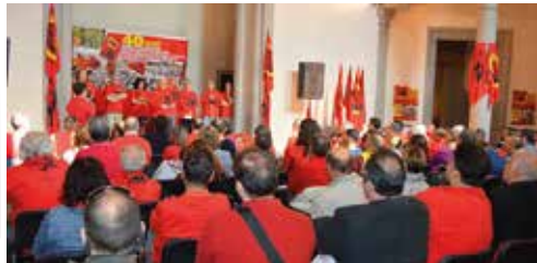
La celebrazione del 40° Anniversario della Fondazione del PMLI. Firenze 9 Aprile 2017