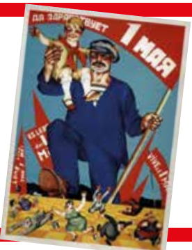
"Viva il 1° Maggio" Manifesto sovietico 1928

Giornata internazionale delle lavoratrici e dei lavoratori