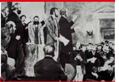
La fondazione della Prima Internazionale. A sinistra in piedi si distingue Marx

Anniversario della fondazione della Prima Internazionale