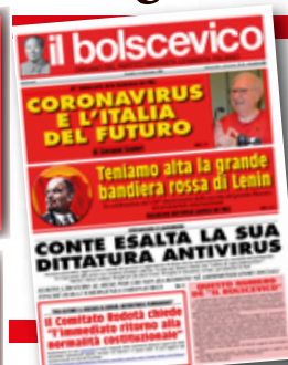
Il Bolscevico n.12 del 2020 realizzato totalmente in remoto a causa delle restrizioni della pandemia

Anniversario della fondazione de "Il Bolscevico"