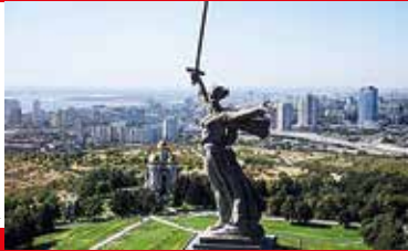
Monumento alla Vittoria di Stalingrado oggi Volgograd

Conclusione della battaglia di Stalingrado