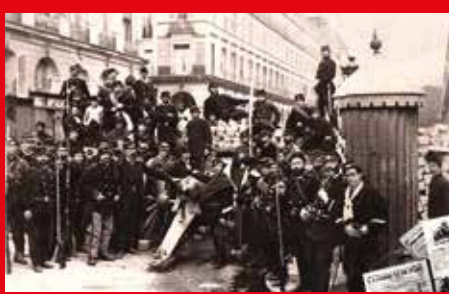
Barricade dei comunardi in place Vendôme