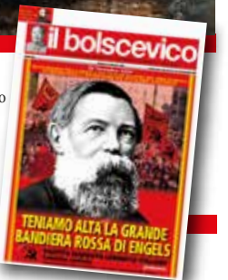
Il n.39 del 2020 dedicato al 200° Anniversario della nascita di Engels