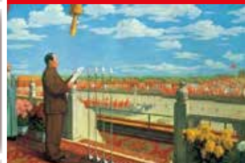
1 ottobre 1949. Mao annuncia la nascita della RPC

Anniversario della fondazione della Repubblica popolare cinese