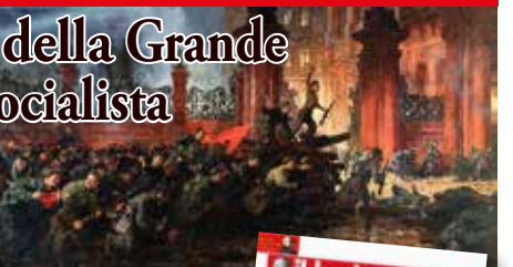
L'assalto al Palazzo d'Inverno

Anniversario della Grande Rivoluzione Socialista d'Ottobre