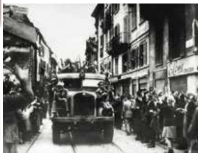
Milano 25 Aprile 1945. L'ingresso dei partigiani

Anniversario della Liberazione dal nazifascismo