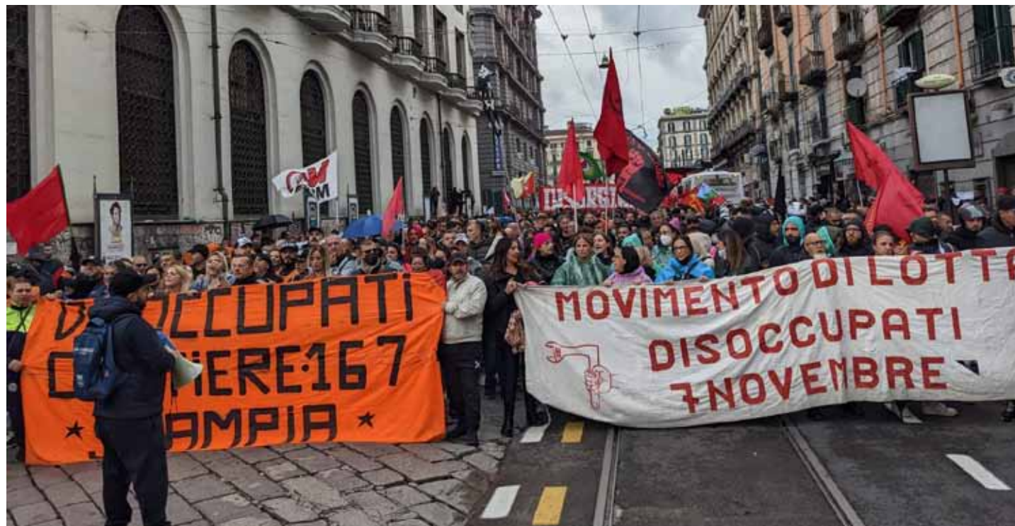
Napoli, 5 novembre 2022. Un aspetto della combattiva manifestazione per il lavoro e contro la disoccupazione e il carovita

ne al palo, ma ci sono altri dati allarmanti da tenere in considerazione.