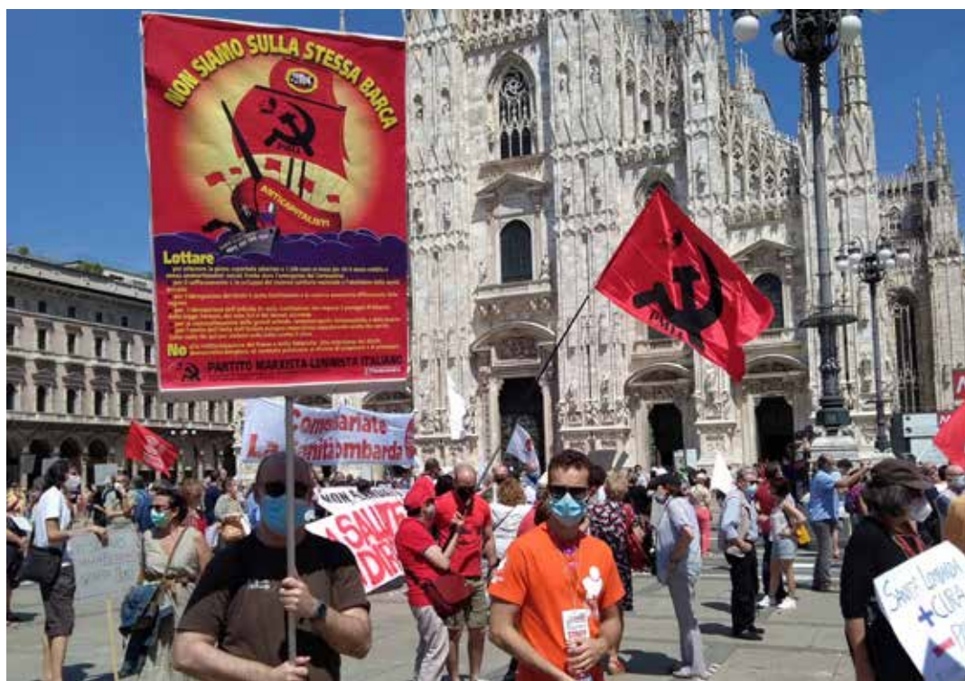
Milano, 20 giugno 2020, piazza Duomo. Grande manifestazione per la sanità pubblica e contro la gestione fallimentare dell'emergenza covid della giunta regionale lombarda. Partecipa il PMLI. In primo piano il cartello del Partito "Non siamo sulla stessa barca".

1. Perché la divisione regionale perseguita svuoterebbe ulteriormente il ruolo e le funzioni del Parlamento, già da tempo indebolite da chi invoca oggi il presidenzialismo e alimenterebbe ancora di più la divisione tra zone più povere