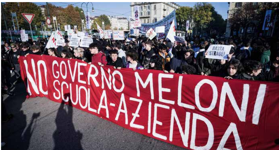
Torino, 19 novembre 2022. Manifestazione studentesca contro il governo neofascista Meloni, la scuola azienda e i PCTO

"Ma cosa pensava che avremmo detto? Dimostra solo una chiara strategia politica: non ascoltare, reprimere e non aprire un canale per permetterci di relazionarci e discutere con l'istituzione che norma la scuo-