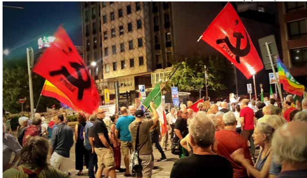
Milano, 10 agosto 2022. 78° Commemorazione dei martiri antifascisti fucilati a piazzale Loreto alla quale ha preso parte il PMLI