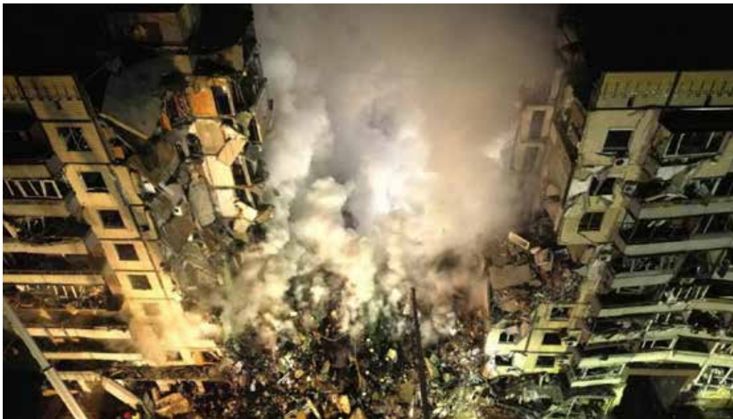
14 gennaio 2023. La terribile devastazione causata da un missile russo su di un condominio a Dnipro con la morte di 40 abitanti e il ferimento di 77. Accanto la popolazione davanti alle macerie del condominio e delle abitazioni adiacenti ormai inabitabili

gressore. Volevano che la nostra libertà cadesse. Ma saranno loro a cadere" aggiungendo che "dobbiamo fare in modo che qualsiasi aggressore non abbia mai l'opportunità di sognare qualcosa di simile e di invadere la nostra libertà".