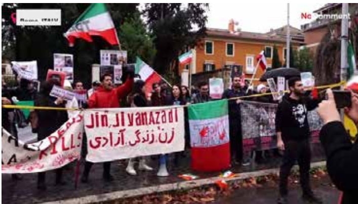
Roma, 10 dicembre 2022. Il presidio di protesta contro la repressione e in appoggio alle lotte di massa in Iran davanti alla sede dell'ambasciata iraniana

La criminale e sanguinaria repressione da parte del governo iraniano teocratico, oscurantista, misogino e reazionario non ha fermato la grande rivolta delle donne, dei giovani e delle masse iraniane contro l'imposizione del velo e per la libertà, la democrazia e la giustizia che è continuata anche dopo le impiccagioni di giovani e dallo scorso 16 settembre mette sotto accusa il governo di Teheran al grido di "Jin, jijan, azadi" (donna, vita, libertà); lo slogan che in solidarietà con la lotta delle masse iraniane campeggia illuminato tra le luci della Torre Eiffel, a Parigi, dal 17 gennaio, assieme al messaggio "Stop esecuzioni in Iran".