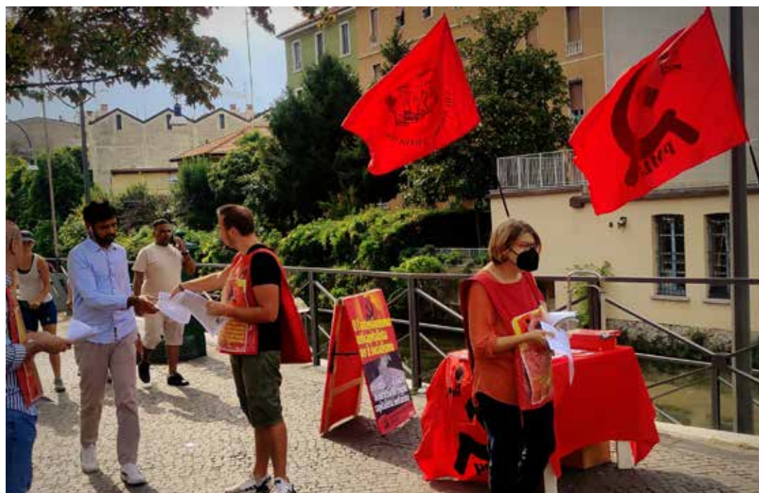
Milano, 3 settembre 2022. Diffusione del documento del PMLI per l'astensionismo alle elezioni politiche del 25 settembre

La crisi economica è stata utilizzata come pretesto per