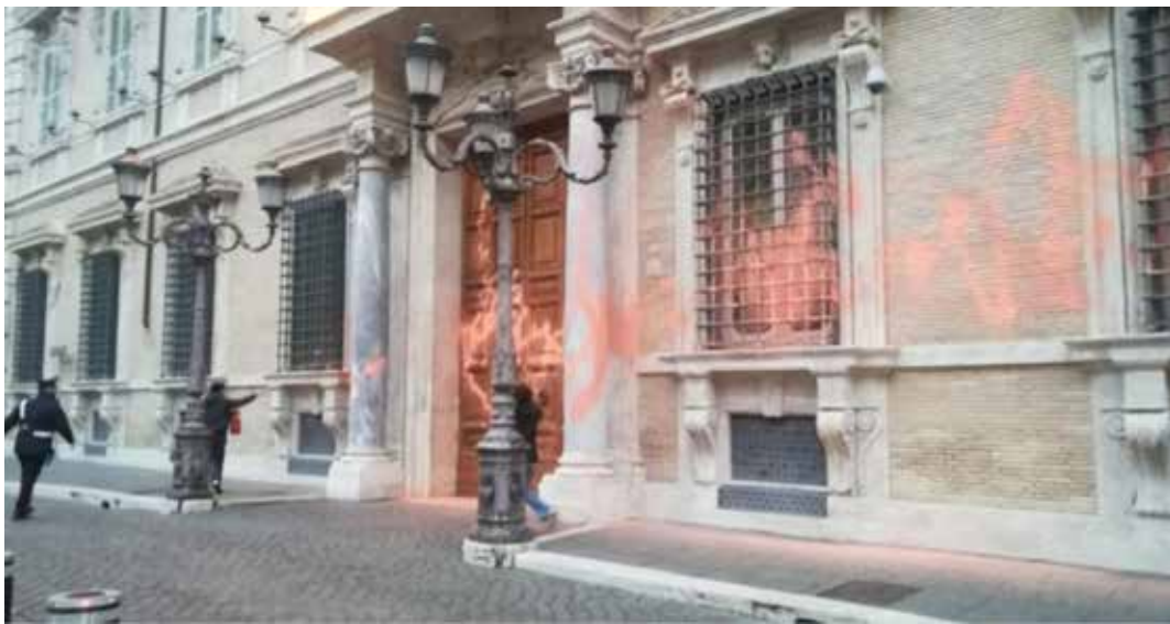
Roma, 3 gennaio 2023. Un momento dell'azione di protesta con la vernice lavabile sull'ingresso di palazzo Madama, sede del Senato