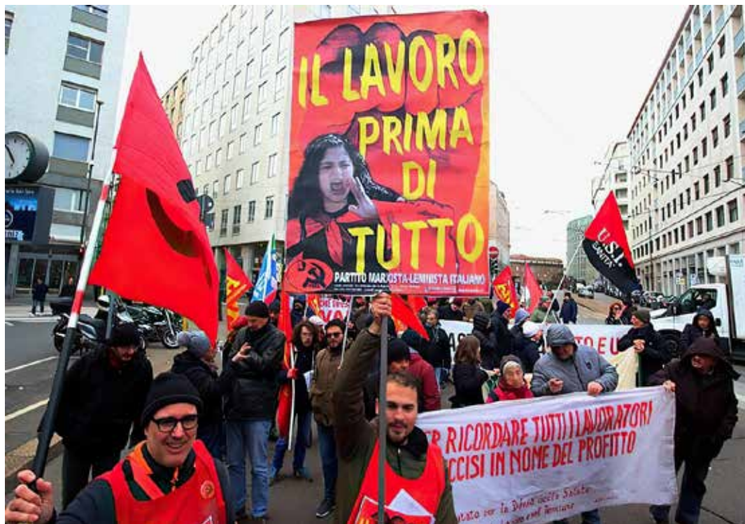
Milano, 2 dicembre 2022. Manifestazione per lo sciopero indetto dai Sindacati di base contro il governo neofascista Meloni

Alle elezioni europee del 2019 è stato eletto eurodeputato, sempre nelle liste del PD, dimettendosi alla carica di assessore. All'avvicinarsi delle elezioni regionali lombarde il "centro-sinistra" ha deciso di sceglierlo, senza nemmeno passare dalle "primarie", come sfidante di Fontana. La candidatura di Majorino è appoggiata anche da Sinistra Italiana,