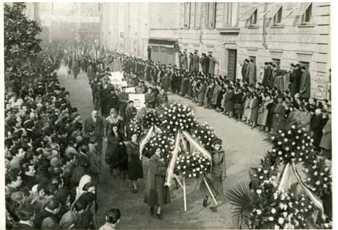
Modena, 11 gennaio 1950. Il solenne corteo funebre delle vittime dell'eccidio