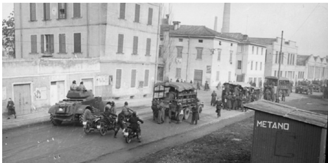
Modena, 9 gennaio 1950. Una veduta di via Menotti con l'arrivo dei camion con polizia e carabinieri. In particolare si nota anche l'arrivo dei blindati T17