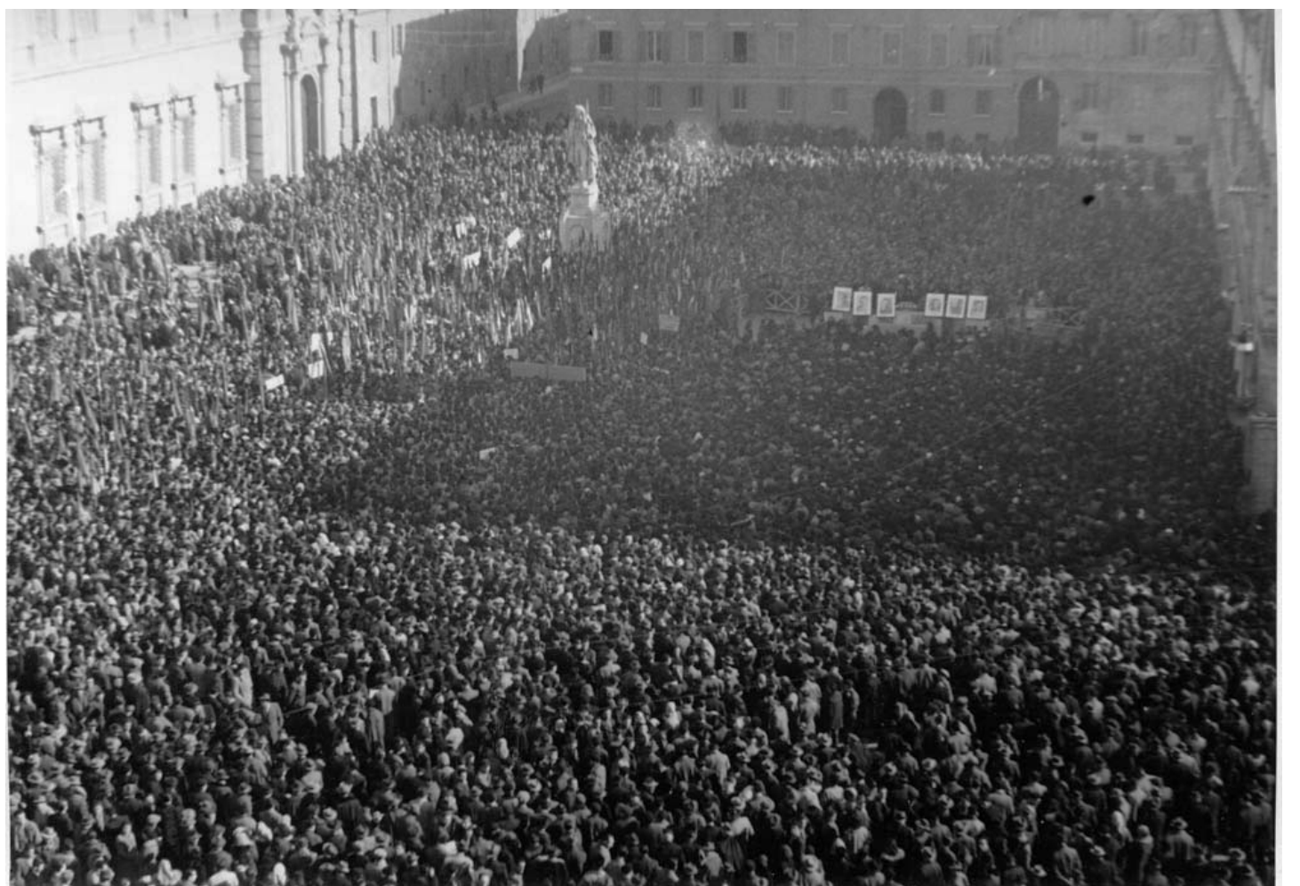
Modena. 300.000 persone, giunte da tutte le parti dell'Italia partecipano alla grandiosa manifestazione funebre e commemorativa in piazza Roma