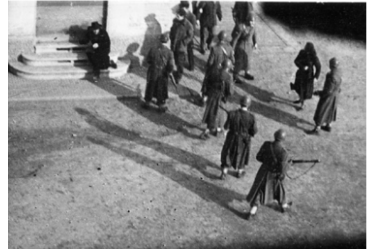
I carabinieri pestano un passante in via Menotti

staurazione del governo neofascista Meloni. Governo che si può combattere e abbattere solo costruendo urgentemente un fronte unito il più ampio possibile, costituito dalle forze anticapitaliste, a cominciare da quelle con la bandiera rossa, dalle forze riformiste e dai partiti parlamentari di opposizione, sull'esempio e con lo spirito unitario di lotta che ci viene ancora dalla Resistenza e dai martiri di Modena e delle tante altre stragi fasciste del dopoguerra.