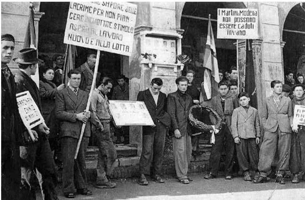
Operai rendono omaggio a pugno chiuso alle vittime al passaggio del corteo funebre. Altri tengono alti dei cartelli di protesta