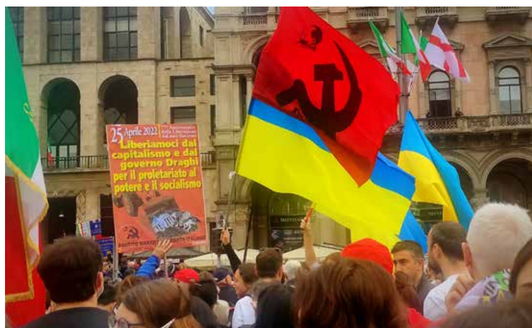
Manifestazione in piazza duomo per il 25 Aprile 2022, 77° Anniversario della Liberazione dell'Italia dal nazifascismo. Accanto alle bandiere del PMLI sventolano le bandiere ucraine simbolo della resistenza contro l'aggressione neonazista russa

Dal 5 giugno 2006 al 1° giugno 2011 è sindaco di Milano, a capo di una giunta confindustria-fascista e antipopolare. Presidente del consiglio di amministrazione di UBI Banca dal 2019 al 2020, nel 2021 viene imposta da Berlusconi come vicepresidente e assessore alla Sanità e al Welfare della giunta Fontana, obbligata a un rimpasto per restare a galla dopo il siluramento del precedente assessore forzista Giulio Gallera divenuto capro espiatorio di una gestione dell'emergenza pandemica così vergognosa da meritare, invece, le dimissioni di Fontana con tutta la sua giunta. Fin da subito l'assessora Moratti ha messo il piede sull'acceleratore della controriforma della sanità lombarda che cancella la sanità pubblica per la privata. Con l'avvicinarsi delle elezioni e la scelta del "centro-destra" di ricandidare Fontana vede svanire il sogno di diventare governatore che per sua stessa ammissione ha sempre considerato una priorità essendo la Lombardia il motore