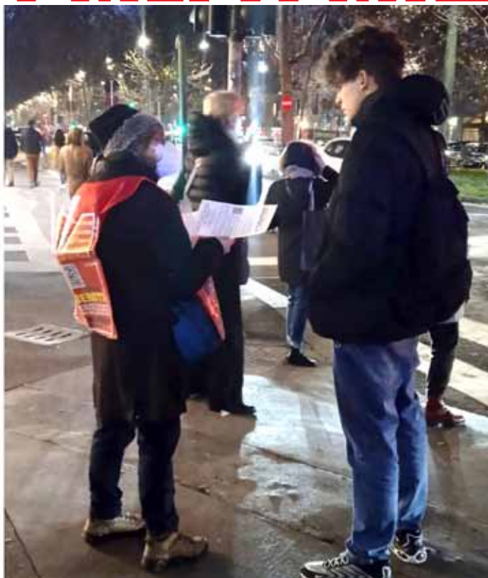
Milano, piazzale Lodi, 20 gennaio 2023. Momenti del volantinnaggio della posizione elettorale astensionista del Comitato lombardo del Partito in vista delle elezioni regionali del 12 e 13 febbraio prossimi. Accanto, la riproduzione del volantino distribuito, il primo in assoluto del PMLI con il QR code, attraverso il quale col cellulare è possibile leggere il testo integrale del Documento sul sito del PMLI Lombardia.