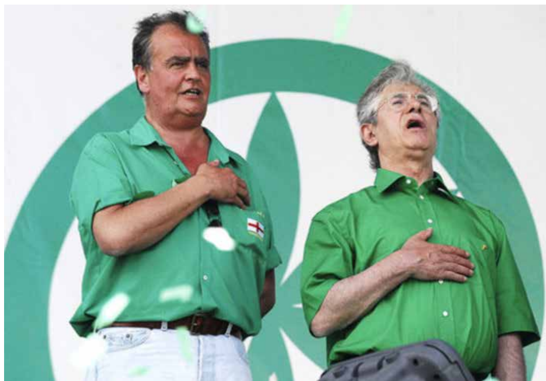
Calderoli e Bossi durante l'adunata annuale della Lega Nord a Pontida

li auspica il "rastrellamento dei nazisti rossi", "l'espulsione degli albanesi che rubano nelle ville", si "pulisce il culo col Tricolore" e spara a zero contro "la civiltà gay che sta trasformando la Padania in un ricettacolo di culattoni". Nel 2000 provocano grandi polemiche le sue dichiarazioni sfacciatamente xenofobe e razziste contro i migranti: "Io credo che per far finire il traffico indecente di esseri umani, dagli esiti troppo spesso tragici, si debba sparare sugli scafisti, una volta che abbiano lasciato il loro carico. Sparare per affondarli, così non ci sarà nemmeno il problema di cosa fare delle imbarcazioni".