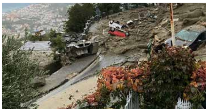
Un'immagine della disastrosa frana del 26 novembre scorso a Casamicciola

La Cellula isola d'Ischia del PMLI "Il Sol dell'Avvenir" ritiene