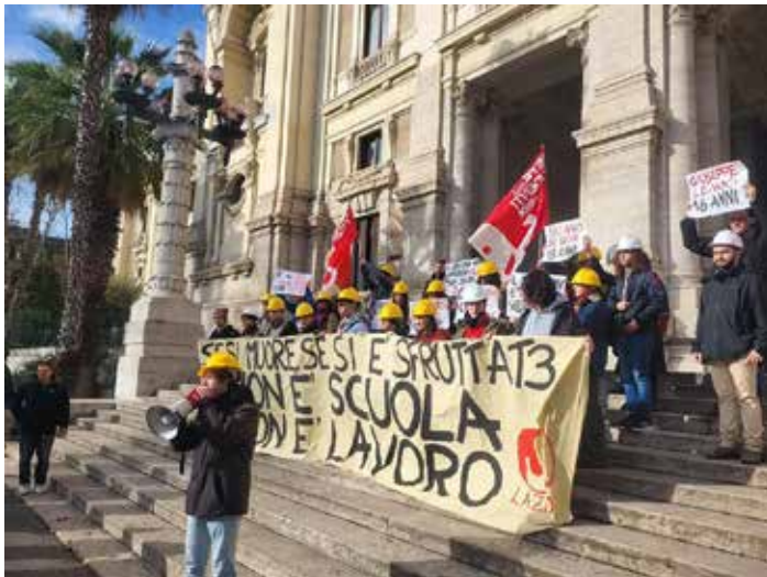
Roma, 21 gennaio 2023. Il presidio di protesta organizzato dalla Rete degli Studenti Medi del Lazio e dalla Fiom Cgil Roma e Lazio

Nel corso del presidio sono stati presentati tra l'altro anche i risultati di un sondaggio