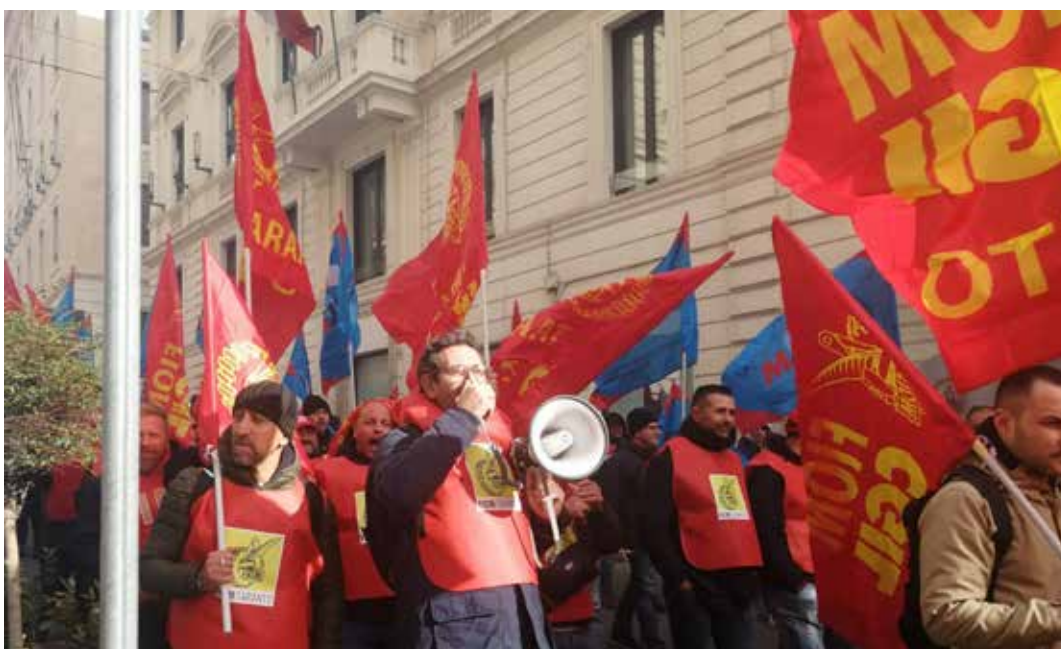
19 gennaio 2023. Manifestazione nazionale dei lavoratori ex Ilva a Roma in concomitanza con l'incontro al Ministero per le Imprese e il Made in Italy tra azienda e sindacati

Il governo neofascista Meloni ha agito come i precedenti, mettendo una pezza. Nella riunione del 28 dicembre sono stati previsti 680 milioni (già stanziati), che possono essere utilizzati fin da subito quale finanziamento soci convertibile in futuro aumento di capitale. Il decreto legge (dl) prevede inoltre modifiche alla normativa per l'attivazione delle procedure per l'amministrazione stra-