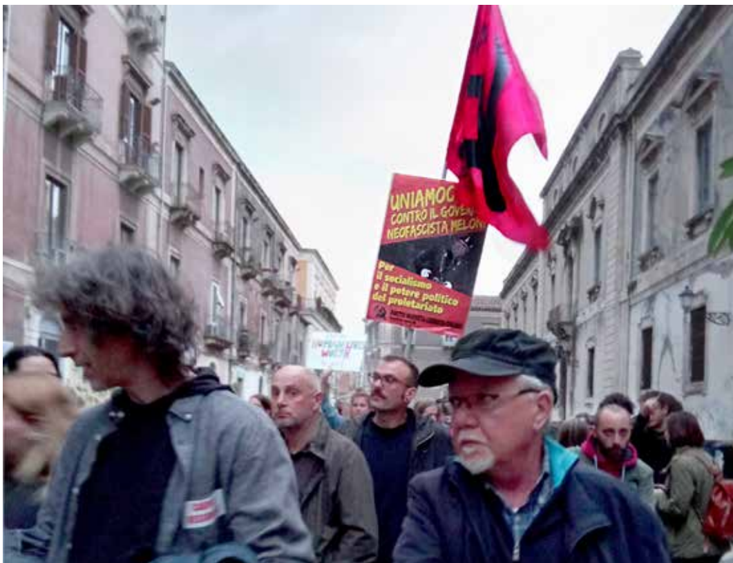
Catania, 12 novembre 2022. Manifestazione Porti aperti per lo sbarco dei migranti nel porto. Nel corteo sventava il manifesto contro il governo Meloni

Subito prima aveva rivolto un appello "ai pensatori, agli intellettuali, agli studiosi, a chiunque abbia qualcosa da dire, a portare legna al fuoco delle nostre idee", perché "Fdl 2.0 deve avere anche