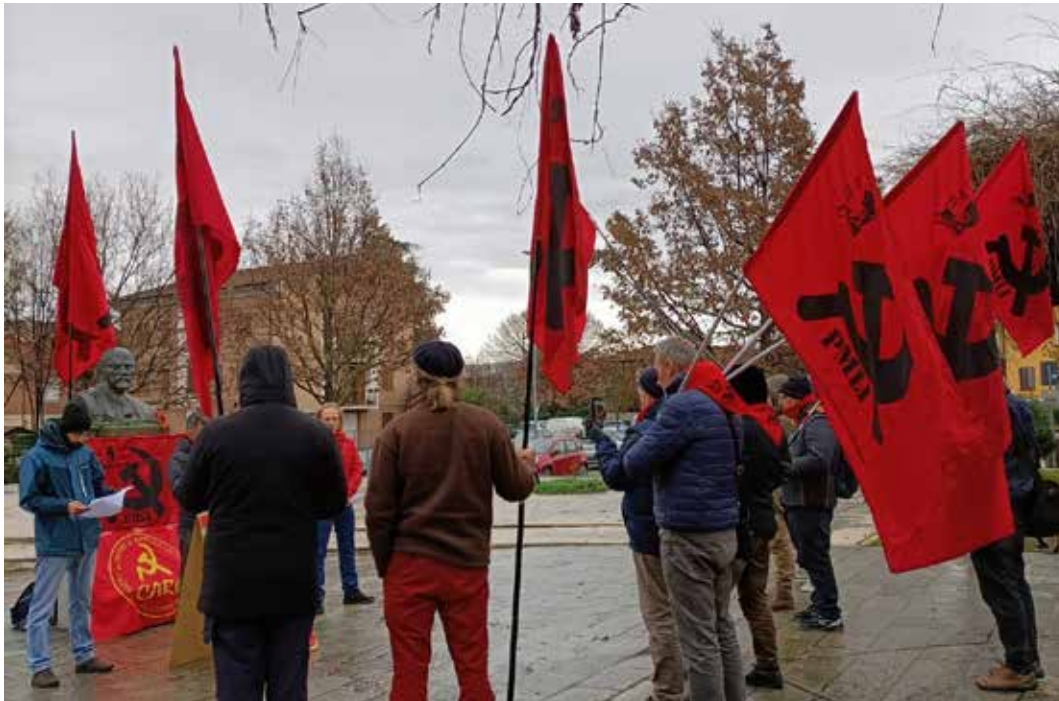
Cavriago 22 gennaio 2023. Un momento della Commemorazione di Lenin

Come disse Stalin il 6 novembre 1941 nel discorso per il XXIV Anniversario della Grande Rivoluzione Socialista d'Ottobre: “Se questi imperialisti sfrenati e reazionari accerrimi continuano tuttora a coprirsi della veste di 'nazionalisti' e di 'socialisti', lo fanno per ingannare il popolo, per abbindolare la gente semplice, per coprire con la bandiera del 'nazionalismo' e del 'socialismo' la loro brigantesca essenza imperialista. Corvi che si rivestono di penne di pavone... Ma per quanto i corvi si rivestono di penne di pavone non cessano di essere corvi”.