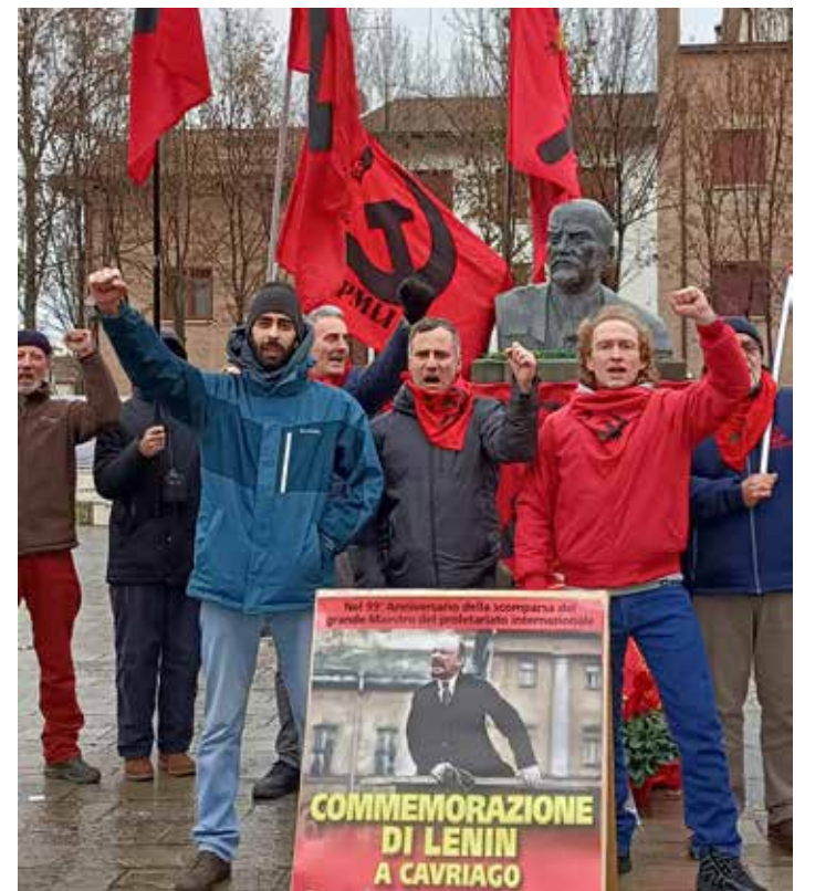
I tre oratori della 99° Commemorazione di Lenin si sono uniti agli altri partecipanti per intonare alcuni canti proletari e di lotta

Alcuni cavriaghesi partecipanti all'iniziativa si sono tratti- nati a discutere con i compagni