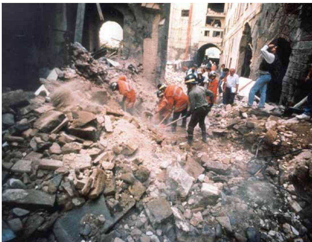
L'effera strage terroristica mafiosa di via dei Georgofili a Firenze, nei pressi di piazza della Signoria e degli Uffizi, avvenuta nella notte fra il 26 e il 27 maggio 1993 con l'esplosione di un'autobomba. Persero la vita tre adulti e due bambine, una di 9 anni e una di appena 50 giorni. Nelle foto: si scava tra le macerie

in un'operazione delle procure antimafia di Roma e Caltanissetta, mentre era pedinato, lo si è visto recarsi a Castelvetrano, dove ha incontrato un uomo,