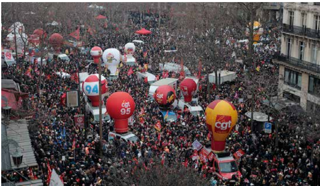
Parigi, 19 gennaio 2023. Una veduta della grandissima manifestazione contro la riforma delle pensioni voluta da Macron

Ai numerosi e partecipati cortei hanno fatto sentire la loro voce anche gli studenti mobilitati da vari sindacati studenteschi universitari come l'Unef e la Farge; il sindacato dei liceali, la