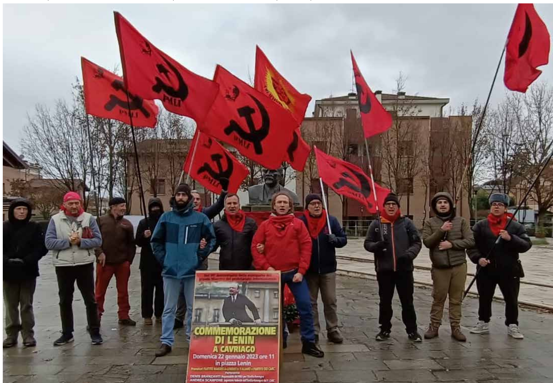
Cavriago, 22 gennaio 2023. Militanti e simpatizzanti del Partito Marxista-Leninista Italiano e del Partito dei Carc, provenienti anche dalla Lombardia e dal Piemonte, oltre a diversi cittadini di Cavriago e delle zone limitrofe, hanno partecipato alla Commemorazione di Lenin per il 99° anniversario della scomparsa del grande Maestro del proletariato internazionale