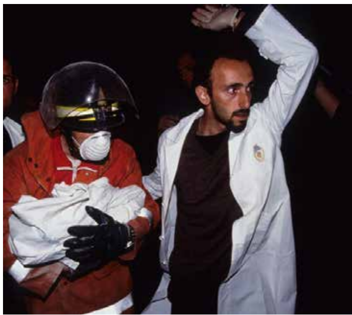
Un pompiere e un medico portano via il corpicino della più piccola delle vittime della strage dei Georgofili