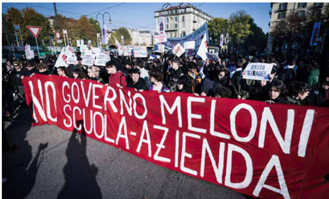
Torino, 18 novembre 2022. Manifestazione degli studenti contro il governo Meloni e i Pcto

In questo nero disegno piduista si inseriscono anche le ultime proposte avanzate da Valditara nei giorni scorsi il quale, dopo il "merito", "l'umiliazione", il "divieto di sciopero" e dell'uso "del cellulare in classe", "la revoca del reddito di cittadinanza a chi viola l'obbligo scolastico" l'istituzione del "docente tutor" e le denunce contro i ragazzi e le ragazze della "Rete studenti Milano" che lo hanno criticato per la morte dei tre ragaz-