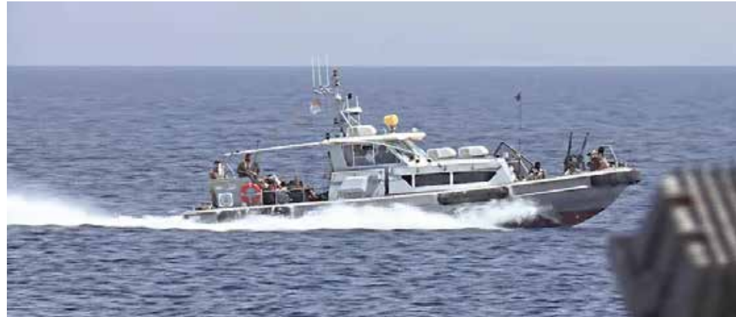
Le motovedette libiche fornite dall'Italia. Accanto: 29 gennaio 2023. La premier Meloni in Libia accolta dal premier libico al-Dabaiba

Continua la politica razzista e antimigranti del governo neofascista Meloni. Dopo il decreto antiONG dello scorso gennaio, Meloni e i suoi ministri degli esteri Tajani (FI) e dell'interno Piantedosi si sono recati in Libia, nell'ambito del viaggio in diversi paesi del nord Africa tenuti dalla premier in Algeria e Tunisia riguardanti non solo la questione dei migranti ma anche tutta una serie di accordi neocolonialisti sul gas in ultima analisi favorevoli all'Eni, tanto che la stessa Meloni ha definito il suo viaggio "Piano Mattei" (in ricordo di Enrico Mattei, morto nel 1956, esponente della Dc e primo presidente dell'Ente Nazionale Idrocarburi).