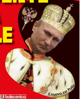
il nuovo zar Putin

Settimanale Via Anversa 41 - 40138 Parma - Tel. e Fax 0521/2781 e-mail: comitato@pml.it - www.pml.it - www.bolscevico.it