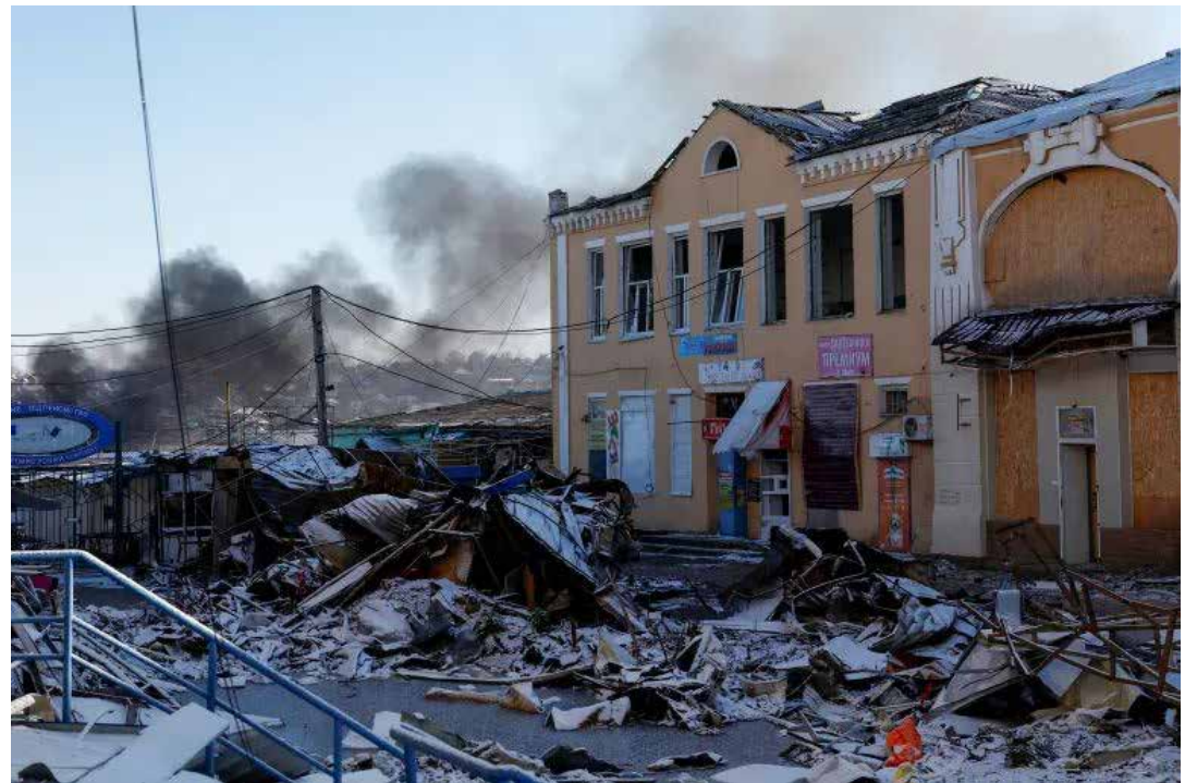
Abitazioni a Bakhmut distrutte dai bombardamenti il 1 febbraio 2023

Per Danilov Putin "Dal 2003 sogna di rinnovare l'impero, e noi stiamo vivendo le conseguenze di questa sua follia. La Russia è già abbastanza grande, Putin aveva tantissimo lavoro da fare lì per costruire il suo Stato, ma invece di gestire questo territorio immenso ha scelto di attaccare altri Paesi. Hanno ancora le case con i bagni in strada, però si occupano di noi".