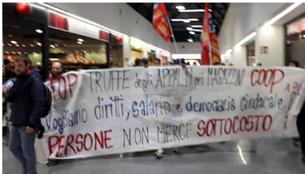
Parma, 4 febbraio 2023. La protesta dei lavoratori della Kamila all'interno della Ipercoop di Parma

Così Coop Alleanza 3.0 e Italtans spa - grandi aziende rispettivamente al vertice in Italia della grande distribuzione cooperativa e della logistica - messe di fronte al problema costituito dalle lotte operaie, hanno deciso di usare il pugno di ferro con la piccola cooperativa Md Service, minacciando di interrompere il subappalto, e inducendo la cooperativa a usare, a sua volta, il pugno di ferro contro i lavoratori sinda-