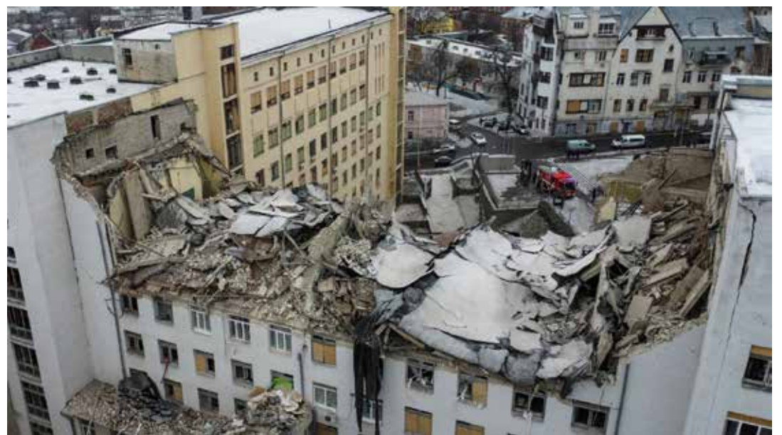
5 febbraio 2023. La sede della università di economia di Karkiv semi distrutta dai missili russi