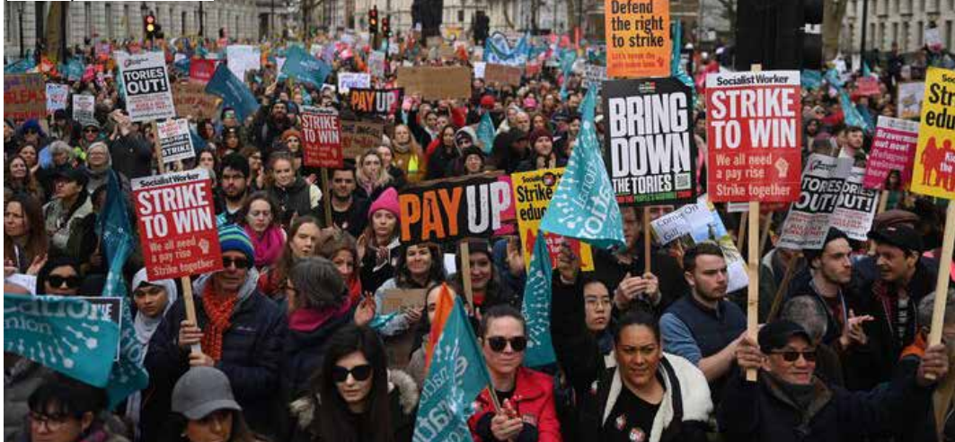
Londra, 1 febbraio 2023

una inflazione che superava il 10% e di assunzioni in un settore che ha dovuto affrontare l'emergenza della pandemia lasciata correre in maniera criminale dal governo di Boris Johnson e dalla quasi inessistente opposizione dei laburisti guidati da Keir Starmer. L'abbandono del sistema sanitario pubblico a favore del privato è passato nelle mani del premier Sunak, figlio di immigrati indiani e uno tra i più ricchi uomini politici del Regno Unito che si è formato nella banca d'affari Goldman Sachs, in carica dal 25 ottobre scorso.