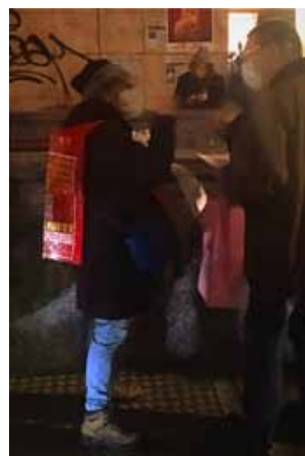
Momenti della diffusione del documento elettorale astensionista per le elezioni regionali a Milano il 26 gennaio e a Sesto San Giovanni il 3 febbraio 2023