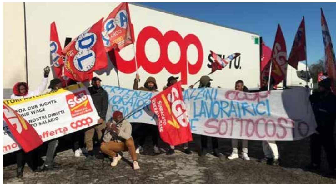
21 gennaio 2023. La protesta delle lavoratrici e lavoratori dei magazzini appaltati davanti alla Coop di Cesena

I lavoratori continueranno nelle proteste perché "Quanto sta succedendo è un attacco non solo a queste centinaia di lavoratori/trici ma a tutti coloro che rivendicano salario giusto, diritti, dignità e il pieno riconoscimento dei diritti sindacali e di sciopero e che hanno a cuore la libertà democratiche. Per questo abbiamo bisogno del sostegno di tutte e tutti affinché Coop Alleanza 3.0 si assuma le proprie responsabilità nei confronti dei 'propri' lavoratori/trici! Ritiro provvedimenti ritorsivi, sospensioni e licenziamenti! Riconoscimento del sindacato scelto dai lavoratori e del diritto di sciopero! Diritti, salario giusto e lavoro degno nei magazzini Coop! Siamo persone, lavoratori e lavoratrici e non ci rassegniamo ad essere trattati come merce sottocosto!".