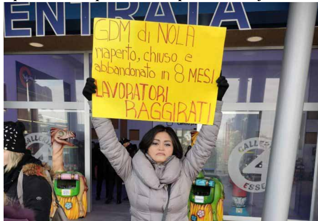
La protesta davanti al centro commerciale GDM di Nola (Napoli) contro i licenziamenti

La GDM - che fa capo a Giovanni Longobardi - nel 2019 aveva rilevato il supermercato di Afragola-Acerra dalla Coop di Bologna e nel 2021 quello di Nola da Margherita distribuzione, controllata da un'altra cooperativa emiliana, la Conad, che a sua volta aveva acquisito l'impianto nolano dalla francese Auchan, in un primo momento "salvando" centinaia di posti di lavoro. Un fantomatico, appunto, "salvataggio" che si è rivelato un clamoroso flop dopo circa dieci mesi e non certo per un difetto di liquidità o per un'a-