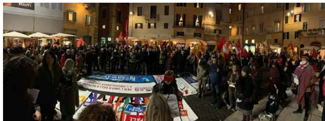
Roma, piazza della rotonda, 21 dicembre 2022. Il partecipò e numeroso presidio contro l'autonomia differenziata a cui ha aderito, con altre forze politiche, anche il PMLI

La Meloni e Fratelli d'Italia - la forza politica che, a partire dal suo stesso nome, basa la propria esistenza e il proprio programma su precise rivendicazioni di carattere nazionalistico - hanno abbassato la testa e, pur di mantenere integri gli equilibri del Governo e procedere, con tutti gli alleati, verso il proprio progetto di presidenzialismo, hanno consentito al passaggio del ddl Calderoli, tenendo così fede allo scambio concordato in campagna elettorale.