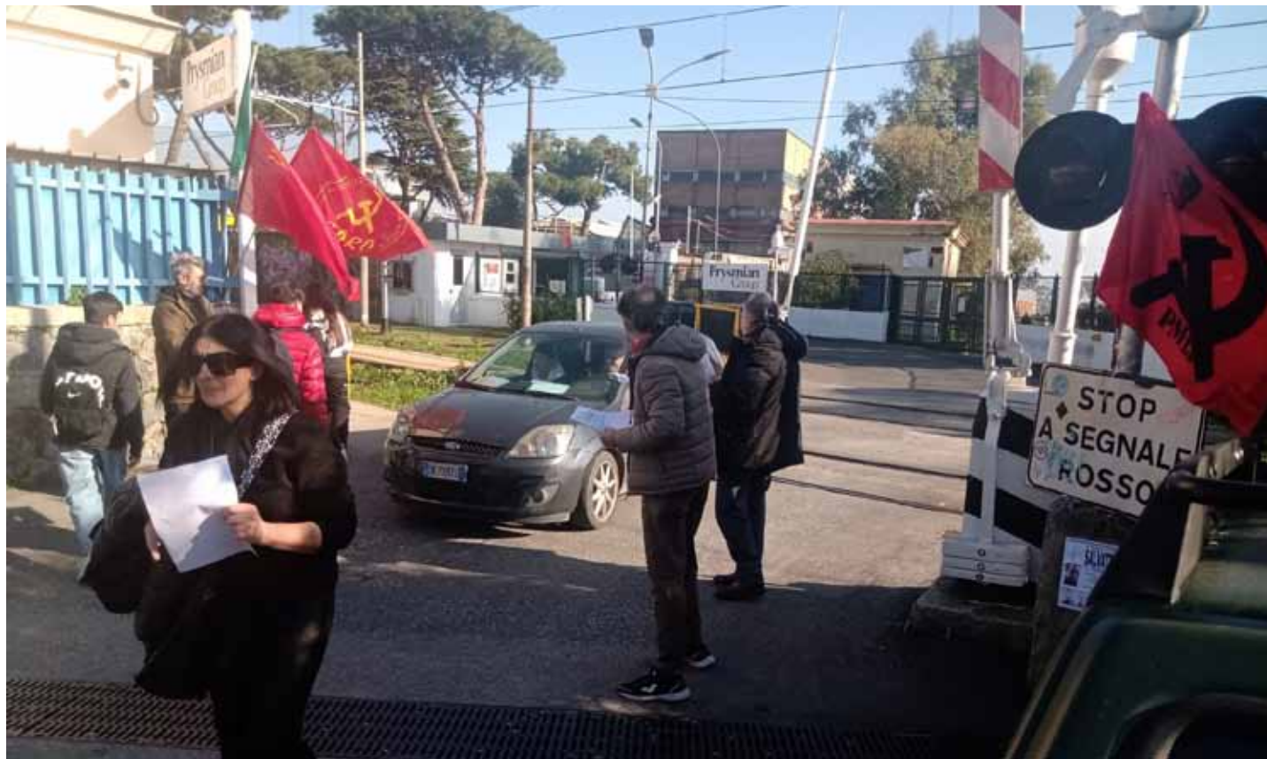
Napoli, 3 febbraio 2023. Un momento della diffusione del documento contro l'autonomia differenziata

La bella giornata di unità e lotta del "Coordinamento di Unità Popolare" si concludeva all'insegna di un ottimo caffè napoletano e una riunione che faceva il bilancio della giornata tra tutte le forze politiche presenti, anticipando le prossime iniziative nella città metropolitana di Napoli.