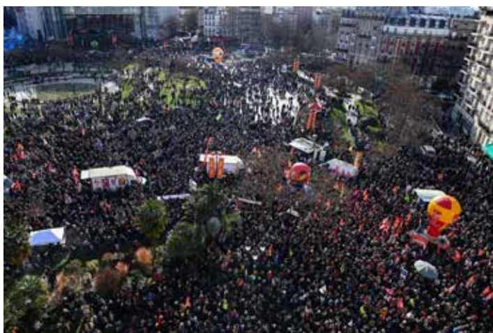
Parigi, 31 gennaio 2023. Seconda giornata di grande mobilitazione contro Macron e la riforma delle pensioni

Finora la risposta dell'amministrazione Biden è rimasta, come sempre indipendentemente da chi democratico e repubblicano siede alla Casa Bianca, di copertura dei crimini della repressione razzista, che rendono sostanzialmente formali le pompose dichiarazioni sui diritti dell'uomo negli Usa, nella cosiddetta patria della democrazia, così come si presenta quando difende i suoi interessi imperialisti nelle aggressioni militari dirette o in difesa dei paesi imperialisti alleati dell'Ovest per combattere il fronte avversario dei paesi imperialisti dell'Est.