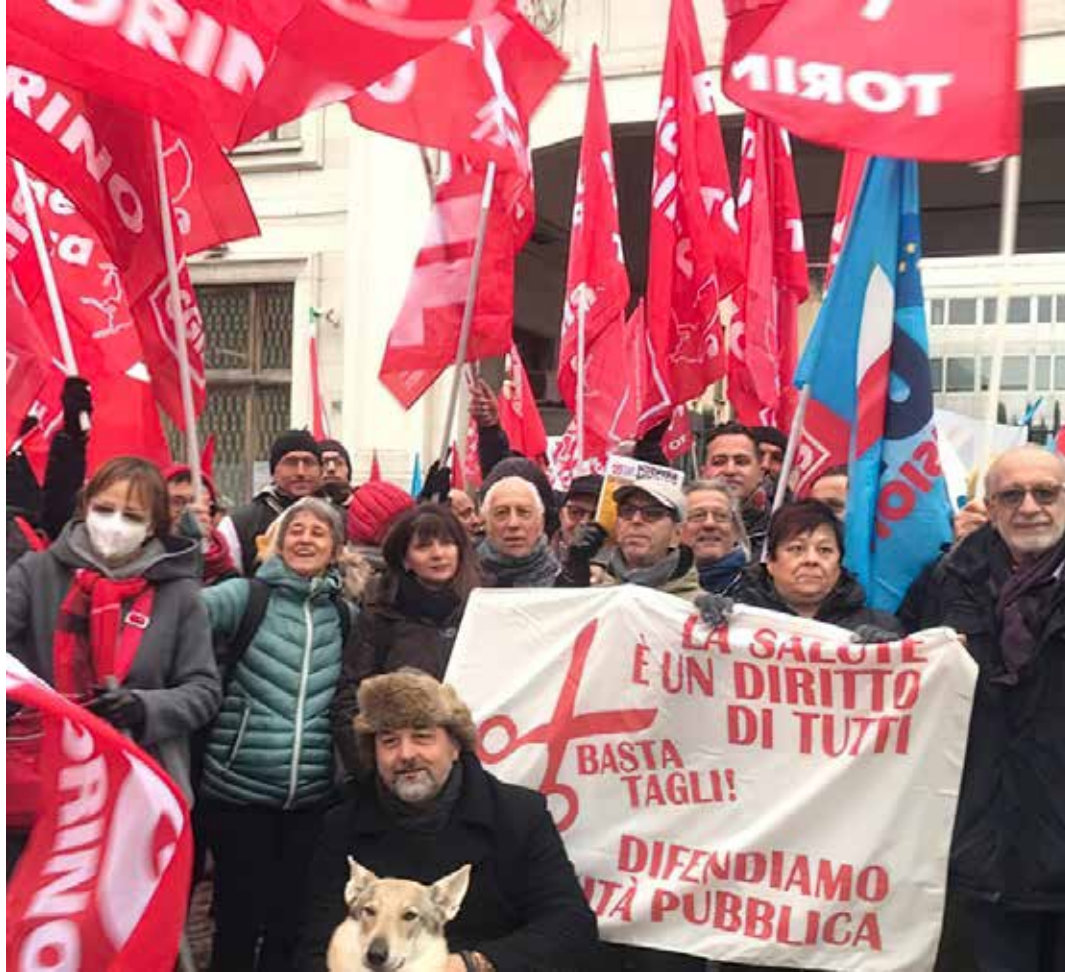
Torino, 15 dicembre 2022. Sciopero generale contro il piano economico del governo Meloni. Lavoratrici e lavoratori tengono bene in vista la parola d'ordine contro i tagli e per la sanità pubblica

La fotografia dettagliata delle condizioni della sanità italiana nel 2021 fatta da Crea