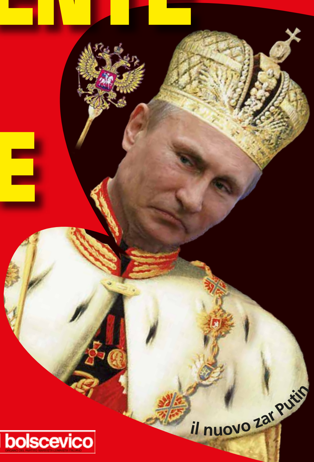
il nuovo zar Putin

Sede centrale: Via Antonio del Pollaiuolo, 172a 50142 FIRENZE Tel. e fax 055.5123164 e-mail: commissioni@pml.i.it • www.pml.i.it • www.facebook.com/PartitoMarxistaLeninistaItalianoPMLI