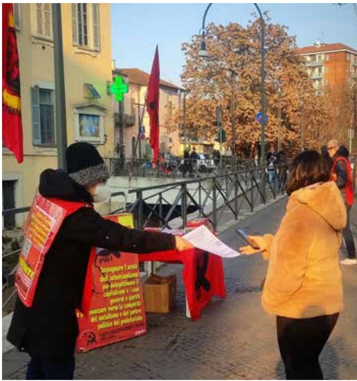
Milano. Alcuni momenti delle diffusioni del volantino realizzato dal Comitato lombardo del PMLI per propagandare l'astensionismo. In piazza Costantino dove era stato allestito un banchino di propaganda e in piazza Argentina