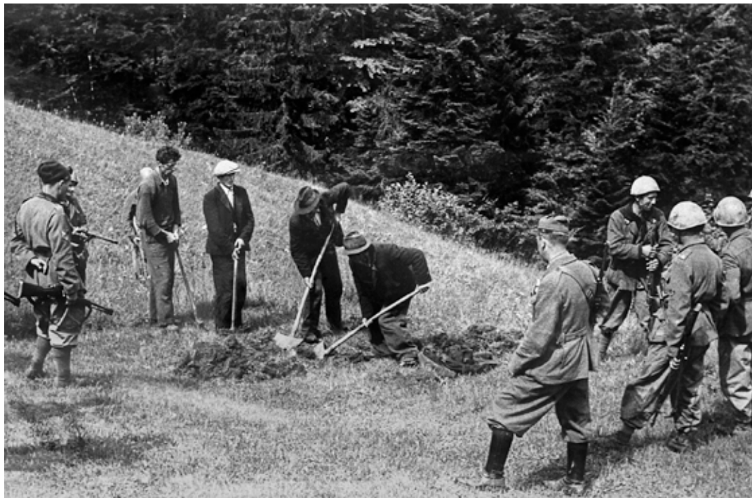
Antifascisti resistenti costretti a scavare la fossa prima di essere fucilati sotto lo sguardo divertito di un plotone italiano di Camicie nere

PARTITO MARXISTA-LENINISTA ITALIANO Cellula "F. Engels" della Valdisieve Rufina, 9 febbraio 2023