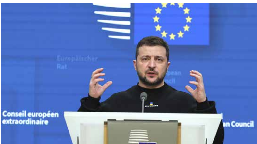
Bruxelles, 9-10 febbraio 2023. L'intervento di Zelensky al Consiglio straordinario dell'Unione europea

Sul secondo tema importante all'ordine del giorno, l'economia, i 27 leader imperialisti europei non hanno ancora trovato l'intesa su come rispondere al piano varato dall'amministrazione Biden per sostenere le industrie americane nella sfida economico-produttiva anzitutto con la Cina socialimperialista, ossia il cospicuo pacchetto di