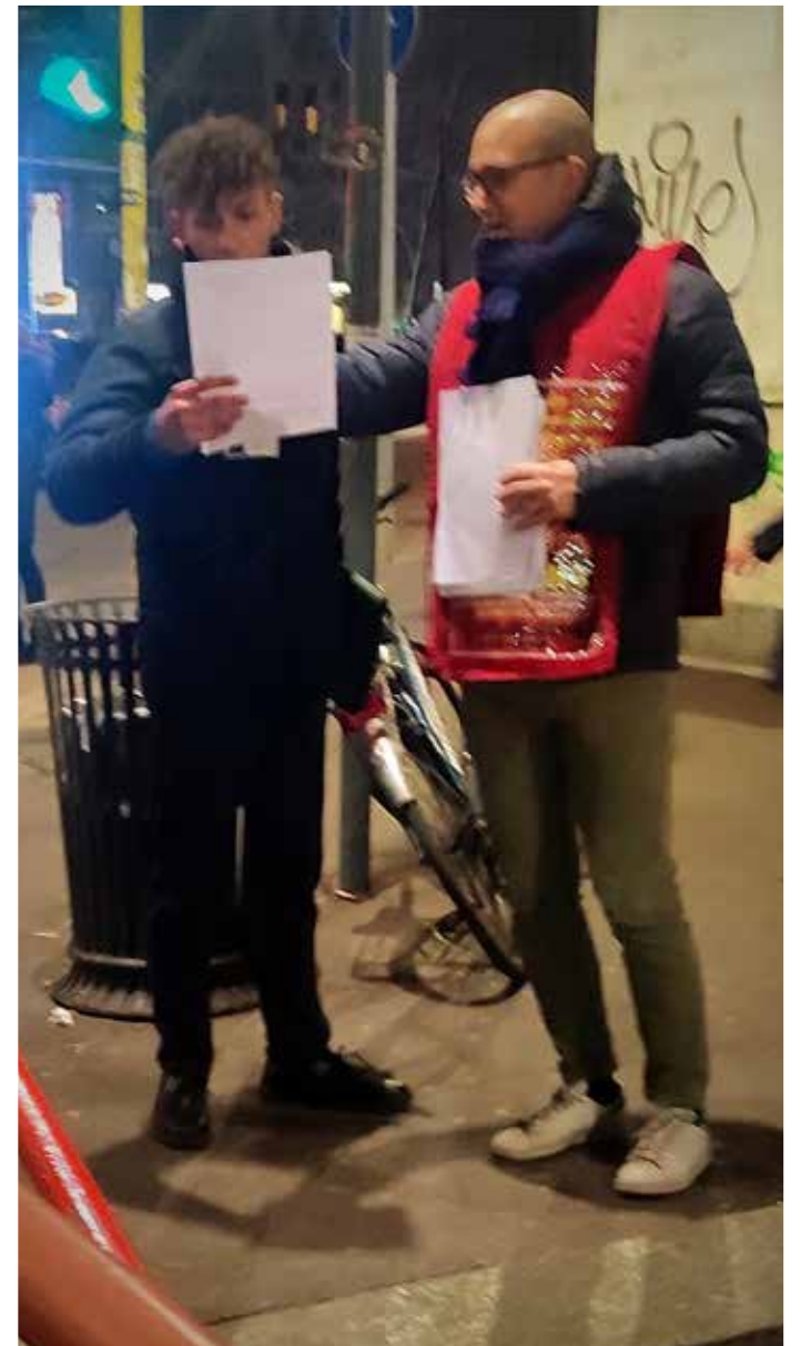
Milano. Diffusione astensionista a Piazzale Loreto

neofascista Meloni. Per il socialismo e il potere politico del proletariato" a unirsi "per creare contro il governo Meloni, almeno nella pratica, un fronte unito più ampio possibile composto dalle forze anticapitaliste, a cominciare da quelle con la bandiera rossa, dalle forze riformiste e dai partiti parlamentari di opposizione. Senza settarismi, pregiudizi ed esclusioni. Deve contare solo l'opposizione a questo governo. Sul campo di battaglia anti-neofascista c'è posto per tutti". Concetti ripresi recentemente dal Segretario generale, compagno Giovanni Scuderi, che nel saluto alla Commemorazione di Lenin a Cavriago del 22 gennaio scorso, scriveva: "Uniamoci per le urgenti lotte contro le bollette, il caro vita e il caro benzina, contro i decreti anti Ong e anti rave, contro l'autonomia differenziata e l'elezione diretta del presidente della Repubblica, per il lavoro, il clima e la revoca del regime del 41bis a Alfredo Cospito. Più in generale dobbiamo unirci per combattere e abbattere il governo neofascista Meloni e il capitalismo, per conquistare il socialismo e il potere politico del proletariato, seguendo la via dell'Ottobre". "Per questo - concludeva - è necessario aprire una discussione pubblica e privata fra tutte le forze anticapitaliste e antifasciste, a cominciare da quelle con la bandiera rossa, per elaborare un progetto comune per il futuro socialista dell'Italia".