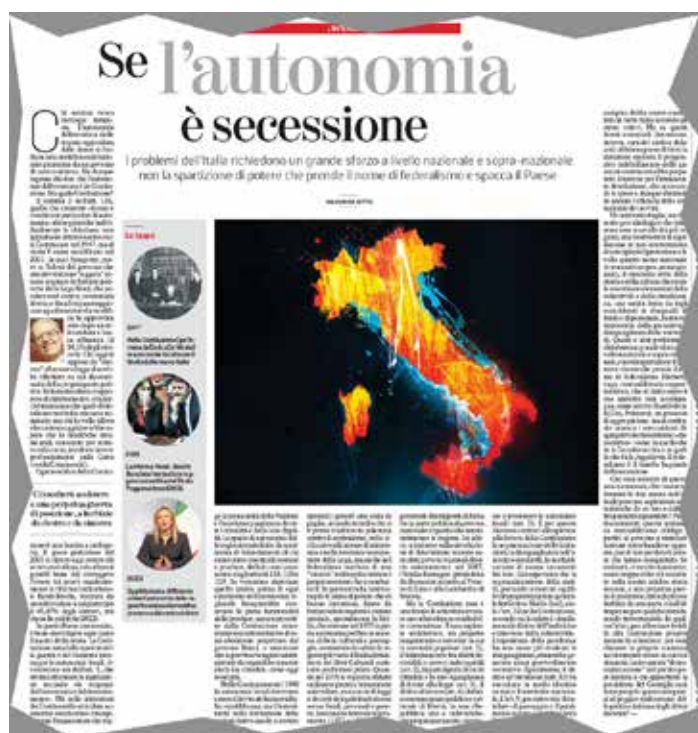
La doppia pagina de "la Stampa" dell'8 febbraio 2023 che pubblica l'intervento di Settis su l'autonomia differenziata

Via A. del Pollaiuolo 172/a - 50142 Firenze Fax: 055 5123164 - e-mail: ilbolscevico@pml.i.it