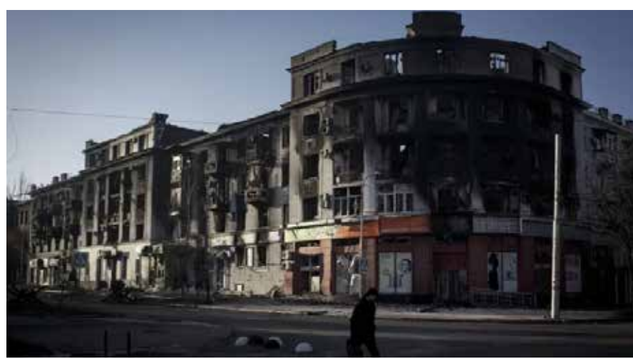
Fronte del Donbass. Il ponte di Kostiantynivka per Bakhmut distrutto dall'attacco dei russi il 10 febbraio 2023. Accanto: Bakhmut, un edificio distrutto dai russi