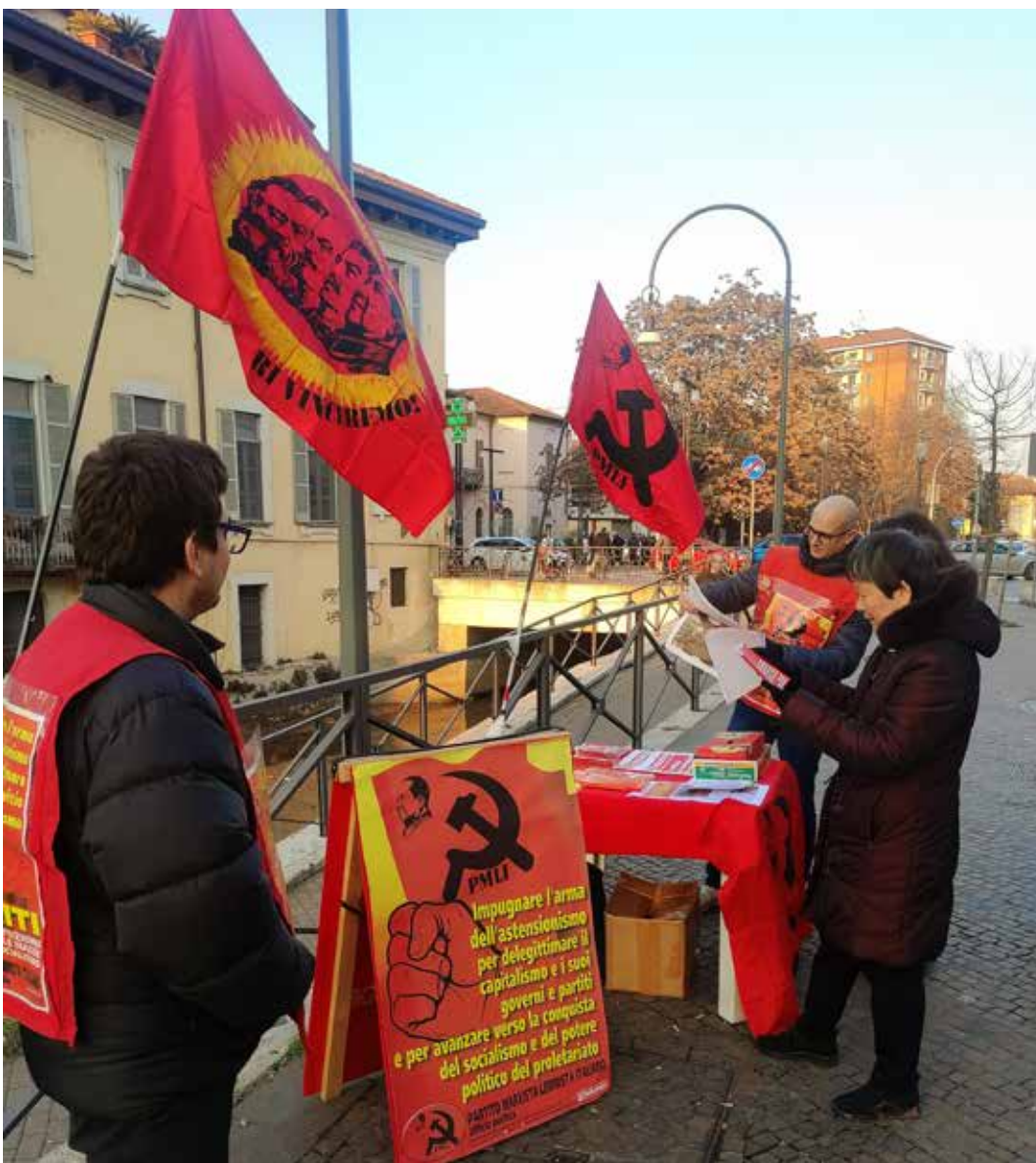
Milano. Piazza Costantino dove era stato allestito un banchino e diffuso il volantino realizzato dal Comitato lombardo del PMLI per propagandare l'astensionismo

L'astensionismo in Lombardia batte Fratelli d'Italia, il primo partito che lo segue, uno a