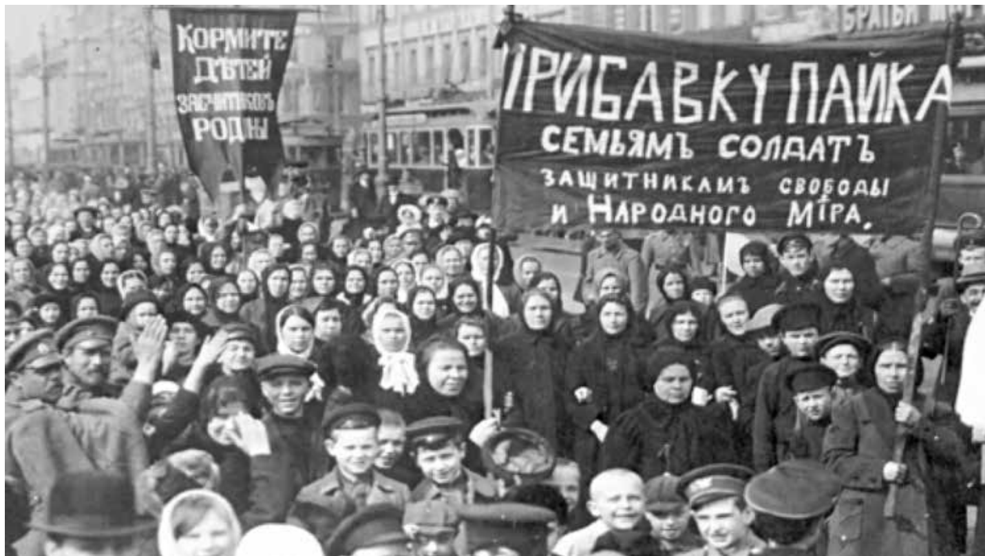
Pietroburgo, 8 marzo 1917. Manifestazione delle donne per rivendicare la fine della guerra di aggressione imperialista zarista, il ritorno a casa dei soldati, per il lavoro e la pace

Le masse femminili stanno pagando assai cara, più di altri settori, le conseguenze del-