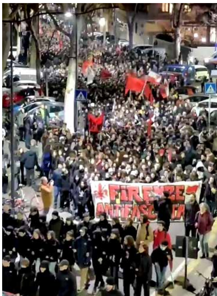
Firenze, 21 febbraio 2023. Il combattivo corteo antifascista contro le aggressioni squadriste