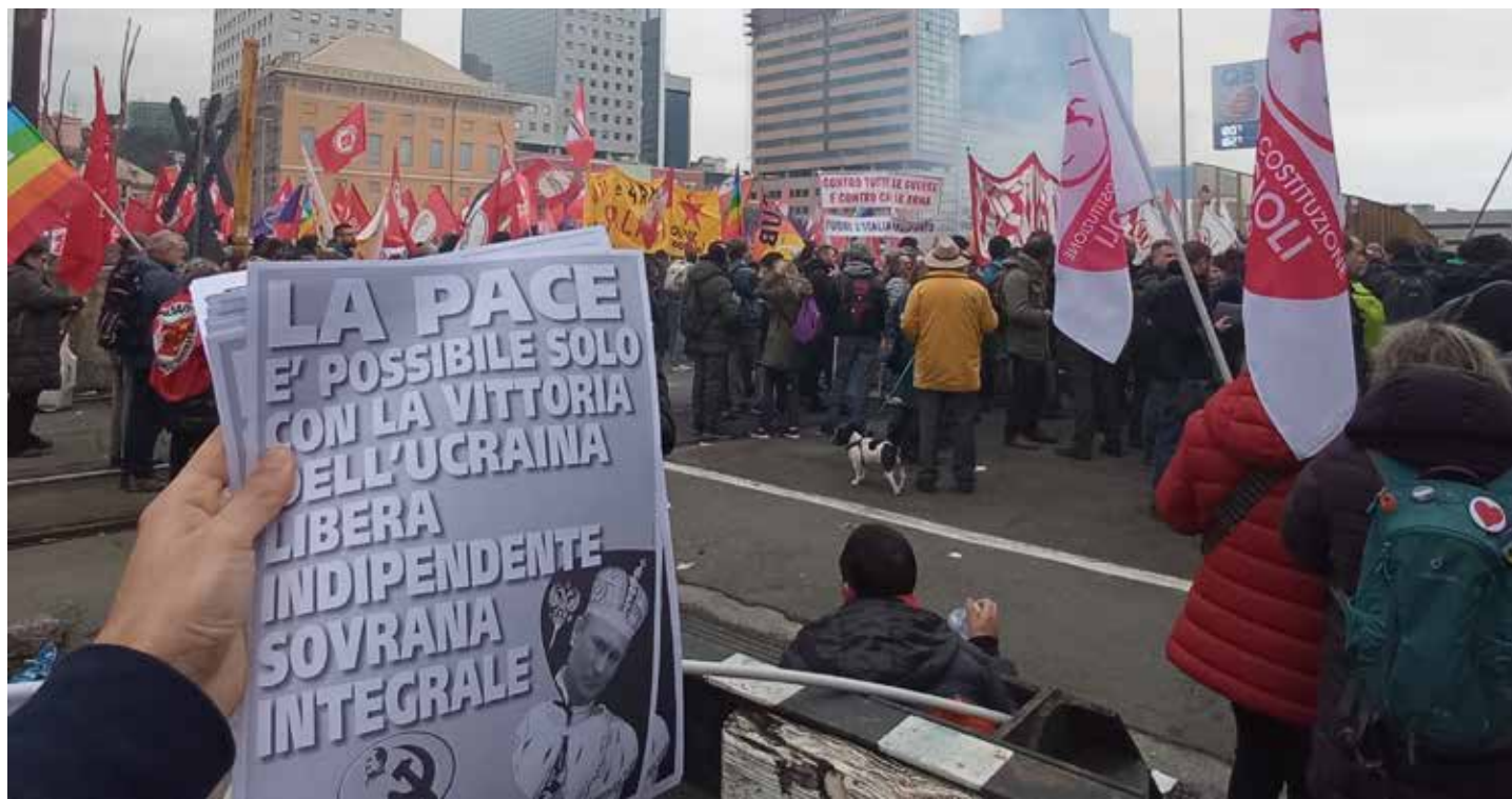
Genova, 25 febbraio 2023. Manifestazione per la pace e contro l'economia di guerra e il caro-vita. In primo piano la diffusione del volantino del PMLI, a cura della neonata Organizzazione della provincia di Genova del Partito, a sostegno della lotta dell'Ucraina contro l'aggressione russa

A Genova sono arrivati in 13 mila per la mobilitazione indetta dal Calp, il Collettivo Autonomo dei Lavoratori Portuali, che già in passato aveva promosso manifestazioni e proteste contro l'invio di armi verso Paesi in guerra. "Le guerre si fermano con le rivoluzioni", "Stop Bahri", in riferimento alle navi della flotta saudita adibite al trasporto di pezzi di armamenti e "Fuori l'Italia dalla Nato", sono stati alcuni slogan dell'iniziativa. La manifestazione era stata aperta e rilanciata dall'ulteriore slogan, "Abbassate le armi, alzate i salari". Tra i partecipanti, tante bandiere dei Cobas, Uzb, le rappresentanze dei portuali di Livorno e Civitavecchia, collettivi studenteschi ed "antagonisti" e una rappresentanza di lavoro