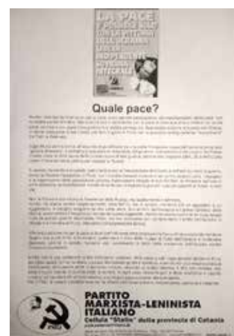
Il volantino del PMLI diffuso durante la manifestazione

I compagni hanno avuto tanti dialoghi e consensi sulla linea del PMLI ma anche discussioni più accese con chi in buona o cattiva fede, si poneva a difesa, o giustificava Putin. I compagni si sono sfolati per spiegare che non c'è un imperialismo buono e uno cattivo, gli imperialismi di fatto sono tutti contro i popoli.