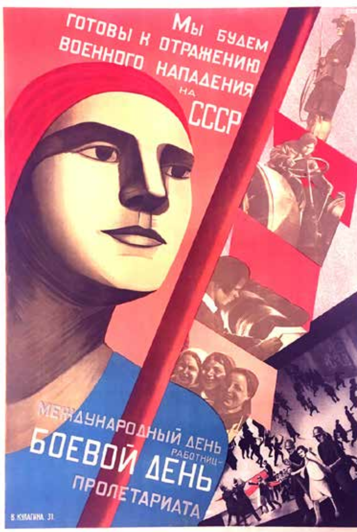
"La giornata internazionale delle donne è un giornata del proletariato militante". Manifesto sovietico del 1931

Dobbiamo batterci con tutte le nostre forze per un lavoro