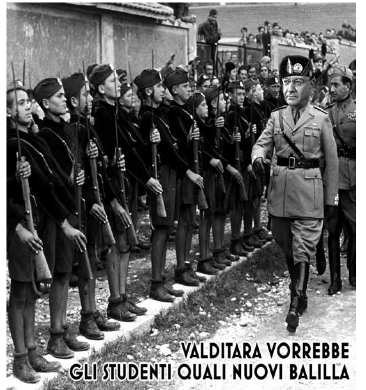
VALDITARA VORREBBE GLI STUDENTI QUALI NUOVI BALILLA

Il PMLI sarà presente alla manifestazione e lotterà al fianco delle studentesse e degli studenti e delle masse polari antifasciste per spazzare via il governo neofascista Meloni, mettere fuorilegge tutti i gruppi neofascisti e neonazisti e chiedere a gran voce le immediate dimissioni del ministro fascioleghista Valditara.