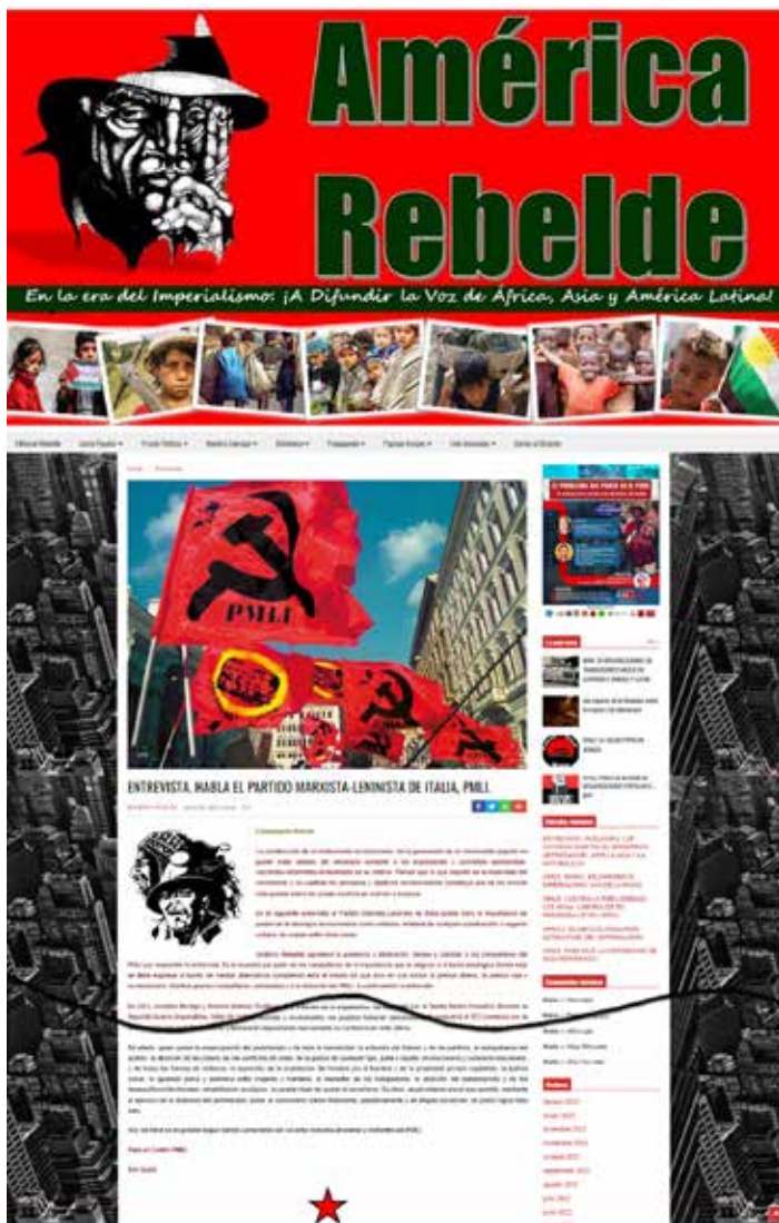
La pagina del sito América Rebelde che riporta l'intervista al PMLI (in spagnolo)

parsa, dal titolo: Applichiamo gli insegnamenti di Mao sul revisionismo e sulla lotta di classe per il socialismo. "Il revisionismo moderno ha avuto in Italia una centrale molto importante e agguerrita, che aveva