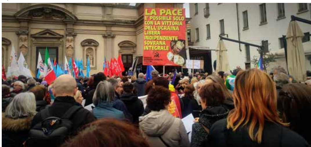
Milano, 24 febbraio 2023, piazza Santo Stefano. Presidio ad un anno esatto dall'inizio della guerra di aggressione russa all'Ucraina. Al centro si nota il cartello del Partito con la giusta posizione antimperialista per l'unica pace possibile

Sostanzialmente, negli stessi interventi, nessuno si è contraddistinto nell'analisi della guerra in corso che ha assunto un carattere esclusivamente "pacifista", senza voler dare alcuna connotazione diversa né all'aggressore, né all'agredito, né tantomeno chiedendosi se questa sia davvero la cosa giusta da fare affinché questa pace possa essere giusta e soprattutto duratura.