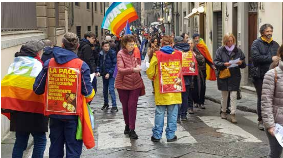
Firenze, 25 febbraio 2023. Aspetti della manifestazione per la pace in piazza Giudici e della diffusione del volantino a firma del Comitato provinciale di Firenze del PMLI dal titolo "Quale pace?"