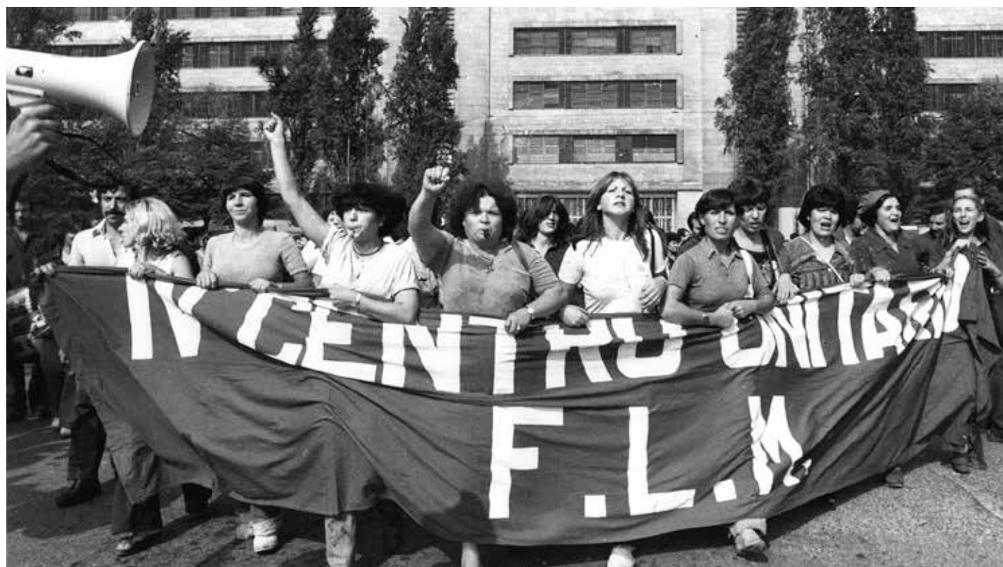
Una immagine delle combattive donne della Fiat durante l'autunno caldo

* Responsabile della Commissione donne del CC del PMLI