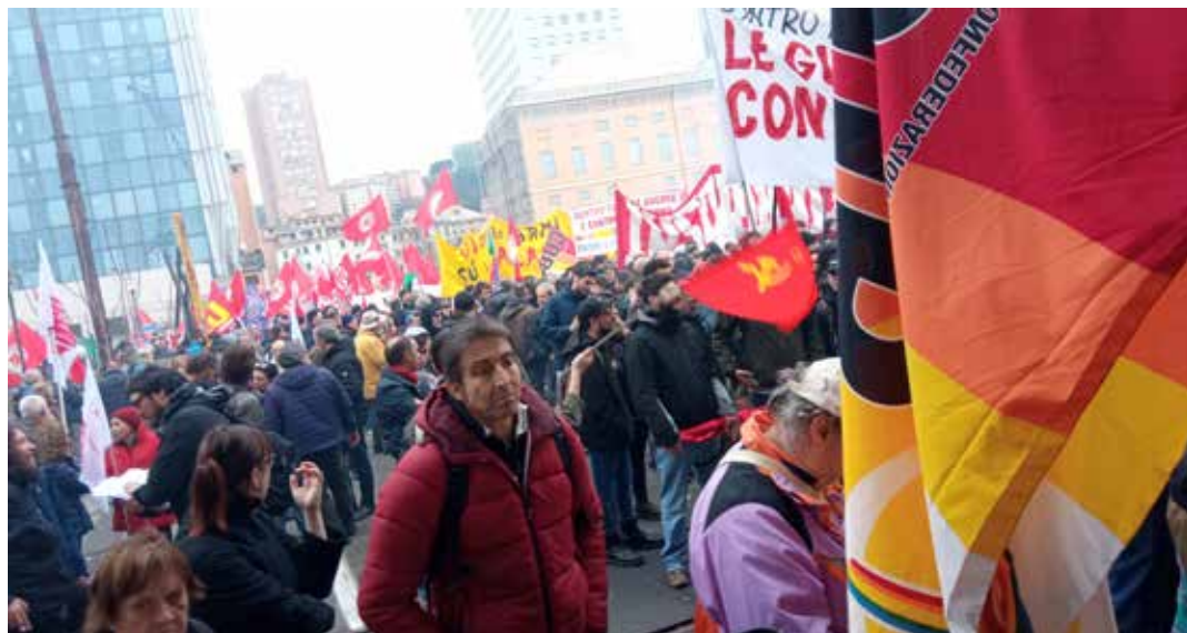
Genova, 25 febbraio 2023. La manifestazione indetta dal Collettivo autonomo lavoratori portuali per la pace

I manifestanti venivano non solo da Genova, ma anche Padova, Trieste, Torino, Milano, Firenze, Civitavecchia e Roma; molti erano lavoratori, in particolare portuali e con l'appoggio del sindacato USB che ha dichiarato 24 ore di sciopero.