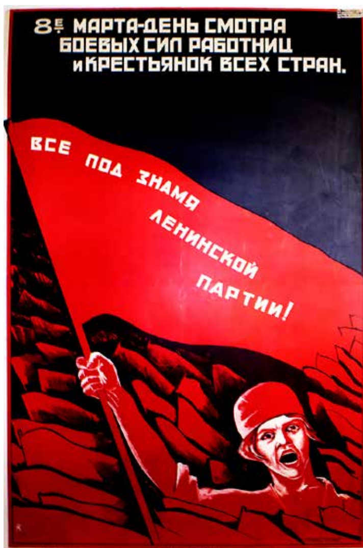
"L'8 Marzo (Giornata internazionale delle donne) passa in rassegna le forze combattenti delle donne lavoratrici di tutti i paesi. Sotto la bandiera del partito di Lenin!". Manifesto sovietico del 1924

Nessun governo, se non quello fascista di Mussolini, è stato più distante dalle esigenze e dai bisogni delle masse femminili sfruttate e oppresse per ideologia, cultura, morale, etica, concezione retrograda e oscurantista della vita, della scienza, della società. E infatti ha cominciato con l'istituzione del Ministero della "Famiglia, natalità e pari opportunità" che dal nome è già tutto un programma, non a caso assegnato alla ministra di Fratelli d'Italia, Eugenia Roc-