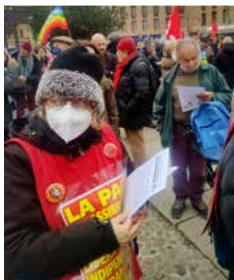
Milano, 24 febbraio 2023. La diffusione del volantino realizzato dal Comitato lombardo del Partito dal titolo "Quale pace per l'Ucraina?" ha suscitato interesse e discussioni così come il manifesto che i compagni della Cellula "Mao" di Milano del PMLI hanno tenuto ben visibile durante tutta la durata del presidio

gredito senza fare una reale distinzione tra le ragioni legittime del secondo e le illegittime pretese del primo. In modo dialet-