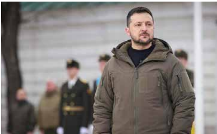
24 febbraio 2023. Il presidente ucraino Zelensky presiede una cerimonia in piazza Santa Sofia a Kiev per commemorare le vittime militari e civili e celebrare la lotta del popolo ucraino a un anno dall'aggressione russa

Sono i nostri medici che soccorrono i soldati feriti al fronte, eseguono interventi chirurgici sotto il fuoco, fanno nascere i bambini nei rifugi antiatomici e restano in servizio per giorni e settimane. Come i nostri soccorritori e vigili del fuoco che tirano fuori le persone dalle macerie e dal fuoco 24 ore al