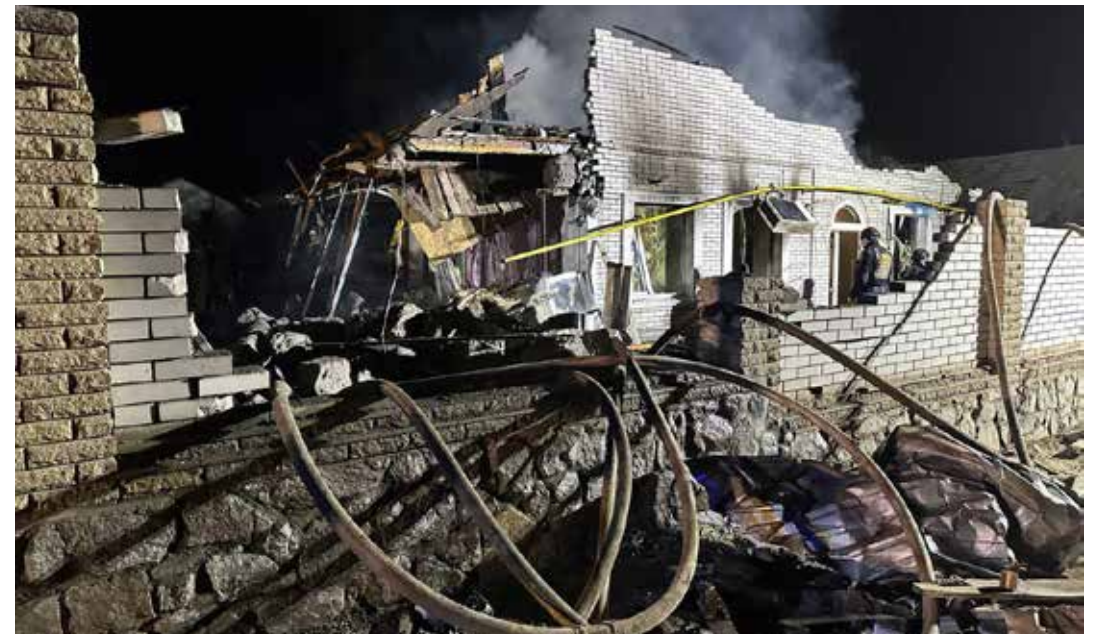
Distruzioni dei missili russi alle abitazioni intorno alla centrale nucleare di Zaporizhzhia