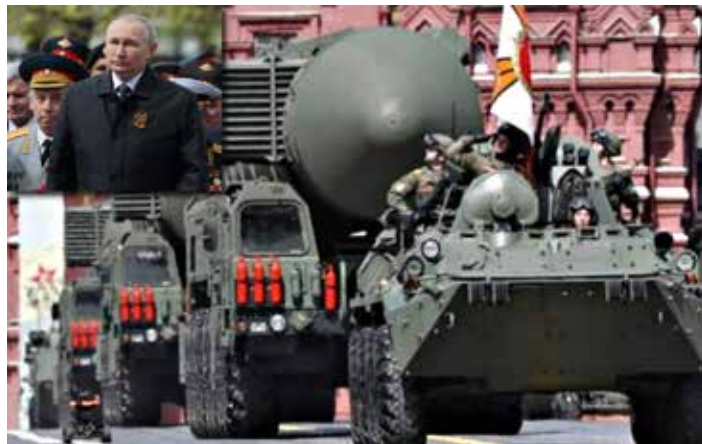
Putin assiste ad una parata militare sulla piazza rossa

Quanto all'Europa, pur prendendo atto che attualmente "la maggior parte degli Stati europei persegue una politica aggressiva nei confronti della Russia", il documento tende ad