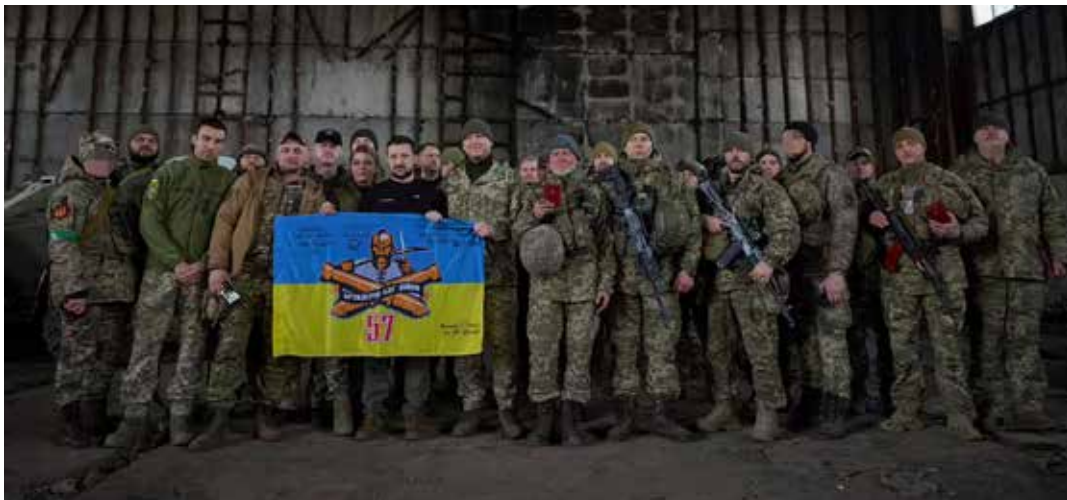
Il presidente ucraino Zelensky durante la sua visita ai combattenti a Bakhmut alla fine di marzo