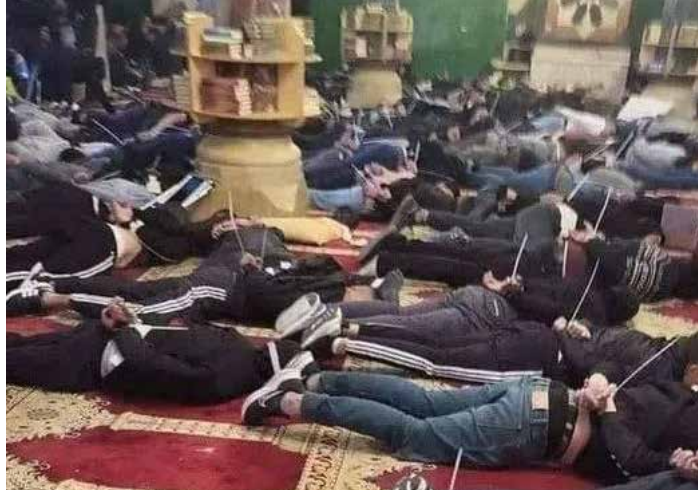
Una immagine della brutale repressione seguita al raid della polizia sionista all'interno della moschea di Al Aqsa con i presenti ammassati a terra legati mani e piedi

di mira obiettivi a Gaza collegati ad Hamas e un'altra formazione politico-militare, Jihad islamica. Il governo di Israele è guidato dal primo ministro Benjamin Netanyahu, dei conservatori del Likud, alleato con partiti della destra di matrice religiosa.