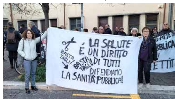
Una delle numerose proteste che si sono svolte in tante località in difesa della sanità pubblica contro i tagli. Qui siamo a Terni A sinistra: Roma, 15 dicembre 2022. Il presidio di protesta dei lavoratori della sanità pubblica in difesa del Servizio sanitario nazionale

contro i cambiamenti climatici, la cura del dissesto idrogeologico, la riconversione ecologica della produzione (in ultima analisi possibile solo nel socialismo), l'abolizione del debito pubblico e il taglio delle spese militari, anche in funzione del reperimento di risorse economiche sulle quali per noi le masse devono avere diritto di parola e di gestione, la lotta all'inquinamento e quindi alla bonifica dei territori e per il trasporto pubblico sia urbano che extraurbano, sbarrando la strada alle mega opere speculative in odor di mafia che aggravano le condizioni di vita delle masse e inquinano l'ambiente, stroncare l'ingerenza del Vaticano negli affari dello Stato italiano, cominciando dall'abolizione dell'“obiezione di coscienza” negli ospedali pubblici che di fatto comprimono il sacrosanto diritto all'aborto.