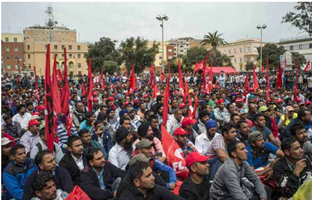
Il primo sciopero dei braccianti indiani nel 2016

Grazie a questo tipo di lavoro nero e sottopagato si sfruttano due/tre lavoratori con uno