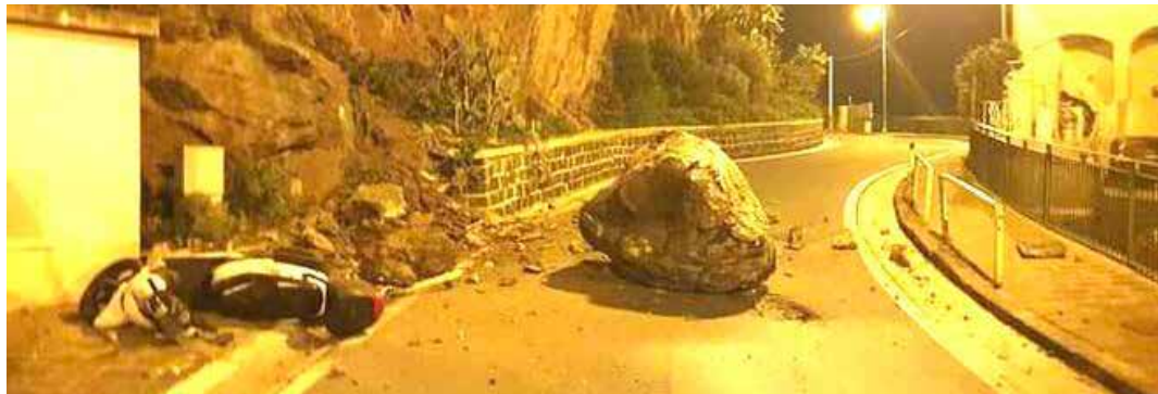
Ischia. Un masso franato dal Monte Vico sulla strada a dicembre 2022 mette in evidenza la necessità di interventi di sicurezza ambientale