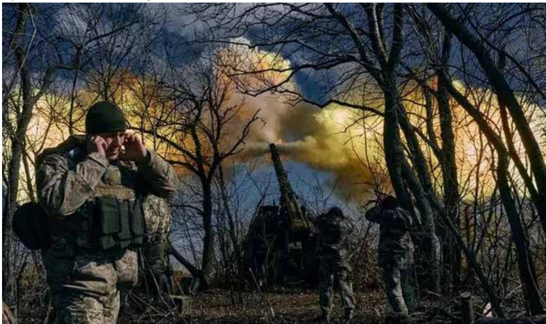
I cannoni ucraini in azione sul fronte di Bakhmut