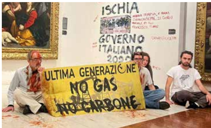
3 dicembre 2022. Protesta di denuncia della terribile frana di Casamicciola ad Ischia del 26 novembre 2022, organizzata alla Pinacoteca di Bologna dagli attivisti di "Ultima Generazione"

A questo punto c'è solo da augurarsi che cresca il movimento ambientalista, civile e politico, capace di sorreggere le proposte avanzate. Dagli oltre 120 amministratori disseminati nei sei Consigli comunali dell'isola, c'è poco da sperare.