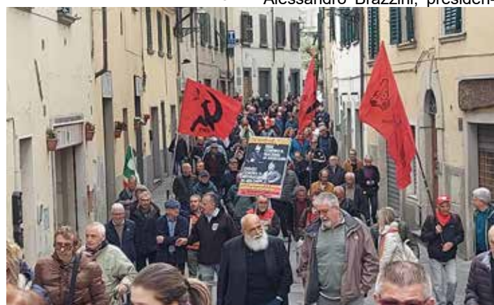
Pontassieve (Firenze), 25 Aprile 2023. Corteo per l'anniversario della Liberazione. In evidenza la delegazione del PMLI con il manifesto per il 25 Aprile contro il governo neofascista Meloni