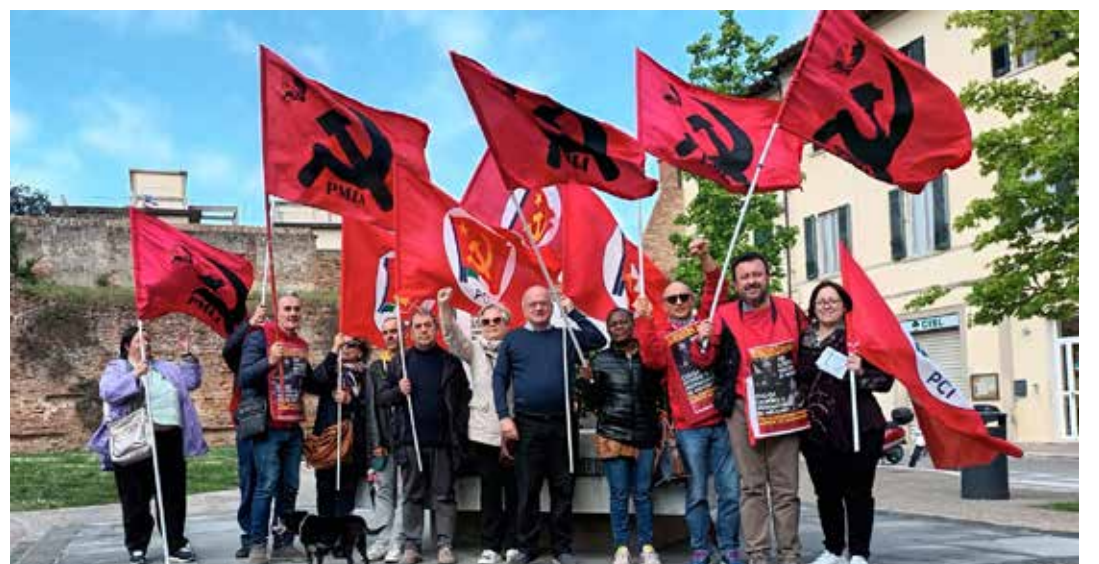
Empoli, 25 Aprile 2023. A conclusione della celebrazione unitaria. Una immagine concreta di che cosa significhi unità d'azione tra i partiti con la bandiera rossa e la falce e martello

L'iniziativa istituzionale si è conclusa davanti al monumen-