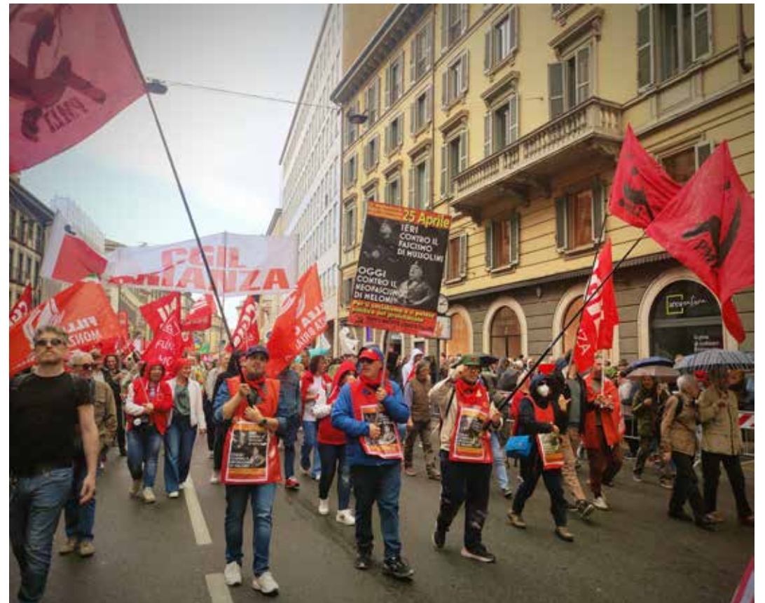
Milano, 25 Aprile 2023. Sopra e nella pagina la combattiva e rossa delegazione del PMLI ha tenuto alto il manifesto del Partito per il 78° della Liberazione contro il governo neofascista Meloni

Anche stavolta l'avanguardia antifascista dell'intero corteo l'ha rappresentata indubbiamente il PMLI con la combattiva delegazione milanese sfilata sotto le rosse bandiere del Partito e di un cartello con affisso il manifesto del PMLI sul 25 Aprile, che rappresenta Meloni in divisa fascista affiancata a Mussolini tra i quali si legge "Ieri