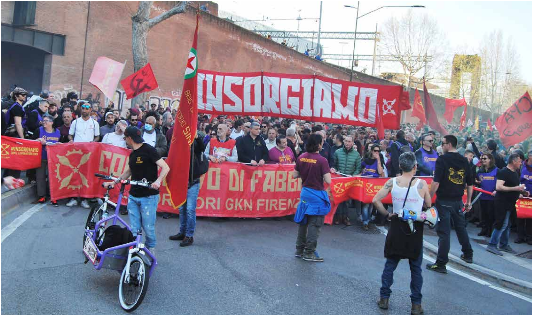
Firenze, 25 marzo 2023. Manifestazione nazionale della ex GKN per la difesa del posto di lavoro e contro la liquidazione della fabbrica. In apertura di corteo, gli storici striscioni del Collettivo di fabbrica e Insorgiamo

la sinistra borghese per avere una sponda politica, che a difendere gli interessi dei lavoratori.