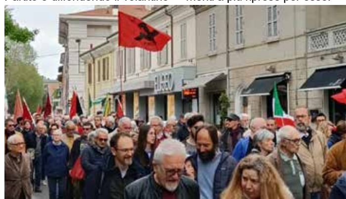
Cesena, 25 Aprile 2023. Corteo per il 78° Anniversario della Liberazione. Presente il PMLI con le bandiere del Partito e la diffusione del volantino riportante l'Editoriale de "Il Bolscevico"

Anche quest'anno era presente il PMLI con le bandiere del Partito e diffondendo il volantino