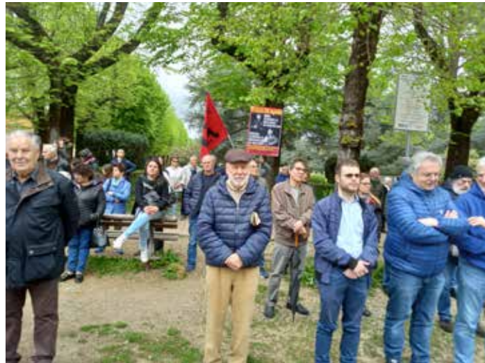
Borgo San Lorenzo (Firenze), 25 Aprile 2023. La celebrazione della Liberazione presso monumento ai Caduti per la lotta di Liberazione. Il PMLI è stato l'unica forza politica presente con le proprie insegne e con il manifesto sul 25 Aprile

Come purtroppo è consuetudine l'iniziativa si è svolta nel solito clima nazionalista e patriottico con l'esecuzione dell'inno nazionale e addirittura de "Il Piave mormorò" che con la Resistenza c'entra "come il cavolo a merenda". Ormai in queste iniziative da un lato vi è la componente istituzionale, dall'altra la componente popolare che quest'anno ha visto la partecipazione di un nutrito gruppo di lavoratori della CGIL organizzati dietro lo striscione della Camera del lavoro di Borgo San Lorenzo; spezzone dove predominava il rosso delle bandiere della stessa CGIL e la com-