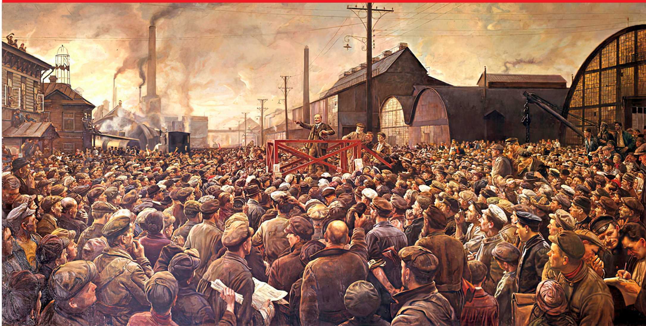
Maggio 1917. Lenin tiene un comizio agli operai delle Officine Putilov. Gli operai di questa grande fabbrica metalmeccanica di Pietrogrado erano stati tra le principali forze della Rivoluzione del 1905, poi della Rivoluzione democratico-borghese del febbraio del 1917 e infine furono l'ossatura operaia e militare della Grande Rivoluzione Socialista d'Ottobre

(Lenin, "VIII Congresso del PCR(b)", 18-23 marzo 1919, Opere complete, vol. 29, pagg. 179-180, Ed Riuniti)