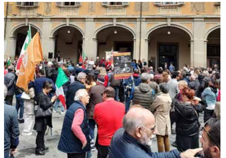
Prato, 25 Aprile 2023. Piazza del Comune durante la celebrazione per il 78° Anniversario della Liberazione. Il PMLI, al centro nella foto, è presente con il manifesto contro il governo Meloni

La manifestazione è stata spostata presso il circolo 29 Martiri di Figline con letture di poesie, ricostruzioni storiche, musica, intrattenimento ed in-