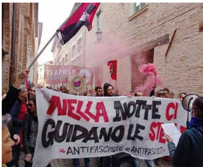
Fano, 25 Aprile 2023. Un aspetto del corteo per la manifestazione per il 78° Anniversario della Liberazione

to locale, certi che, prima o poi, vedremo nuove leve locali entrare nel Partito con l'obiettivo di liberarci dal capitalismo, dal fascismo, in tutte le sue varianti e coperture, e battersi per l'Italia unita, rossa e socialista!