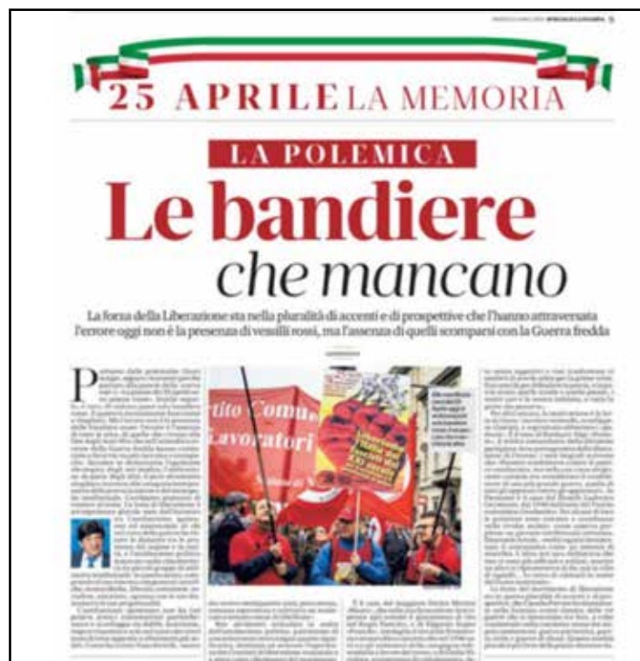
L'inserto de La Stampa del 25 aprile 2023 pubblica un manifesto del PMLI contro il neofascismo nell'articolo dal titolo "Le bandiere che mancano"