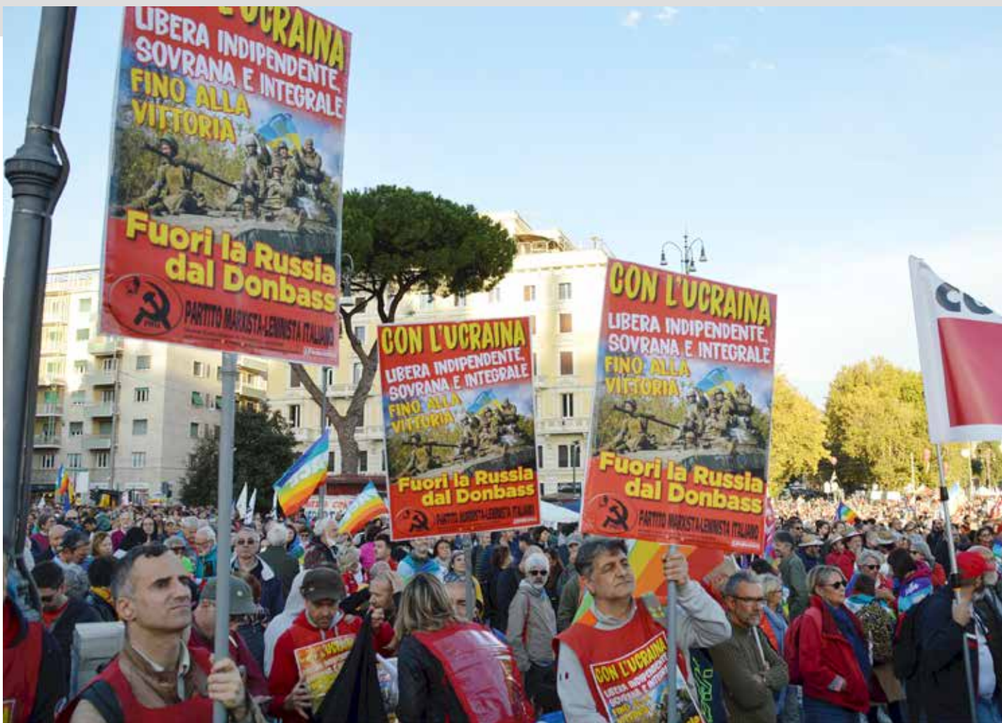
Roma, piazza San Giovanni, 5 novembre 2022. Manifestazione nazionale per la pace. La delegazione nazionale del PMLI tiene alti i manifesti a sostegno della resistenza ucraina

si per ammansire l'orso russo e far cessare al più presto la guerra; un opportunismo, di tipo culturale, che non distingue tra le guerre giuste (antimperialiste, di resistenza e di liberazione) e le guerre ingiuste (imperialiste e di aggressione) e che condanna la resistenza popolare armata al pari delle guerre ingiuste e ammette idealisticamente solo la resistenza passiva nonviolenta.