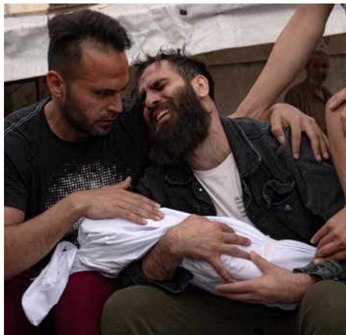
29 ottobre 2023, Khad Younis. Un padre si dispera per la morte del figlio neonato