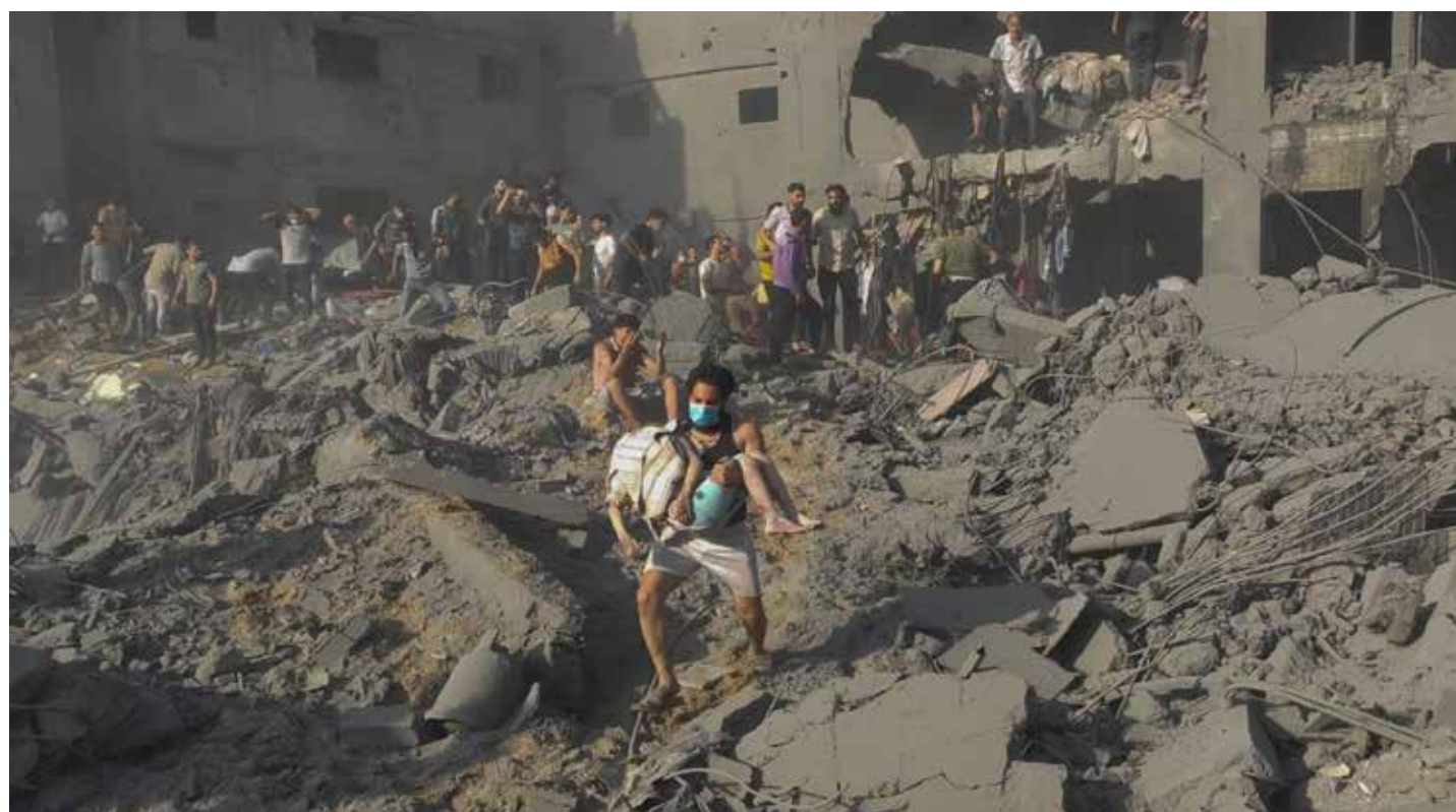
31 ottobre 2023. Il campo rifugiati di Jabalia nel nord di Gaza completamente distrutto dal criminale bombardamento nazi-sionista

lager, l'attacco israeliano è stato accompagnato dall'interruzione di energia elettrica, telecomunicazioni e internet che rischia di “servire da copertura per atrocità di massa”. Lo ha dichiarato l'organizzazione per i diritti umani Human Rights Watch (Hrw). “Questo blackout di informazioni – ha dichiarato la funzionaria di Hrw Deborah Brown – rischia di servire da copertura per le atrocità di massa e di contribuire all'impunità per le violazioni dei diritti umani”. Secondo Hamas, “l'interruzione delle comunicazioni e di internet nella Striscia di Gaza e l'intensificazione dei bombardamenti aerei, marittimi e terrestri sui quartieri residenziali fanno presagire nuovi omicidi che l'occupante intende commettere lontano dallo sguardo dei media e del mondo”. Hamas ha attribuito la piena responsabilità a Israele, al suo alleato americano