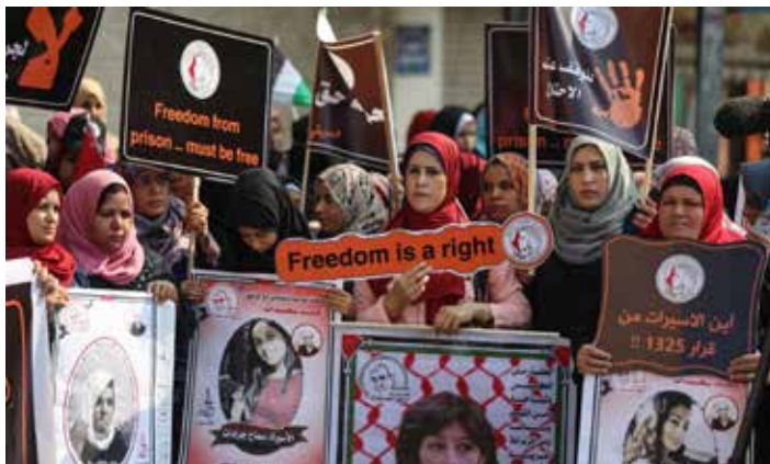
Una manifestazione delle donne dell'Unione dei Comitati di azione delle donne palestinesi

L' Unione dei Comitati d'Azione delle Donne palestinesi (UCADP) ha "denunciato i pesanti bombardamenti di strutture residenziali e palazzi in tutte le aree della Striscia di Gaza, e l'alto tasso di feriti e martiri tra