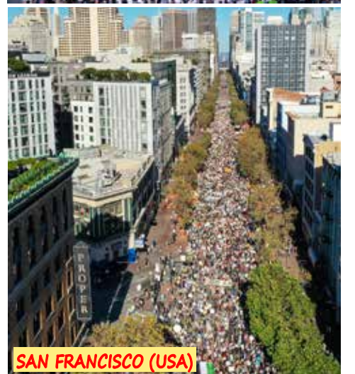
SAN FRANCISCO (USA)