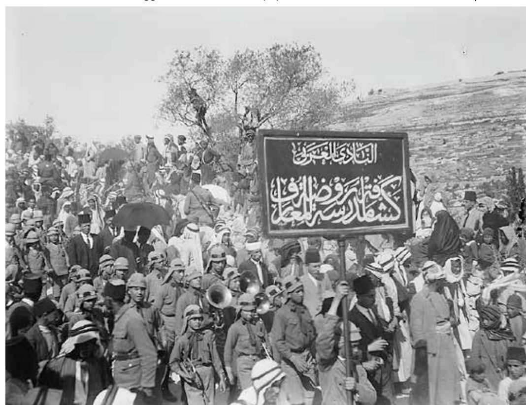
Una manifestazione araba del 1920 contro la politica dell'imperialismo inglese che appoggiava le "rivendicazioni" sioniste per mettere le mani sulla Palestina

Tra gli immigrati ebrei in Palestina si era intanto diffusa, come strumento di comunicazione, la lingua ebraica scritta e parlata, perché nella seconda metà dell'Ottocento filologi ebrei europei avevano creato l'ebraico moderno: gli ebrei sparsi per il mondo, infatti, per