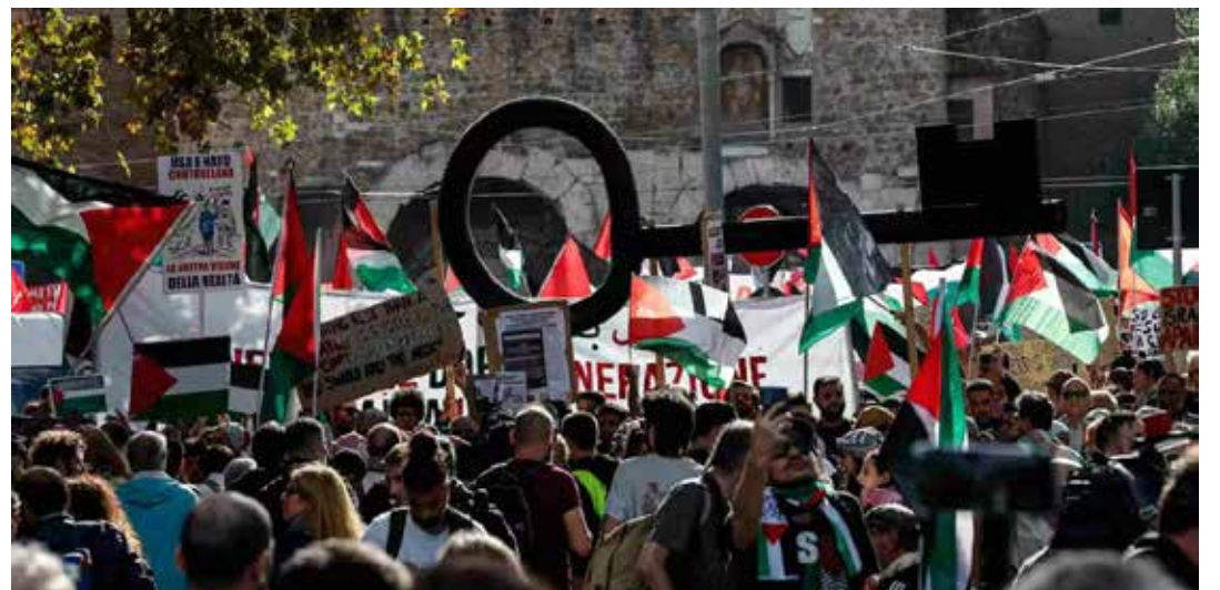
Durante la manifestazione di Roma è stata portata e tenuta alta una grande chiave simbolo della Nakba