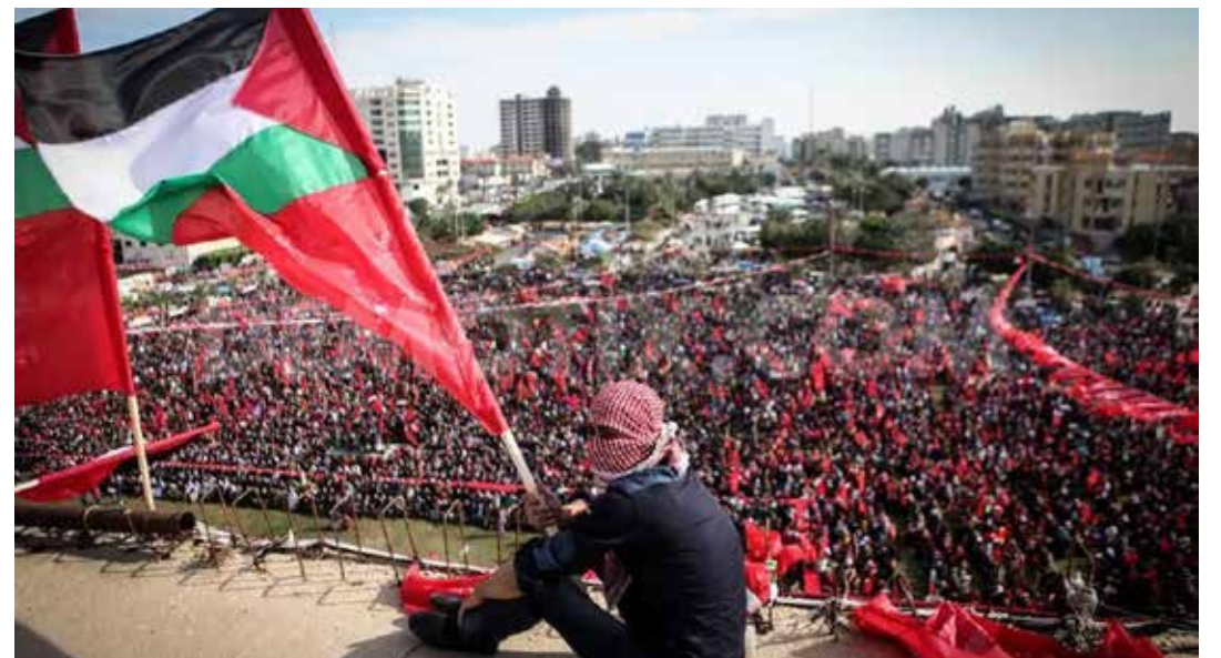
Una grande manifestazione del Fronte popolare di Liberazione della Palestina svoltasi in Cisgiordania

In una Dichiarazione rilasciata dal Partito Comunista Palestinese del 14 ottobre si legge: "Le masse del nostro popolo sono in lotta da 75 anni contro l'occupazione della terra di Palestina, gli occupanti hanno cercato e continuano a cercare di