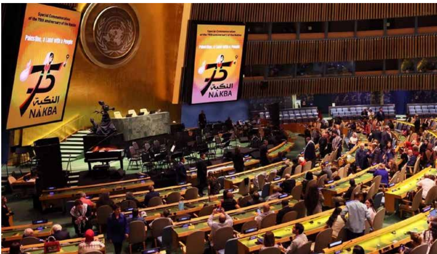
La commemorazione della Nakba per la prima volta all'Onu il 16 maggio 2023 con 90 voti a favore, 30 contrari e 47 astenuti

Intanto, come prima misura, Israele ha iniziato a negare i vi-