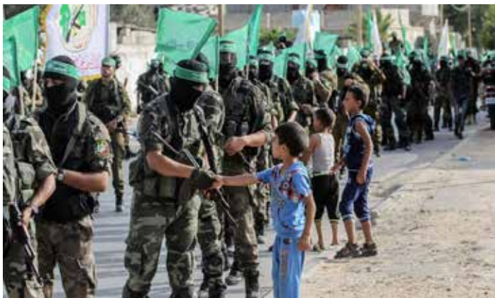
Le Brigate Ezzedin al-Qassem

Gaza, sottraendolo all'Autorità nazionale palestinese. La Lista Cambiamento e Riforma (Hamas) ha ottenuto la maggioranza assoluta dei consiglieri, con 74 seggi (44%); nel distretto di Gaza ha ottenuto 15 seggi su 24 (6 a Fatah e 3 a indipendenti), mentre in Cisgiordania e Gerusalemme est, ha ottenuto 30 seggi su 42 (11 a Fatah e 1 ad un indipendente). Tra i suoi alleati si annovera il movimento libanese Hezbollah. Le Brigate Ezzedin al-Qassam sono la sua ala militare. È considerata un'organizzazione terroristica da Stati Uniti, Unione europea e altri paesi occidentali.