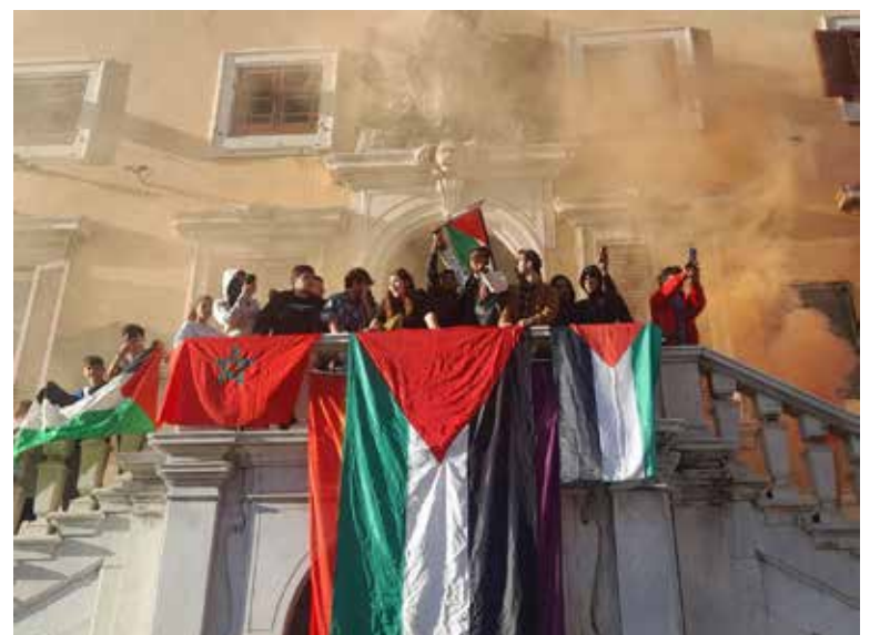
Livorno. Un aspetto della manifestazione per la Palestina