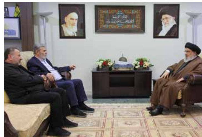
Beirut, 25 ottobre 2023. Il capo di Hezbollah, Hassan Nassrallah, (a destra) con il capo della Jihad islamica palestinese Ziad Nahleh e il vice capo dell'ufficio politico di Hamas, Saleh al-Aroui

ne dal giorno dopo l'attacco di Hamas a Israele del 7 ottobre. Hezbollah e Israele erano già combattuto una guerra di un mese nel 2006 che si è conclusa con una situazione di stallo sostanziale. Israele vede Hezbollah, sostenuto dall'Iran, come la sua minaccia più grave, stimando che abbia circa 150.000 razzi e missili puntati contro Tel Aviv.