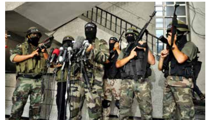
Le brigate Al-Nasser Salah al-din

cilmente la loro terribile sconfitta, ma difenderanno con tutte le forze il loro progetto imperialista nella regione, già hanno praticato e attueranno altri terribili massacri contro il nostro popolo, nel tentativo di sottometterlo. Pertanto, la battaglia attuale tra il nostro popolo indifeso e il più grande arsenale militare del mondo è una battaglia per l'esistenza, non una battaglia per i confini, ed è la chiave delle battaglie della prossima liberazione. Anche il nostro nemico inevitabilmente si rende conto, che la sua battaglia contro il popolo palestinese è la battaglia per l'esistenza su questa terra. Ogni palestinese in terra di Palestina è un chiodo nella bara dello stato di occupazione sionista. Pertanto, non sorprende che gli obiettivi della sua battaglia contro il nostro popolo, oggi abbia tra gli obiettivi: ricreare lo scenario di sfollamento e creare una nuova catastrofe per il nostro popolo, ma questo nemico, con la sua mentalità criminale, non si è reso conto e non si renderà conto che il nostro popolo ha capito la lezione ed è determinato a far sì che non vi siano più spostamenti dopo oggi, e che il tempo delle battute d'arresto è passato, dopo la battaglia di Al-Aqsa. Sosteniamo il nostro eroico popolo, oh nostro popolo