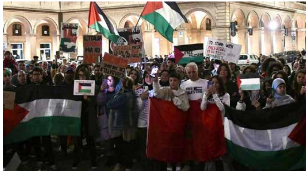
28 ottobre 2023. La manifestazione per la Palestina a Macerata