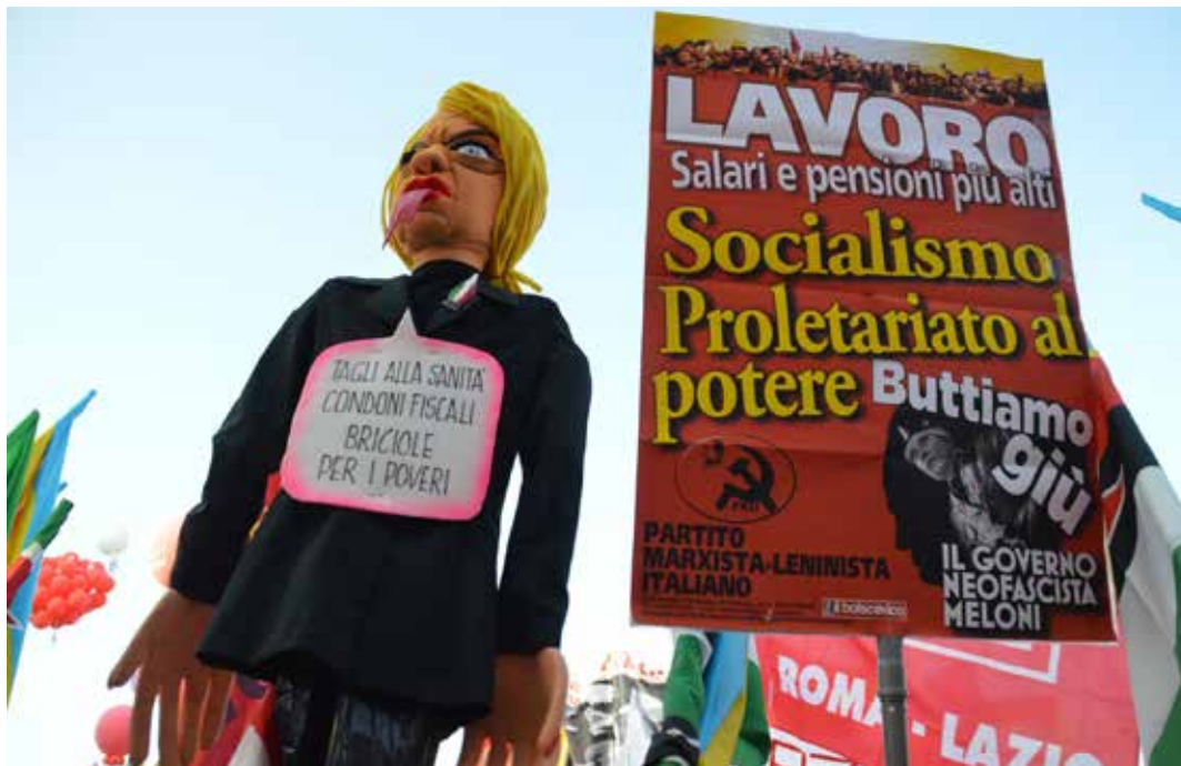
Roma, piazza San Giovanni, 7 ottobre 2023. Manifestazione nazionale sindacale e politica della CGIL e altre organizzazioni. Di fronte al palco spicca il manifesto del PMLI e accanto una efficace caricatura della neofascista Meloni con un cartello che sintetizza alcuni degli aspetti della manovra finanziaria

Anche l'Ape sociale, lo strumento introdotto dal governo