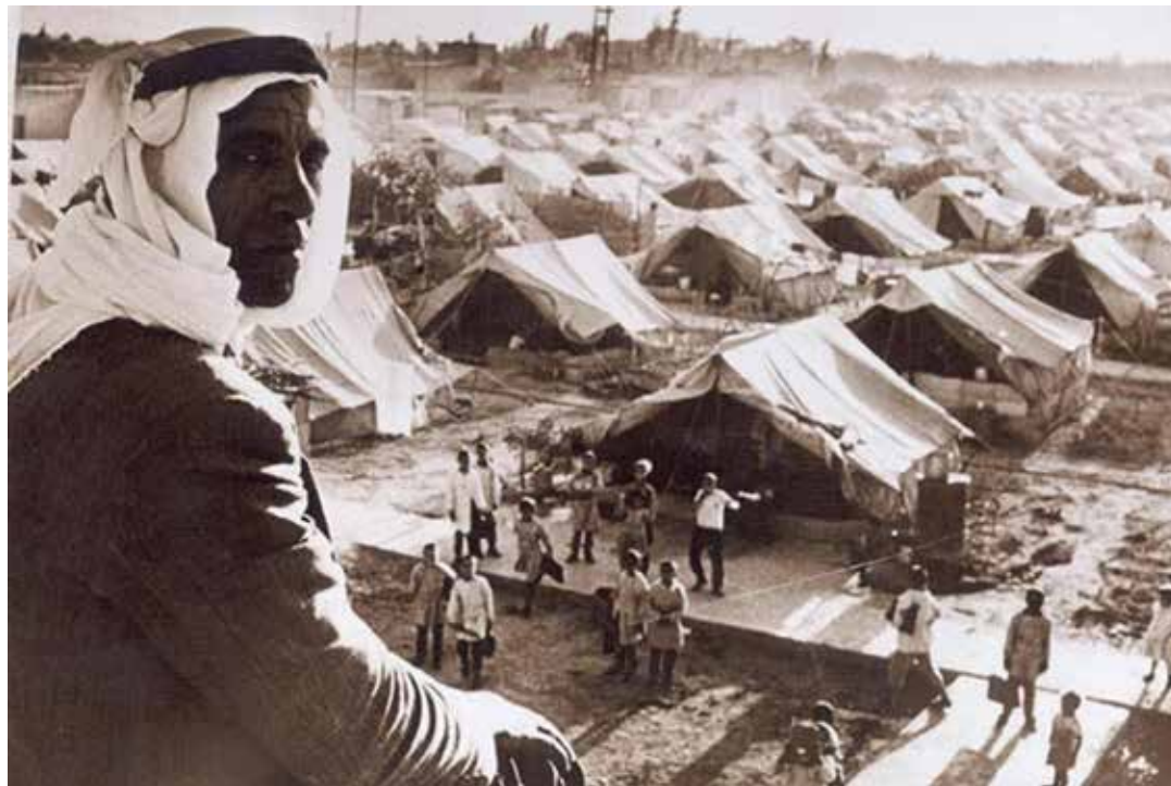
1948. Lo sterminato campo dei profughi palestinesi a Jaramana (Damasco in Siria)

In modo particolare, mentre Hamas e Jihad Islamico Palestinese facevano partire contemporaneamente centinaia di razzi verso il territorio israeliano, il Fronte Popolare per la Liberazione della Palestina ha curato sia l'assalto alle torri di guardia israeliane al confine della Striscia di Gaza con l'utilizzo di droni e di sabotatori sia l'abbattimento di tratti di recinzione con l'esplosivo, aprendo così la strada a circa cinquemila combattenti di Hamas, Jihad Islamico Palestinese e Fronte Popolare per la Liberazione della Palestina che hanno compiuto azioni di guerriglia in territorio israeliano. I miliziani del Fronte Popolare per la Liberazione della Palestina hanno curato aspetti tecnici e logistici dell'operazione.