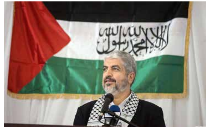
Khaled Meshal, uno dei leader di Hamas

Cosa pensate di fare con gli ostaggi? Cosa volete in cambio?