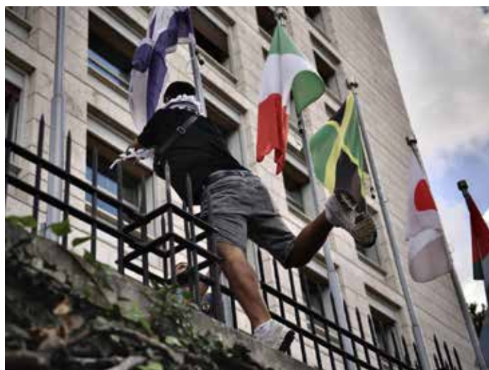
Roma. Un manifestante toglie la bandiera israeliana dal palazzo della Fao

Israele tra gli applausi degli altri manifestanti. Mentre durante il percorso verso Piazza San Giovanni dal camion con gli altoparlanti in testa al corteo gli organizzatori improvvisano comizi volanti per denunciare l'assedio di Gaza, il genocidio in atto, la pulizia etnica, l'apartheid, le "vittime innocenti dei raid israeliani", gli oltre "tremila bambini uccisi dai terroristi durante i bombardamenti indiscriminati" e avvertono "Resisteremo fino alla vittoria".