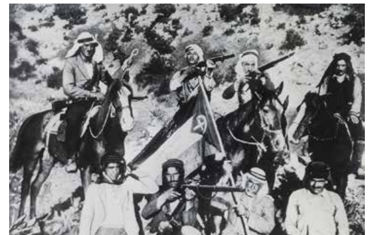
Due immagini della grande Rivolta Araba contro l'imperialismo Inglese e sionista avvenuta in tre anni dal 1936 al 1939 in particolare dopo l'uccisione di uno dei capi della rivolta antimperialista Ezzedin Al-Qassam

È chiaro ed evidente, quindi, che già dopo alcuni secoli dalla conquista araba la popolazione che viveva in quell'area geografica aveva in maggioranza abbandonato gradualmente, da un punto di vista linguistico, l'aramaico e il greco a favore dell'arabo e, da un punto di vista religioso la quasi totalità degli ebrei e dei cristiani si era convertita pacificamente all'islam. Se da un punto di vista etnico, quindi, si può affermare che gli attuali palestinesi discendono dagli antichi ebrei etnici e religiosi che abitavano da millenni quel territorio, la nascita di una specifica identità palestinese - cioè il fatto che gli abitanti della Palestina sentano di appartenere allo stesso popolo e si con-