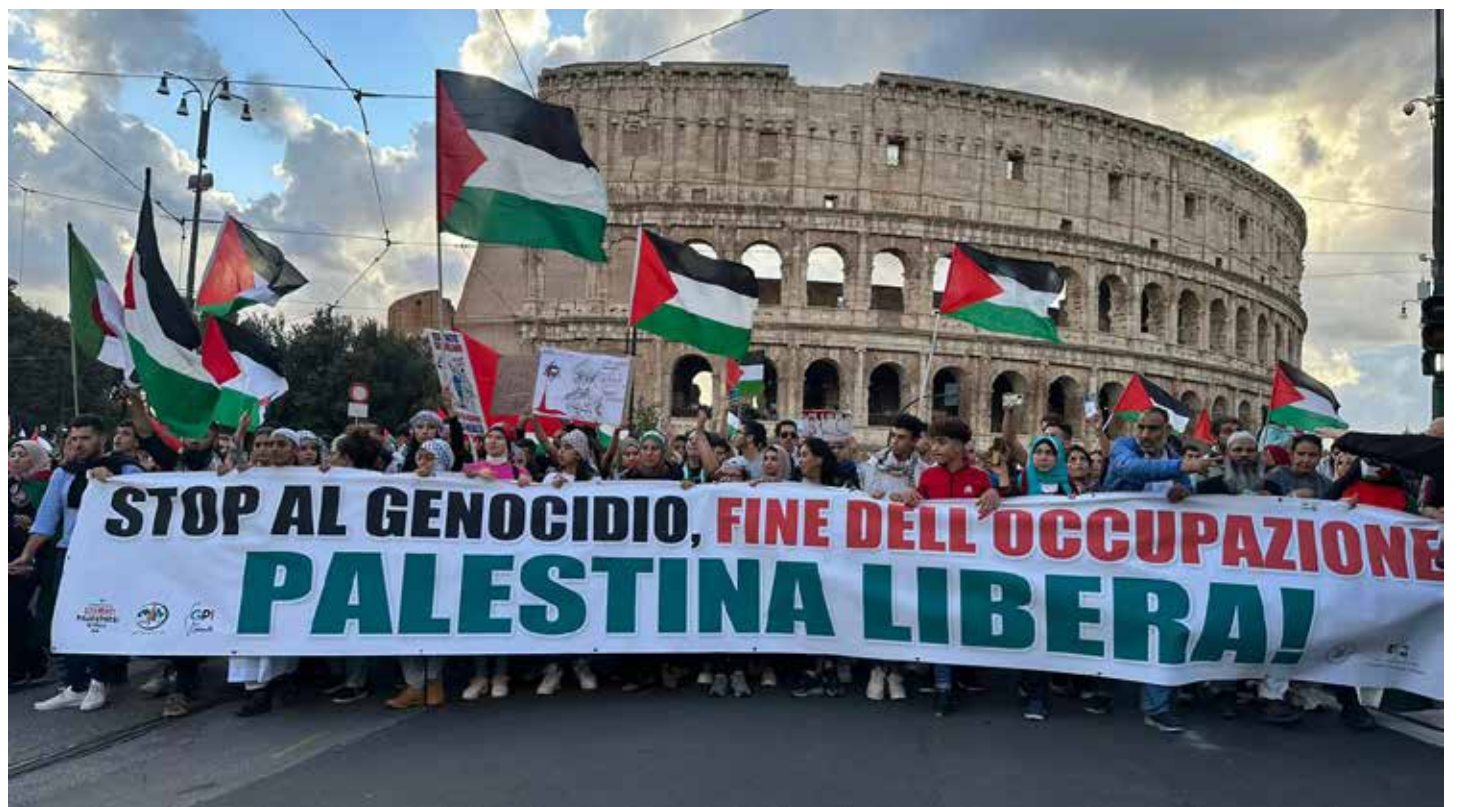
Roma, 28 ottobre 2023. Manifestazione in appoggio alla lotta del popolo palestinese e contro l'aggressione israeliana

Contestati anche i media di regime sostenitori del "legittimo diritto di Israele di difendersi dagli attacchi terroristi di Hamas" e giustamente accusati di fare "propaganda impe-