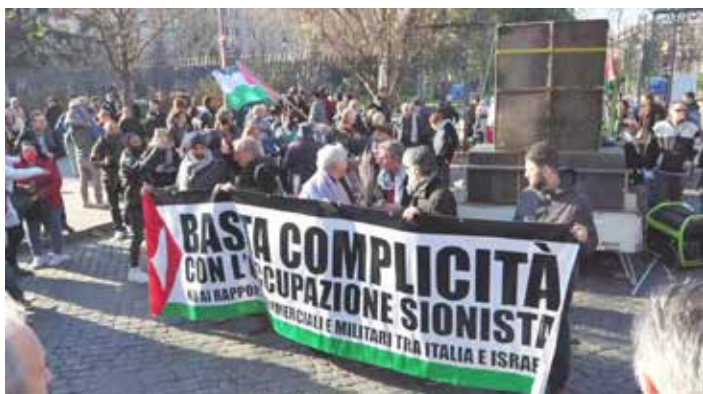
Roma, 27 gennaio 2024. Due importanti striscioni contro le manovre del governo Meloni per impedire la manifestazione per la Palestina

Il governo della ducessa Meloni ha cercato inutilmente di impedire con misure liberticide e a suon di manganelli affinché si manifestasse nel Giorno della Memoria che, ricordiamo, ricade ogni 27 gennaio, il giorno della liberazione del campo di sterminio nazista di Auschwitz da parte dell'Armata Rossa di Stalin. Una data storica e importante per ogni sincero antifascista che oggi viene mistificata e travisata dalla borghesia e dall'imperialismo che intendono appropriarsene a proprio comodo, e le prescrizioni sulle manifestazioni ne sono un esempio lampante. Gli imperialisti USA e i loro stretti alleati sionisti si riempiono ipocritamente la bocca ammonendo sempre i popoli a "non dimenticare l'olocausto", ma nei fatti si comportano come i nazisti che lo attuarono.