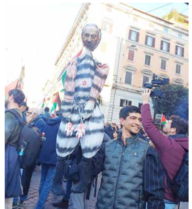
27 gennaio 2024. Il fantoccio di Netanyahu (di cui si parla nell'articolo) portato in corteo a Roma