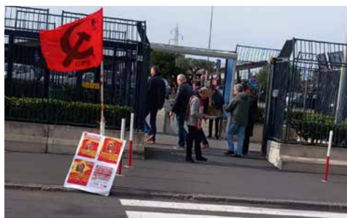
Catania, zona industriale, 19 gennaio 2024. Diffusione del volantino per il centenario della morte di Lenin

Il volantino, che oltre alla bella effigie di Lenin su una bandiera rossa, conteneva il QR code per poterlo leggere integralmente in Internet, è stato effettuato alla zona industriale di Catania in uno degli stabilimenti dell'azienda susci-