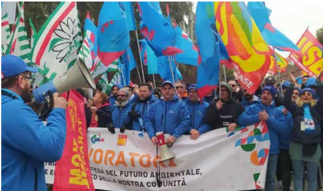
29 gennaio 2024. Correo di protesta dei lavoratori ex Ilva intorno allo stabilimento al grido "Via Mittal da Taranto"

Alla fine Arcelor-Mittal è venuta allo scoperto. Il settembre scorso aveva sottoscritto un piano di investimenti per la decarbonizzazione aggiornato e potenziato dove "venivano individuati i relativi finanziamenti pubblici di supporto". Il piano, da finalizzare entro il 2030 aveva un costo di 4,6 miliardi con l'impegno del governo a mettercene 2,3. Quell'intesa è stata letteralmente stracciata da Mittal nel giro di due mesi.