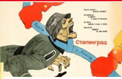
I nazisti strozzati dall'Armata rossa. Manifesto sovietico sulla vittoria di Stalingrado