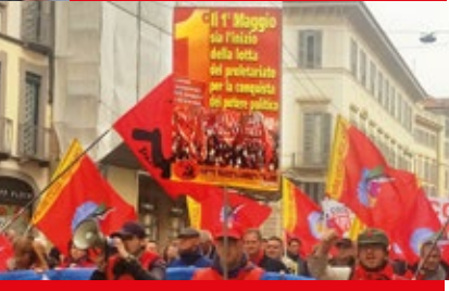
Il 1° Maggio sui Pirelli: la lotta della classe proletaria per la conquista del primo maggio

Giornata internazionale delle lavoratrici e dei lavoratori