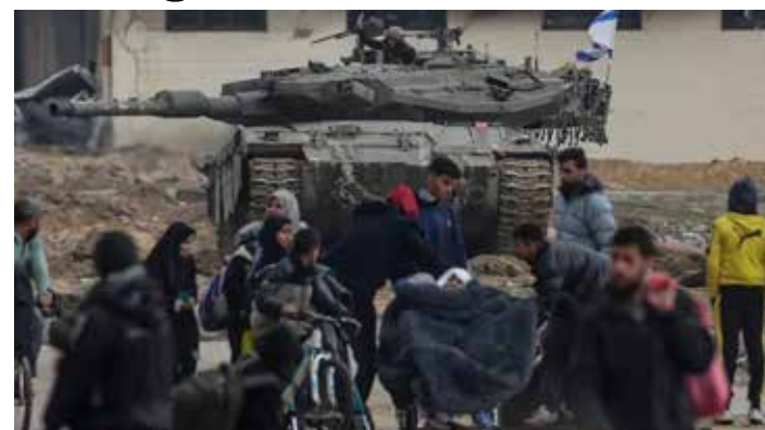
Profughi palestinesi di Khan Yunis sotto il controllo di un carro armato israeliano

Il boia Netanyahu definiva "oltraggiosa" la decisione della Corte, "un marchio di vergogna che non sarà cancellato per generazioni", ossia quello che ha fatto finora il regime di Tel Aviv ignorando le sue decisioni, attaccava il governo del Qatar perché "ospita e finanzia Hamas", che lo ha fatto per anni col suo permesso "scaduto" il 6 ottobre scorso, e dava il via libera per gli attacchi più becchi e arroganti degli esponenti del suo governo. La lista sarebbe lunga ma la teoria che i boia di Tel Aviv sarebbero i paria di un mondo che nonostante i loro sforzi insiste a sostenere i presunti "terroristi" palestinesi, da Hamas a tutte le organizzazioni della resistenza alla popolazione decimata senza scrupoli cade alle prime accuse, ridicolo