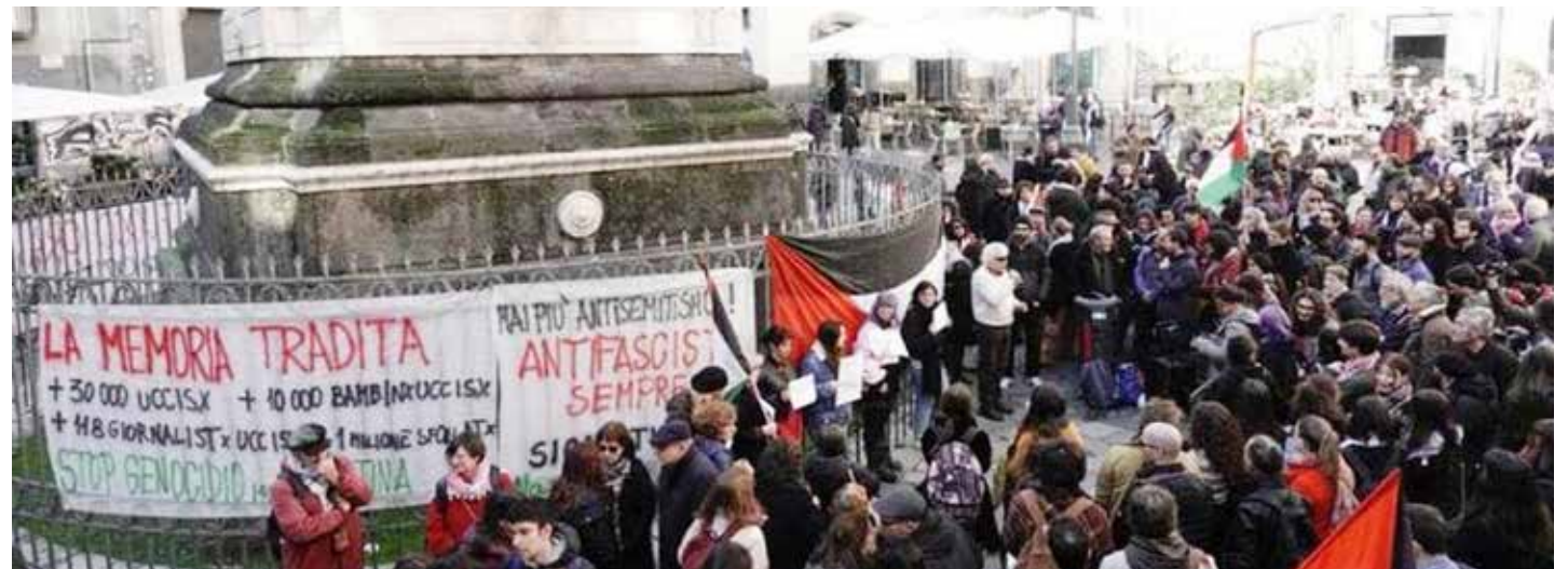
Napoli, piazza del Gesù nuovo, 27 gennaio 2024. Manifestazione per la Palestina