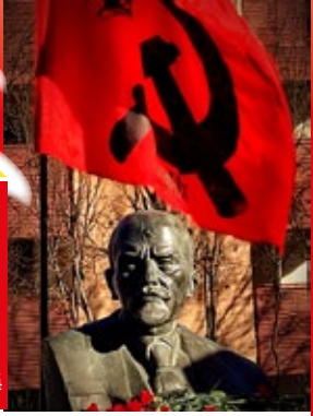
Caviago, 21 gennaio 2024