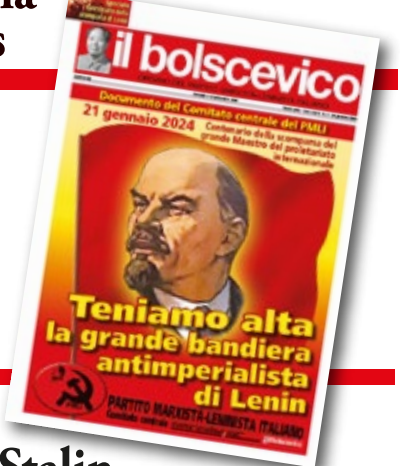
Il Bolscevico n°4_2024 che pubblica l'importante documento del Comitato centrale del PMLI per il 100° Anniversario della morte di Lenin

Anniversario della fondazione de "Il Bolscevico"