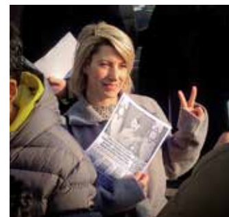
Il volantino del PMLI con la caricatura di Netanyahu come Hitler è stato molto apprezzato. Il volantino riporta come sempre i qr code che rimandano agli articoli de Il Bolscevico sulla Palestina

boleggia la verità la cui bocca era tappata da delle mani con sopra il logo dei più famosi social-network dell'imperialismo occidentale) mentre dei fumogeni simboleggiavano gli incendi dei bombardamenti.