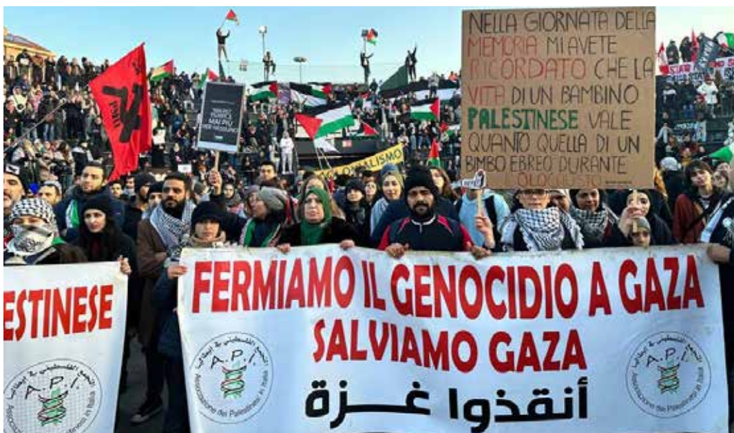
Milano, 28 gennaio 2024. La conclusione della manifestazione all'anfiteatro Martesana. Nell'immagine sotto spicca il cartello che equipara i bambini uccisi durante l'olocausto dai nazisti con quelli uccisi a Gaza dai sionisti

dell'imperialismo assassino". Su un altro era scritto: "Nel Giorno della Memoria mi avete ricordato che la vita di un bambino palestinese vale quanto quella di un bambino ebreo durante l'Olocausto". In coda è stata srotolata invece un'enorme bandiera della Palestina e uno striscione nero che chiede il "cessate il fuoco ora".