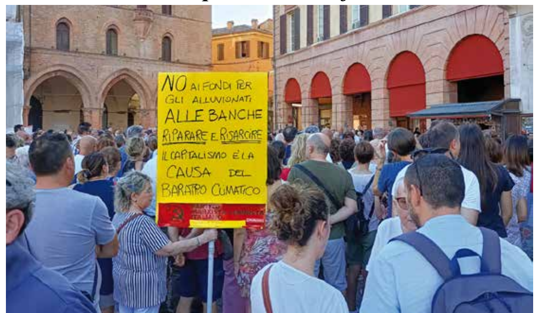
Forlì, 2 agosto 2023. Manifestazione di protesta degli alluvionati indetta dai comitati delle vittime del fango nella centrale piazza Saffi sotto la sede del Comune. Al centro spicca il cartello del PMLI Emilia Romagna

C'è inoltre da condannare duramente la gravissima interferenza del vice ministro fascista delle Infrastrutture e dei Trasporti Galeazzo Bignami