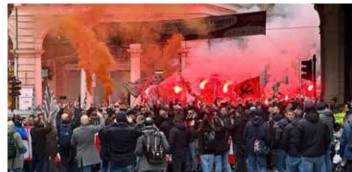
Genova, 16 gennaio 2024. Il PMLI nel corteo di solidarietà con i lavoratori Ansaldo processati

È evidente che la lotta di classe continua inesorabilmente e le contraddizioni di classe si fanno