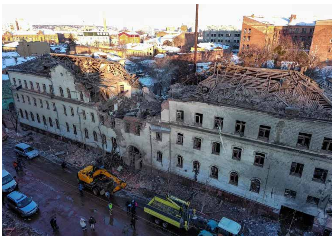
Le abitazioni civili colpite dai missili russi su Kharkiv in questa ultima settimana dal 17 al 24 gennaio 2024, ed è su questo importante centro industriale nonché la seconda città dell'Ucraina che si stanno concentrando gli attacchi russi

Intanto la situazione al fronte in Ucraina resta attualmente difficile a causa della mancanza di forniture di munizioni. Lo ha affermato il 24 gennaio il ministro degli Esteri di Kiev,