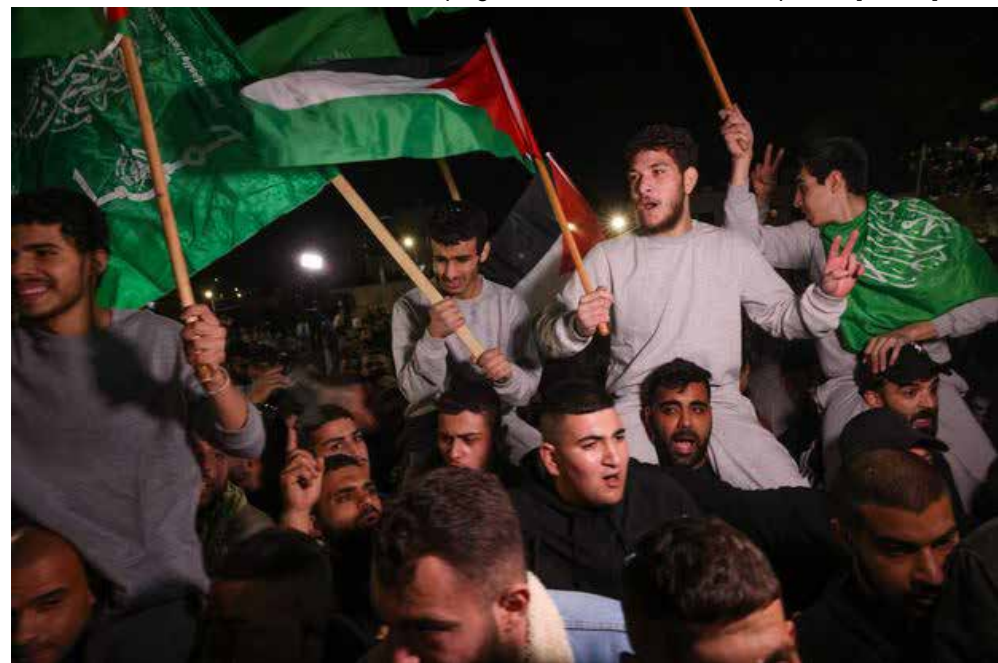
Una manifestazione palestinese a sostegno di Hamas

ha ribadito che, per gettare le basi per un incontro congiunto e un programma nazionale congiunto con le altre fazioni palestinesi, accetta uno Stato ai confini del 1967 con Gerusalemme come capitale, con completa indipendenza e con il diritto del ritorno senza riconoscere la legittimità dell'entità sionista. Ha sottolineato che questa posizione "viene a facilitare il consenso palestinese e arabo in questa fase, ma senza rinunciare a nessuna parte dei nostri diritti o della nostra terra e senza riconoscere l'entità usurpatrice [Israele]".