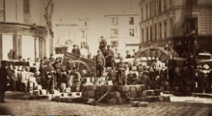
Una barricata dei comunardi contro le truppe di Versailles