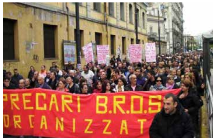
Napoli. Manifestazione dei precari ex Bros