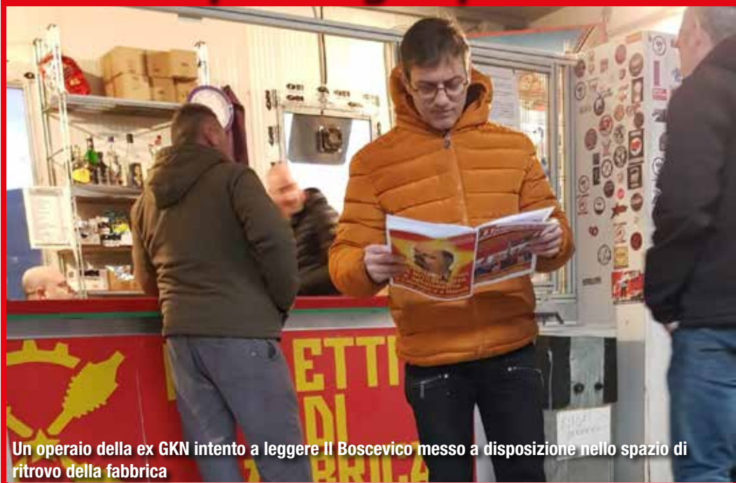
Un operaio della ex GKN intento a leggere Il Bolscevico messo a disposizione nello spazio di ritrovo della fabbrica