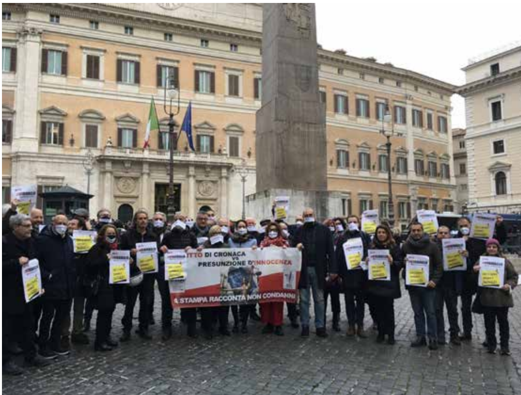
Roma, 28 dicembre 2023. Uno dei presidi di protesta contro la legge bavaglio sulla libertà di stampa. Qui siamo davanti al Parlamento, a Montecitorio. Gli altri sono stati organizzati davanti Palazzo Chigi (sede del governo) e davanti a Palazzo Madama dove ha sede il Senato

La Costituzione democratico-borghese del 1948 ovviamente non c'entra un fico secco, come il "garantismo", che non viene mai considerato quando si tratta di reprimere le masse in lotta per i loro diritti, peraltro essa prevede la messa fuorilegge dei partiti e dei gruppi neofascisti. Ma il punto è che la Costituzione borghese del '48, frutto di un compromesso tra il proletariato e la borghesia, sfavorevole al primo e favorevole alla seconda, è ormai palesemente, di fatto e di diritto morta e se-