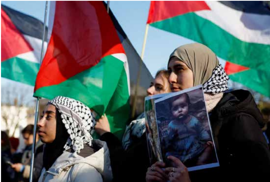
Gennaio 2024. I presidi di protesta a l'Aia per il processo ad Israele

Il nazionista Benjamin Netanyahu aveva invece dichiarato che avrebbe continuato la guerra di occupazione e il genocidio dei palestinesi "e nessuno ci fermerà, né l'Aja né l'asse del male", sostenuto dai complici imperialisti Usa e Gran Bretagna. D'altra parte il regime sionista di Tel Aviv ha già arrogantemente ignorato la condanna della Corte dell'Onu nel 2004 per la costruzione illegale del muro nella Cisgiordania occupata, così come delle risoluzioni Onu contro l'occupazione della Cisgiordania e Gerusalemme Est. E dopo la decisione di dare il via al processo i nazionisti attaccavano il principale organo giudiziario delle Nazioni Unite col ministro della sicurezza nazionale Itamar