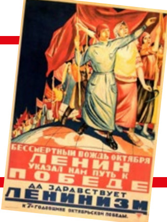
Il leader immortale di Ottobre LENIN ci ha mostrato la strada verso la vittoria VIVA IL LENINISMO!