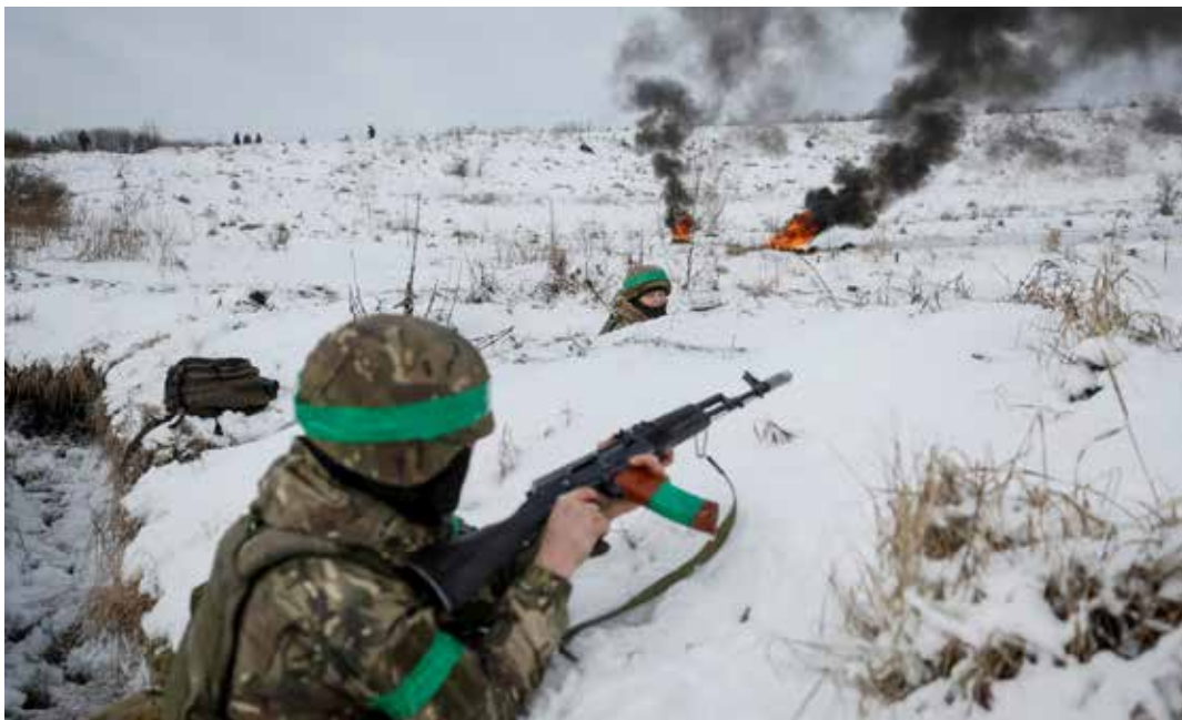
Truppe ucraine impegnate in azioni antisabotaggio nella regione di Sumy al confine con la Russia

Dmytro Kuleba, in un'intervista al quotidiano tedesco Bild. Secondo il capo della diplomazia ucraina, "la situazione è molto grave, forse ancora più grave di quanto lo fosse all'inizio dell'invasione russa, quasi due anni fa". Il ministro degli Esteri ha anche aggiunto che il massiccio attacco missilistico russo di ieri dimostra che l'Ucraina ha bisogno di più sistemi di difesa aerea e missilistici. "Anche se l'Ucraina ha aumentato significativamente la sua produzione e continuerà a farlo, vediamo che ancora l'industria della difesa occidentale non è in grado di produrre una quantità sufficiente di munizioni", ha affermato Kuleba.