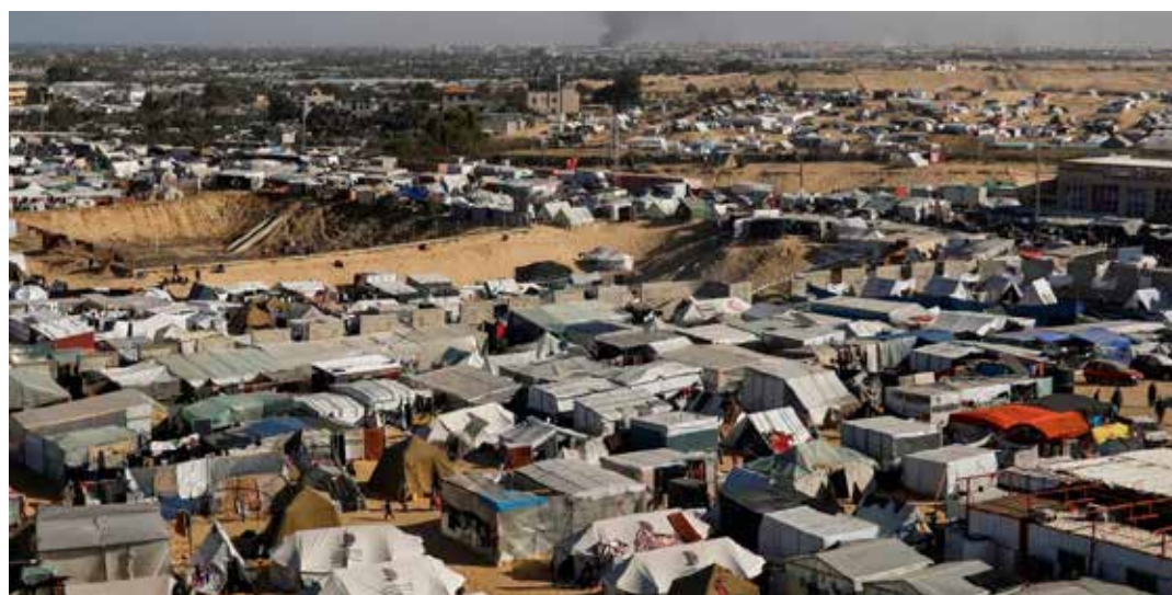
22 gennaio 2024. I campi profughi a Gaza presso Khan Yunis

Dal polverone propagandistico per occultare l'accusa di genocidio sollevato dai nazisionisti non si salvava neanche l'Oms accusata nella riunione del Consiglio esecutivo a Ginevra del 25 gennaio di essere collusa con Hamas, di chiudere gli occhi sulla sofferenza degli ostaggi tenuti a Gaza e non reggere il sacco alla oramai logora e non provata tesi che la resistenza palestinese usa gli ospedali della Striscia di Gaza "per fini terroristici". Accuse respinte dal responsabile dell'Oms. In ogni caso ricordiamo che attaccare le strutture ospedaliere, sparare su chi esce dall'ospedale a Khan Yunis come a Gaza city da parte dei soldati occupanti rappresenta un crimine di guerra a prescindere.