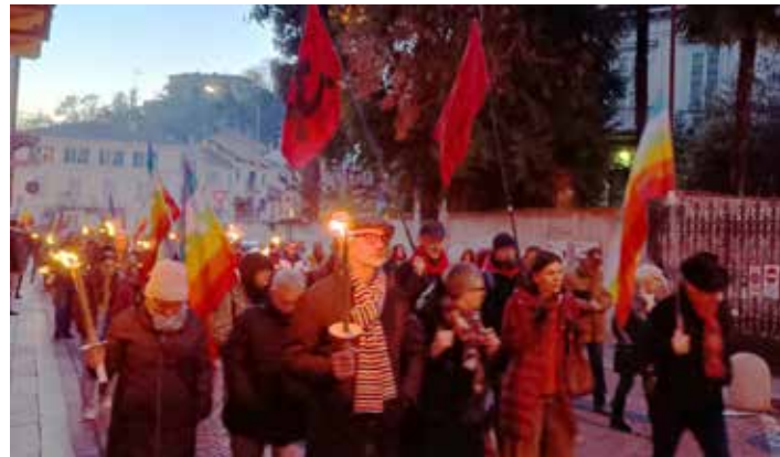
Biella, 27 gennaio 2024. Il corteo per la Giornata della memoria. A destra la partecipazione del PMLI

Per gli organizzatori ricordare il Giorno della Memoria costituisce un imperativo civico e mora-