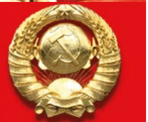
(Unione delle Repubbliche Socialiste Sovietiche)