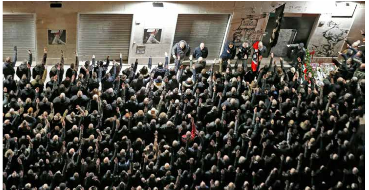
Roma, 7 gennaio 2024. Una veduta parziale della stesa di saluti fascisti alla commemorazione di Acca Larentia

Dunque i fascisti in doppio petto continuano spediti nella loro infame politica di lacrime, sangue, repressione e anticomunismo, anche quando sono