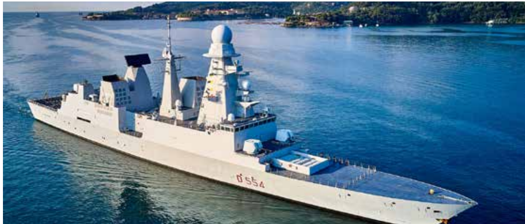
Il cacciatorpediniere Caio Duilio è la prima nave italiana partita per il Mar Rosso. E' dotata di tutta l'elettronica per tenere sotto controllo la zona e assolvere all'incarico di comando tattico nella Missione Aspides della UE

Se l'Italia entrasse in guerra, chiameremo il nostro popolo a unirsi come un sol corpo e a insorgere, denunciando e smascherando l'imperialismo, partecipando attivamente ai movimenti di massa contro la guerra imperialista, chiedendo al governo italiano il ritiro di tutte le forze militari ancora impegnate nelle missioni imperialiste in tutto il mondo, fino a chiamare il proletariato e tutto il popolo italiano alla guerra civile contro la guerra imperialista. Per adesso la misura più urgente è quella di abbattere il governo neofascista Meloni assieme a tutti i suoi ministri per stroncare sul nascere la sua politica guerrafondaia e le nuove mire dell'imperialismo italiano di cui le masse popolari sarebbero le prime vittime mentre non avrebbero altro da guadagnare che miseria, luttu, sangue e barbarie senza fine.