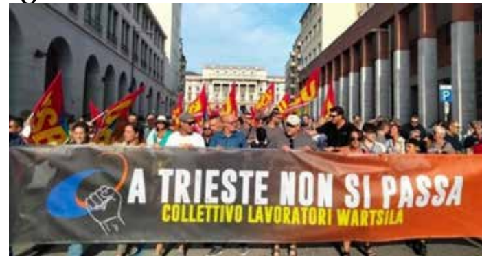
Trieste. Una manifestazione di protesta dei lavoratori Wärtsilä

Un risultato, seppur parziale, dovuto in gran parte alla lotta tenace dei lavoratori che hanno presidiato i cancelli dell'azienda, hanno organizzato decine di presidi, manifestazioni e cortei. Una mobilitazione che ha coinvolto tutte le realtà triestine, a partire dai portuali, e costretto le istituzioni locali e il governo nazionale a prendere l'iniziativa per scongiurare i 450 licenziamenti annunciati dalla multinazionale finlandese a luglio 2022. Questo non risolve assolutamente la vertenza perché da Helsinki hanno confermato l'intenzione di chiudere il