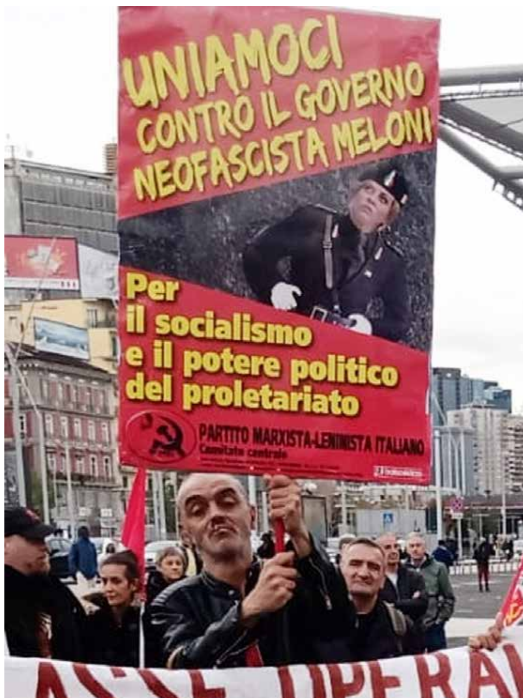
Napoli, 5 novembre 2022. Manifestazione per il lavoro, contro la disoccupazione e il carovita

E siccome l'appetito vien mangiando, come prossima mossa in attesa della separazione delle carriere dei magistrati, che però richiede una modifica costituzionale e quindi più tempo, adesso il governo si appresta a realizzare quello che era un vecchio desiderio di Berlusconi, mutuato dal Piano di rinascita democratica della P2 di Licio Gelli: i test attitudinali per i magistrati, già proposti l'anno scorso dal sottosegretario e consulente giuridico della Meloni, Alfredo mantovano.