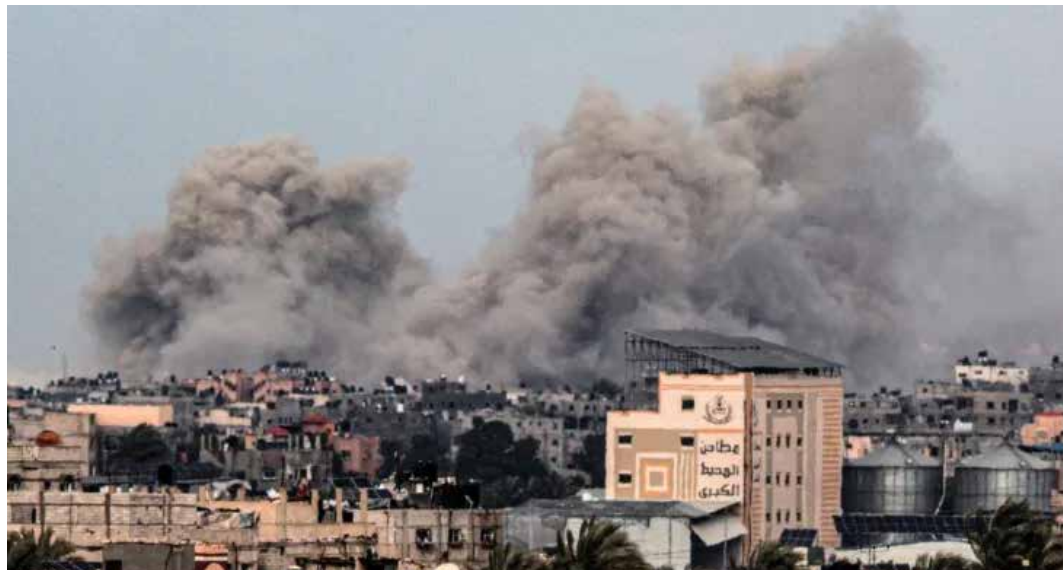
5 febbraio 2024. Gaza ancora sotto attacco dei nazisionisti

La cronaca del genocidio palestinese riporta il 5 febbraio una denuncia dell'agenzia umanitaria delle Nazioni Unite, Ocha, su almeno una ventina i palestinesi uccisi nel fine settimana precedente negli attacchi israeliani su Rafah, in un'area di Gaza dove centinaia di migliaia di palestinesi erano fuggiti perché indicata dall'esercito israeliano come zona sicura. Un comportamento di ordinaria normalità dei criminali sionisti concentrati a colpire, scuole, chiese e ospedali, sedi di associazioni umanitarie; l'ultimo episodio è del 2 febbraio quando hanno bombardato e distrutto l'edificio che ospitava l'Agenzia belga per la cooperazione allo sviluppo a Gaza; notiamo che il Belgio è tra i tanti paesi che non hanno sospeso i finanziamenti all'Unrwa come chiesto dal boia Netanyahu. La distruzione di strade e infrastrutture, financo di cimiteri e di zone coltivate, di oltre a più della metà delle abitazioni e gli attacchi in tutte le zone rifugio dove hanno co-