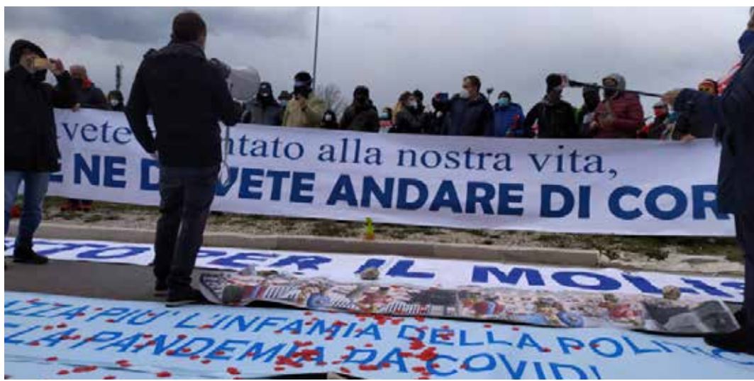
Campobasso. Una delle tante manifestazioni per la difesa della sanità pubblica e contro la gestione dell'emergenza Covid

Forse la colpa è stata, a ben vedere, delle stesse vittime che hanno osato recarsi negli ospedali? Cosa aspettarsi se si è arrivati a scrivere che vanno pure riconosciuti i