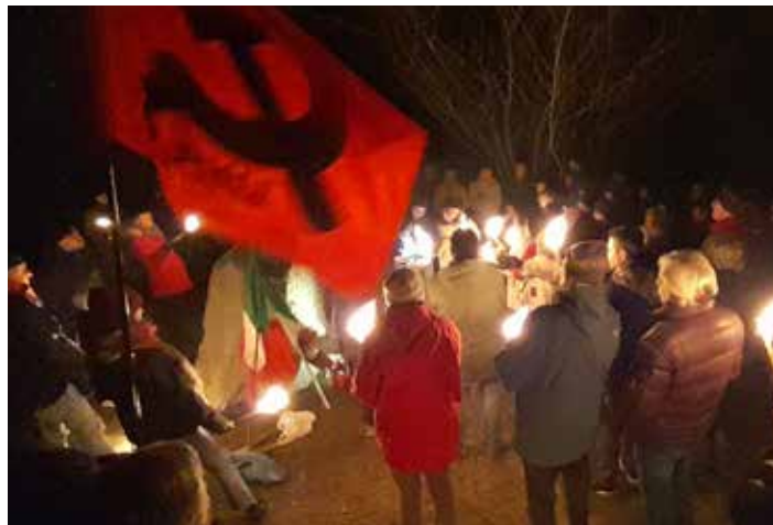
Lace di Donato (Biella), 29 gennaio 2024. Il sentito ricordo della 76a Brigata e della VII Divisione Garibaldi, si nota la partecipazione del PMLI

Il commissario politico Luigi Gallo, conosciuto come Battisti, fu torturato e umiliato dai nazi-