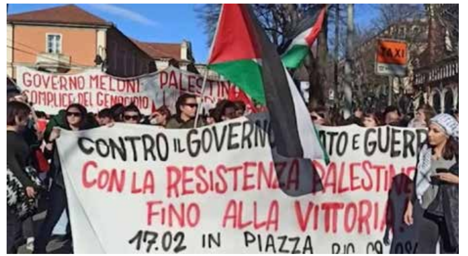
Torino, 3 febbraio 2024. Combattiva manifestazione per la Palestina. Tra gli striscioni uno contro il governo Meloni per l'accordo con Netanyahu

stretto i civili palestinesi a spostarsi, indicano che i nazisionisti puntano rendere Gaza inabitabile, a spingere i palestinesi a andarsene "volontariamente", in una azione di criminale pulizia etnica che viaggia in parallelo alla costante riduzione di terre coltivabili e zone di civile abitazione in Cisgiordania.