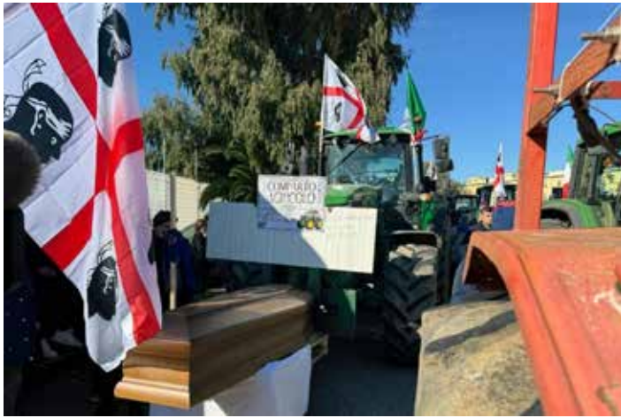
Alcune immagini di questi giorni delle lotte degli agricoltori