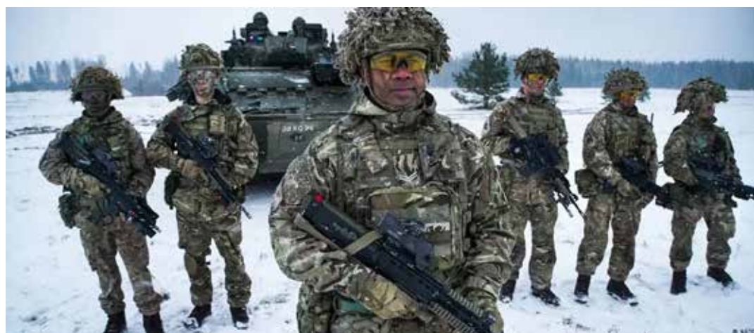
Soldati inglesi impegnati in una recente esercitazione in Estonia

Parole impensabili fino a due anni fa, quelle del capo militare dello staff generale di Sua Maestà. Ma che oggi riflettono pienamente il pericolo di una guerra mondiale imperialista. Del resto come aveva