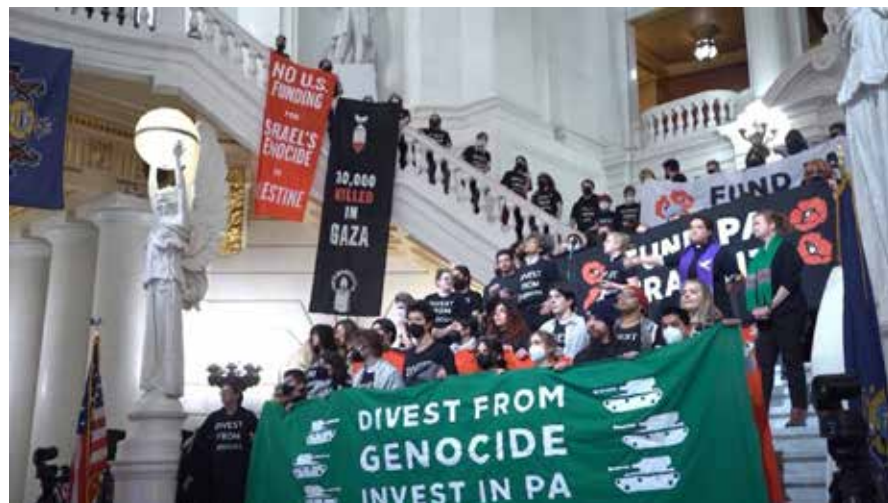
Pennsylvania (USA). Più di cento attivisti ebrei contro il genocidio a Gaza sono stati arrestati dalla polizia durante una manifestazione svoltasi il 6 febbraio 2024

do Crosetto alla Stampa. Magari bombardando le basi a terra. In attesa di sapere quali saranno le cosiddette regole di ingaggio definite per l'operazione Aspides, che alla segretaria pd Elly Schlein basta siano ufficialmente difensive e poi via libero nel Mar Rosso, registriamo che il governo della neofascista Meloni intanto porta il tricolore imperialista a sventolare in zona di guerra, a prepararsi a partecipare a questa guerra mentre dovrebbe ritirare immediatamente le navi e puntare quantomeno agli obiettivi degli alleati Arabia Saudita e Kuwait. Altrimenti, come è evidente, l'Italia se non è neutrale "diventerà un bersaglio se parteciperà all'aggressione contro lo Yemen", dichiarava in una intervista a Repubblica del 5 febbraio il dirigente yemenita Mohamed Ali al-Houthi. Che ripeteva come non c'è alcun blocco nel Mar Rosso ma sono sotto mira le navi associate ad Israele, che si dirigono verso porti occupati, di proprietà di israeliani, o entrano nel porto di Eilat. Le altre non avranno danni, ripeteva l'esponente yemenita che accusava i paesi occidentali di demonizzare deliberatamente il governo di Sana'a, di definire scorrettamente gli Houthi come terroristi e di diffondere attraverso i media notizie false. E che la soluzione