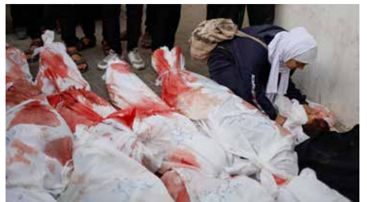
Rafah, sud Gaza, 12 febbraio 2024. I corpi di numerosi bambini uccisi nell'ultimo attacco dei nazionisti israeliani contro i civili raccolti nella zona