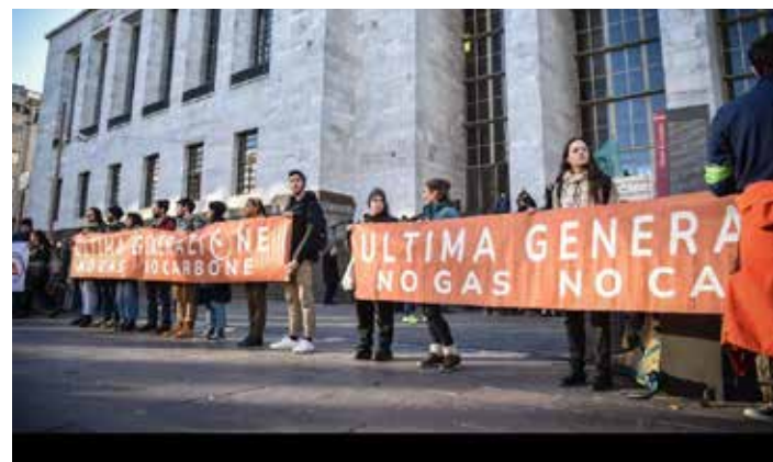
10 gennaio 2023. Il presidio di protesta e solidarietà di "Ultima generazione" all'esterno del tribunale di Milano durante il processo ad alcuni attivisti

Ne è testimonianza il fattore comune dei tanti provvedimenti già varati dal governo Meloni, rappresentato da quella chiara ideologia che mira alla costruzione di un modello "autoritario" e repressivo, come lo definiscono alcuni giornali, ma che noi definiremo senza mezzi termini "fascista", nell'affrontare ogni disagio sociale (come accaduto ad esempio col vergognoso decreto cosiddetto "Caivano"), e le proteste di studenti, operai o attivisti ambientali che siano.