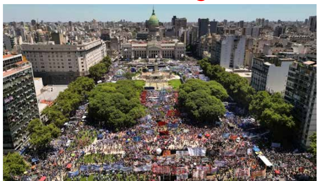
Buenos Aires, 24 gennaio 2024. La grande mobilitazione e manifestazione nazionale davanti alla sede del Congresso contro il pacchetto di riforme economiche e sul lavoro proposte dal presidente argentino Milei

La risposta dei lavoratori e pensionati è scattata il 25 gennaio con un partecipato sciopero generale che ha visto mezzo milione di persone manifestare a Buenos Aires e un altro milione nel resto del paese al seguito della mobilitazione indetta dalla Confederazione Generale del Lavoro (CGT), il più grande sindacato del paese, che al momento hanno chiamato in piazza i lavoratori della salute, dei trasporti, del settore bancario e delle costruzioni. La protesta è continuata nei giorni successivi con un presidio e scontri con la polizia davanti la sede del parlamento che ha iniziato la discussione della legge.