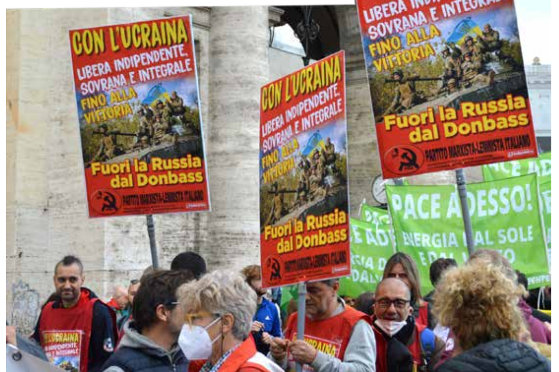
Roma, 5 novembre 2022. Manifestazione nazionale per la pace. Il PMLI sostiene con decisione la lotta di resistenza del popolo ucraino contro l'aggressione russa

Occorre fare attenzione a non indebolire, criticandolo, chi ha subito l'aggressione. In tal modo, oggettivamente si fa il gioco di Putin. Noi marxisti-leninisti, per principio, se riteniamo che una causa è giusta, l'appoggiamo, anche se è sostenuta da altre forze lontane e nemiche; quello che conta è la motivazione di ogni sostenitore. La lotta armata dell'Ucraina per difendere la propria libertà, indipen-