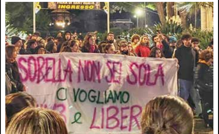
Catania, villa Bellini, 5 febbraio 2024. Un momento della manifestazione di protesta e di solidarietà contro lo stupro subito da una tredicenne

Così nel progetto di direttiva, mancando l'unanimità sulla definizione di stupro, esso non figura tra i reati contro la donna riconosciuti dalla Ue: a votare a favore della sua esclusione sono stati Paesi come la Francia, la Germania, l'Austria, la Svezia e i Paesi Bassi che si sono trincerati dietro ragioni tecniche e giuridiche sulle modalità di adozione della proposta,