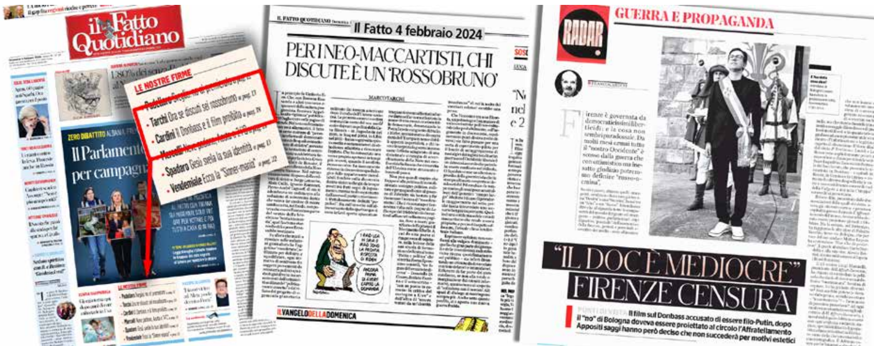
Il Fatto quotidiano del 4 febbraio 2024 dà risalto in prima pagine alla presenza di autori di matrice fascista tra le sue firme. Accanto gli articoli trattati da Marco Tarchi e Franco Cardini

Due punti di partenza diversi ma che mirano a un unico obiettivo: portare acqua al mulino di Putin. In primo luogo giustificando in qualche modo l'invasione russa come una conseguenza della politica ostile della Nato, del riarmo dell'Ucraina e del suo rifiuto di trattare sull'autonomia