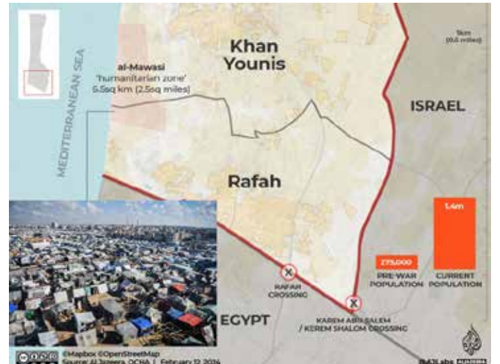
Una cartina della zona di Rafah aggiornata al 12 febbraio 2024. Prima della guerra ospitava 275.000 abitanti mentre ora ne ospita 1 milione e 400.000, raccolti in sterminate tendopoli stretti tra il mare e il confine egiziano che è chiuso al passaggio e i criminali bombardamenti israeliani

Chissà se riuscirà a fermare la mano criminale di Netanyahu il procuratore capo della Corte penale internazionale (Cpi), l'avvocato britannico Karim Khan che in una dichiarazione pubblicata su X il 12 febbraio si è detto "profondamente preoccupato per il bombardamento segnalato e la potenziale incursione di terra da parte delle forze israeliane a Rafah", avvertendo che chiunque violi il diritto internazionale sarà ritenuto responsabile.