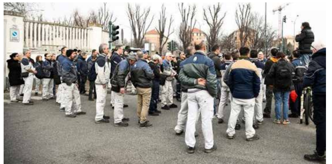
Torino, Mirafiori. Un'immagine delle proteste di lavoratrici e lavoratori della Fiat e dei primi scioperi di protesta, davanti agli ingressi della fabbrica, contro la cassa integrazione di due mesi varata per 2.260 di loro

senza alcun riconoscimento al nostro Paese. Al momento della fusione vi erano in carica 55mila addetti, ora non supera i 35mila, il Centro di ricerca e sviluppo non ha sostanzialmente missioni, esiste un peggioramento delle condizioni di lavoro e i salari sono inadeguati. Mentre i dividendi degli azionisti e dell'amministratore delegato sono pazzeschi".