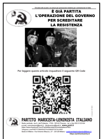
Milano, 10 febbraio 2024. Il volantino realizzato contro la "giornata del ricordo" affisso nel quartiere di Cimiano, sotto: Il volantino con in evidenza il QR che rimanda all'articolo sul sito nazionale del PMLI e il particolare del fotomontaggio con Meloni e Valditara in divisa fascista

Inoltre nel manifestino, sopra il QR code, è riportato un fotomontaggio che ritrae in orbace la ducessa Meloni e il suo ministro dell'Istruzione e "del Merito", il leghista Valditara, con dietro un manifesto di propaganda neofascista e anticomunista sul "Giorno del ricordo", che sicuramente contribuirà ad attirare l'attenzione degli studenti antifascisti.