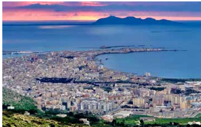
Una veduta della città di Trapani

Nel frattempo, l'ATI Trapani, l'organo di "governo" per la regolazione del servizio idrico