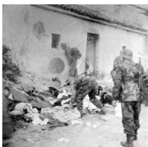
Non si può rendere in poche immagini i crimini nazifascisti in territorio jugoslavo. Una per tutte l'eccidio di Lipa di Elsane. Si tratta di una strage nazifascista avvenuta il 30 aprile 1944 nel villaggio di Lipa all'epoca nel comune italiano di Elsane, in provincia di Fiume (oggi Rijeka in Croazia). Le vittime furono 269 morti (quasi tutti anziani, donne e bambini)

D'altra parte è un fatto che tutte queste operazioni che si sono susseguite negli anni con una accelerazione impressionante nell'ultimo ventennio hanno avuto il benplacito, quando non il vero e proprio consenso unanime, dei partiti della sinistra istituzionale. L'istituzione stessa nel 2004 del Giorno del Ricordo, la risoluzione anticomunista del parlamento europeo del 2019, e ancora la programmazione del film revisionista Rosso Istria, le Linee Guida del Ministe-