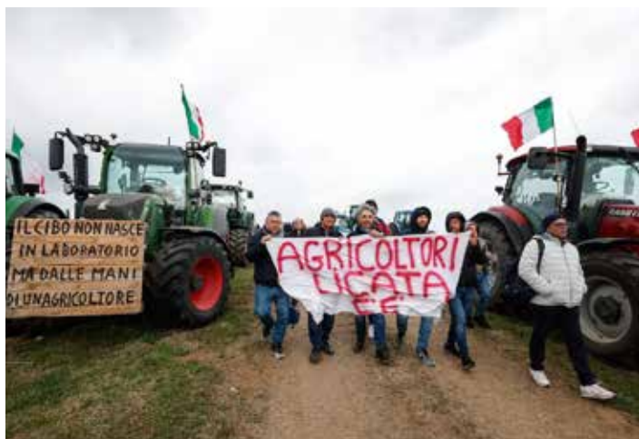
Alcune immagini della mobilitazione in tutta Italia degli agricoltori

Pur cercando l'accordo con una parte del movimento