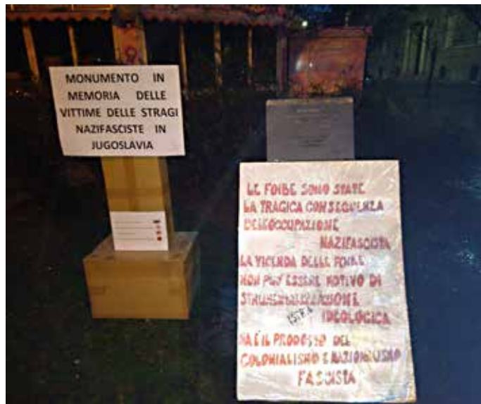
Il monumento mobile e la lapide alle vittime delle stragi nazifasciste in Jugoslavia di cui si parla comunicato

Oggi, forse come non mai in passato, ce n'è un grande bisogno. Si vogliono far passare come "martiri" alcune centina-