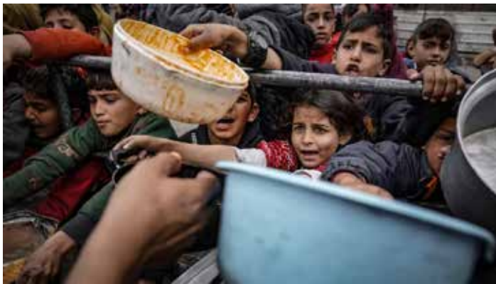
Una immagine dell'emergenza alimentare nei campi dove sono raccolti i profughi provenienti dal nord

Magari è Israele, che "ha violato 400 risoluzioni e dichiarazioni di tutte le organizzazioni internazionali", che deve essere "espulso dalle Nazioni Unite per il massacro che sta compiendo in Palestina", come dichiarava il presidente iraniano Raisi nel discorso tenuto in piazza Azadi, nel centro della capitale Teheran, l'11