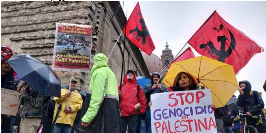
Firenze, 10 febbraio 2024. Manifestazione in appoggio alla lotta del popolo palestinese alla quale ha partecipato il PMLI. Accanto: uno striscione che denuncia il colonialismo del nazionismo è stato aperto alla fortezza dove si è concluso il corteo e un interessante cartello di denuncia non solo il genocidio a Gaza ma anche la politica espansionista di USA, UE e Israele verso il Mar rosso e lo Yemen

Oltre a manifestare per la Palestina, la piazza fiorentina ha inviato anche un messaggio di risposta al revisionismo storico, e di difesa - come si legge nel comunicato stampa di Firenze Antifascista - "delle forze comuniste che rivelarono al mondo l'orrore dei campi di concentramento con la deportazione di sinti, rom, omosessuali, disabili e oppositori politici" e di denuncia sia dei crimini fascisti in Istria rimossi dalla narrazione istituzionale, sia dei "veri e propri falsi storici, da quello della pulizia etnica contro gli italiani fino al mito della foiba di Basovizza eretta addirittura a monumento nazionale".