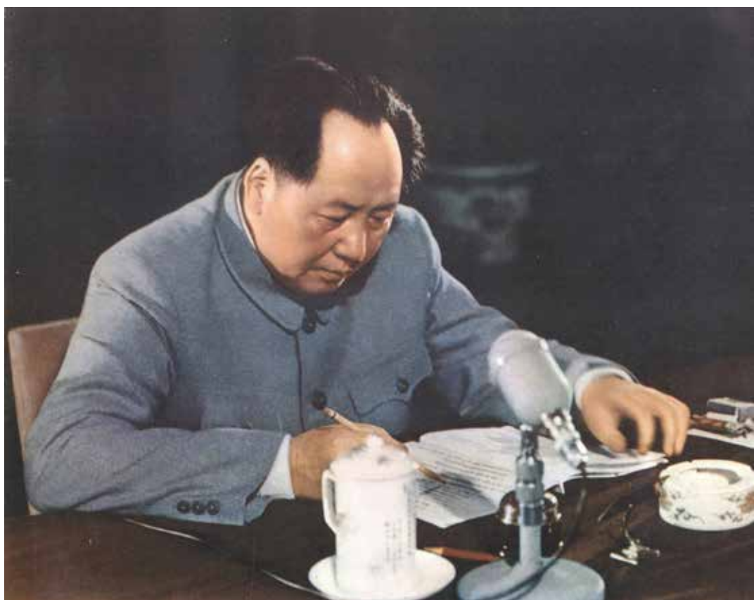
Mao impegnato ad apportare alcune modifiche alla nuova costituzione cinese