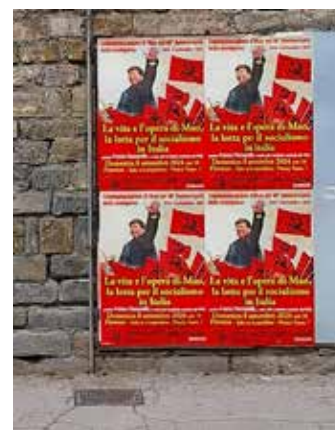
La propaganda della Commemorazione di Mao a Pontassieve (Firenze). Altri manifesti sono stati affissi a Rufina