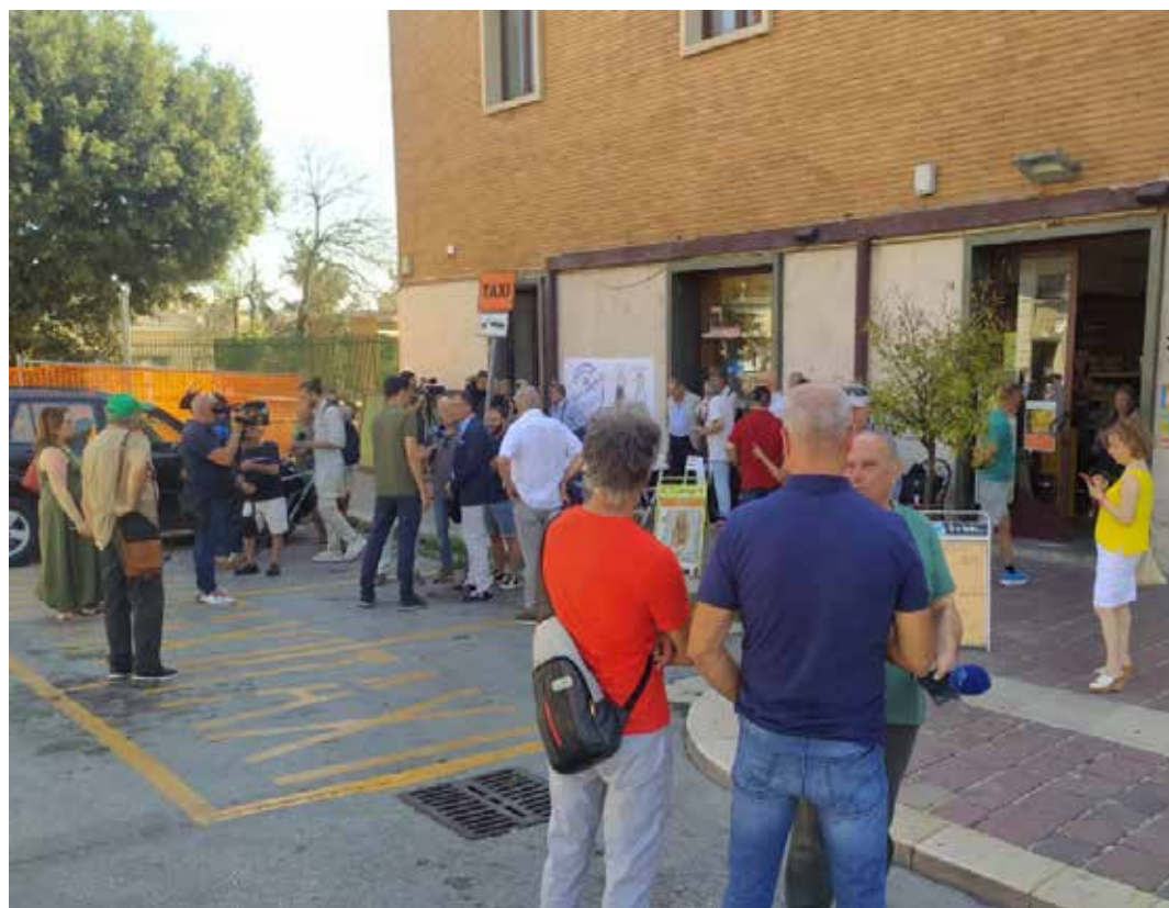
Campobasso, 2 agosto 2024. Un momento della manifestazione "Presidio per non morire" davanti alla stazione ferroviaria per denunciare i tagli e i ritardi sui trasporti e rilanciare il diritto alla mobilità