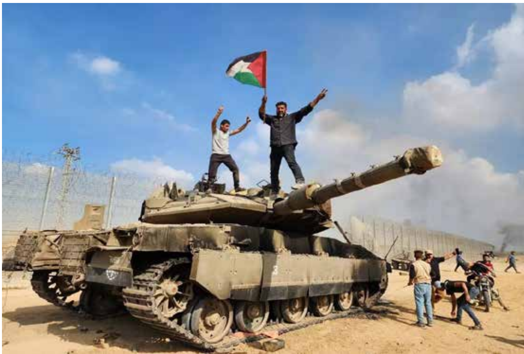
7 ottobre 2023. La bandiera palestinese sventola su di un carro armato catturato all'esercito sionista presso la rete di confine, realizzata da Israele per isolare Gaza, e nella quale hanno aperto un varco

Le organizzazioni palestinesi, di fronte alla guerra di genocidio e all'aggressione criminale sionista che colpisce il nostro popolo, sottolineano lo spirito positivo e costruttivo che ha caratterizzato l'incon-