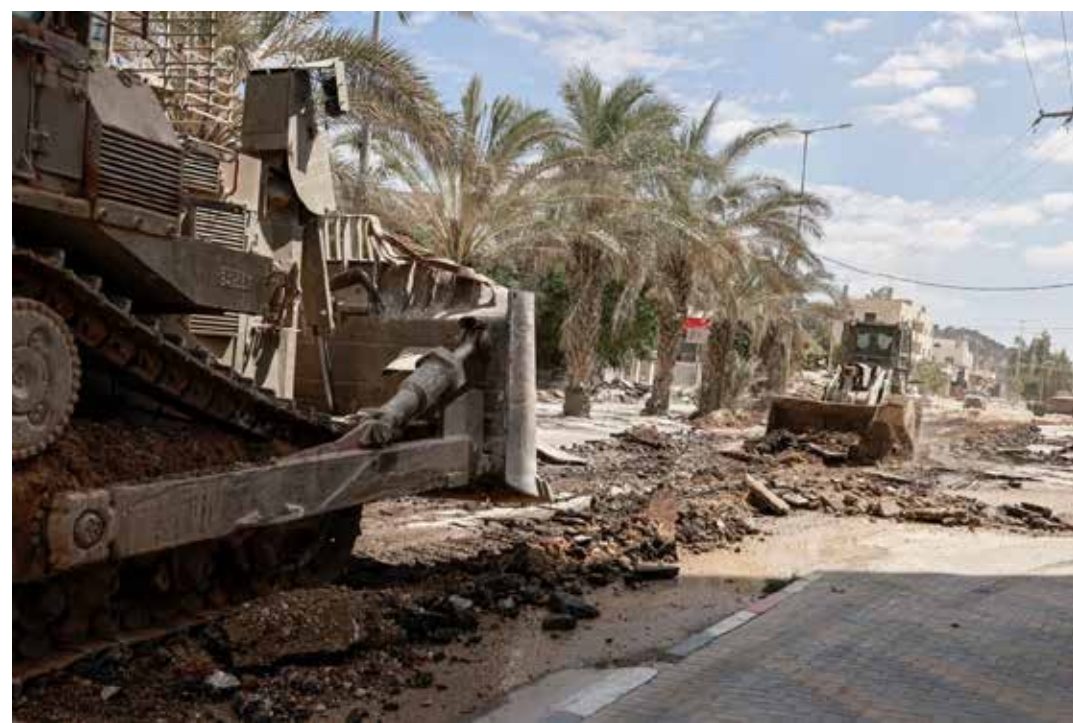
Cisgiordania, 28 agosto 2024. Bulldozer dell'esercito israeliano in azione per distruggere una strada di collegamento durante il raid contro il campo palestinese di NUR Shams

I più recenti pogrom tentati dai coloni sionisti sui villaggi palestinesi erano solo il preludio della più vasta offensiva militare nella Cisgiordania occupata che l'esercito lanciava la mattina del 28 agosto in tutta la parte nord della regione palestinese. Gli attacchi dei droni accompagnavano l'assalto delle truppe di terra sulle città di Jenin, Tulkarem e Tubas e si registravano subito una decina di vittime palestinesi. I principali bersagli dell'offensiva sionista erano in particolare i campi profughi delle tre città ma l'attacco era diretto anche contro gli ospedali, assediati dai soldati che impedivano l'accesso al personale medico. Ricordiamo che l'attacco agli ospedali è un crimine di guerra che i na-