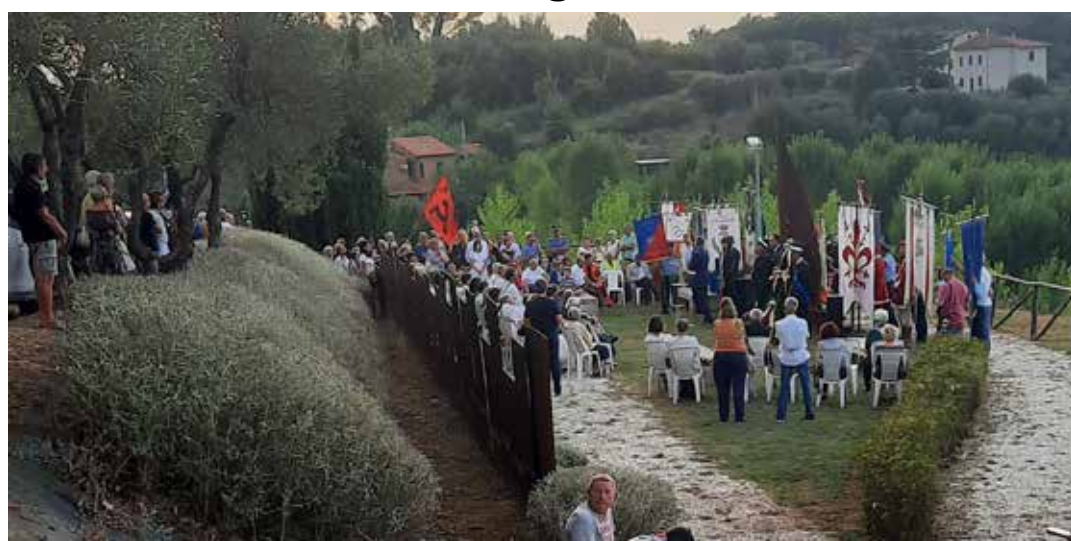
23 agosto 2024. La Commemorazione dell'eccidio del Padule di Fucecchio nell'80° Anniversario della strage nazifascista