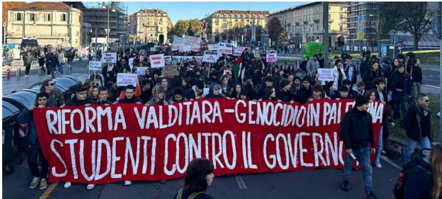
Novembre 2023. Manifestazione studentesca contro la "riforma Valditara" della scuola e il governo neofascista Meloni

Per il completamento dell'iter legislativo saranno necessari altri due decreti attuativi da emanare in collaborazione con altri ministeri e previa intesa in Conferenza unica Stato Regioni. Mentre tutte le disposizioni per l'attuazione