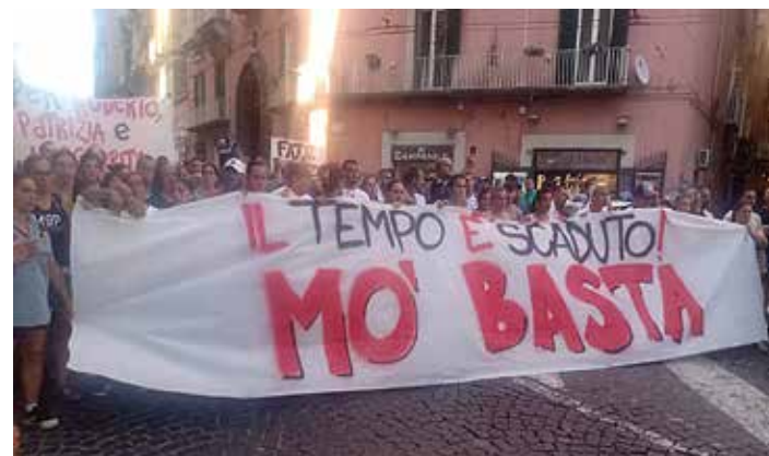
Napoli, 30 luglio 2024. Lo striscione di apertura del corteo per le vittime del crollo a Scampia e contro l'irrisorio "piano-fondi" proposto dalla giunta comunale

Una prima risposta alla strage del 23 luglio le masse popolari di Scampia la davano giovedì 25 con una partecipata fiaccolata che ha attraversato il quartiere. Un corteo compatto che si apriva con lo striscione "il nostro sangue le nostre vite: resistete!" e che veniva spezzato dal grido nell'aria dei manifestanti dei