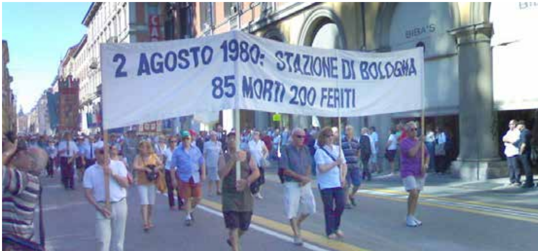
Bologna, 2 agosto 2024. Manifestazione nel 44° della strage di Bologna

Parole che hanno spinto la Meloni ad attaccare Bognesi: "profondamente e personalmente colpita dagli attacchi ingiustificati e fuori misura che sono stati rivolti, in questa giornata di commemorazione, alla sottoscritta e al governo. Sostenere che le 'radici di quell'attentato oggi figurano a pieno titolo nella destra di governo', o che la riforma della giustizia varata da questo governo sia ispirata dai progetti della loggia