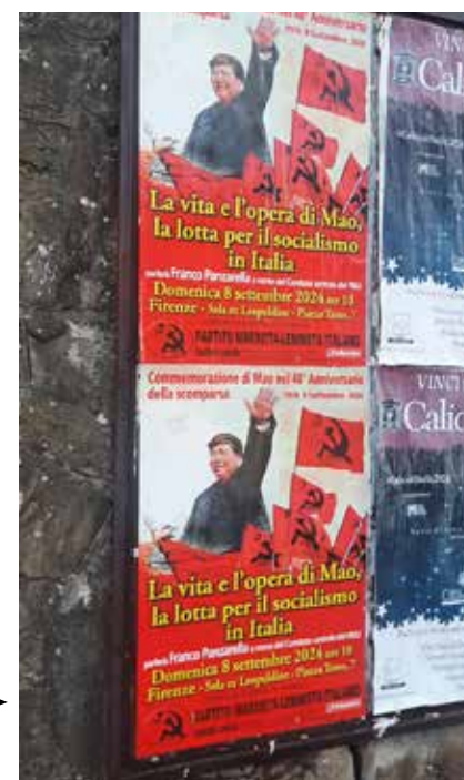
I manifesti affissi a Fucecchio

Ai mercati settimanali di Fucecchio ed Empoli sono stati diffusi i volantini che annunciavano l'iniziativa del PMLI a Firenze per commemorare la scomparsa di Mao Zedong. Una diffusione è stata effettuata davanti il supermercato Coop di Fucecchio. Nella stessa cittadina fanno bella mostra di se anche i bellissimi e colorati manifesti fatti affiggere per l'occasione.