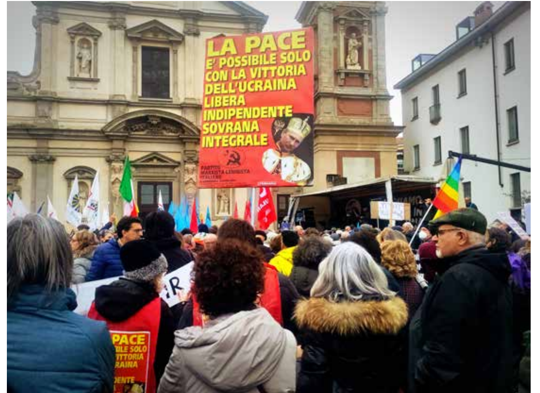
Milano, 24 febbraio 2023, Piazza Santo Stefano. Manifestazione EuropeforPeace

Il 17 agosto Sudzha è la più grande città russa a cadere nelle mani delle forze ucraine dall'inizio della loro incursione oltre confine. Il 19 agosto, in un discorso davanti agli ambasciatori ucraini a Kiev, il presidente ucraino Volodymyr Zelensky ha rivendicato il controllo da parte delle sue truppe di oltre 1.250 km quadrati e 92 località nella regione russa di Kursk. Intanto la Russia ha perso 600.470 soldati dall'inizio dell'aggressione. Lo ha riferito nella stessa giornata lo