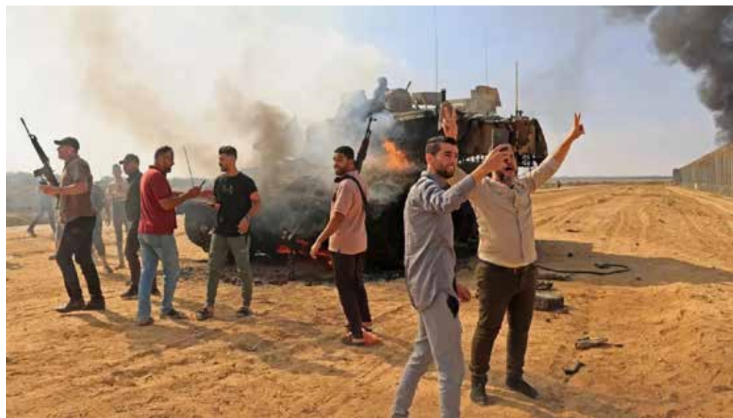
7 ottobre 2023. Combattenti palestinesi esultano per la distruzione di un carro armato israeliano vicino al confine tra con Gaza a Khan Younis

6. Sostenere la resistenza eroica del nostro popolo e la sua coraggiosa resistenza in Palestina per superare le fe-