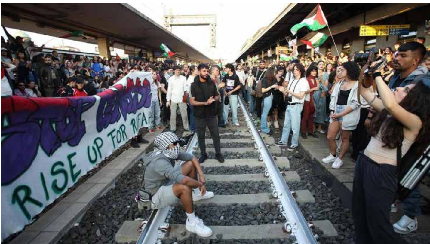
28 maggio 2024. Studentesse e studenti occupano i binari della stazione di Bologna per protestare contro il genocidio nazionista a Gaza contro il popolo palestinese

C'è poi una serie di articoli finalizzati ad aumentare le tutele e l'impunità per gli agenti di polizia giudiziaria, pubblica si-