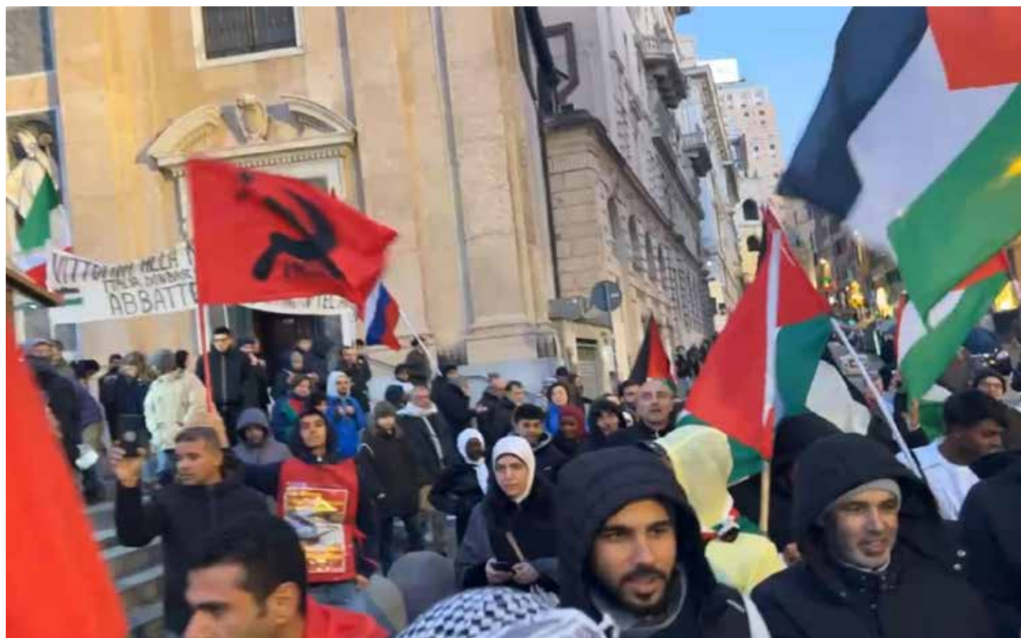
Genova, dicembre 2023. Il PMLI durante la manifestazione a sostegno della lotta della Palestina contro i nazionisti