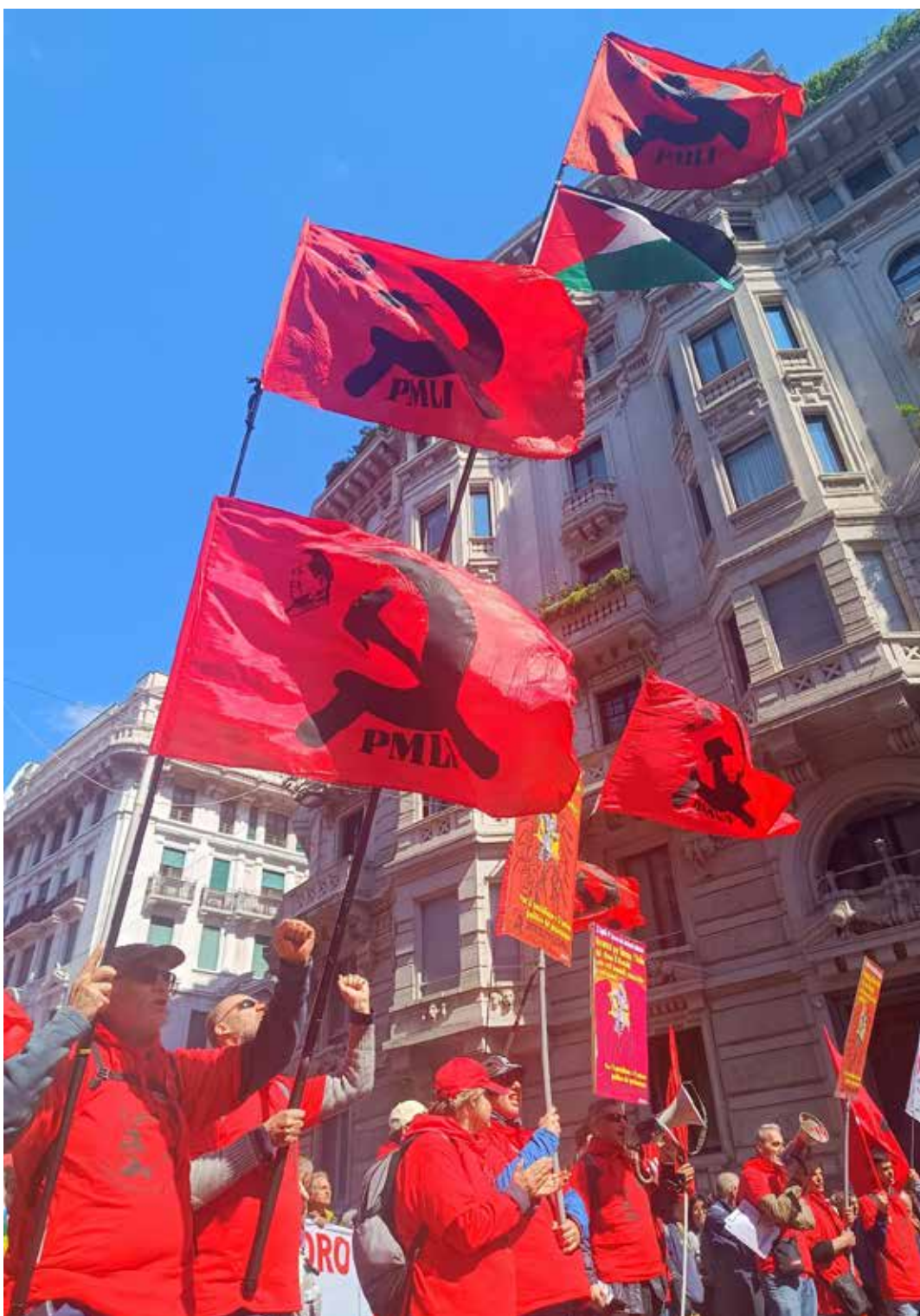
Milano, 25 Aprile 2024. Il PMLI partecipa con una delegazione alla combattiva manifestazione nazionale per il 79° Anniversario della Liberazione dell'Italia dal nazifascismo

In sostanza l'imperialismo dell'Ovest e l'imperialismo dell'Est vanno combattuti entrambi, non essendoci prospettiva politica di liberazione per chi si appoggia ora sull'uno, ora sull'altro.