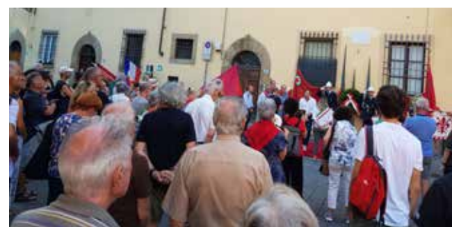
Firenze, 8 agosto 2024. Un momento della Commemorazione promossa dall'ANPI sezione Oltrarno in Piazza Santo Spirito in ricordo dell'80° Anniversario della morte di Aligi Barducci, il comandante partigiano "Potente" colpito a morte da una granata durante i combattimenti per la Liberazione della città dal nazifascismo