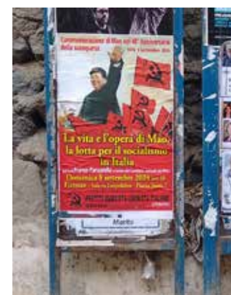
Il manifesto della Commemorazione di Mao affisso ad Ischia (Napoli)