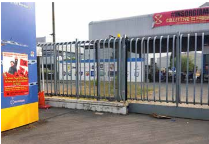
La Commemorazione di Mao è stata propagandata anche all'ingresso della ex GKN in lotta per il posto di lavoro