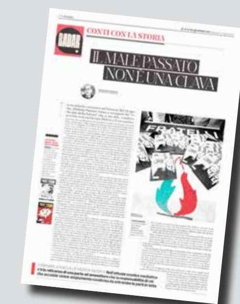
L'intera pagina de "Il Fatto" con l'articolo dell'ideologo della nuova Destra Marco Tarchi titolato: "Il male passato non è una clava"

E per non lasciar dubbi né ambiguità sul riposizionamento del suo quotidiano in area meloniana accanto al Giornale di Sallusti, alla Verità di Belpietro e al Tempo del senatore Fdi Angelucci, mercoledì 28 agosto regalava un'intera pagina del suo quotidiano all'ideologo della cosiddetta Nuova Destra italiana Marco Tarchi per invo-