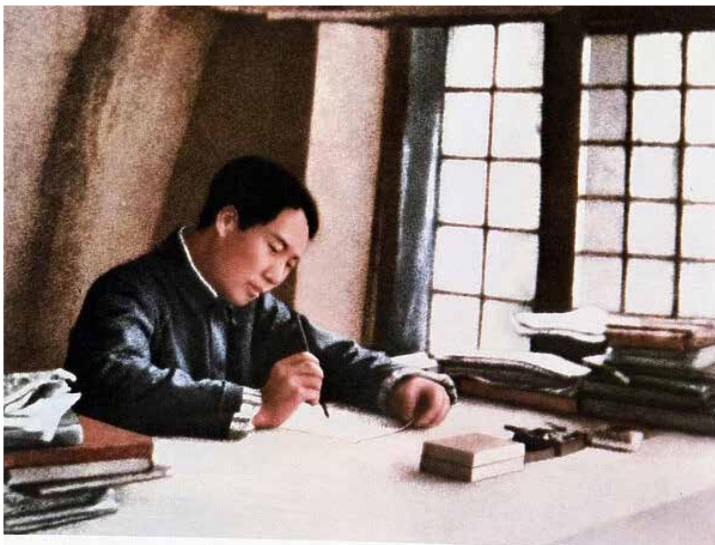
Mao nel 1938 nella sua grotta che fungeva da abitazione nella base rossa di Yanan scrive "Sulla guerra di lunga durata"

Essendo l'idealismo la filosofia della classe dominante questa storicamente ebbe maggior seguito anche in campi diversi dall'ambito strettamente filosofico. Per i materialisti la realtà era oggettiva, era unione di particolare e universale che invece gli idealisti vedevano separati. Inoltre per