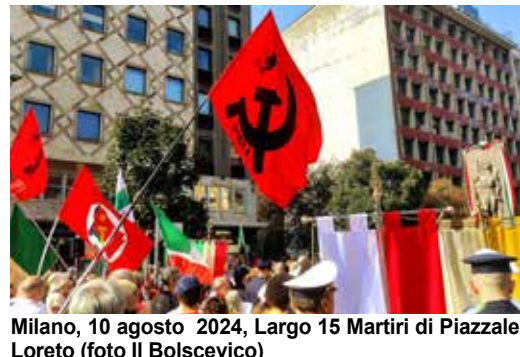
Milano, 10 agosto 2024, Largo 15 Martiri di Piazzale Loreto