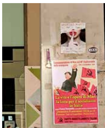
Polo Universitario Novoli