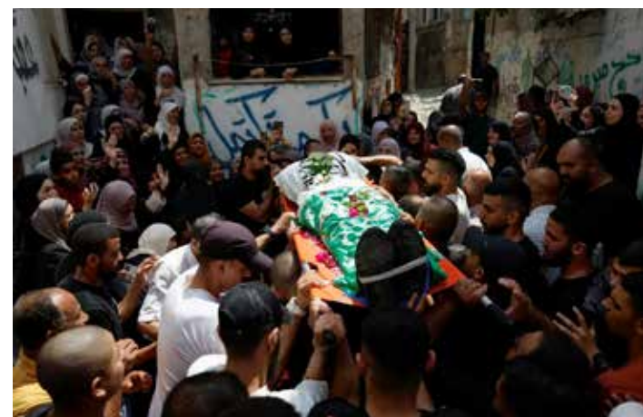
Cisgiordania. I funerali delle vittime dell'attacco sionista a Tulkarem

con i rappresentanti democratici e repubblicani impegnati a fare a gara a chi applaudeva di più, volteggiava su un presunto scontro non di civiltà ma "tra la barbarie e la civilizzazione" e "per far trionfare le forze della civiltà, Stati Uniti e Israele devono restare insieme" contro il cosiddetto "asse del terrore" costituito dall'Iran, contro il quale si può vincere solo restando uniti: "Quando stiamo insieme vinciamo noi e loro perdono, vinceremo noi e sarà una vittoria totale". Da macellaio del popolo palestinese col consenso imperialista, il leader nazionista indossava i panni del difensore della civiltà contro i barbari, in una nuova crociata di cui sarebbe la testa di ariete nella regione per conto dello schieramento dei paesi imperialisti dell'Ovest contro gli alleati dei paesi imperialisti dell'Est. Un discorso bellicista che preparava l'assassinio del 31 luglio leader palestinese Ismail Haniyeh a Teheran, un atto criminale dei nazionisti vergognosamente ignorato dall'Onu, ancora una volta ostaggio dei complici imperialisti Usa e Ue impegnati nei giorni successivi in una campagna contro l'Iran per indurla a non rispondere per non "allargare il conflitto", scambiando da criminali l'agredito per aggressore.