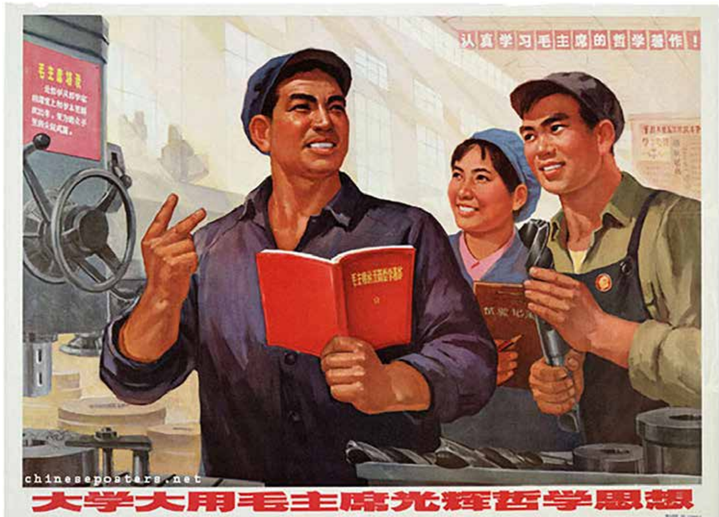
Praticare e studiare il glorioso pensiero filosofico di Mao è la strada giusta" Manifesto cinese pubblicato nel 1971

Era però sempre la forza delle parti in lotta a determinare la vincitrice, quella che conosceva meglio dell'altra le leggi e la teoria giusta, riusciva ad affermarsi e a trasformare la realtà.