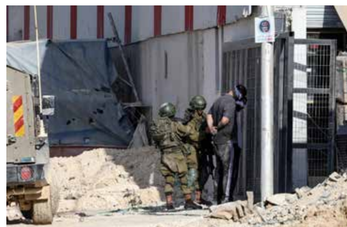
Cisgiordania, 28 agosto 2024. L'esercito nazionista arresta resistenti palestinesi nel raid contro il campo palestinese di NUR Shams vicino Tulkarem

Le tappe dell'escalation nazionista contro il popolo palestinese e i paesi della regione non allineati con i complici imperialisti erano state preannunciate dal criminale premier Netanyahu, in visita negli Stati Uniti, nel discorso del 24 luglio all'assemblea del Congresso americano a Washington. Il leader nazionista definiva quanto accaduto il 7 ottobre 2023, un orrore paragonato a "20 undici settembre in un giorno", in base alle dimensioni della popolazione, che ha trascinato 255 persone "sia vive sia morte" nelle prigioni di Gaza ad opera di Hamas, il gruppo islamico definito "puro male". Con toni messianici che hanno accarezzato il pelo del ben predisposto uditorio,