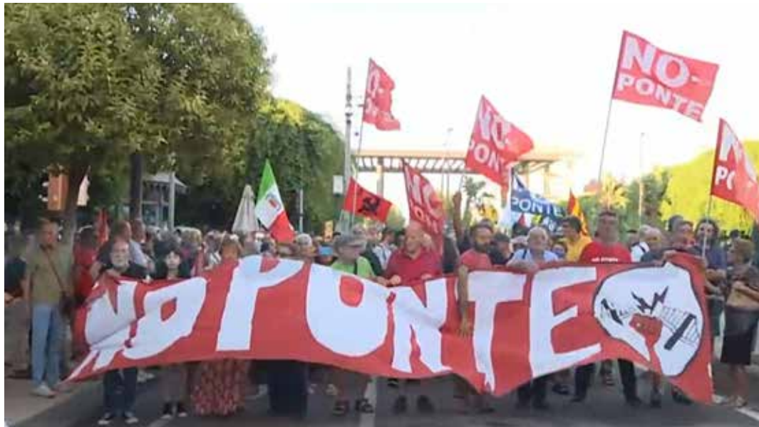
Messina, 10 agosto 2024. Lo striscione di apertura del combattivo corteo contro il ponte sullo stretto. Dietro, al centro, si nota la presenza del PMLI.

Con spirito militante e unitario il PMLI ha partecipato al corteo con la Cellula "Stalin" della provincia di Catania, una presenza storica nella lotta contro il ponte di Messina. I compagni portavano la bandiera rossa del PMLI e il manifesto No ponte. Oltre a de-