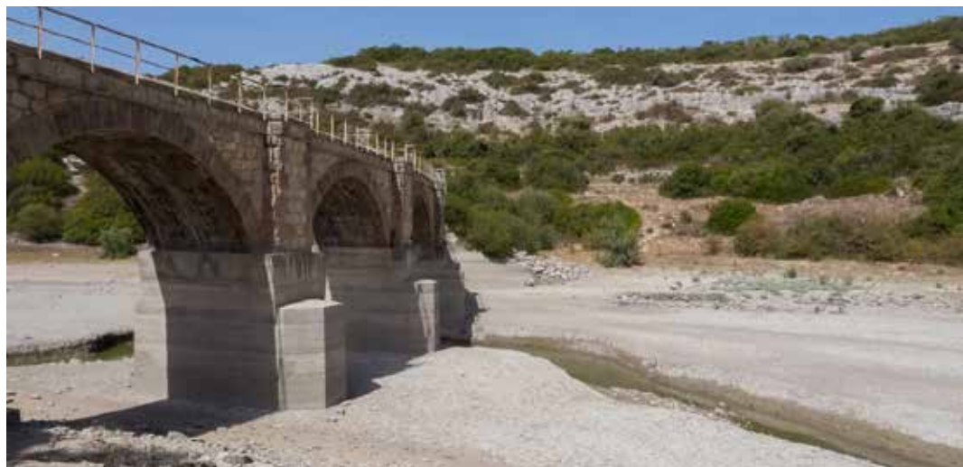
Sardegna. Una immagine recente della siccità

Adesso si torna alla carica per costruire nuovi invasi e nuove dighe. In verità la Sardegna non è carente da questo punto di vista: ve ne sono 33 di grandi/medie dimensioni, costruiti quasi tutti a fine '800, inizio '900 e nel dopoguerra. Il problema sono la dispersione e la mancanza di comunicabilità tra di loro, tanto che in regione vi sono territori dove non ci sono proble-