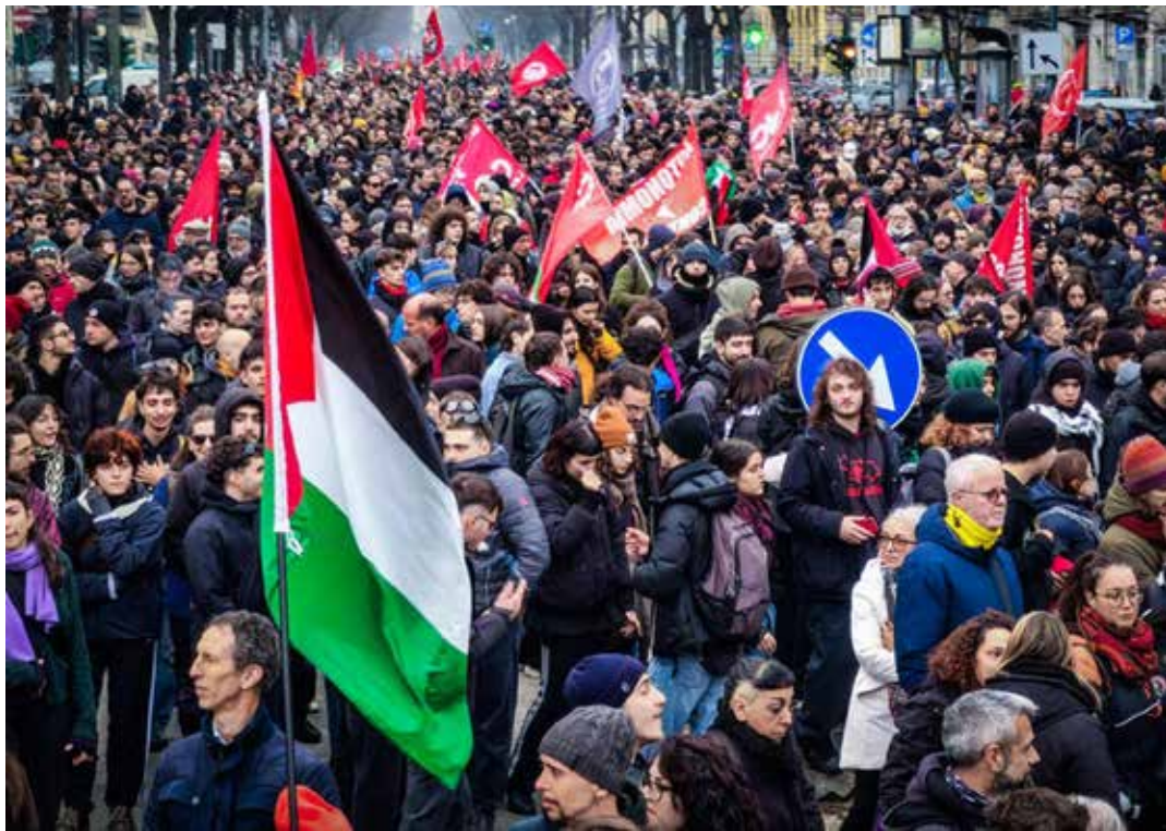
Torino, 20 dicembre 2025. Un aspetto della partecipata e combattiva manifestazione in difesa di Askatasuna