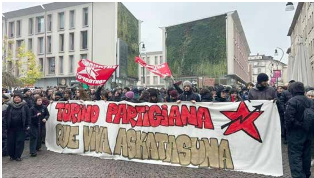
Torino, 20 dicembre 2025. Manifestazione nazionale contro lo sgombero del Centro sociale Askatasuna