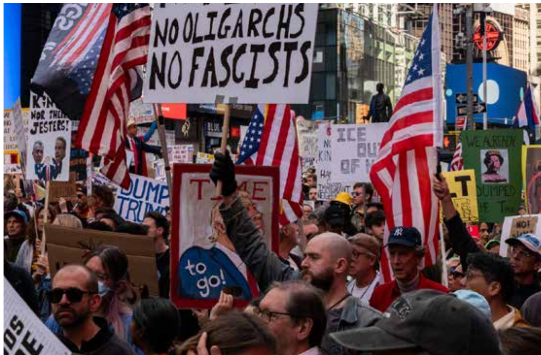
New York, 18 ottobre 2025. Grande manifestazione contro Trump

un'intervista a La7: "Io non parlerei di un'incrinarsi dei rapporti tra Stati Uniti ed Europa. Io penso che quello che c'è scritto in questo documento strategico, al di là di quelli che sono i giudizi sulla politica dell'Unione Europea, alcuni dei quali io condivido - che la politica europea sulla migrazione in passato sia stata sbagliata, tant'è che la stiamo correggendo, sono assolutamente d'accordo - dica magari con toni più assertivi, qualcosa che nel dibattito tra Stati Uniti e Europa va avanti da molto tempo. E penso che parli di quello che alcuni di noi hanno avuto il coraggio di definire molto tempo fa un processo storico inevitabile".