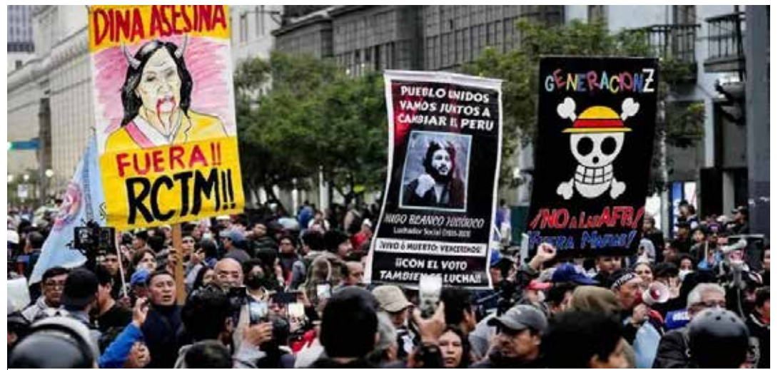
Generazione Z: una delle varie manifestazioni che si sono svolte in varie parti del mondo. Qui siamo in Perù

Alla fine, l'impressione è che chi chiama a raccolta gli spiriti più radicali del mondo studentesco o movimentista debba anche assumersi l'onere della chiarezza: dire qual è l'obiettivo, e non limitarsi ad evocare