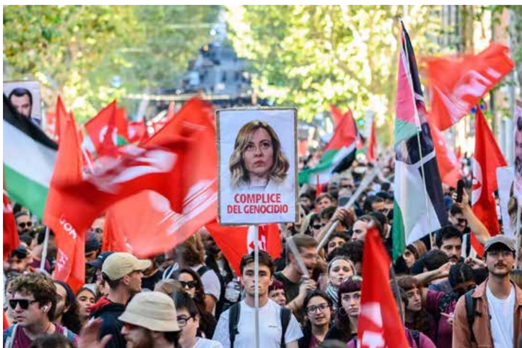
In questa pagina immagini della manifestazione nazionale a Roma lanciata dalle Organizzazioni palestinesi in Italia del 4 ottobre a cui hanno partecipato un milione di internazionalisti/e e antisionisti/e contro il genocidio di Gaza e per la Palestina libera

re le fonti del Diritto Internazionale che legittimano la lotta del popolo palestinese, pur nella consapevolezza che il diritto, troppo spesso, viene violato e disatteso nell'impunità.