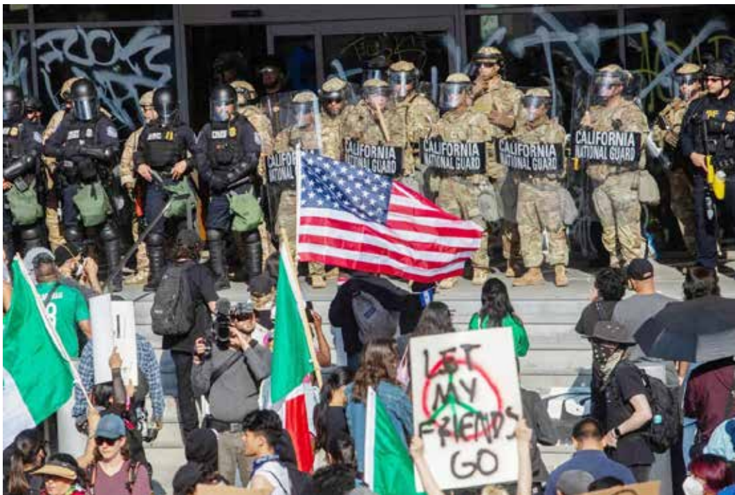
Los Angeles, 7 giugno 2025. Manifestazione contro la linea antimigrati varata da Trump con la caccia all'immigrato tramite le forze di polizia antimigrazione (ICE). Per l'occasione la città è stata invasa da 700 marines e 2000 agenti della guardia nazionale

Stato-nazione contrapposta alla "sovranità delle organizzazioni transnazionali più invadenti" (come l'ONU, che non viene neanche nominata), e che vanno riformate per "promuovere gli interessi americani".