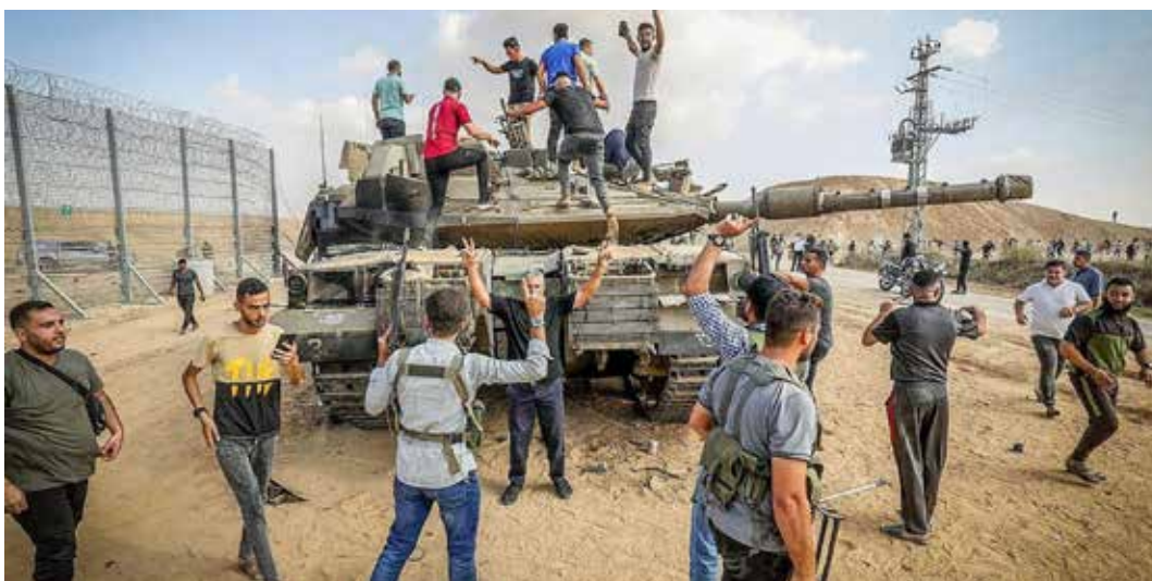
Gaza, 7 ottobre 2023. Combattenti e resistenti palestinesi festeggiano la cattura di un carro armato dell'esercito israeliano nei pressi della rete, messa dai sionisti, che separa Israele dalla striscia di Gaza

"Assegnare la forza internazionale con compiti e ruoli all'interno della Striscia di Gaza, incluso il disarmo della resistenza, la spoglia della sua