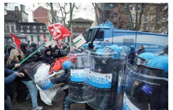
Le violente cariche della polizia per impedire ai manifestanti di avvicinarsi alla sede del Centro sociale

La nuova Strategia di sicurezza nazionale degli Usa