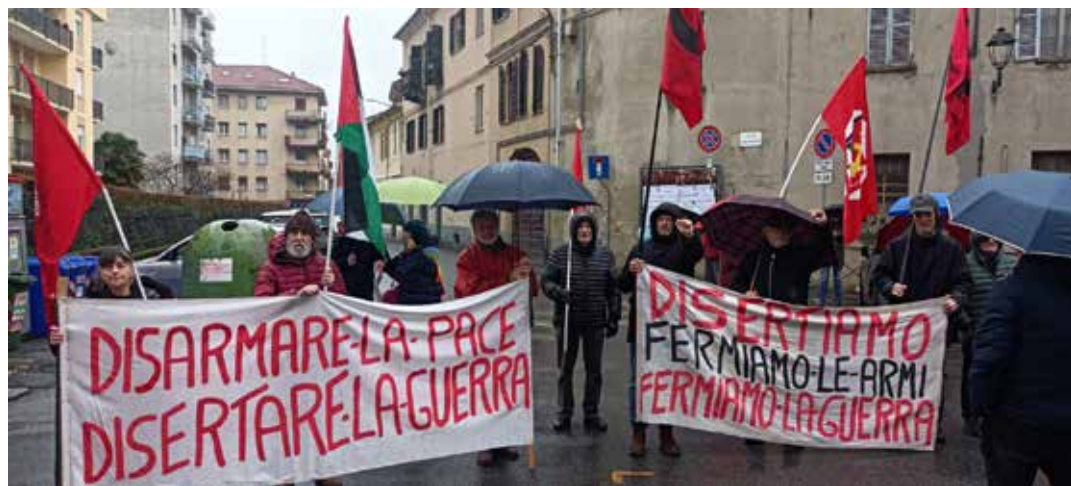
Biella, 21 dicembre 2025. Il presidio commemorativo dei martiri dell'eccidio nazifascista di San Cassiano al quale ha partecipato, tra gli altri, l'Organizzazione di Biella del PMLI

del Partito della Rifondazione Comunista, del Partito Comunista Italiano e del Partito marxista-leninista italiano, dell'ARCI Interprovinciale e "Biellesi per la Palestina Libera" con gli striscioni e bandiere palestinesi.