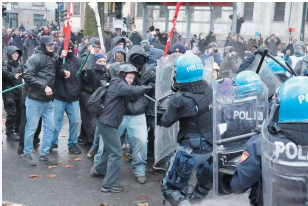
Le violente cariche della polizia per impedire ai manifestanti di avvicinarsi alla sede del Centro sociale