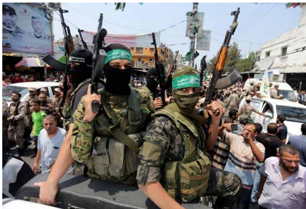
Gaza, Agosto 2023. Hamas celebra il funerale di un combattente

Il movimento ha concluso affermando che la risoluzione ignora l'urgente necessità di revocare l'ingiusto blocco e ricollegare la Striscia di Gaza ai territori occupati, riflettendo il sostegno a un programma volto a frammentare il territorio palestinese e a favorire le politiche di annessione e sfollamento praticate dal nemico usurpatore "zionista nazista".