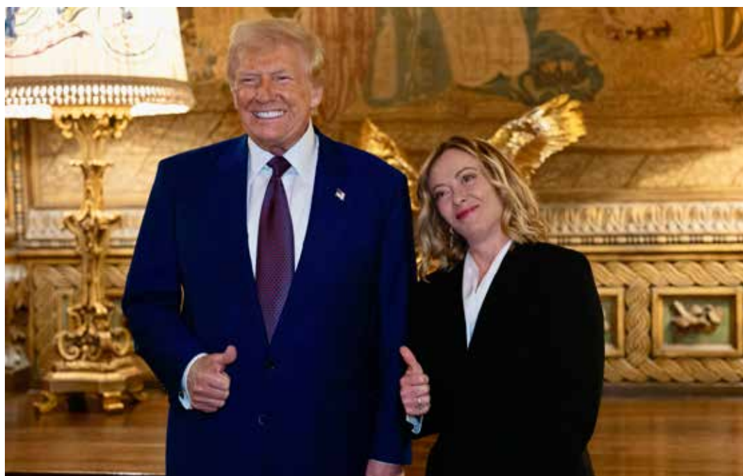
4 gennaio 2025. L'incontro in perfetta sintonia tra la Mussolini in gonnella Meloni e Trump nella sua residenza privata a Mar-a-lago in Florida

L'Italia di Mussolini in gonnella, insieme all'Ungheria ("finalmente, non stiamo più combattendo da soli", ha salutato entusiasta il fascista Orban), è senza dubbio la punta di lancia in Europa di questa internazionale nera trumpiana che comincia a delinearsi. La neofascista Meloni è stata infatti la prima a schierarsi con la nuova strategia trumpiana, dichiarando in