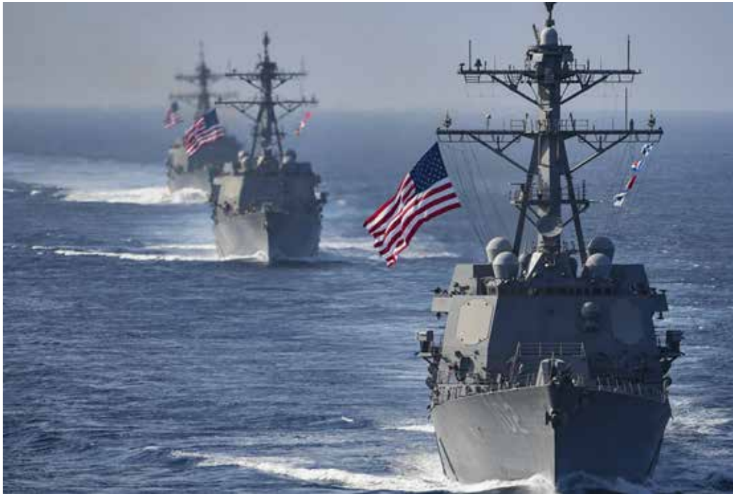
Un gruppo navale Usa diretto verso le coste del Venezuela

Tra i "Principi" su cui si fonda la nuova strategia trumpiana, spiccano la "pace attraverso la forza", quale "miglior deterrente" per prevenire minacce agli interessi americani; una "preferenza per il non-interventismo" e il "primato delle nazioni", fondato sulla sovranità dello