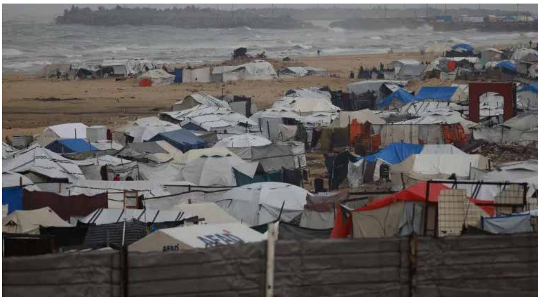
Gaza, 11 dicembre 2025. Un violento nubifragio accompagnato dal forte moto ondoso ha colpito tutti i campi di tende dei rifugiati gazawi vicino alla costa

Il 17 dicembre l'agenzia delle Nazioni Unite per i rifugiati palestinesi (Unrwa) avvertiva che la tempesta Byron aveva ulteriormente aggravato le già disastrose condizioni di vita di migliaia di sfollati nella Striscia di Gaza, molti dei quali sotto le poche tende o in edifici dan-