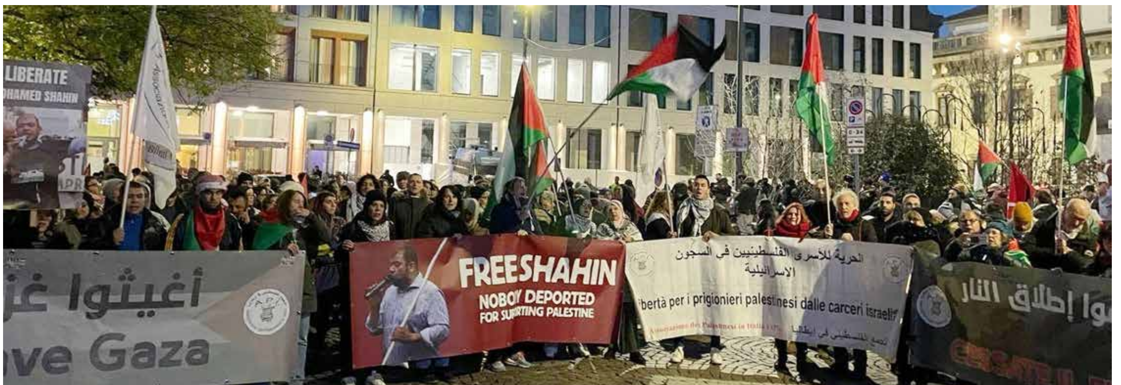
Milano, 29 novembre 2025. Manifestazione per la Palestina

na e per perpetuare il controllo sulla Striscia di Gaza. La risoluzione viene denunciata per aver ridimensionato l'obiettivo di uno Stato palestinese a un vago "percorso verso l'autodeterminazione", senza offrire garanzie concrete o tempistiche definite per la sovranità palestinese.