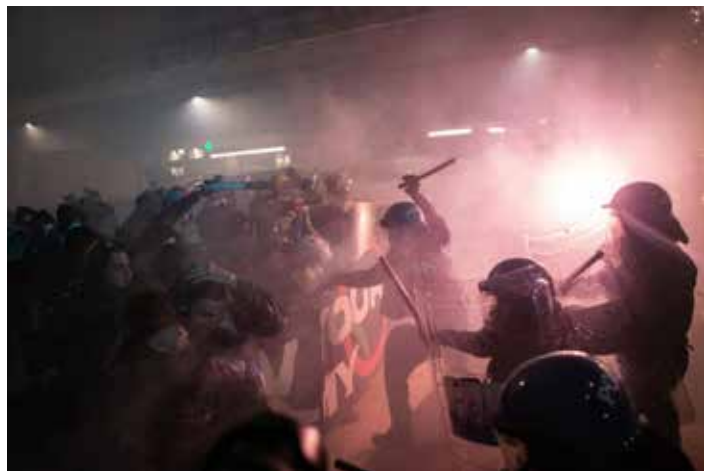
Milano, 5 febbraio 2026. Le violente cariche della polizia contro i manifestanti che volevano proseguire con il corteo