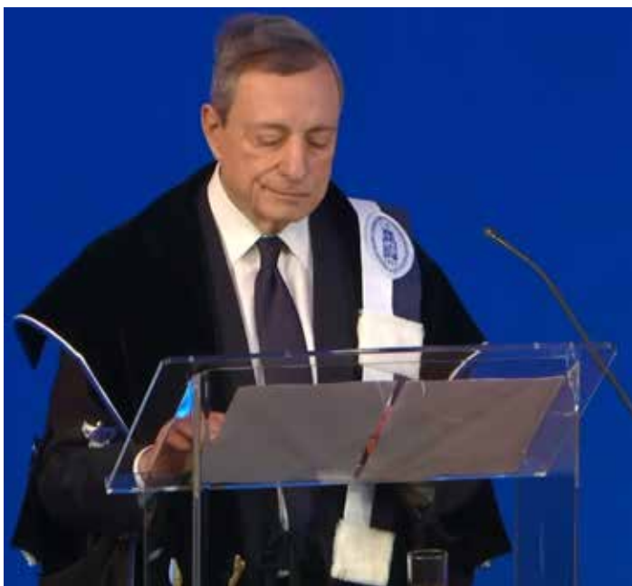
Leuven (Belgio), 2 febbraio 2026. Draghi pronuncia il discorso sulla federazione europea dopo aver ricevuto la laurea honoris causa dalla Università Cattolica di Lovanio

E per Draghi la ricetta funzionale a concretizzare questa accelerazione va ricercata soprattutto nel passaggio dell'UE dal modello confederale a quello federale nel quale la sovranità rimane sì in capo ai singoli Stati aderenti, ma con poteri limitati, subordinati a una sola legge fondamentale vincolante per tutti i Paesi. In questo modello l'unico soggetto riconosciuto a livello internazionale dovrà essere lo Stato Federale, di fatto una istituzione com-