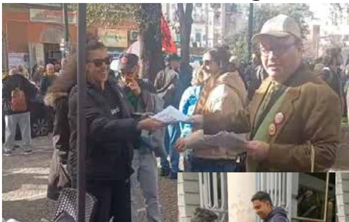
le cui avrebbero partecipato i marxisti-leninisti (vedi articolo a parte).

La calda accoglienza delle masse di Montesanto veniva bissata dalle masse della zona Ovest di Napoli presso il quartiere già operaio di Bagnoli dove, il 7 febbraio, decine e decine di volantini raggiungevano le masse, soprattutto giovani e donne che apprezzavano la propaganda per il NO organizzata dalla Cellula. Si discuteva della questione dell'inquinamento in quelle zone visto che sarebbe partito di lì a poco un corteo che si sarebbe concluso con un'assemblea naziona-