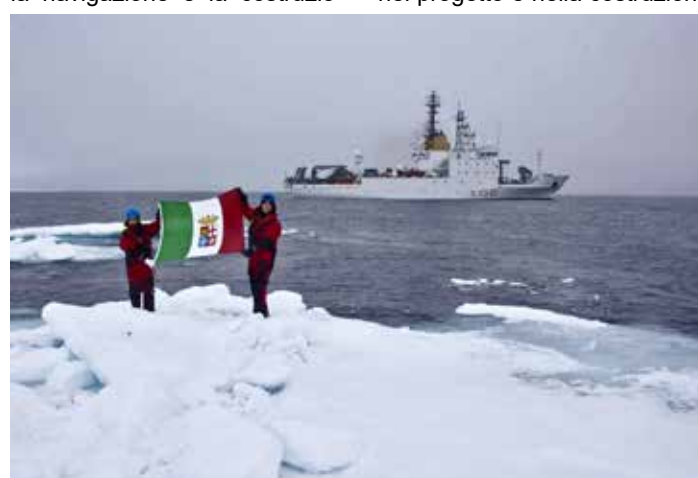
Artico. Una nave della Marina militare italiana durante la missione "Alliance High North"

di navi con codice polare e rompighiaccio, apre notevoli prospettive nel campo della cantieristica. Questo è particolarmente vero per l'Italia che vanta una lunga tradizione che la rende competitiva, come dimostrato dall'attività di Fincantieri che in Norvegia attraverso la sua controllata Vard, ha raggiunto una leadership mondiale nel progetto e nella costruzione