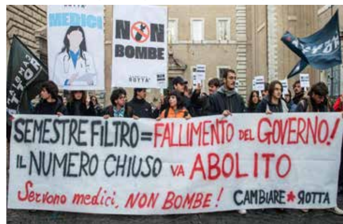
Roma, piazza Vidoni, 11 dicembre 2025. Presidio di protesta contro il semestre filtro per l'accesso a medicina

ANDU - Associazione Nazionale Docenti Universitari