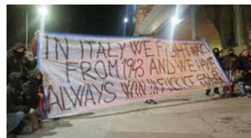
Genova, 6 febbraio 2026. Momenti della manifestazione dei lavoratori portuali a cui si sono uniti studentesse e studenti per lo sciopero internazionale contro il traffico di armi per Israele. I lavoratori portuali Calp antifascista hanno anche esposto un grande e interessante striscione in inglese in cui si legge: "In Italia noi abbiamo combattuto i nazisti dal 1943 e abbiamo sempre vinto !!! Fuck ICE"