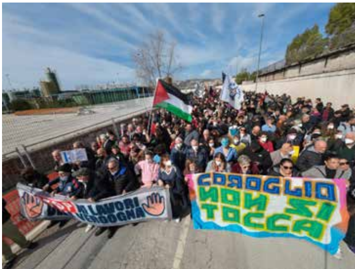
Napoli, 7 febbraio 2026. Manifestazione contro la mancata bonifica di Bagnoli

Già dall'annuncio che l'America's cup sarebbe di nuovo venuta a Napoli si erano mobilitati gli attivisti dei Comitati per bloccare i camion che portavano il materiale verso il quartiere popolare per adeguare il litorale alle esigenze dell'evento. Successivamente, con la collaborazione dei centri sociali "Laboratorio Iskra" e la Casa del Popolo "Villa Medusa", i Comitati ambientalisti decidevano di convocare una manifestazione per chiedere al Commissario che vengano ripristinate le opere necessarie per la zona sotto l'egida e il controllo proprio dei Comitati e delle masse popolari. Così, sabato 7 febbraio in più di 5mila hanno invaso nella mattinata la zona che va da Bagnoli a Coroglio fino a Nisida per chiedere la rimozione della colmata, dove saranno sistemati hangar e infrastrutture per la competizione, la realiz-