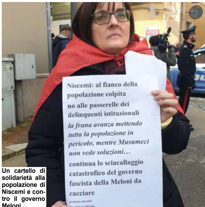
Un cartello di solidarietà alla popolazione di Niscemi e contro il governo Meloni

Il corteo ha attraversato alcune strade percorribili, evitando le zone rosse, combattivo, con tante bandiere No Muos e