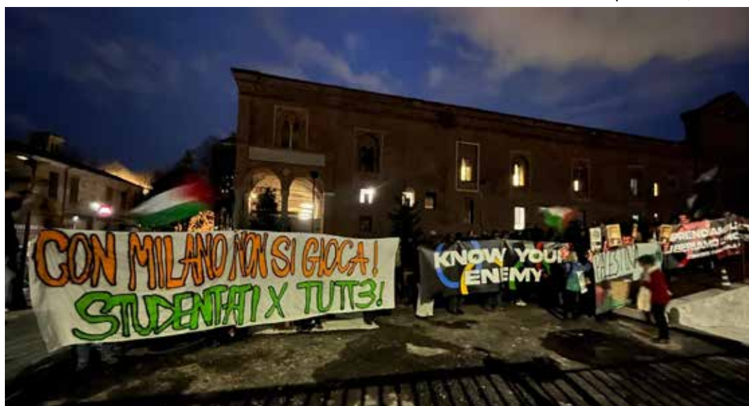
Milano, 5 febbraio 2026. Manifestazione di contestazione contro il passaggio della fiaccola olimpionica e la partecipazione di Israele