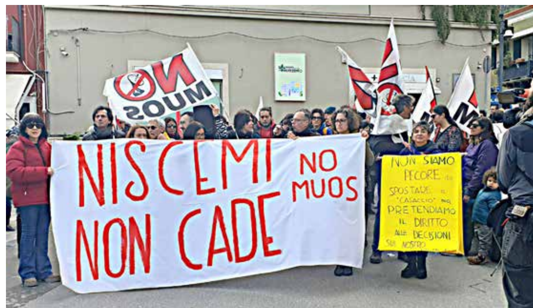
Niscemi (Caltanissetta), 8 febbraio 2026. Il presidio indetto dal movimento "no muos" per protestare contro lo stato in cui è stata abbandonato dalle istituzioni e governo il paese per la collina che frana

Sul Corriere di Gela era scritto: "Frana di Niscemi. Ministro, governatori e sindaco nel mirino della procura di Gela. Il governatore Renato Schifani, il ministro nello Musumeci e Rosario Crocetta. Il ministro per la Protezione civile e le politiche del mare, Nello Musumeci (Fdl), potrebbe essere sentito nei prossimi giorni della procura della Repubblica del tribunale di Gela, nella qualità di ex presidente della regione Sicilia dal 2017 al 2022, se non indagato quantomeno come persona a conoscenza dei fatti riguardo alle responsabilità penali sulla complessa vicenda che dalla frana di Niscemi del 1997 arriva a quella di questi giorni senza che siano state adottate le opportune misu-