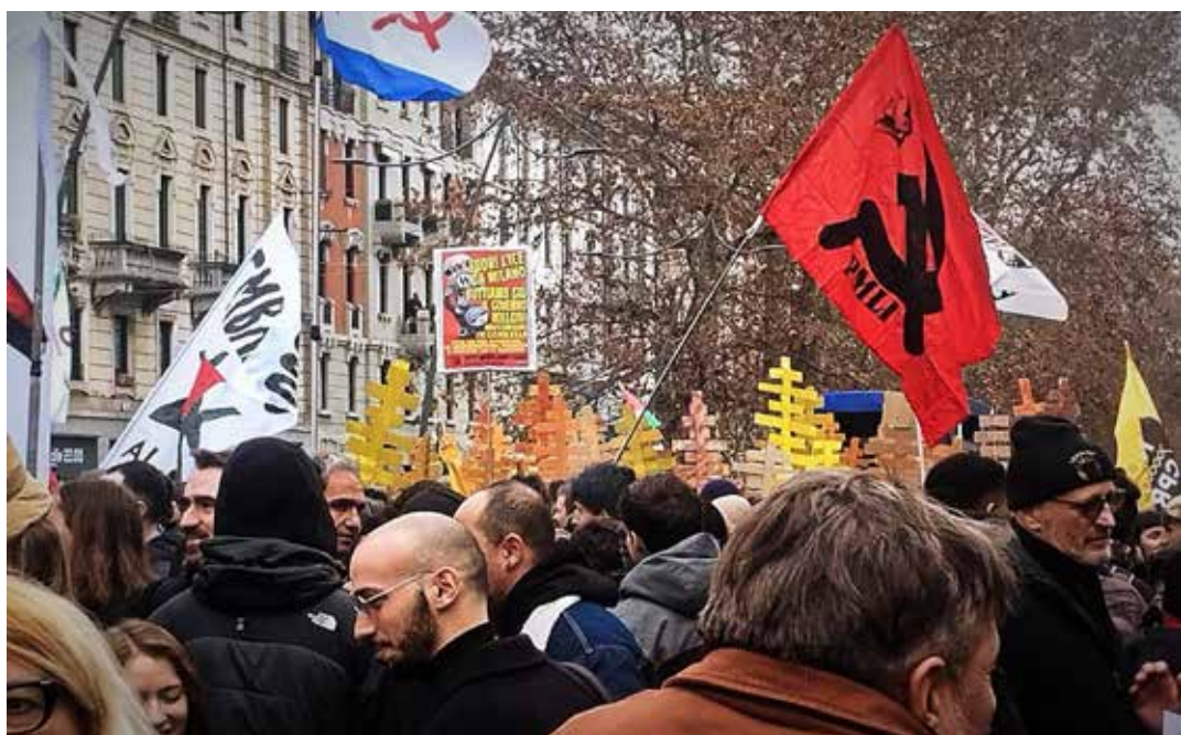
Milano, 7 febbraio 2026. Manifestazione contro le Olimpiadi invernali Milano-Cortina