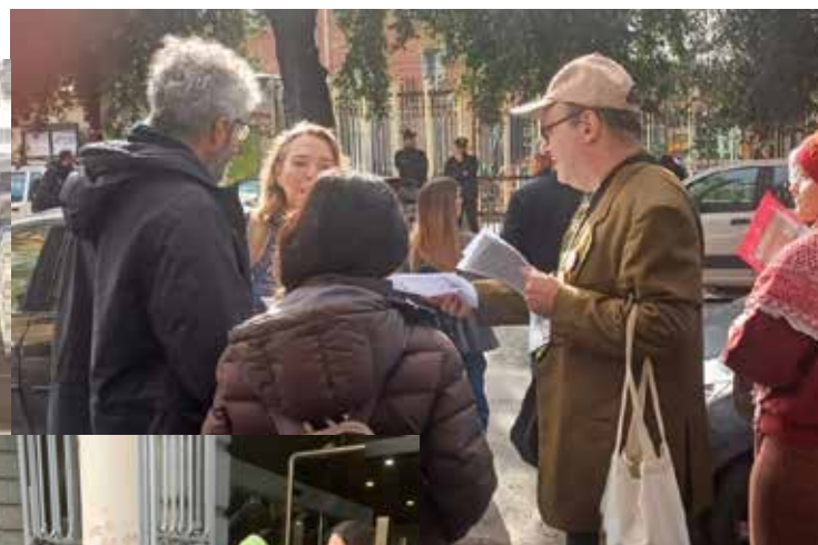
Napoli, nelle foto sopra, il 7 febbraio 2026 la diffusione referendaria per il NO nel quartiere già operaio di Bagnoli Napoli

Ribadiamo la necessità di votare e far votare NO al referendum di marzo, per questo, anche, appoggiamo i Comitati unitari per il No che si stanno formando.