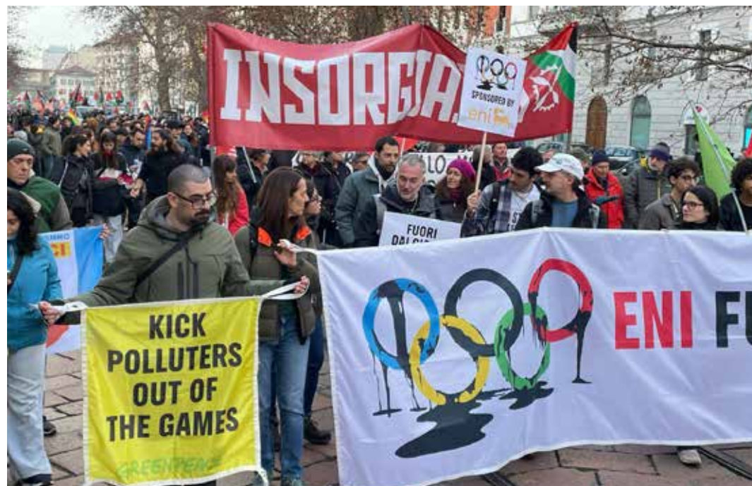
Milano, 7 febbraio 2026. Alla manifestazione hanno fatto sentire la propria voce la Comunità palestinese, gli ambientalisti contro i tagli dei lariani a Cortina, contro la speculazione edilizia e contro la sponsorizzazione dell'ENI