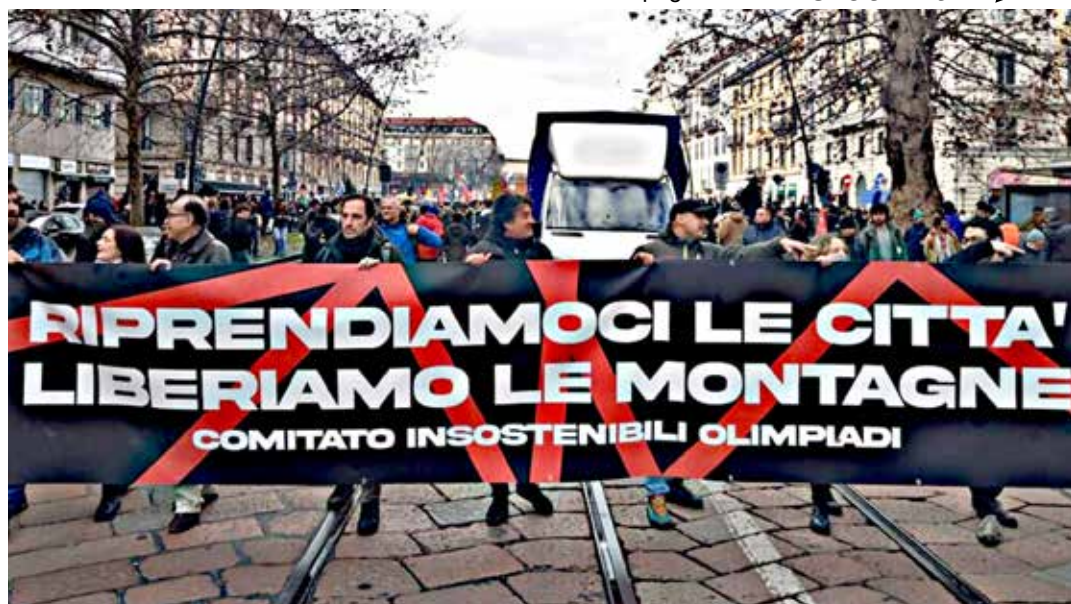
Milano, 7 febbraio 2026. L'apertura del combattivo corteo contro le Olimpiadi invernali Milano-Cortina