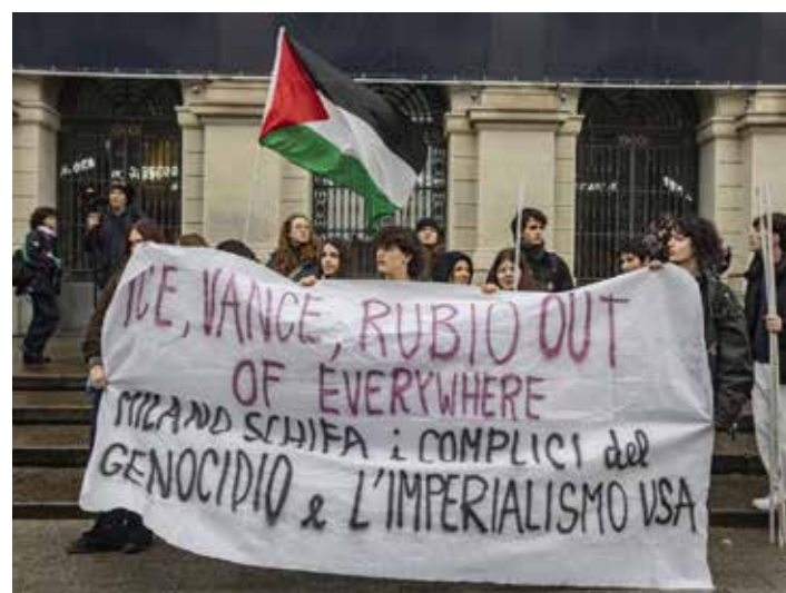
Milano, 6 febbraio 2026. Due momenti della mobilitazione studentesca contro la presenza dell'ICE

I nostri compagni hanno anche diffuso centinaia di copie di un volantino che riproduceva il suddetto manifesto con l'aggiunta di QR-Code che collegano, tramite smartphone, all'articolo "Le nuove misure sulla sicurezza, puro fascismo mussoliniano" e al Documento refe-