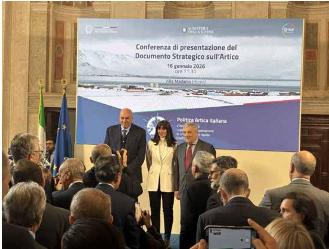
Roma, Villa Madama. 16 gennaio 2026. Un momento della Conferenza per la lancio della politica italiana nell'Artico. Alla presentazione i ministri coinvolti (da sinistra): Crosetto, Ministro della difesa; Bernini, Ministra dell'Università e della ricerca e Tajani, Vicepresidente del Consiglio e Ministro degli Esteri. Sul pannello alla spalle una immagine di Ny-Alesund, nelle isole Svalbard, dove si trova la Base Italiana "Dirigibile Italia"

il trasporto di personale e materiali e la partecipazione alle missioni di Air Policing nell'ambito del sistema NATO di difesa aerea e missilistica integrata (NATINAMDS), anche in regioni sub-artiche.