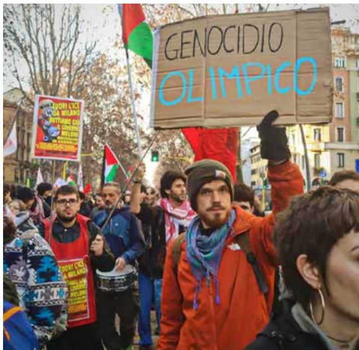
Un aspetto del corteo del 7 febbraio

La Milano che sabato ha riempito le strade non è né la Milano da bere del sindaco PD Sala né l'Italia servile del governo Meloni: è l'Italia che lotta, che non si piega e che lavora per relegare fascismo, neofascismo e capitalismo nel museo della storia. Una Milano sinceramente rossa e coraggiosamente resistente che può e deve indicare la via al Paese che per noi marxisti-leninisti non potrà essere che la via universale dell'Ottobre per la conquista del potere politico del proletariato per la realizzazione dell'Italia unita, rossa e socialista!