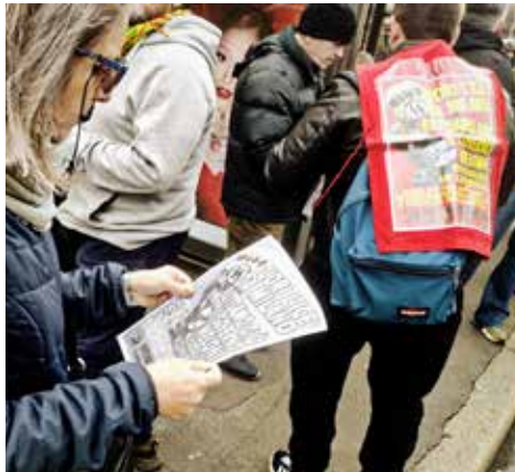
Milano, 7 febbraio 2026. Alcuni momenti della diffusione del volantino del PMLI contro la presenza dell'ICE a Milano