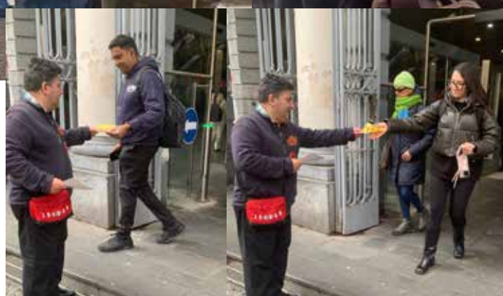
Mentre a fianco, due momenti della diffusione del volantino del PMLI per il No a Montesanto, davanti la stazione della Cumana fatta il 6 febbraio 2026