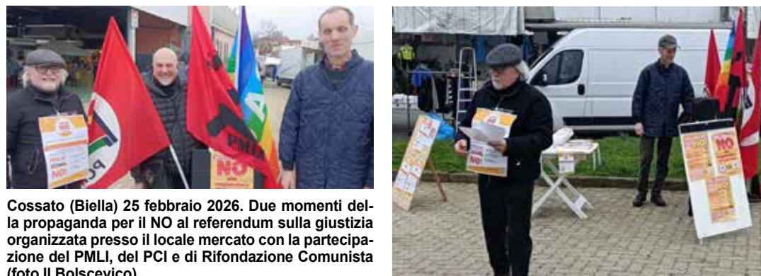
Cossato (Biella) 25 febbraio 2026. Due momenti della propaganda per il NO al referendum sulla giustizia organizzata presso il locale mercato con la partecipazione del PMLI, del PCI e di Rifondazione Comunista

Numerosi e significativi gli scambi con la popolazione, che in molti casi ha espresso giudizi nettamente negativi sull'operato del governo di Mussolini in gonnella, Giorgia Meloni, ricordando come la controriforma della giustizia - in particolare la separazione