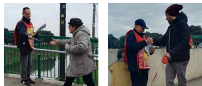
Firenze, 1 marzo 2026. Momenti della diffusione del volantino del PMLI per il No al referendum sulla giustizia

I media, che pure in cronaca riportano che il boss leghista ha rinunciato a svolgere l'annunciata propaganda anche sul lato del Ponticino verso il parco delle Cascine, proprio per evitare di incrociare i "sostenitori del NO", ossia i militanti del PMLI che lo propagandavano, si sono ben guardati dal citare i marxisti-leninisti. Addirittura "Repubblica.it" è ricorsa a un falso pur di non citare il PMLI: "Salvini decide poi di cambiare tragitto ed evitare di andare a fare volantinaggio per il Sì alle Cascine per