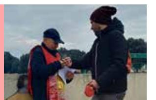
Firenze, un momento della diffusione alla passerella nel quartiere Isolotto

Al referendum sulla giustizia basta un solo voto in più per vincere