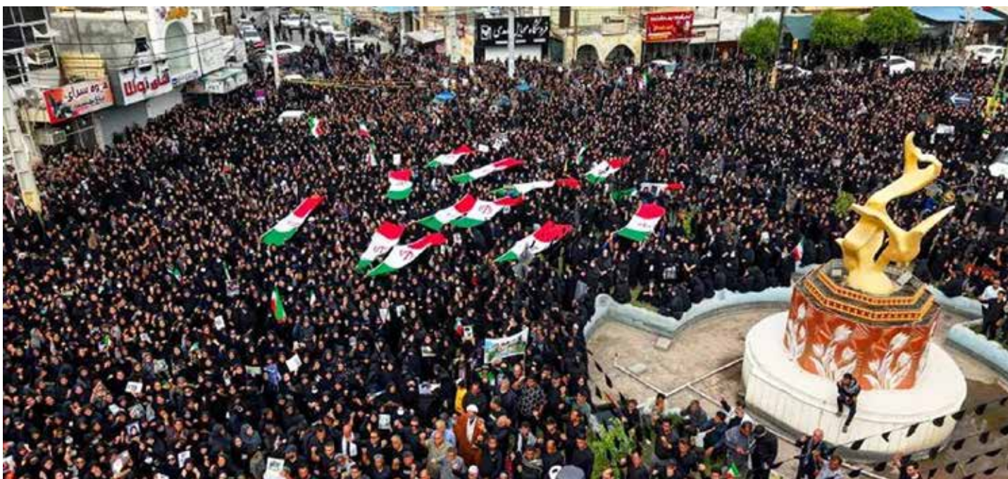
Usa e Israele, sabato 28 febbraio 2026, con il loro primo criminale attacco sull'Iran hanno colpito in pieno una scuola elementare a Minab, nel sud del paese, con 160 alunne tutte morte nel criminale bombardamento. Nella foto i funerali a Minab il 3 marzo

sicurezza nazionale", affermava nel primo di tanti messaggi promettendo di eliminare tutti i missili e le industrie belliche iraniane. "Fratelli e sorelle, cittadini di Israele, poco più di un'ora fa Israele e gli Stati Uniti hanno avviato un'operazione per rimuovere la minaccia esistenziale rappresentata dal regime del terrore in Iran", ricalcava il criminale Netanyahu che non dimenticava di ringraziare "il nostro grande amico, il presidente Donald Trump, per la sua leadership storica". Entrambi invitavano la popolazione iraniana a ribellarsi al governo, paladini di una libertà che negano in casa propria con una feroce repressione, vedi Trump e i suoi pretoriani dell'Ice e il criminale genocida del popolo palestinese Netanyahu; erano però stati battuti sul tempo dal comunicato del ministro della Difesa sionista Israel Katz, non appena le agenzie avevano diffuso la notizia di colonne di fumo nero che si erano levate sui cieli di Teheran: "Israele ha lanciato un attacco preventivo contro l'Iran per rimuovere le minacce allo Stato". Non si tratterebbe quindi di una guerra di aggressione ma