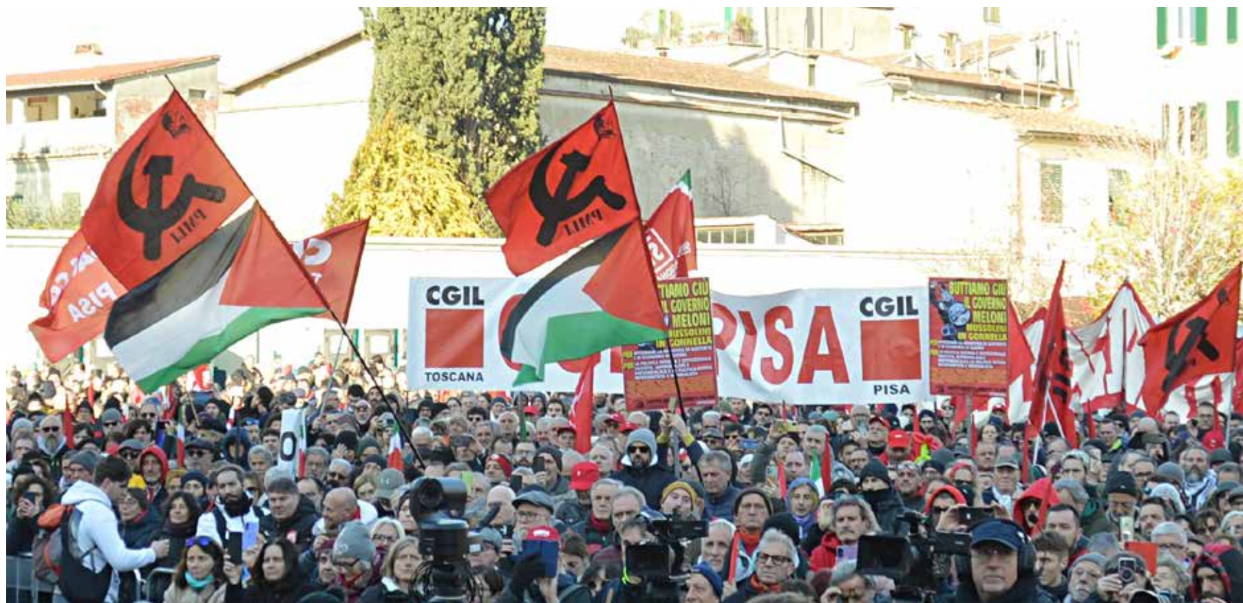
Firenze, 12 dicembre 2025. Manifestazione regionale per lo sciopero generale indetto dalla CGIL. Piazza del Carmine durante l'intervento conclusivo di Landini. Al centro le bandiere e i cartelli del PMLI contro il governo Meloni

Sagge parole, in effetti dai giovani quadri e militanti del Partito che avanzano e crescono alla sua scuola, e questo