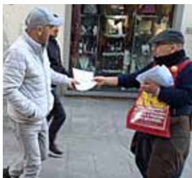
Borgo S. Lorenzo (Firenze), 28 febbraio 2026. Due momenti della diffusione del volantino del PMLI per il NO alla "riforma" della giustizia

ottimo strumento di approfondimento che abbiamo proposto all'elettorato per il NO col quale c'è stata un'ottima sintonia. Per contro, è stata solo una minoranza a dichiarare di votare Sì o che ha rifiutato il volantino. Pertanto si è registrato un ottimo "clima" di stima e condivisione intorno ai nostri compagni.