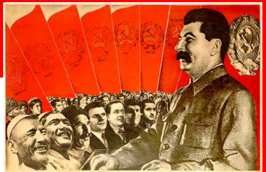
"Viva l'USSR esempio di unità dei lavoratori di tutte le nazionalità del mondo"

Sono assolutamente contrario alla pubblicazione di Racconti sull'infanzia di Stalin .