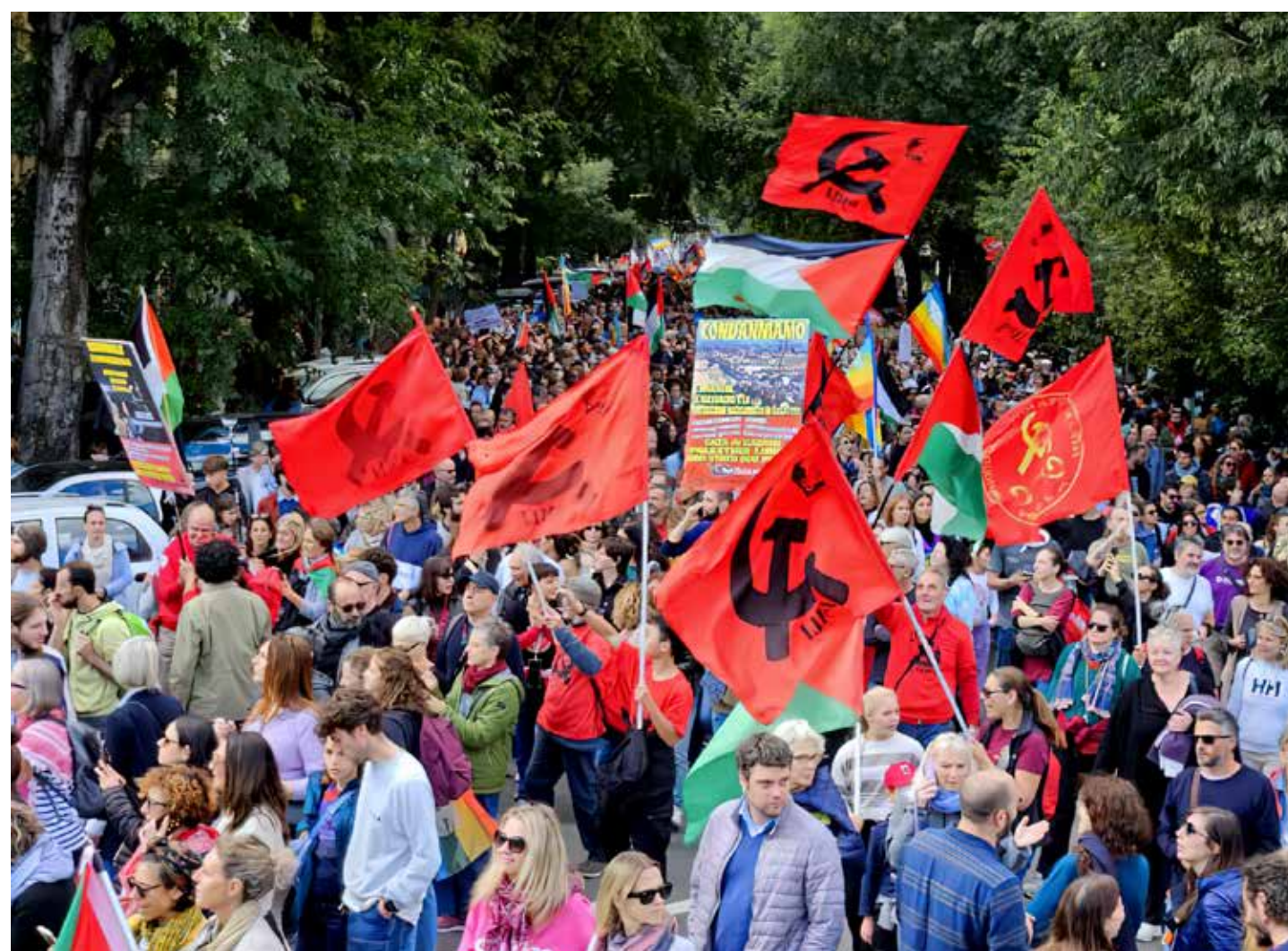
Firenze, 3 ottobre 2025. Un momento della grande e combattiva mobilitazione per lo sciopero per la Palestina libera e la Sumud Global Flotilla

Per quanto riguarda la lotta di classe "quando e dove non c'è, o segna il passo, - ci indica Scuderi - dobbiamo rimuovere le acque per rilanciarla. Altrimenti tutto ristagna e imputridisce, la borghesia impera