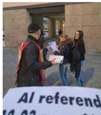
Fuucecchio, 28 febbraio 2026. Il volantinaggio per il No al referendum sulla giustizia nella centrale piazza Montanelli

nale di Firenze. Al comitato locale, costituito da Anpi, Circolo Arci Casa del Popolo, Spi-Cgila