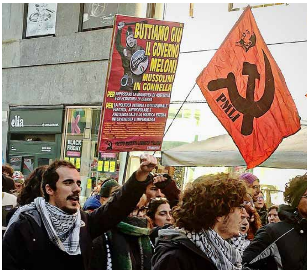
Milano, 28 novembre 2025. Manifestazione per lo sciopero generale indetto dai sindacati di base contro il governo

Per quanto riguarda l'ostacolo che ci impedisce attualmente