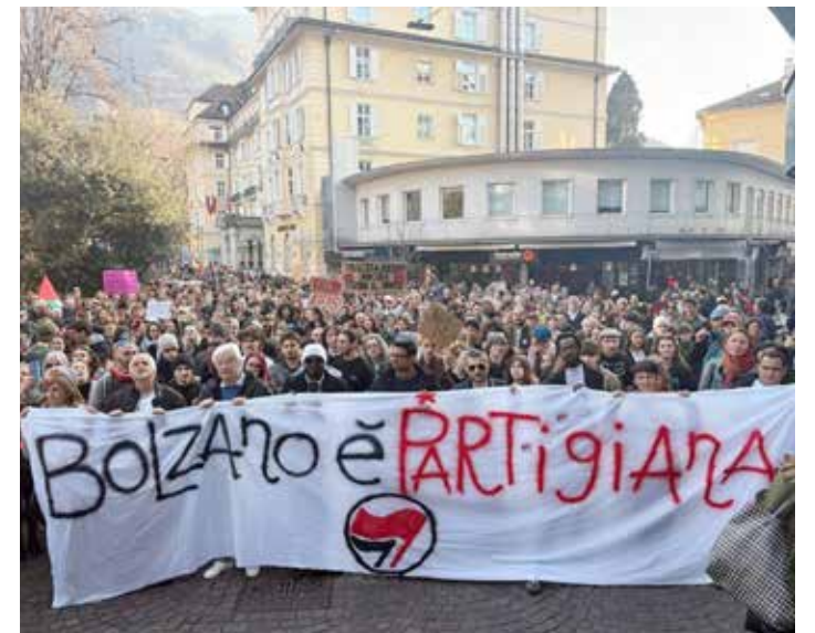
Bolzano, 28 febbraio 2026. Il grande striscione di apertura del partecipato e combattivo corteo contro la "remigrazione" e i neofascisti

Il lunghissimo corteo è partito da piazza Stazione per salire lungo via Grappoli, si è fermato davanti al Municipio ed ha svoltato in via Piave, per poi proseguire lungo via Brennero passando davanti alla sede dell'Svp; ha poi imboccato via Renon per tornare in piazza Stazione al grido: "Benvenuti migranti" e "Non è patriottismo, il vostro è razzismo".