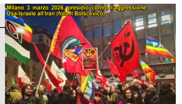
Milano 3 marzo 2026, presidio contro l'aggressione Usa-Israele all'Iran