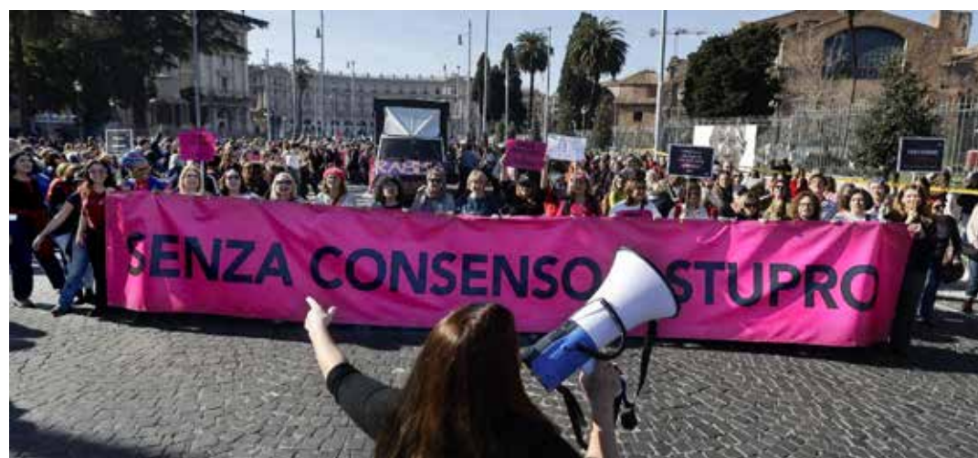
Roma, 28 febbraio 2026. Manifestazione nazionale contro il ddl Bongiorno

Al grido "Senza consenso è stupro" le donne, fra le quali spicca la partecipazione massiccia delle ragazze e delle studentesse con al loro fianco i compagni di studio, di vita e di lavoro hanno dato vita a un folto corteo, colorato, rumoroso e arrabbiato per le vie del centro della capitale, "boccian-