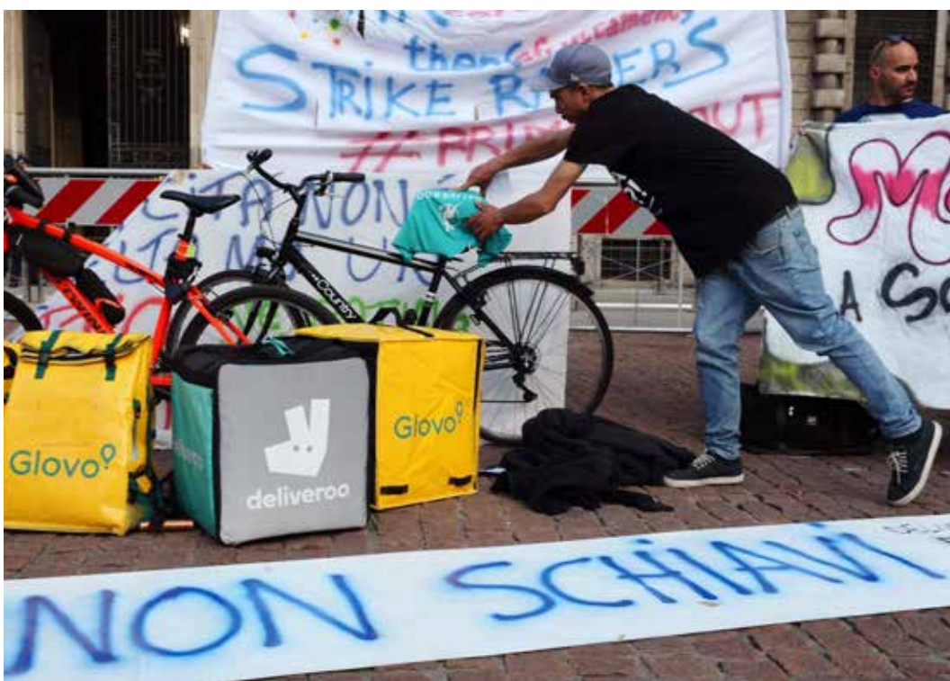
Una protesta dei rider schiavizzati da Glovo e Deliveroo