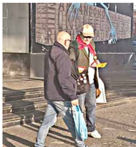
Napoli, 1 marzo 2026. Propaganda del PMLI per il NO al referendum davanti alla metro di Chiaiano