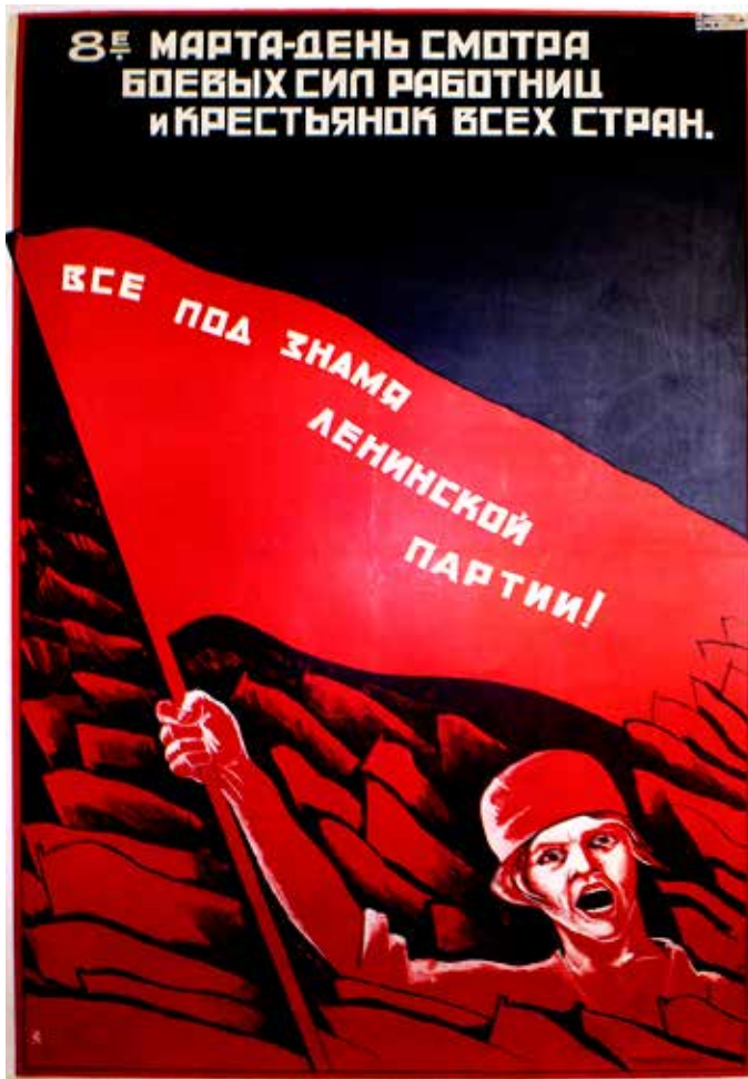
"8 Marzo, giorno della celebrazione delle combattenti lavoratrici e contadine di tutti i paesi". Sulla bandiera si legge: "Tutte sotto la bandiera del partito leninista!" Manifesto sovietico-1924

(Lenin, Alle operaie , 21 febbraio 1920, Opere , vol. 30, pagg. 334-335, Editori Riuniti)