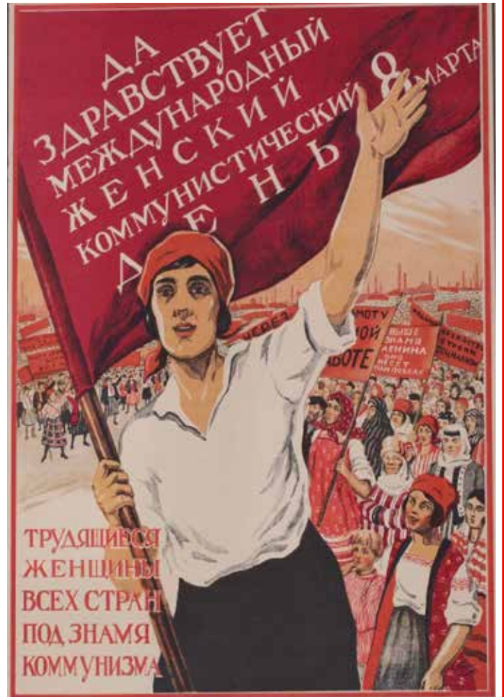
"8 Marzo. Viva la giornata internazionale comunista delle donne" Manifesto sovietico-1926