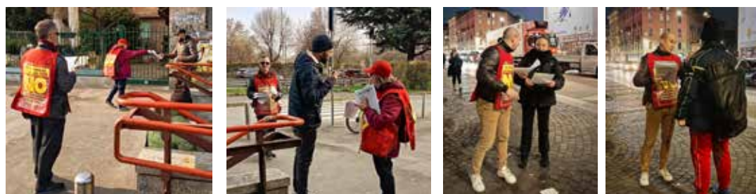
Milano, 28 febbraio 2026. Due momenti della diffusione referendaria del PMLI per il No alla metro di Crescenzago

Anche questa volta non sono mancati coloro che hanno di-