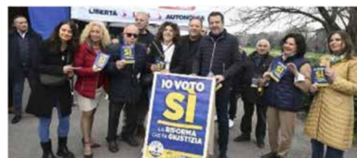
Firenze. Il misero show leghista per il Sì al referendum sulla giustizia svoltosi in piazza Isolotto il 1 marzo come testimonia questa foto pubblicata da "La Nazione"

Nei prossimi giorni continueremo la propaganda del NO con altre diffusioni all'Isolotto e l'affissione di locandine che riproducono il manifesto del PMLI per il NO presso le facoltà universitarie.