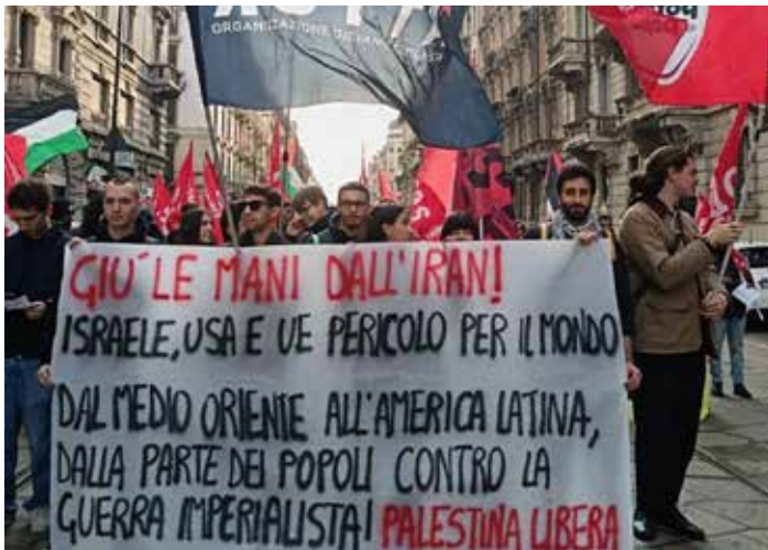
Striscione di denuncia dell'aggressione all'Iran durante la manifestazione per la Palestina a Milano il 28 febbraio 2026