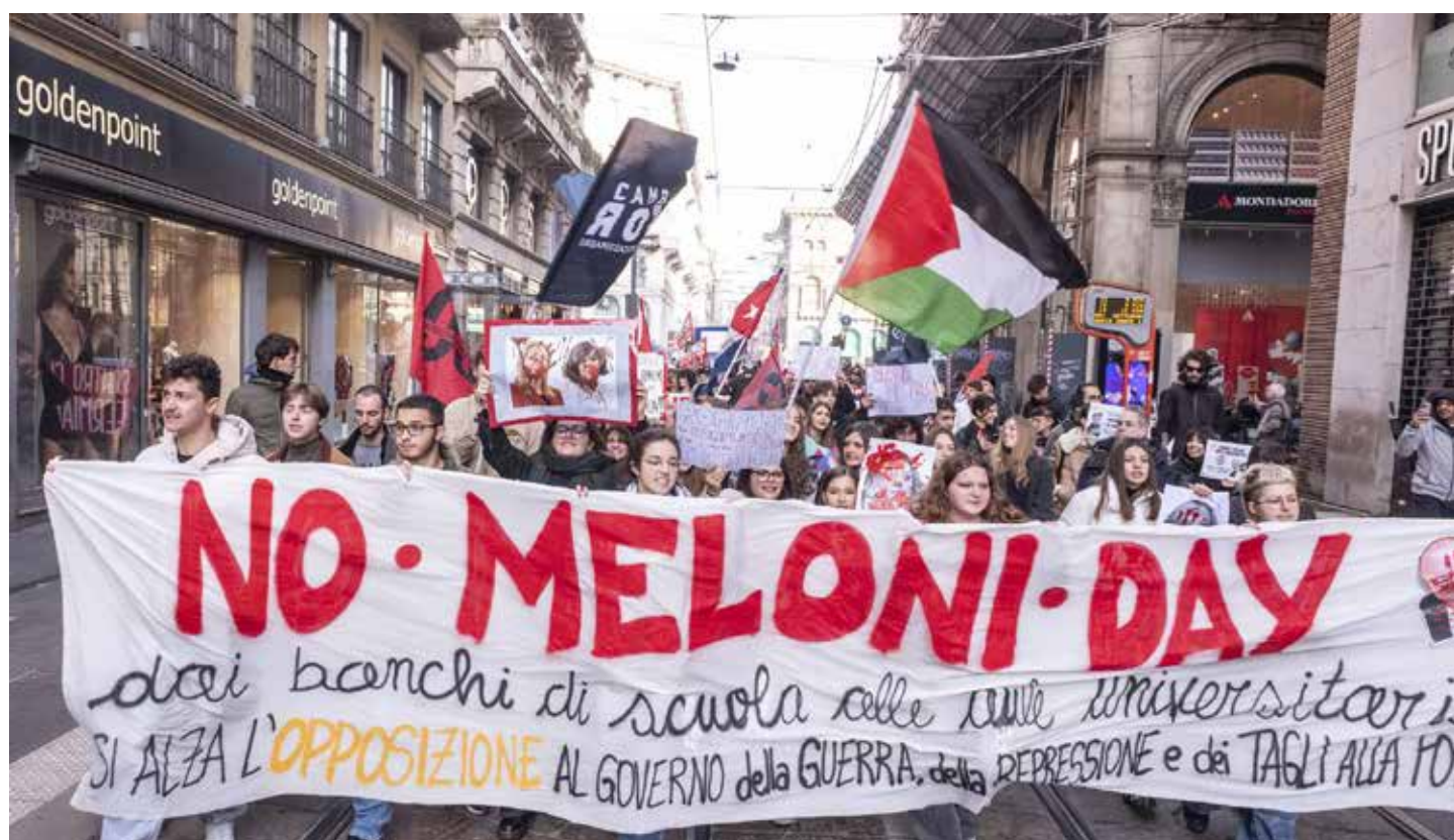
Milano, 15 novembre 2024. Manifestazione per il No Meloni day

fascista movimento sociale italiano (MSI), non è un semplice governo reazionario con "tendenze autoritarie", come sostengono opportunisticamente le opposizioni parlamentari. In realtà è un governo neofascista dalla testa ai piedi, come dimostra la sua politica interna ed estera ispirata a quella di Mussolini.