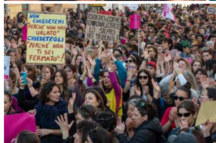
Aspetti del combattivo corteo contro il ddl Bongiorno

Per questi motivi alla giusta lotta contro il ddl Bongiorno, va affiancata quella contro il governo neofascista Meloni, Mussolini in gonnella che del ddl è l'ispiratore e sostenitore. In tal senso rinnoviamo l'appello alle masse femminili, alle