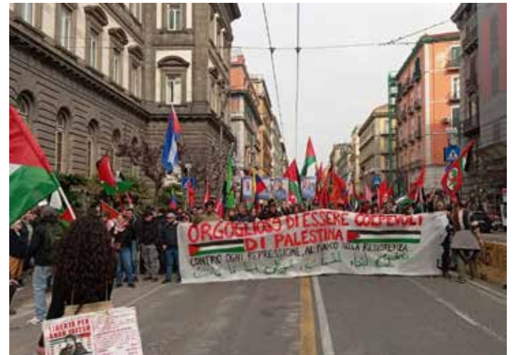
Napoli, 28 febbraio 2026. manifestazione per la resistenza palestinese e contro la repressione

Il corteo di Milano è partito alle ore 15 da piazza Duca D'Aosta, davanti alla stazione Centrale, per terminare in via Venini, da-