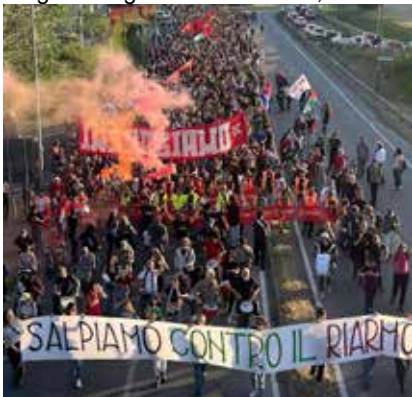
Campi B. (Firenze), 11 aprile 2026. La combattiva e partecipata manifestazione organizzata dal Collettivo ex GKN contro il riarmo, i licenziamenti e per la fabbrica socialmente integrata

tante "Appello alle ragazze e ai ragazzi che lottano per cambiare l'Italia" redatto dal compagno Giovanni Scuderi, Segretario generale del PMLI, in occa-