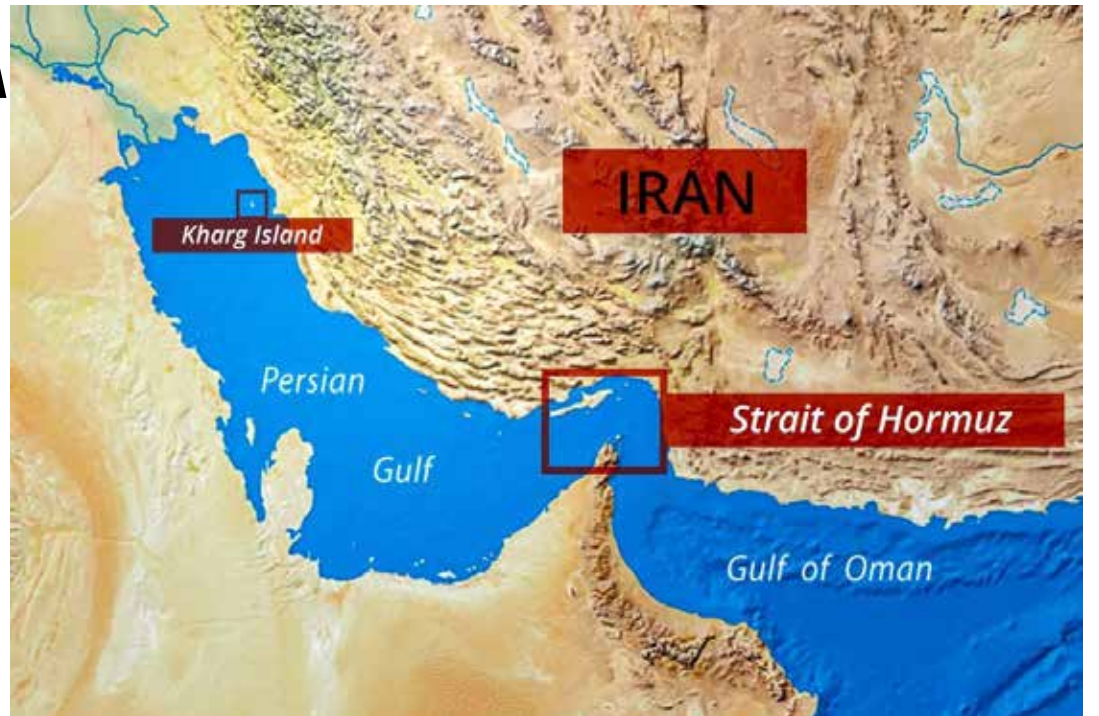
Sopra: La mappa dello stretto di Hormuz

Nella conferenza stampa del 10 aprile la portavoce del ministero degli Esteri ci-