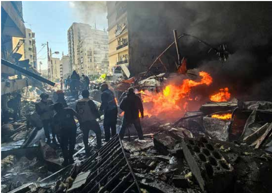
8 aprile 2026. Beirut colpita nella zona di Corniche al Mazraa da un raid sionista

Dopo la carneficina nazisionista dell'8 aprile le proteste contro il criminale Netanyahu crescevano, da quella della Spagna che definiva la strage in Libano un "inaccettabile disprezzo per la vita umana", a Parigi col portavoce del ministero degli Esteri, Pascal Claverie, che definiva "sproporzionati" i bombardamenti sul Libano e sosteneva che l'accordo di associazione fra l'Unione europea e Israele potrebbe essere "ridiscusso" alla luce della "gravità di quanto successo in Libano e vista la situazione in Cisgiordania". La Spagna almeno ha già ritirato l'11 marzo la sua ambasciatrice a Tel Aviv, quella di Macron al momento la possiamo classificare come la solita dichiarazione di intenti che non avrà seguito. Sempre qualche cosa di più comunque della neofascista Meloni che nell'informativa in parlamento il 9 aprile sull'azione del governo, tenuta all'insigne del motto mussoliniano "noi tireremo dritto", confermava il suo sostanziale appoggio