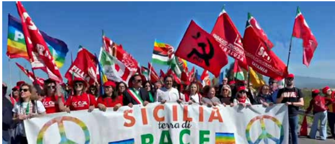
11 aprile 2026. Lo striscione di apertura del combattivo corteo regionale "Sicilia terra di Pace", diretto verso la base militare italiana, USA e Nato di Sigonella (Siracusa) e contro l'uso della base stessa per la guerra di aggressione all'Iran

"Stiamo già pagando il costo economico di una guerra scellerata e illegale, non vogliamo pagare pure il costo della trasformazione della Sicilia in un hub logistico di guerra che viola la Costituzio-