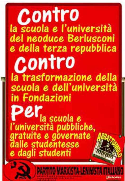
Due manifesti del PMLI sulle lotte studentesche con le rivendicazioni per la scuola per bocciare sia le "riforme scolastiche" dell'allora governo Prodi (novembre 2006, a sinistra) che quelle del governo del neoduce Berlusconi (2008)