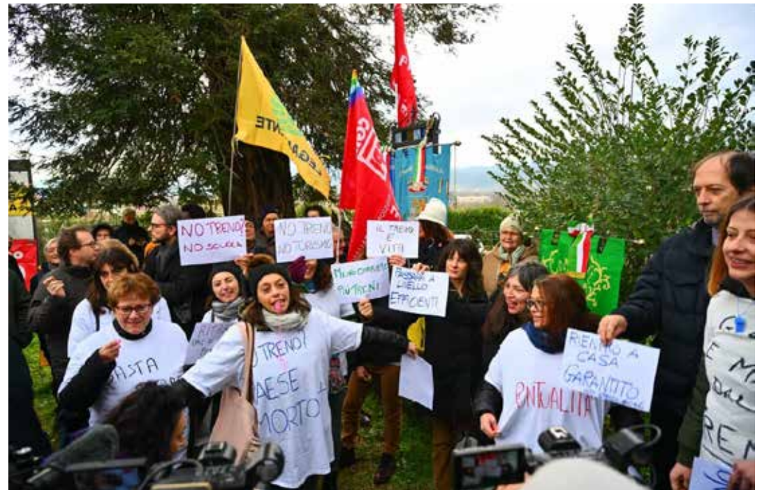
2 febbraio 2025. Protesta per incrementare e migliorare i servizi di trasporto pubblico dei pendolari che utilizzano la ferrovia fientina

In conclusione, su entrambe le questioni noi marxisti-leninisti non siamo assolutamente d'accordo né sul merito né sul metodo come esposto né tantomeno sulla logica che porta a quest'opera, perché essa ha come sua colonna portante il non più sostenibile e inquinante trasporto privato su gomma. L'aggravante è poi che questi progetti si vogliono realizzare in zone come il Mugello e la Valdisieve, servite da