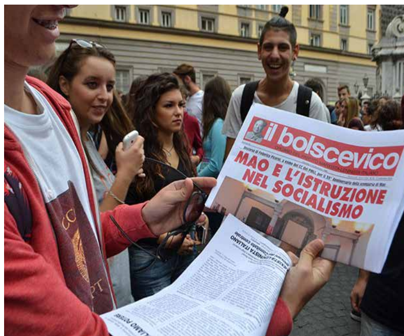
Napoli. Manifestazione studentesca, 9 ottobre 2015