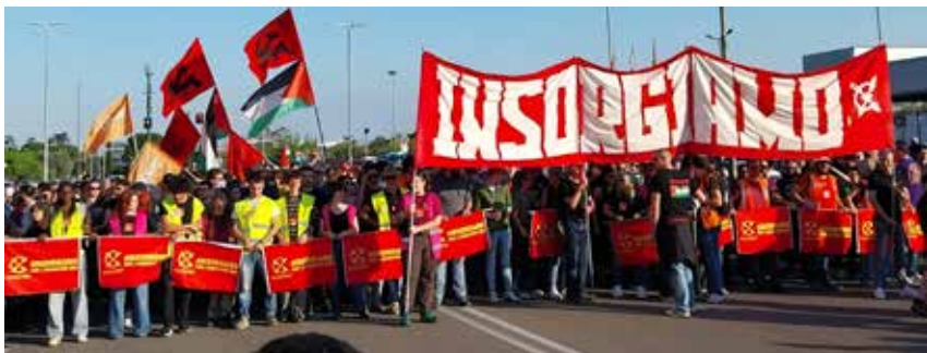
Campi B. (Firenze), 11 aprile 2026. La rossa e compatta linea di apertura del corteo delle lavoratrici e dei lavoratori del Collettivo ex GKN. Dietro si notano le bandiere del PMLI con quelle della Palestina portate dalla delegazione del PMLI di Prato e della provincia di Firenze

di questa realtà dei lavoratori e solidali, non ci poteva essere situazione migliore per lanciare i valori proletari rivoluzionari contenuti nell'Appello del PMLI alla componente giovanile antimperialista e anticapitalista.