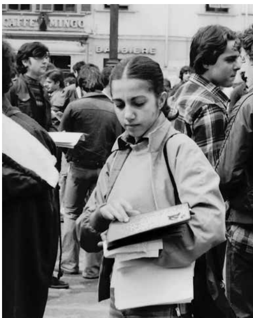
Firenze, 14 maggio 1977. Manifestazione provinciale studentesca. Diffusione del PMLI (fondato da poco più di un mese) a sostegno delle lotte