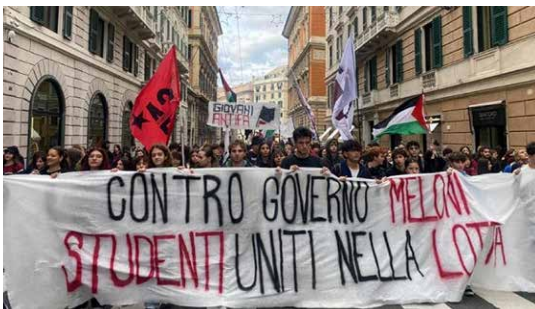
Genova, 14 novembre 2025. Manifestazione studentesca contro Meloni

A tutti questi politicanti borghesi neofascisti, liberali, riformisti, opportunisti, carrieristi e trasformisti, ben si attaglia questo passaggio dell'"Appello alle ragazze e ai ragazzi che lottano per cambiare l'Italia", contenuto nell'editoriale di Giovanni Scuderi per il 49° Anniversario della fondazione del PMLI: "In vista delle prossime elezioni politiche, già le varie forze borghesi sono in gran movimento per riuscire ad accaparrarsi più posti possibili in parlamento, e magari nel governo, per gestire gli affari della classe dominante borghese e del capitalismo. Non seguitelo, non agevolate i loro piani parlamentari e governativi col vostro voto. Anzi, prendetene le distanze col voto astensionista anticapitalista e antifascista, per il socialismo e, se volete per il PMLI".