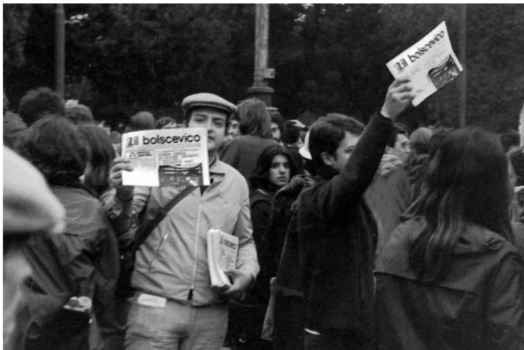
Roma, 12 marzo 1977. Manifestazione nazionale delle studentesse e degli studenti