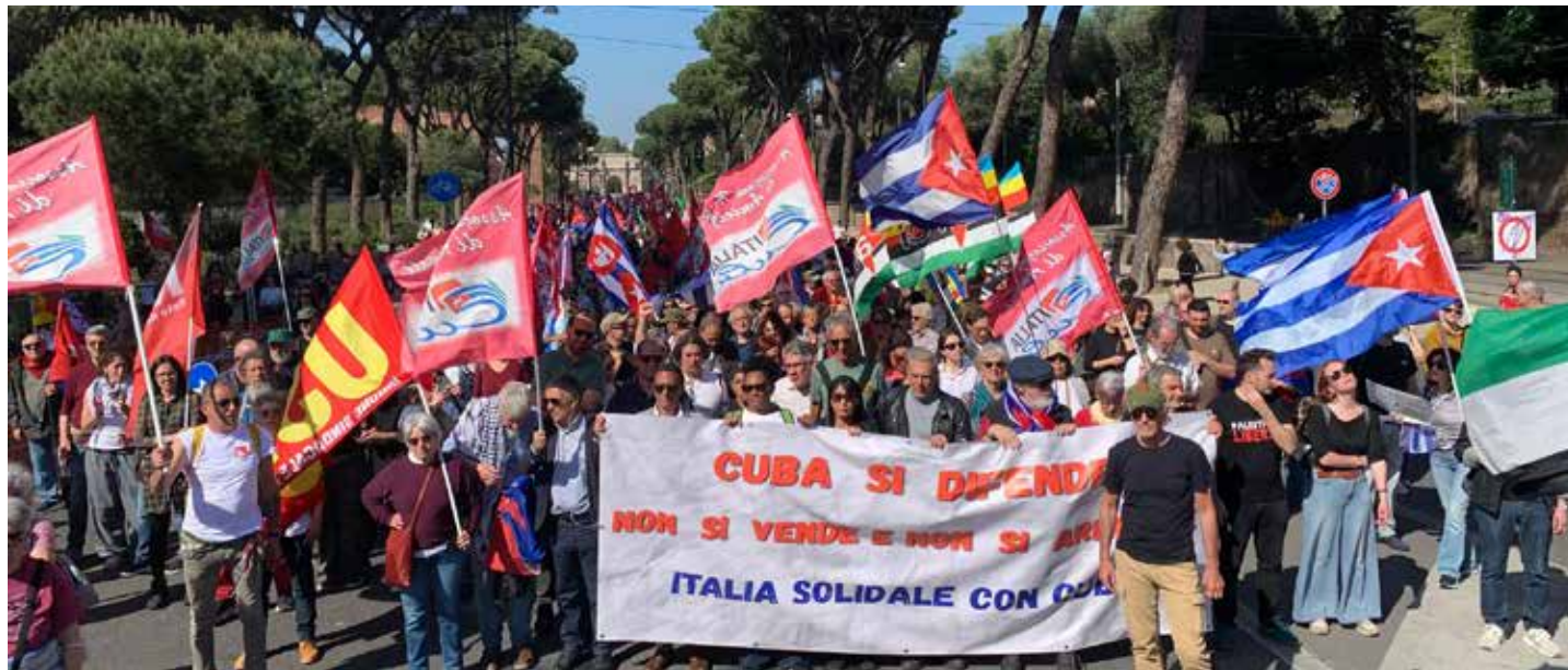
Roma, 11 aprile 2026. Manifestazione nazionale di solidarietà contro il blocco di Cuba

L'altra parola d'ordine che ha contraddistinto l'avvio della mobilitazione che si è concre-