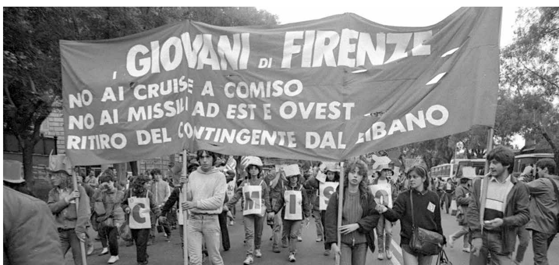
Roma, 22 ottobre 1983. Manifestazione nazionale antimperialista contro i missili a Comiso. Due momenti della partecipazione del Comitato Giovani di Firenze promosso dal PMLI, nato sulla base dell'esperienza delle lotte studentesche del Comitato 6 Ottobre