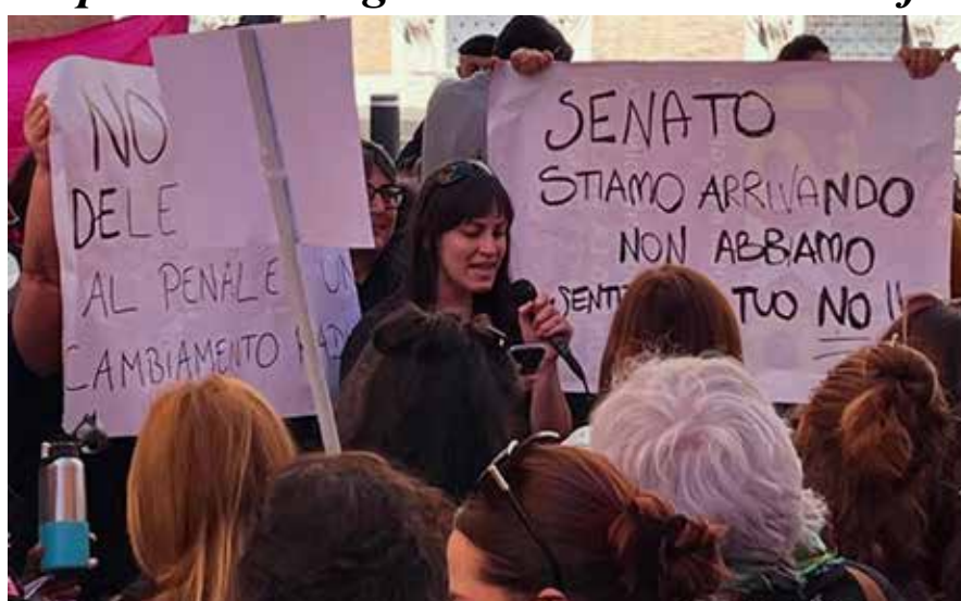
Roma, 8 aprile 2026. Presidio manifestazione davanti la sede del Senato contro il Ddl Bongiorno

È quasi impossibile darne un resoconto completo, colpa del silenzio connivente della stampa di regime col governo di Mussolini in gonnella Meloni, che ha ignorato quasi totalmente le manifestazioni a eccezione del presidio di Roma sotto il Senato in concomitan-