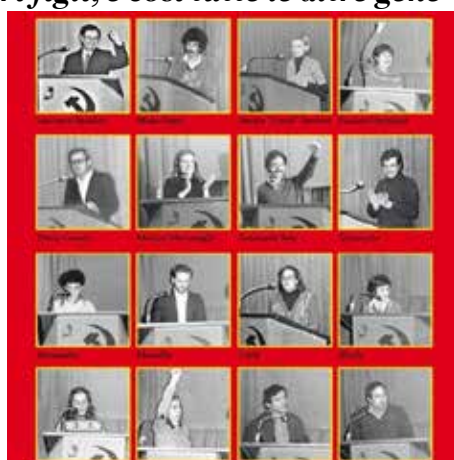
I fondatori del PMLI

Estratto dal Rapporto politico pronunciato a nome della Direzione nazionale dell'OCBI m-l al Congresso di fondazione del PMLI, 9 Aprile 1977