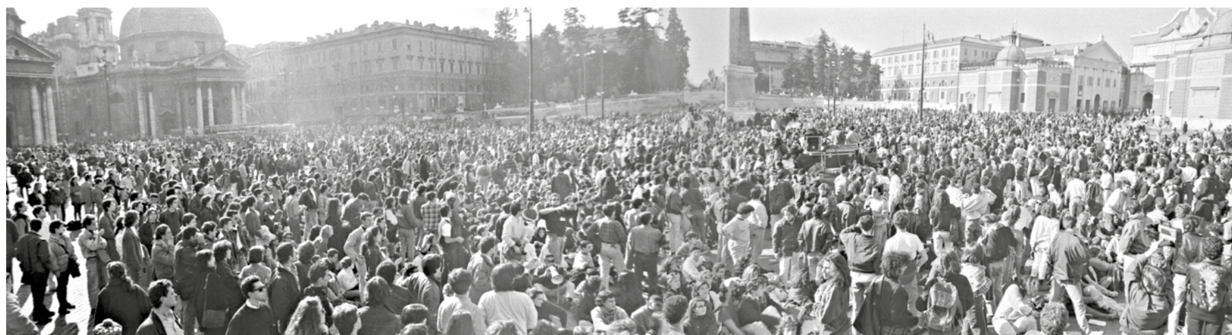
Roma, 3 febbraio 1990. Una veduta di Piazza del popolo gremita di studentesse e studenti a conclusione della grande manifestazione nazionale contro la controriforma universitaria e la privatizzazione e la selettività della scuola. Il PMLI appoggiò la manifestazione e vi partecipò con una capillare diffusione de Il Bolscevico n.4

muoverne noi, naturalmente dopo esserci conquistati una base che ci permetta di renderli effettivamente di massa; tali collettivi devono essere composti non solo dai militanti e simpatizzanti del Partito, ma anche da tutti gli studenti che condividono le nostre proposte. In questi casi bisogna fare molta attenzione a non commettere l'errore di trasformare il collettivo da noi creato in una brutta copia di un'organizzazione di Partito, bisogna invece utilizzare parole, azioni, simbologie e atteggiamenti consoni a un organismo di massa. Per noi, però, l'assemblea generale, oltre a rappresentare il contraltare degli