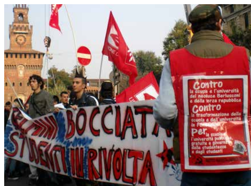
Milano. Manifestazione studentesca, 10 ottobre 2008

attuali organi di governo scolastici e universitari, deve essere considerata la massima organizzazione unitaria delle studentesse e degli studenti in cui possono esprimersi anche i collettivi e ogni altra organizzazione studentesca, ma alla fine le decisioni dell'assemblea devono essere vincolanti per tutti.