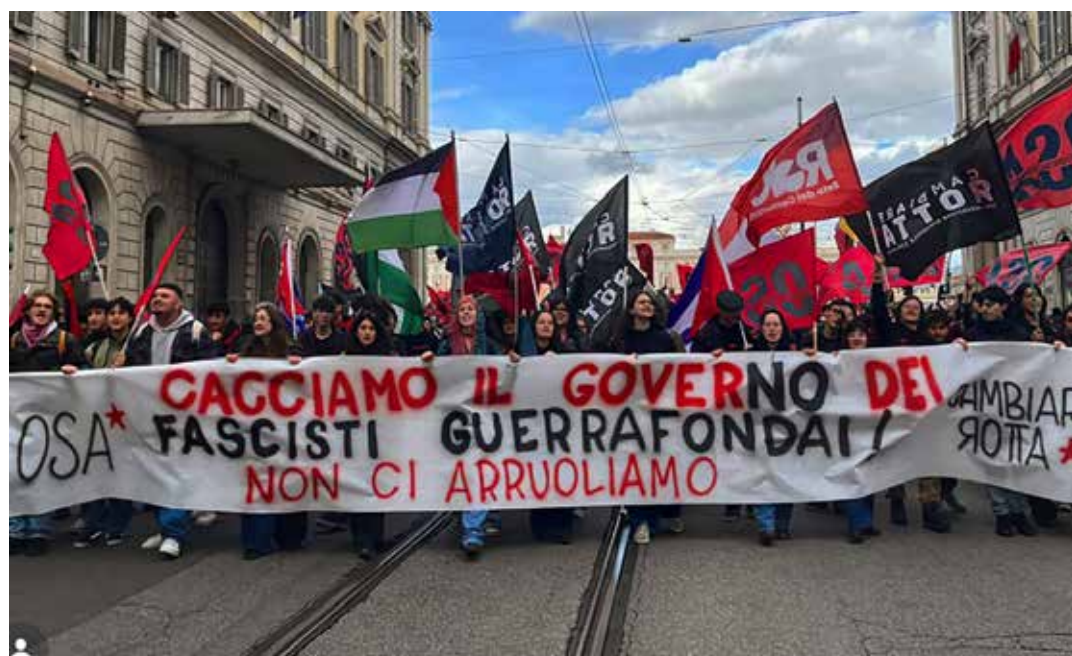
Roma, 14 marzo 2026. Manifestazione per il NO al referendum sulla giustizia