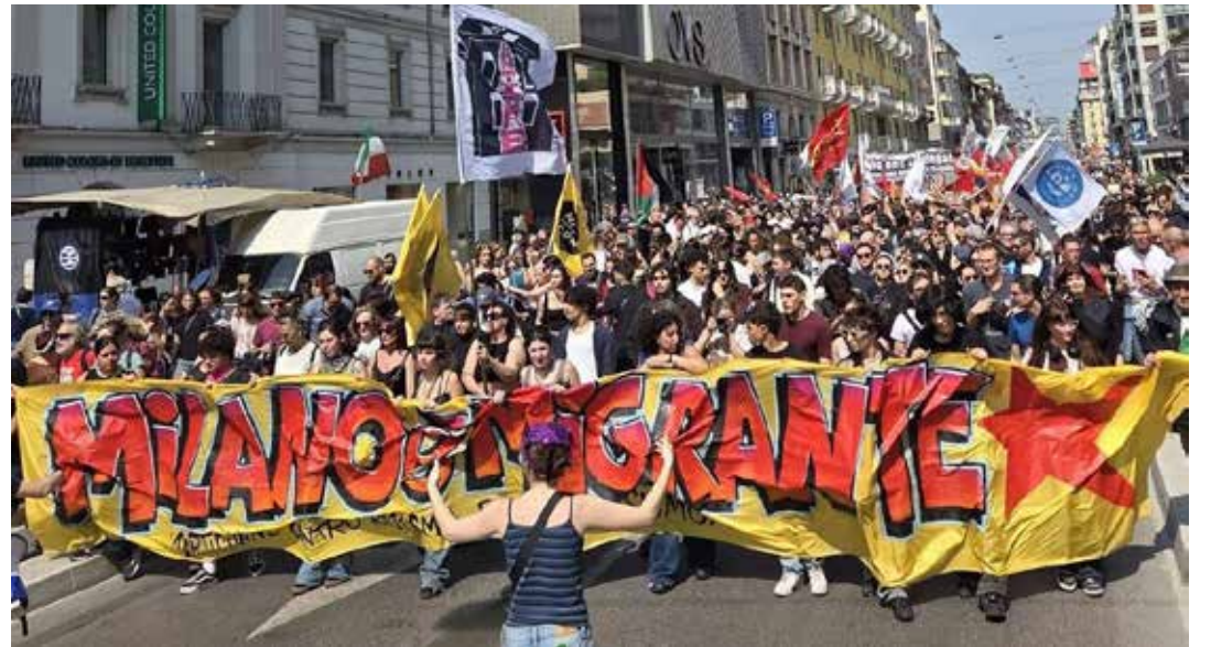
Milano, 18 aprile 2026. Aspetti del combattivo corteo contro l'adunata xenofoba organizzata da Salvini

Dalle 14, una vasta mobilitazione antifascista e antirazzista ha animato Milano: la misera adunata di piazza Duomo è stata progressivamente accerchiata da diversi presidii che sono confluiti in un unico, imponente corteo di 30mila partecipanti. La manifestazione è avanzata fino a sfiorare la "zona rossa" blindata da un ingente schieramento di polizia in tenuta antisommossa affinché la contestazione non giungesse in Duomo. Appena in via Borgogna i manifestanti hanno provato ad avvicinarsi alla zona rossa blindata dalle forze di polizia sono immediatamente stati aggrediti e respinti da un muro d'acqua sparato sulle prime file dagli idranti. Alla sacrosanta reazione degli antifascisti sono seguiti il lancio di fumogeni e cariche poliziesche per impedire che la contestazione di massa potesse in qualche modo farsi sentire in