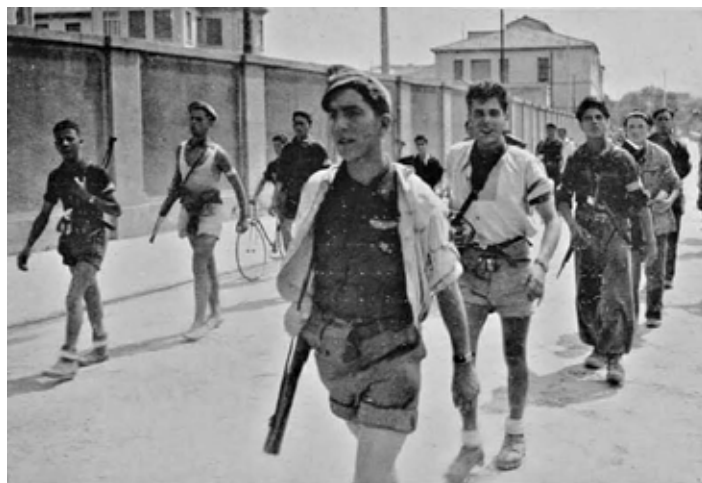
Gruppi di partigiani entrano a Livorno liberata il 19 luglio 1944

Così come non cambiano di una virgola il suo progetto di conquistare la testa dell'Internazionale nera dei fascisti del XXI secolo. Progetto non indebolito dai recenti attacchi di Trump, "deluso" perché non l'aiuta abbastanza nella guerra all'Iran, né dalla caduta del suo principale alleato europeo, Orban, ma forse addirittura rafforzato: sia all'interno, potendosi fregiare di una maggiore "indipendenza" da Trump rispetto al suo alleato e rivale Salvini, con gli elogi perfino della sua principale sfidante dell'opposizione, Elly Schlein; sia