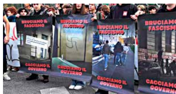
Roma, 14 novembre 2025. Manifesti contro il fascismo durante il No Meloni day