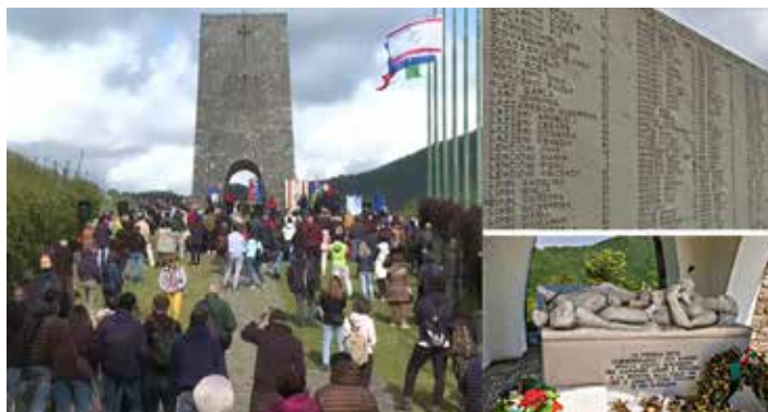
Il monumento alle vittime dell'eccidio nazifascista di Sant'Anna di Stazzema del 12 agosto 1944. In alto a destra la lapide con i nomi delle 560 vittime e in basso la tomba custodita alla base del monumento

"Ancora più grave è che tutto questo avvenga mentre si av-