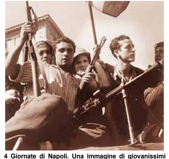
4 Giornate di Napoli. Una immagine di giovanissimi combattenti per la cacciata dei nazifascisti dalla città (settembre 1943)

base continua a essere usata intensamente per la logistica di supporto alla guerra all'Iran); dichiarando "inaccettabile" l'attacco di Trump al papa (ma in ritardo di 10 ore, e solo per non inimicarsi il voto cattolico); e di sospendere il "rinnovo" del memorandum di collaborazione militare con Israele, ma solo per gli attacchi israeliani ai soldati italiani della missione dell'Onu in Libano, e dopo oltre due anni di assordante silenzio sul genocidio di Gaza, nonché di rifiuto di qualsiasi sanzione e anzi continuando a inviare armi a Israele. Silenzio peraltro condiviso vergognosamente anche dal "nonno buono" degli italiani, Mattarella.