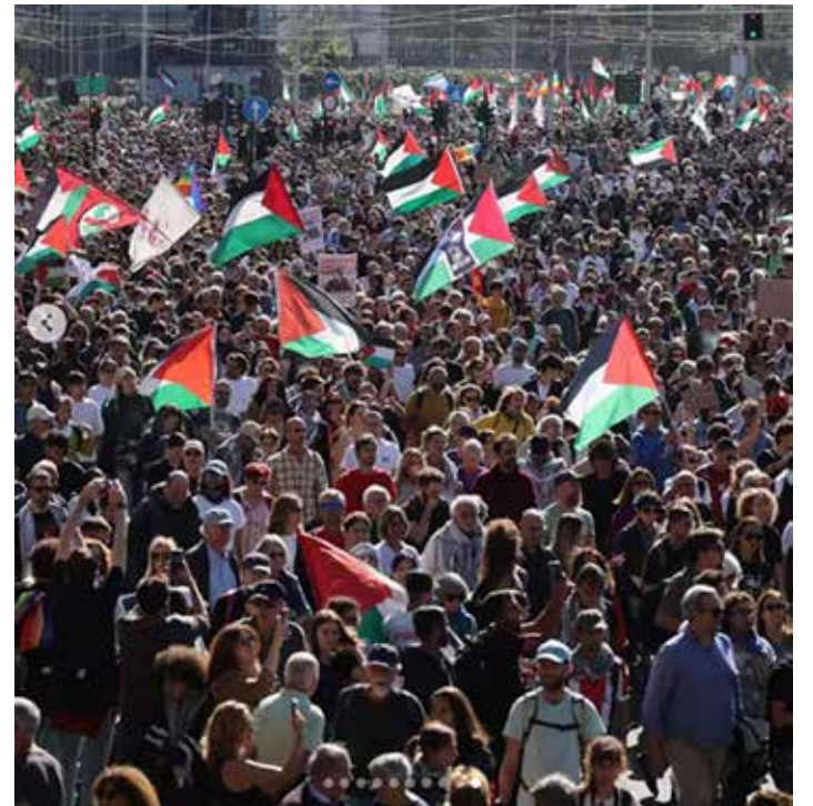
Roma, 4 ottobre 2025. La grande manifestazione antimperialista per la Palestina e Gaza dopo lo sciopero generale contro il blocco della Sumud Flotilla

per portarle a terra e sottoporle a violenze fisiche e psichiche: dalle ore passate sotto al sole seduti sull'asfalto bollente alle percosse, dall'assenza di acqua potabile alla privazione del sonno, dai gesti di minaccia e di scherno, ai pugni, le ginocchiate, gli schiaffi per svegliare chi riusciva ad addormentarsi nelle celle minuscole e prive di letti dove erano stati sistemati gli attivisti. "L'hanno trascinato per il collo e buttato per terra - ha raccontato un testimone riferendosi a quanto accaduto a un'altra prigioniera non italiana - le hanno sputato addosso, le hanno messo la bandiera israeliana e le hanno chiesto di can-