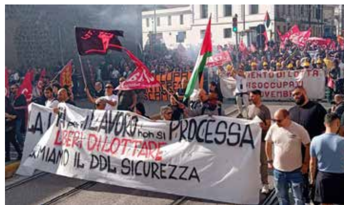
Napoli, 28 ottobre 2024. Manifestazione dei disoccupati per il lavoro e contro il ddl "sicurezza"