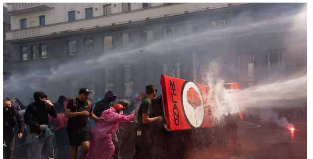
Gli idranti di Piantadosi contro i manifestanti antifascisti