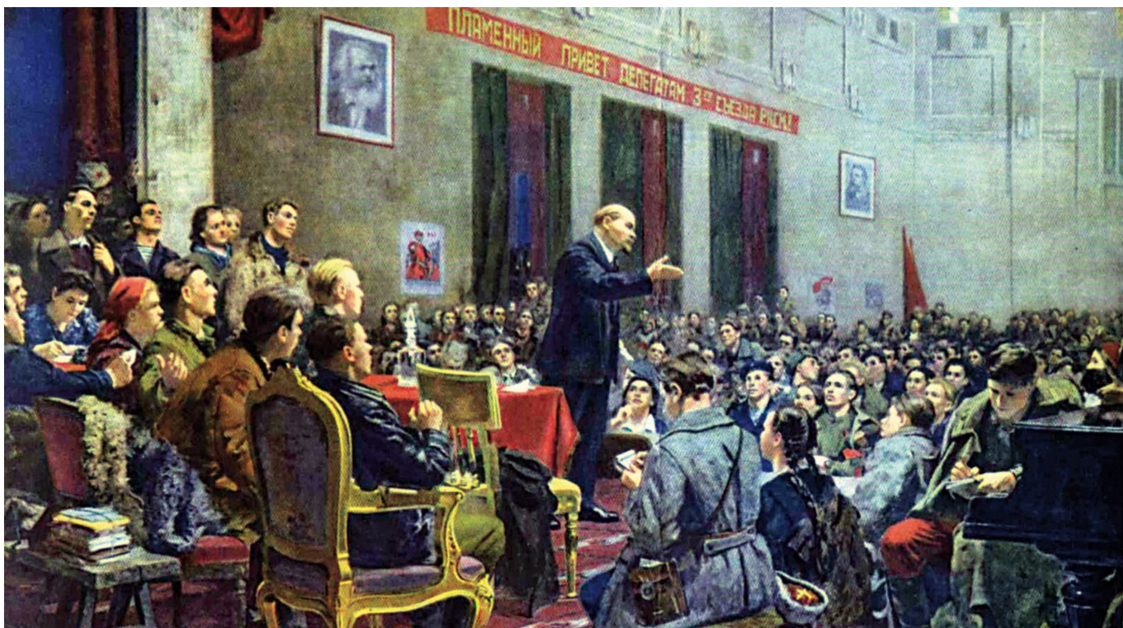
Lenin parla al Terzo congresso dell'Unione della Gioventù Comunista Russa con un importante intervento dal titolo: "I compiti delle Unioni della Gioventù". Mosca, 2 ottobre 1920. L'Unione della Gioventù Comunista Russa era stata fondata un anno dopo la vittoria della Rivoluzione socialista d'Ottobre, il 29 ottobre 1918

(Lenin, Rapporto sulla Rivoluzione del 1905, gennaio 1917, sta in Lenin, Opere complete, Ed. Riuniti, vol. 23, pagg.253-254)