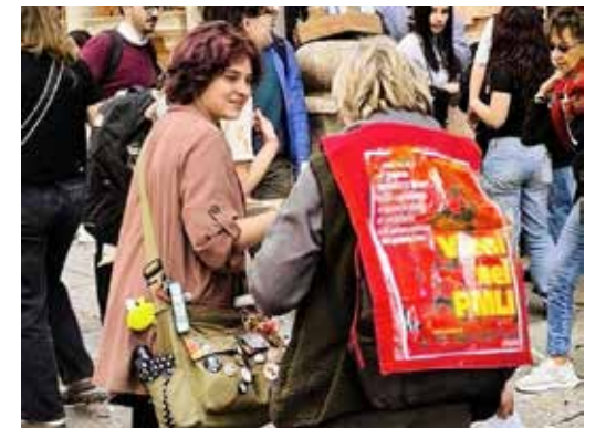
Milano, 20 aprile 2026. Alcuni momenti della diffusione dell'Editoriale di Scuderi davanti all'Università Statale di Milano