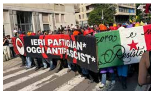
Milano, 18 aprile 2026. Momenti del corteo di "Milano in Movimento" durante la manifestazione contro l'adunata xenofoba antimigranti di Salvini