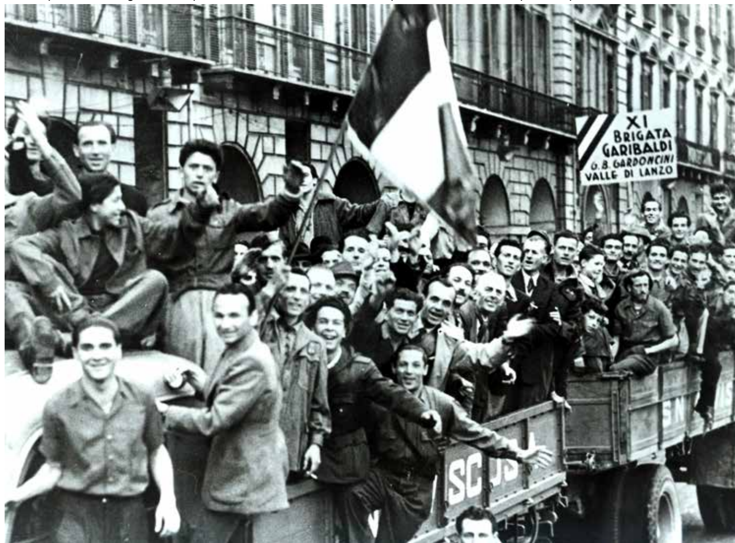
I gruppi partigiani vittoriosi sfilano a Milano dopo la fine del fascismo e la vittoria del 25 Aprile 1945. Sui camion partigiani di tutte le età, in maggioranza giovani

Per questo sta cercando adesso di rifarsi, a buon mercato, un'immagine di maggiore autonomia dai due, come ha fatto negando l'uso di Sigonella a due cacciabombardieri Usa (mentre insieme ad Aviano quella