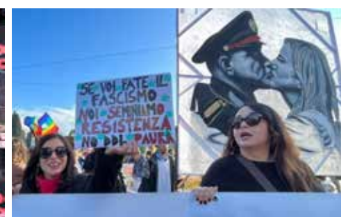
Roma, 14 dicembre 2024. Manifestazione nazionale contro il Ddl "Sicurezza"