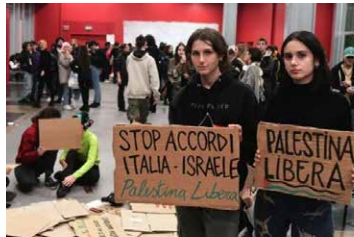
Nella lotta contro il genocidio a Gaza, rivendicata la rottura definitiva degli accordi tra le varie università italiane e Israele

La decisione di Roma di sospendere l'accordo è stata recepita da Tel Aviv senza particolari difficoltà. "Non influirà sulla nostra sicurezza, ha commentato il ministro degli Esteri israeliano al portale Ynet. Abbiamo un memorandum