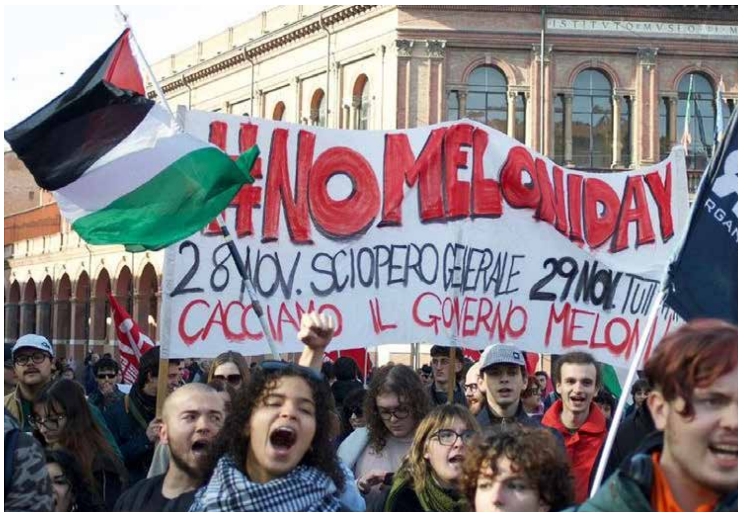
Bologna, 14 novembre 2025. No Meloni day