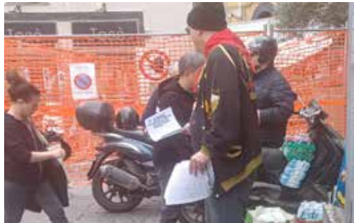
Napoli, 16 aprile 2026. Volantinaggio dell'Editoriale alla stazione di Montesanto della Cumana