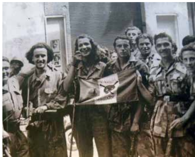
1944. Un gruppo di sabotatori della Brigata partigiana "Julia" che operava nella zona di Borgotaro (Parma)