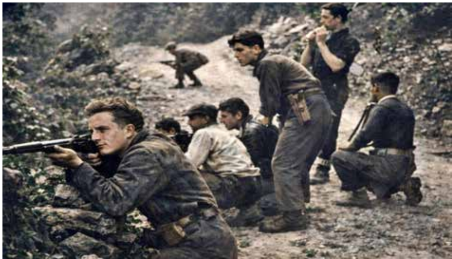
Partigiani in azione durante la difesa della Repubblica partigiana dell'Ossola (10 settembre-23 ottobre 1944)