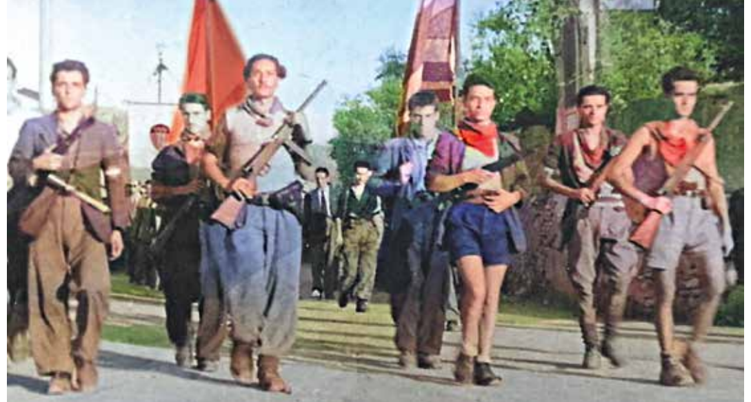
Partigiani sfilano a Prato liberata il 6 settembre 1944

Come ha indicato il Segretario generale e Maestro del PMLI, Giovanni Scuderi, alla VII Sessione del Comita-