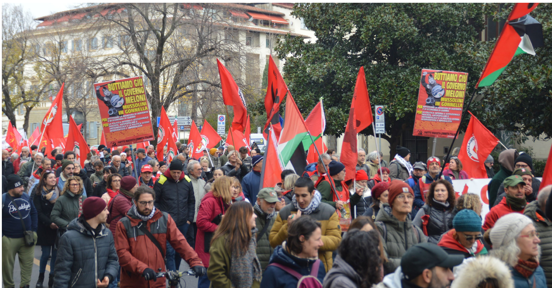
Firenze, 12 dicembre 2025. Sciopero generale indetto dalla Cgil contro la finanziaria del governo Meloni

La legge Fornero è stata peggiorata ed è stata aumentata l'età pensionabile, sulla sicurezza solo lacrime di cocodrillo: con il governo Meloni i morti sul lavoro sono aumentati del 15%, ma si vogliono comunque promulgare nuovi "scudi" per assicurare impunità alle aziende appaltanti. Per il rinnovo dei contratti del pubblico impiego sono state stanziolate risorse che non recuperano nemmeno la metà dell'inflazione, si scippa il Tfr dei lavoratori e con il silenzio/assenso lo si destina ai fondi previdenziali. Ai lavoratori e alle masse popolari non si è concesso nulla,