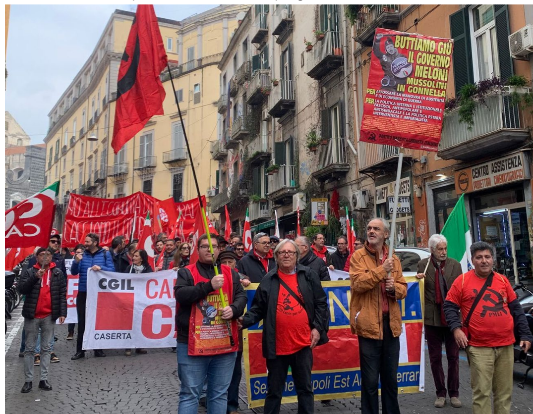
Napoli, 12 dicembre 2025. Sciopero generale indetto dalla Cgil contro la finanziaria del governo Meloni

Ma come si fa a cambiare radicalmente la società, e con che cosa sostituire questo marcio sistema di sfrut-