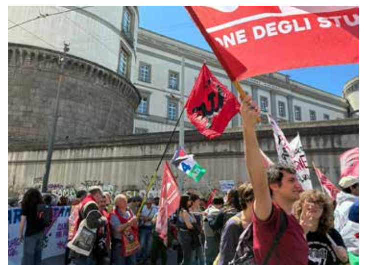
Napoli, 25 Aprile 2026. Un momento della manifestazione per la Liberazione dal nazifascismo. Al centro la delegazione del PMLI

Il corteo veniva aperto dai ragazzi e dalle ragazze antifasciste di Napoli e provincia con un bello striscione e slogan che ricordavano i partigiani; tantissime le bandiere palestinesi sventolavano o ricoprivano a mo' di mantello i giovani antifascisti. Di seguito si vedevano diversi centri sociali della città, in prima fila il Laboratorio Iskra, seguito dal sindacato Si Cobas, e dopo Potere al Popolo, l'Usb Campania con alla testa la sua direzione provinciale e regionale, il centro sociale "Je so Pazz", poi diversi militanti di "Officina 99", cui seguiva un folto e qualificato spezzone della Comunità palestinese, quello del Partito dei Carc, a cui abbiamo direttamente portato la