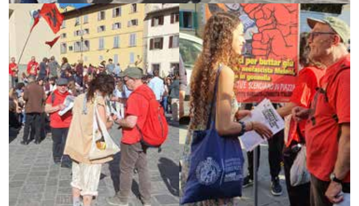
Alcuni momenti della proficua diffusione del volantino sul 25 Aprile e dell'Editoriale per l'Anniversario del PMLI

toria della lotta di massa, supportata con convinzione dal PMLI.