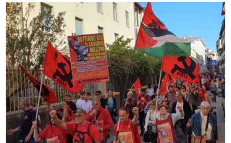
Firenze, 25 Aprile 2026. Corteo organizzato da "Firenze antifascista". In primo piano la delegazione del PMLI