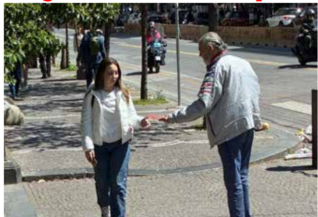
Napoli, 23 aprile 2026. Diffusione del volantino di Proselitismo del PMLI