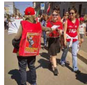
Momenti della diffusione e dell'accoglienza del volantino del PMLI sul 25 Aprile e di quello con l'Editoriale di Scuderi alle ragazze e ai ragazzi

Il PMLI, per la qualità politica delle parole d'ordine e per le canzoni partigiane proposte ("Bella Ciao", "Fischia il Vento", "La Brigata Garibaldi"), ha saputo coinvolgere manifestanti di ogni età, in particolar modo lavoratrici e lavoratori che sfilavano nello spezzone della CGIL, che hanno sia cantato che ripetuto in coro gli slogan lanciati dai nostri compagni: "La Resistenza non si cancella brilla forte è la nostra stella", "Ieri, oggi e anche domani, gloria eterna ai partigiani", "Per conquistare un grande domani dobbiamo fare come i partigiani", "I nazifascisti e chi li protegge, non vanno finanziati ma messi fuorilegge", "I repubblicani di Mussolini, sian sempre ricordati come degli assassini", "Il futuro è il socialismo, spazziamo via il capitalismo", "Stato fascista di polizia, decreto sicurezza spazziamolo via", "L'unica sicurezza da garantire, è quella sul lavoro per non morire", "Governo Meloni, non ne possiamo più, dalla piazza buttiamolo giù", "Premierato da rifiutare, forma di fascismo che non deve passare", "No no no, Autonomia differenziata, no no no", "Basta, basta, basta spese militari, vogliamo salari alti, scuole e ospedali", "Ma quale pacifista ma quale riformista, Unione europea gabbia imperialista", "Cittadinanza agli immigrati, con pari diritti, e non discriminati", "Ucraina libera,