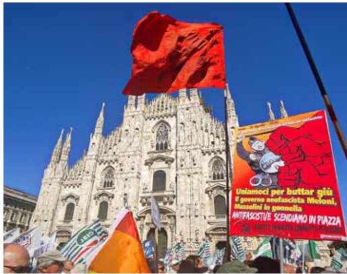
Milano, Piazza del Duomo. Manifestazione per 81°Anniversario della Liberazione dal nazifascismo. In primo piano il manifesto del PMLI per il 25 Aprile 2026

Dichiarazioni giudicate dal neofascista Giubilei "inquietanti (già pronunciate durante il con-