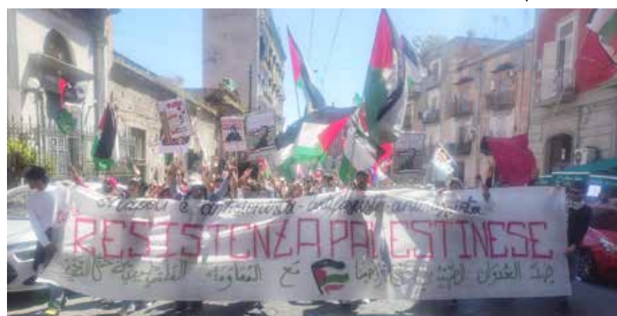
Napoli, 25 Aprile 2026. Uno degli striscioni in corteo che ha legato antifascismo e antisionismo e la Resistenza italiana alla Resistenza palestinese

Tutte le compagne, i compagni, i simpatizzanti e gli amici (che ringraziamo) mobilitati dal Partito per onorare in maniera militante questo 81° anniversario della Liberazione hanno dato prova di grande unità di lotta, non si sono risparmiati (molti di loro hanno partecipato sia alle manifestazioni istituzionali della mattina che a quelle militan-