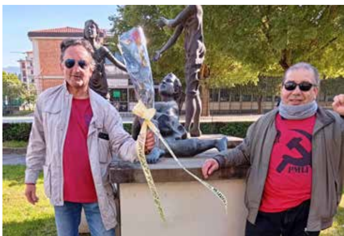
25 Aprile 2026, Borgo S. Lorenzo (Firenze). Prima della celebrazione della Liberazione, i nostri compagni hanno deposto un bel fiore rosso sul monumento alla Resistenza in onore ai Partigiani

tello bifacciale con i manifesti del PMLI del 25 Aprile e del 1° Maggio. Un antifascista ha apprezzato affermando: "Questo manifesto è bestiale".