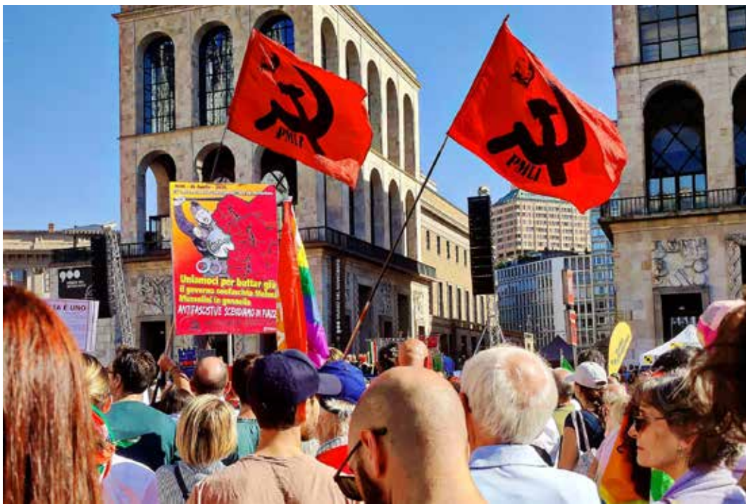
Milano 25 Aprile 2026. In Piazza Duomo durante i comizi conclusivi

Una campagna repressiva e intimidatoria studiata a tavolino che ha coinvolto anche il PMLI e il suo organo "Il Bol-