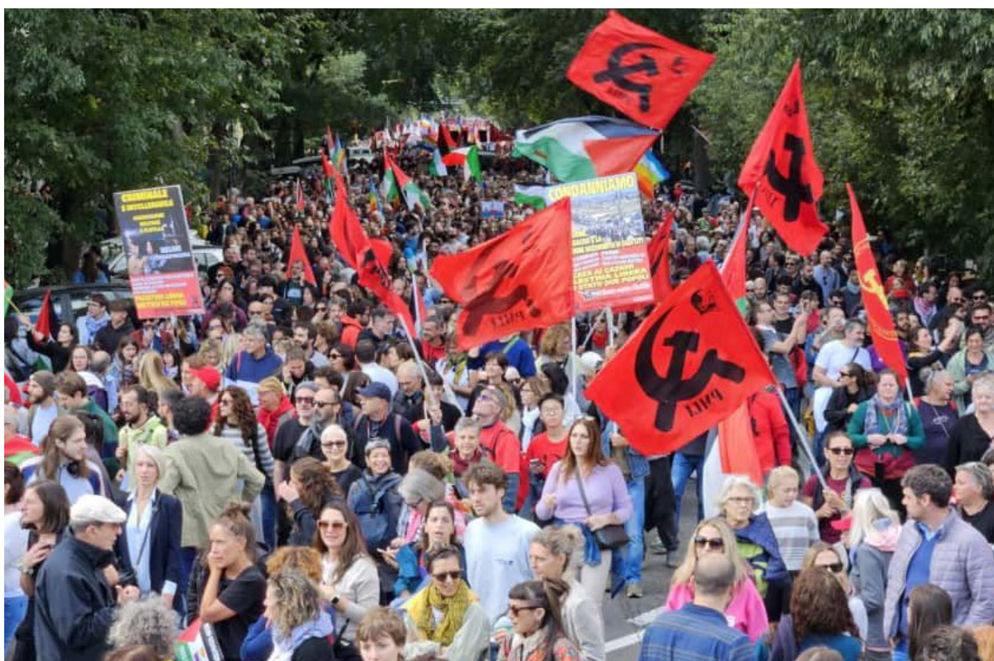
Firenze, 3 ottobre 2025. La grande e combattiva manifestazione per lo sciopero indetto dai sindacati di base e Cgil per la Palestina libera e la Sumud Global Flotilla