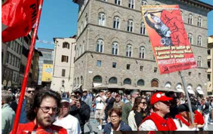
Firenze, 25 Aprile 2026, Piazza della Signoria. Altri due momenti della rossa presenza del PMLI con il manifesto in bella vista

vamo per le foto c'era sempre qualche ragazza o ragazzo che si affiancava per fotografarci a sua volta.