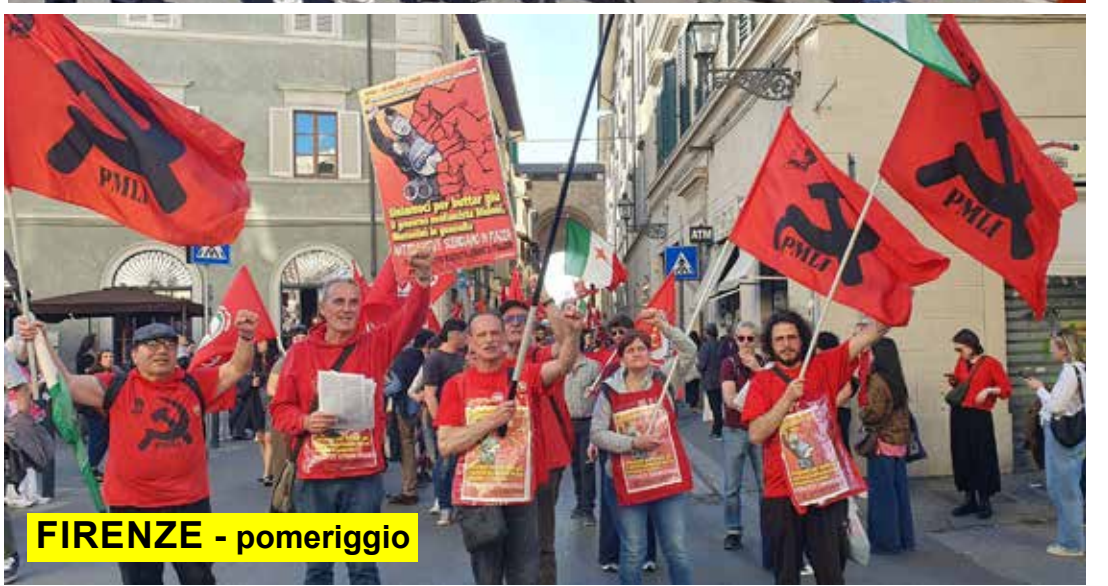
FIRENZE - pomeriggio