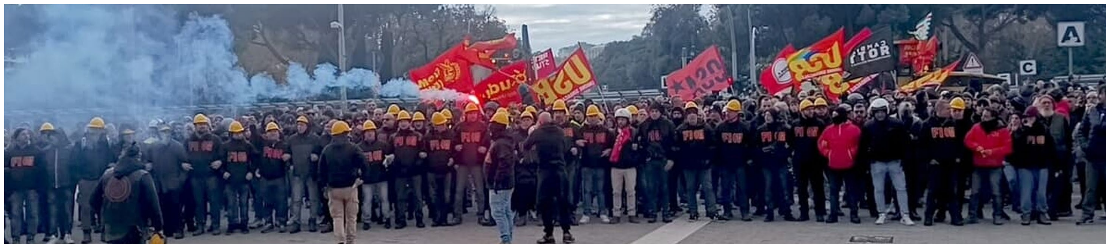
Genova, 4 dicembre 2025. Il compatto e massiccio "muro" dei lavoratori dell'Ilva in lotta schierato nel piazzale della stazione di Genova Brignole. Una lotta che ha unito Fiom, sindacati non confederali e masse studentesche in una unica mobilitazione per la difesa del posto di lavoro e l'esistenza della stessa ILVA.

ni. Una vittoria ottenuta soprattutto grazie al contributo dei giovani e degli astensionisti di sinistra. Era il momento buono per non dargli tregua,