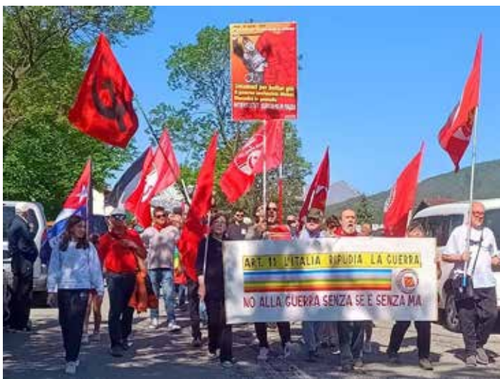
25 Aprile 2026, Lince di Donato (Biella). Un momento del combattivo corteo che si dirige verso il monumento partigiano per la celebrazione della Liberazione dal nazifascismo

Per Biella la celebrazione del 25 Aprile, giornata della Liberazione dal nazifascismo assume un significato ancora più profondo, poiché la città venne liberata già il 24 aprile grazie all'azione decisa e organizzata delle formazioni partigiane, che strapparono il territorio alla teppaglia nazifascista con un giorno di anticipo rispetto al resto del Paese.