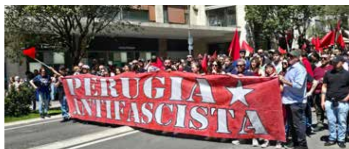
Il corteo organizzato da Perugia Antifascista per il 25 Aprile 2026