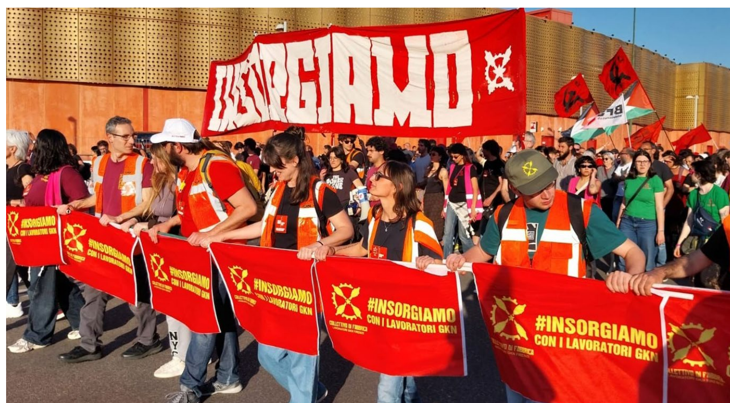
Campi B. (Firenze), 11 aprile 2026. La rossa e compatta linea di apertura del corteo delle lavoratrici e dei lavoratori del Collettivo ex GKN contro il riarmo, i licenziamenti e per la fabbrica socialmente integrata. Dietro si notano le bandiere del PMLI con quelle della Palestina portate dalla delegazione del PMLI di Prato e della provincia di Firenze

sto governo neofascista e le sue politiche econo- miche e sociali, sia inter- ne che internazionali. I sindacati, in particolare quelli che raccolgono la parte più consistente del proletariato, compreso