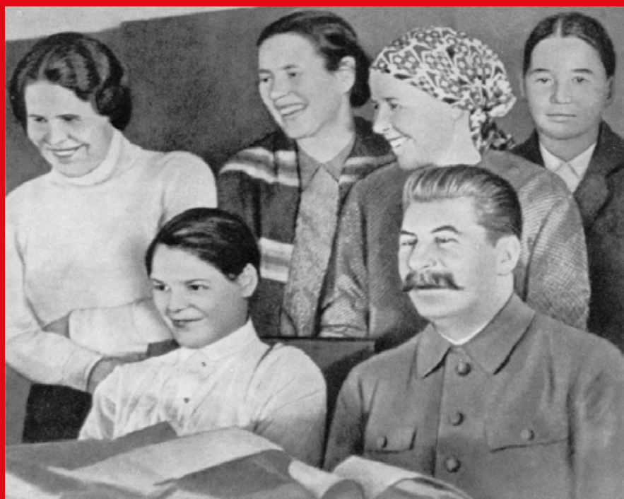
Stalin al congresso delle donne colcosiane d'avanguardia. Mosca, 1935

Soltanto la vita colcosiana poteva attribuire al lavoro un ruolo onorevole, solo questa poteva far sorgere delle autentiche eroine del villaggio. Soltanto la vita colcosia-