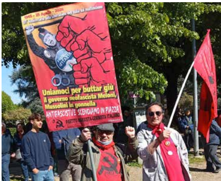
Borgo S. Lorenzo (Firenze). Un momento della manifestazione del 25 Aprile 2026 durante la quale sono state tenute bene in vista la bandiera e il manifesto del PMLI

Il PMLI, tramite l'Organizzazione di Vicchio del Mugello, è stata l'unica forza politica presente ufficialmente con le proprie insegne. I compagni indossavano maglietta e fazzoletto del PMLI, le spille Maestri e PMLI e il fazzoletto ANPI e hanno portato in piazza la bandiera del Partito, il car-