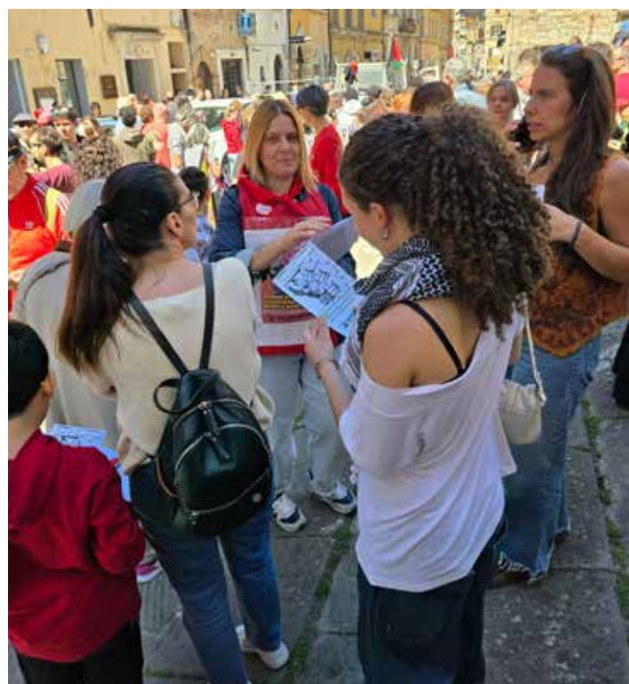
Perugia, 25 Aprile 2026. In questa foto e nelle altre momenti della diffusione del volantino del PMLI con il manifesto del 25 Aprile e dell'Editoriale aper per il 49° Anniversario del Partito