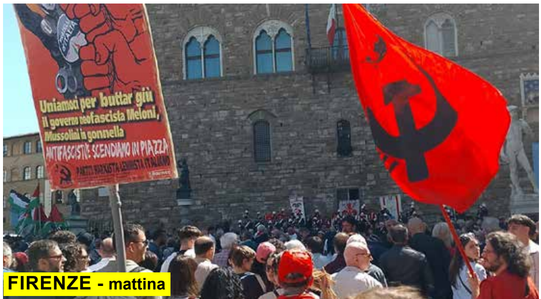
FIRENZE - mattina