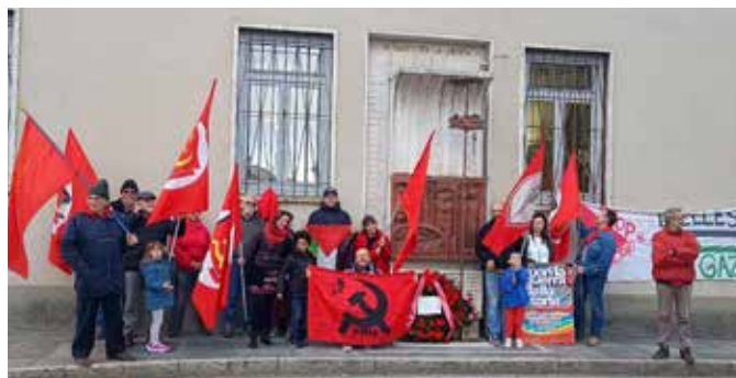
Biella, 2026. Manifestazione davanti al monumento partigiano di piazza Martiri della Libertà per Gaza e contro il genocidio palestinese

In questo senso l'antifascismo si pone in netto contrasto con politiche e visioni che comprimono i diritti sociali e civili e alimentano divisioni tra le masse popolari. Particolarmente grave è inoltre la polemica dei giovani di FdI sulla presenza, nei cortei del 25 Aprile, di bandiere rosse con falce e martello e della Palestina. Si tratta di una posizione che denota il palese tentativo revisionista di riscrivere la storia della Resistenza e della solidarietà internazionalista. Una parte rilevante dei partigiani che contribuirono alla Liberazione nel Biellese, si riconosceva infatti negli ideali comunisti e combatteva sotto