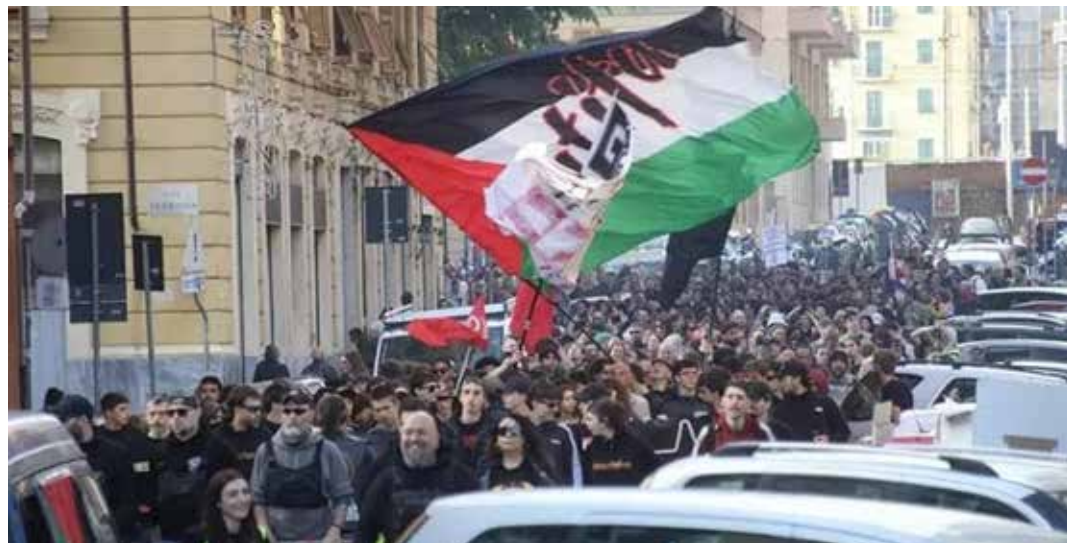
Genova 25 Aprile 2026. Corteo per la Liberazione organizzato da "Genova Antifascista"

La manifestazione indetta dall'ANPI e dalle istituzioni, si è svolta al mattino del 25 Aprile. Concentramento in via Cadorna (presso la stazione ferroviaria di Genova Brignole). Presenti oltre diecimila antifascisti, accompagnati dalla Filarmonica Sestrese che ha suonato musiche riconducibili all'eroica esperienza partigiana. Il corteo ha proseguito per via XX Settembre sostando in