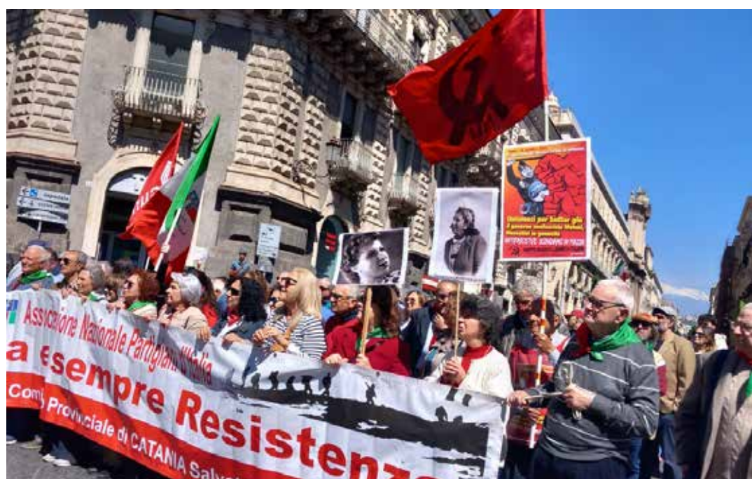
Catania. Corteo per il 25 Aprile 2026

(dove all'interno una lapide ricorda i partigiani catanesi caduti durante la Resistenza) il corteo intona Bella ciao. I promotori: "È sempre stato un giorno di memoria, di impegno e di festa, ma oggi la gioia è strozzata da un mondo in guerra, da potenti che distruggono