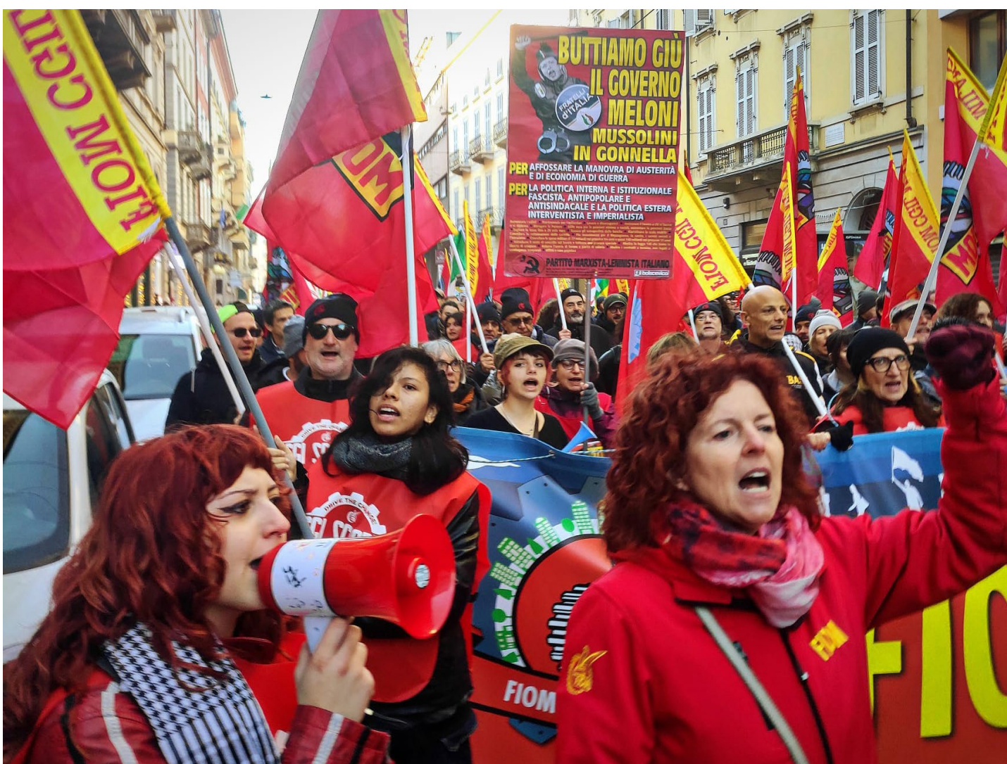
Milano, 12 dicembre 2025. Sciopero generale indetto dalla CGIL contro la finanziaria del governo Meloni

E poi le controriforme, da quella federalista sull'"autonomia differenziata", alla "madre di tutte le riforme", quella presidenzialista attraverso il premierato, punto centrale del programma