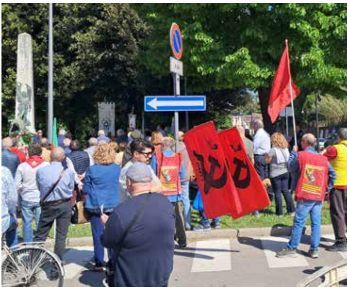
Fucecchio. Celebrazione al monumento dei caduti del 25 Aprile 2026

Anziché attaccare con forza il governo Meloni, denunciare ad esempio i fascistissimi "decreti sicurezza" approvati il giorno prima, ci si è richiamati all'unità nazionale, nel nome della Costituzione del 1948, tra