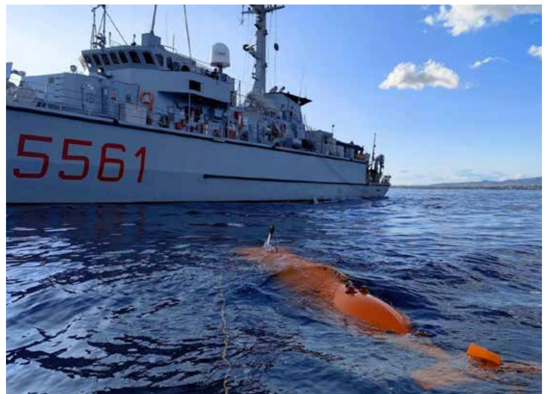
Il cacciamine RIMINI, che potrebbe essere fra quelli inviati nello stretto di Hormuz durante una azione di individuazione di ordigni

Un altro tradizionale paravento per giustificare alcune guerre imperialiste, sbandierate come "missioni di pace",