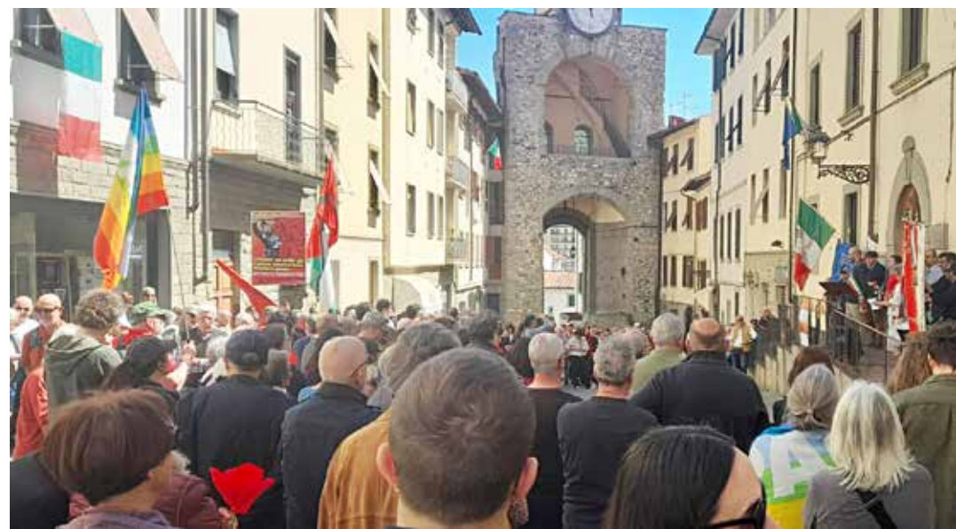
Pontassieve (Firenze). Celebrazione del 25 Aprile 2026. A sinistra si nota la presenza del PMLI con il manifesto contro il governo Meloni

Nel pomeriggio si è svolta la Street Parade "Resistenza a denti street" organizzata da collettivi indipendenti per protestare contro il restringimento delle libertà, la mancanza di spazi aggregativi, i recenti attacchi ai centri sociali.