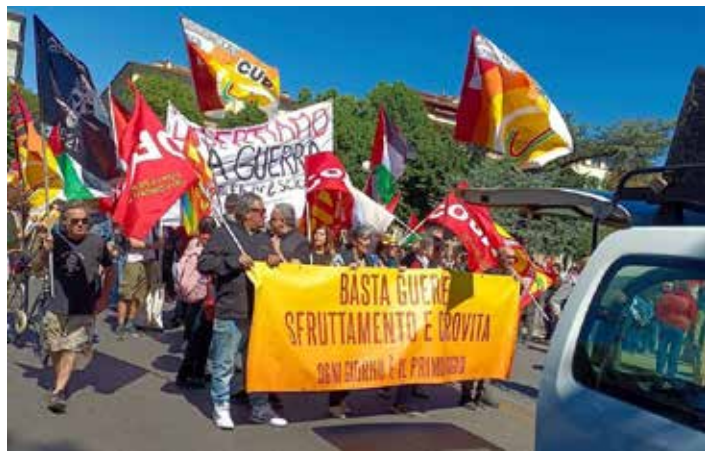
1°Maggio 2026. Un aspetto della manifestazione di Firenze

La manifestazione, caratterizzata da continue soste (vicino alla sede padronale di Confindustria, ad esempio), si è diretta verso la sede del Con-