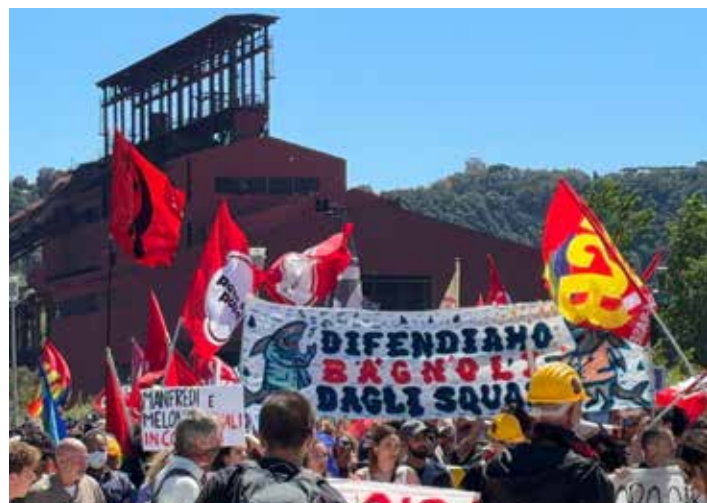
La conclusione della marcia per Bagnoli. Sullo sfondo dei resti degli stabilimenti dell'Italsider, Lo striscione denuncia i "pescecani" capitalisti nello sfruttamento dell'area