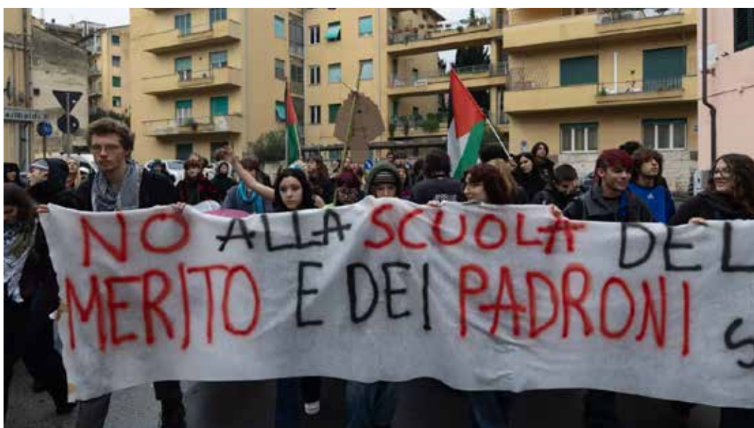
Pisa, 19 dicembre 2025. Gli studenti medi bloccano la città in un corteo spontaneo contro la riforma Valditara

A differenza di quanto avviene oggi, con la scelta della specializzazione alla fine del secondo anno, il decreto impone agli studenti appena usciti dalla terza media una rigida scelta del percorso di studi già a 14 anni, al momento dell'iscrizione alla prima superiore, che non possono più cambiare durante tutto il percorso di studi. Con l'aggravante che molti studenti già da quest'anno rischiano di essere inseriti a casaccio nei vari corsi di studio perché il “ministro del merito”, dall'alto della sua “competenza”, ha emanato il decreto dopo la chiusura delle iscrizioni e ha imposto la sua im-