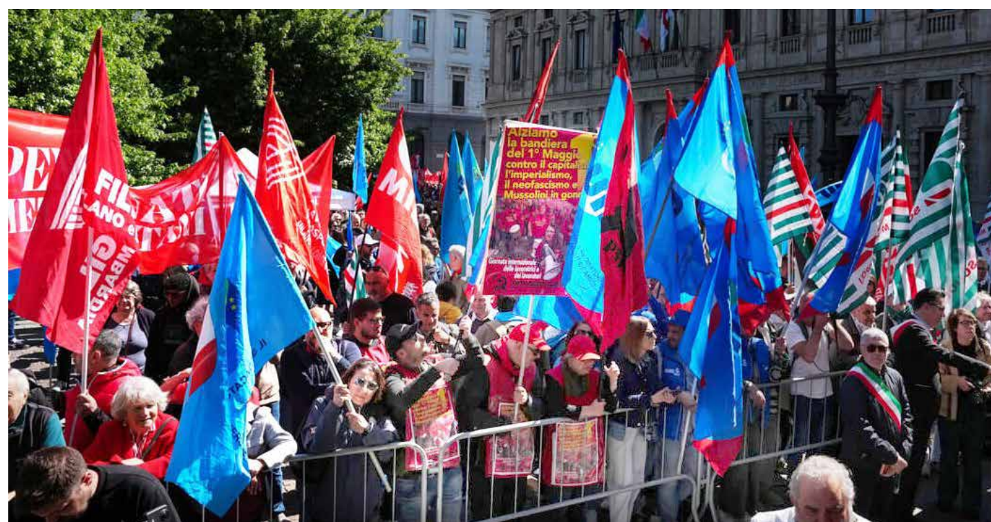
Milano, 1°Maggio 2026. Militanti e simpatizzanti del PMLI tengono alte le bandiere e il cartello del Partito per il Primo Maggio durante i comizi conclusivi in piazza della Scala

Cisl e Uil addirittura hanno espresso posizioni in linea con l'operato del governo. Basti vedere quanto successo con il cosiddetto "decreto lavoro", che da alcuni anni il governo vara in maniera propagandistica e provocatoria a ridosso del Primo Maggio. Un decreto che non incide di un euro sui salari dei lavoratori, dopo che l'unica misura positiva annunciata, quella sul rimborso degli arretrati in caso di ritardo della firma dei contratti, è stata eliminata. Il tutto si riduce ai soliti sgravi fiscali per le aziende, quasi un miliardo di euro. Nonostante