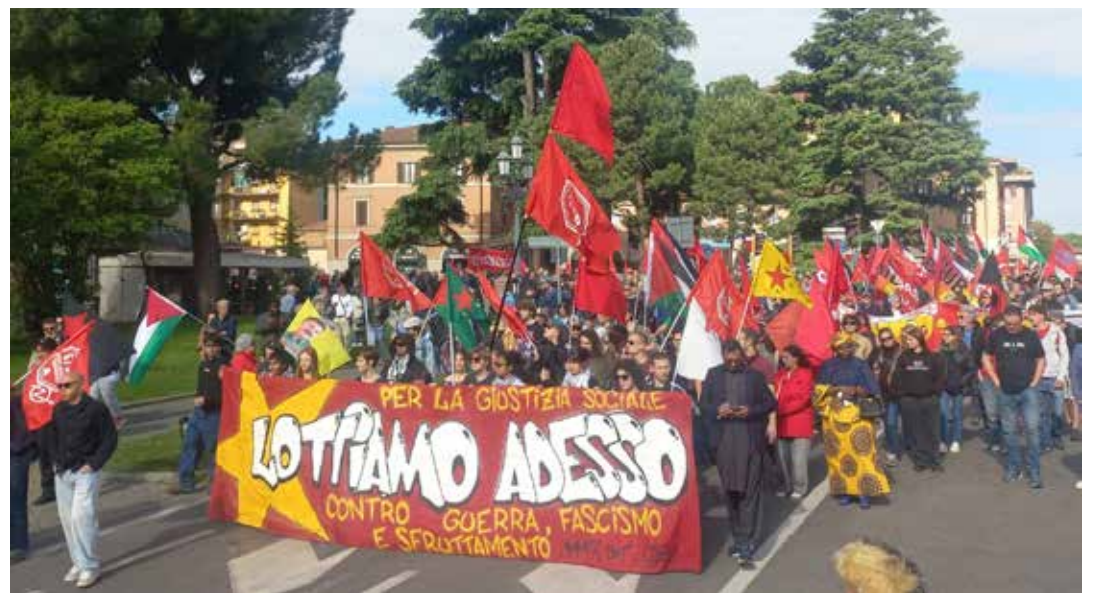
Brescia, 1°Maggio 2026