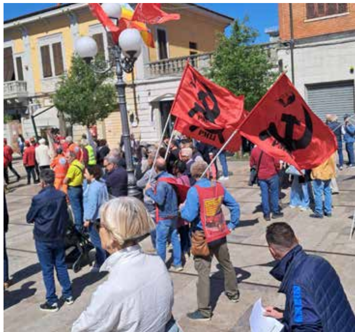
Due momenti della presenza del PMLI durante l'iniziativa del 1°Maggio 2026 a Fucecchio

ra mantengono posizioni ambigue e non condannano in maniera netta Israele.