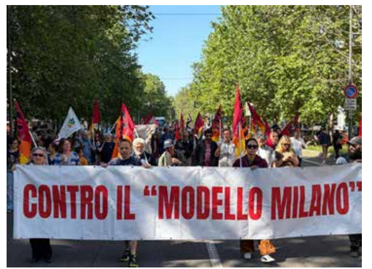
Lo striscione contro il "modello Milano" nel corteo della MAY-Day parade del pomeriggio del Primo Maggio

li di CGIL, CISL e UIL si sono guardati dal mettere sotto accusa le politiche urbanistiche e sociali della giunta comunale guidata dal sindaco PD Giuseppe Sala, a farlo ci ha pensato invece, nel pomeriggio, la MayDay Parade che ha posto al centro della contestazione il "modello Milano", indicato dai manifestanti come responsabile dell'aumento delle disuguaglianze sociali, della precarietà e della trasformazione della città in uno spazio sempre più esclusivo e subordinato agli interessi capitalistici immobiliari e finanziari.