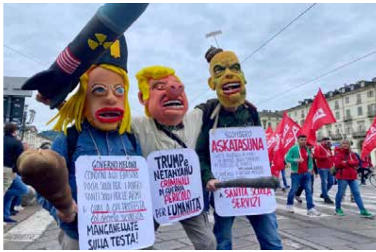
Le significative caricature di Meloni fascista, di Trump e Piantadosi con il manganello portati in corteo alla manifestazione sindacale per il Primo Maggio

svolto un presidio in Piazza Municipio. Un'iniziativa con le istituzioni locali e i rappresentanti di Cgil, Cisl e Uil. Nel pomeriggio la manifestazione nella zona Ovest della città, a cui hanno partecipato in più di 5mila, organizzata dai sindacati di base, collettivi e comitati, a cui hanno aderito alcuni partiti politici, tra cui il PMLI. I partecipanti hanno occupato temporaneamente i cantieri dell'ex Italsider di Bagnoli per protestare contro la lentezza del risanamento del vecchio centro siderurgico e contestare i maggiori responsabili, il neopodestà Gaetano Manfredi e il governatore della Campania Fico, entrambi eletti con il "centro-sinistra" o "campo largo" che dir si voglia (articolo a parte).