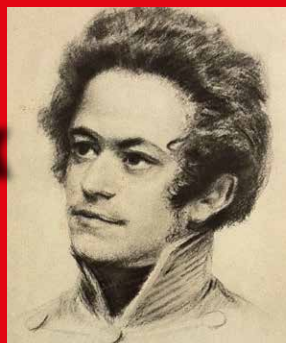
Marx studente in un ritratto del 1836

Ma la guida principale che ci deve soccorrere nella scelta di una professione è il bene dell'umanità, la nostra propria perfezione. Non