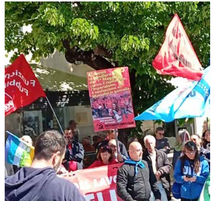
Barberino di Mugello (Firenze). In piazza, durante la celebrazione del Primo Maggio

Ha partecipato l'Organizzazione di Vicchio del Mugello del PMLI. I compagni militanti e amici del Partito, con le spille Maestri e Partito appuntate sul petto, maglietta PMLI e fazzoletto ANPI, hanno sventolato con orgoglio la bandiera del Partito e portato il cartello del 1° Maggio. Diffuse con successo alcune decine di copie di volantini con l'Editoriale per il 1° Maggio e dell'Appello ai giovani lanciato da Scuderi per il 49° del PMLI. In fin dei conti i simboli del Partito, i volantini con