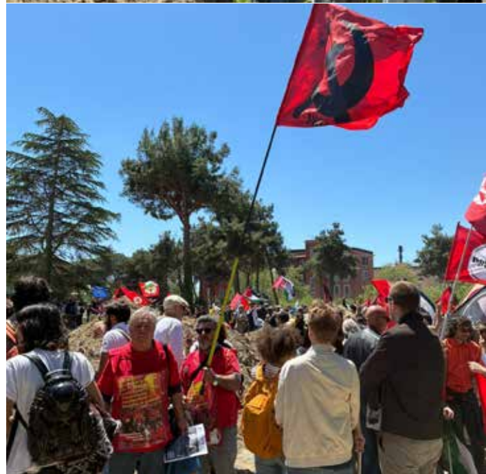
1°Maggio 2026. Due momenti della marcia verso la spiaggia di Coroglio e i cantieri. Si nota la delegazione del PMLI