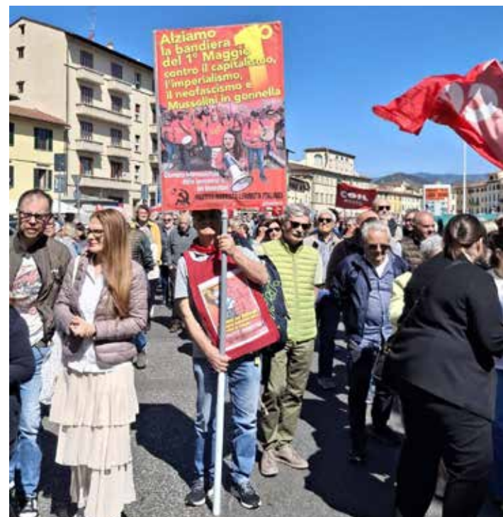
Prato. Il PmlI è sfilato con il manifesto del Partito sul 1°Maggio con l'invito a buttare giù dalla piazza Mussolini in gonnella Meloni.

Nel pomeriggio altre centinaia di lavoratori, immigrati, giovani e studenti sono sfilati da Piazza Del Comune fino ai giardini di Via Carlo Marx nel corteo organizzato dal Sudd-Cobas.