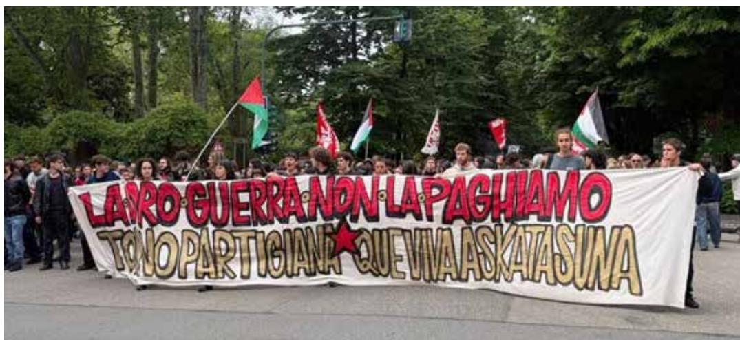
Torino, 1° Maggio 2026. Lo striscione di apertura del corteo di Askatasuna

La Toscana è stata una delle regioni con più iniziative, dalle