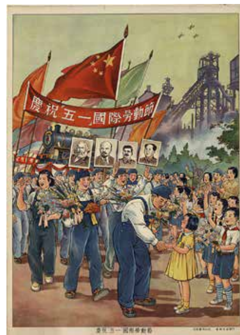
Sopra: "Viva la grande e invincibile bandiera di Marx, Engels, Lenin, Stalin!". 1953