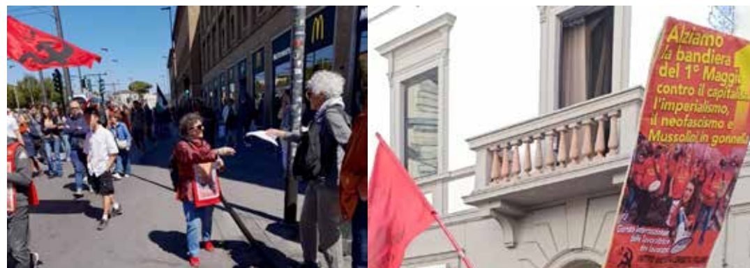
La diffusione del volantino con l'Editoriale di Scuderi e un momento della presenza del Partito

ternazionale delle lavoratrici e dei lavoratori e, mirati ai giovani, quelli con l'importante Appello del Segretario generale e maestro del PMLI, compagno Giovanni Scude-