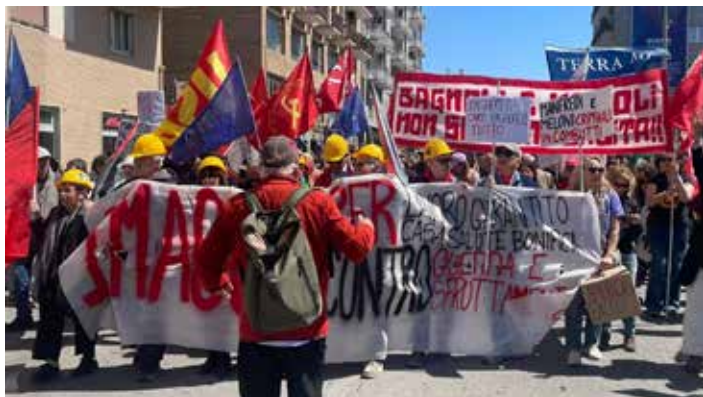
Napoli, 1°Maggio 2026. L'inizio del corteo per la marcia verso l'occupazione dei cantieri dell'ex area di Bagnoli

Una bella giornata di sole unita ad un insolito freddo spirato dal vento grecale ha accolto il Primo Maggio a Napoli che si è svolto nella zona Ovest della città, dopo che nella prima mattinata Cgil, Cisl e Uil davano luogo al consueto e rapido presidio presso piazza Municipio, facendo intervenire addirittura il sindaco di Napoli, il barone Gaetano Manfredi, che ribadivano temi sulla precarietà e l'assenza dei diritti, senza entrare nel vivo, ossia che il governo Meloni è un esecutivo neofascista. Presente anche il governatore regionale Fico assieme alla nuova assessora al lavoro, Saggese, che non rila-