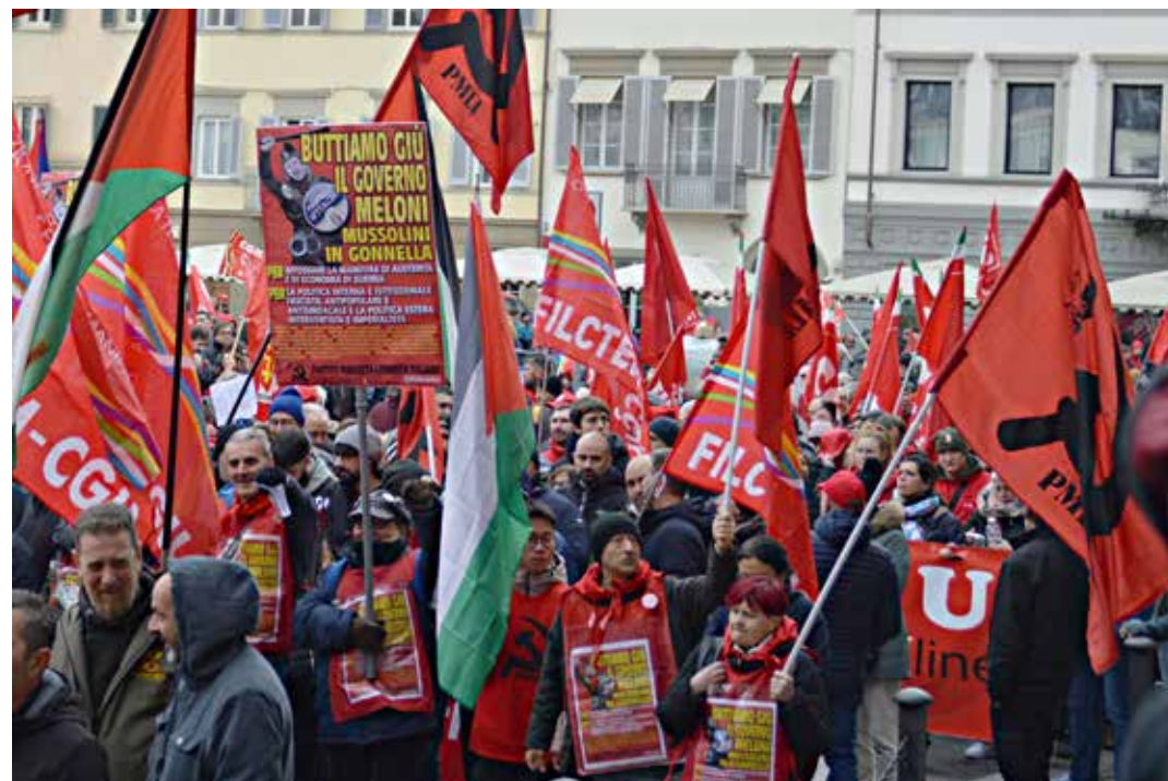
Firenze, 12 dicembre 2025. Manifestazione regionale per lo sciopero generale contro la politica economica e antipopolare del governo Meloni. In evidenza la partecipazione del PMLI

Giusto, ma allora che aspetta Landini ad indire lo sciopero generale per buttarci giù il governo neofascista di Mussolini in gonnella, visto che ha sempre ignorato i suoi appelli, in tutti i provvedimenti presi si è sempre dimostrato dalla parte dei padroni e nemico giurato dei lavoratori, dei giovani, delle donne e del Sud, e questo nuovo Decreto 1° Maggio ne è solo l'ultima vergognosa conferma?