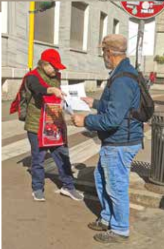
Due momenti della diffusione dell'Editoriale del Partito sul Primo Maggio durante il concentramento

I segretari locali di CGIL, CISL e UIL si sono limitati a denunciare la gravità della situazione generale dandone un quadro veritiero ma senza rilanciare le necessarie iniziative di lotta; escludendo a priori che è la lotta di classe che paga, così come invece è storicamente dimostrato, continuano a parlare genericamente di "diritto al lavoro" e di "sicurezza sul lavoro", senza nessuna esplicita rivendicazione di