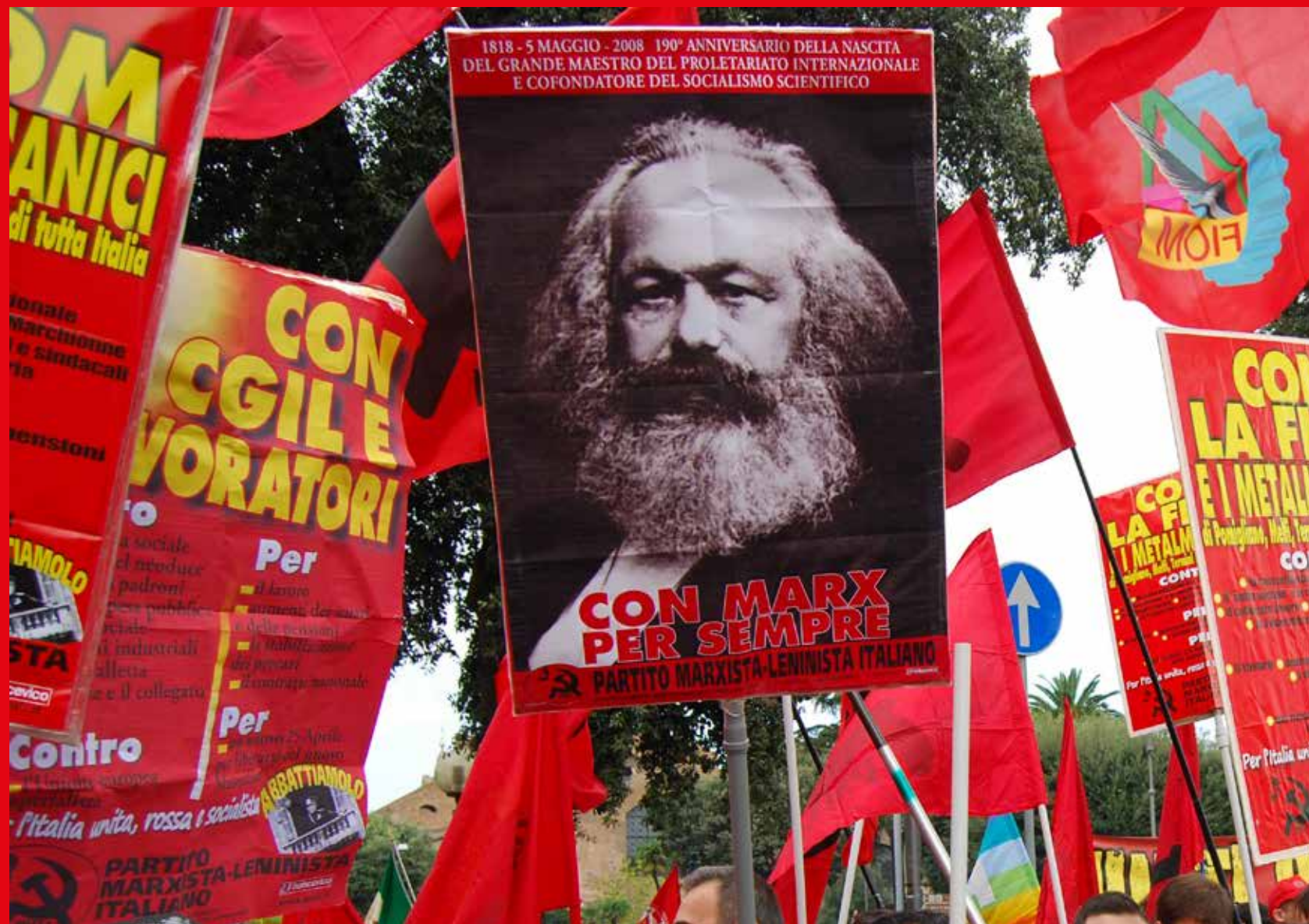
Roma, 16 ottobre 2010. Manifestazione nazionale della FIOM. Il PMLI coglie l'occasione per portare un manifesto per Marx realizzato per il 190° Anniversario della sua nascita. 1818-2008

Karl Marx, Considerazioni di un giovane in occasione della scelta di una professione, 12 agosto 1835. (Sta in Marx - Engels, Opere complete, vol. 1, pagg.5-7, Ed. Riuniti)