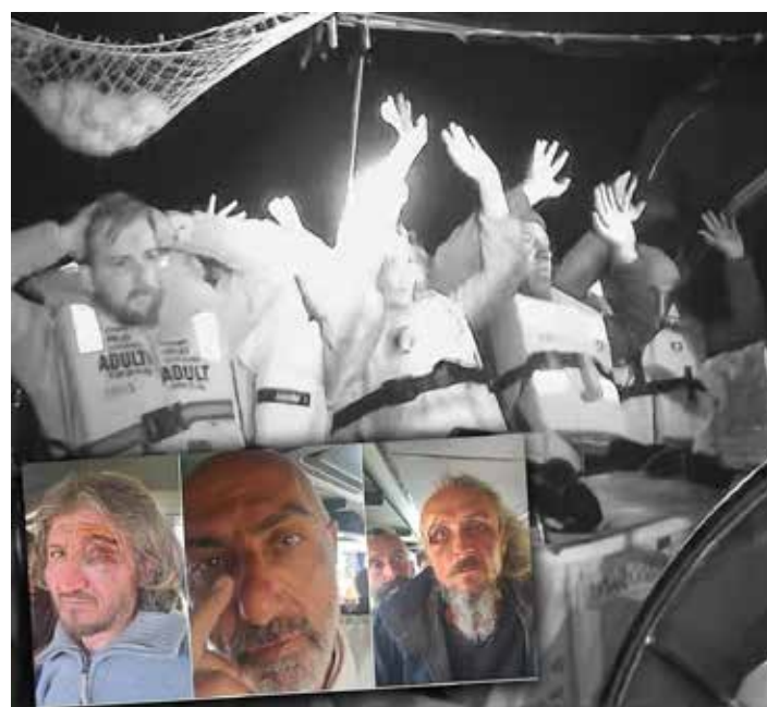
Una immagine tratta dal video dell'assalto piratesco dei nazisionisti alle imbarcazioni della Flotilla. In piccolo, tre attivisti mostrano i segni della violenza dei militari israeliani

Ma Mussolini in gonnella, che anche in questo caso si ripositiona tatticamente in un quadro politico estero che si intreccia con un sentimento popolare nazionale sempre più complicato nell'intenzione di mantenersi utili alla riconferma nel 2027, non perde oc-