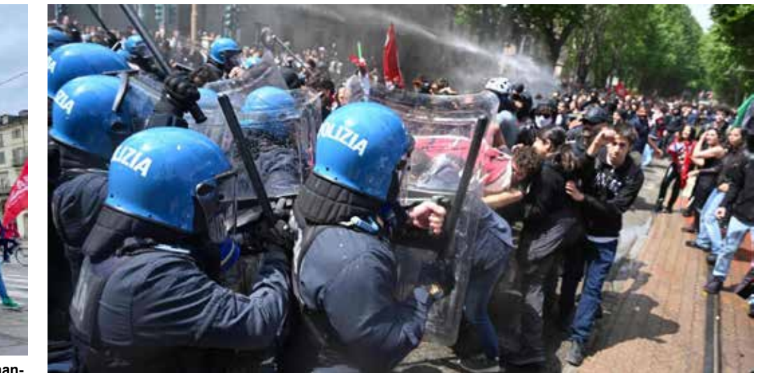
Torino, 1°Maggio 2026. Le violente cariche della polizia contro il corteo di Askatasuna

In Sardegna la manifestazione principale si è svolta Villacidoro , nel sud della regione, organizzata dalla sola Cgil. Anche questa una zona in profonda crisi, a causa della dismis-