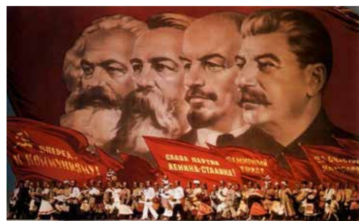
ДА ЗАРАБОТУЕТ БЕЛЫЕ, НЕПОВЕДАННОЕ ЗНАМЯ МАРКСА-ЭНГЕЛЬСА-ЛЕНИНА-СТАЛИНА!