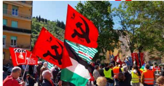
Pontassieve (Firenze). Celebrazione del 1° Maggio 2026.

Recuperare la coscienza del Primo Maggio significa tener presente che questo giorno è sinonimo di emancipazione delle lavoratrici e dei lavoratori ed i primi a celebrarlo furono gli operai e le operaie americane a Chicago nel 1886 quando scesero in piazza in oltre 50 mila per rivendicare la giornata lavorativa di otto ore in un contesto che vedeva i capitalisti imporre, anche ai fanciulli, di lavorare per un misero salario dalle