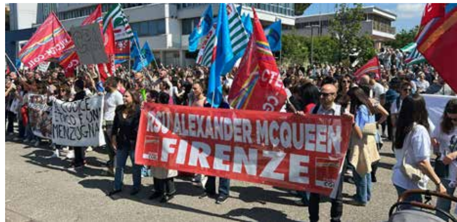
Scandicci (Firenze), 20 maggio 2026. Due momenti della partecipata e combattiva manifestazione davanti al Comune contro i 54 licenziamenti alla "MacQueen" marchio del gruppo Kering