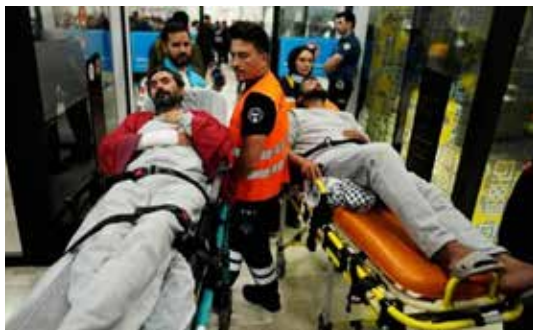
Due attivisti della Flotilla, feriti in modo grave, al loro arrivo in barella ad Istanbul il 21 maggio 2026