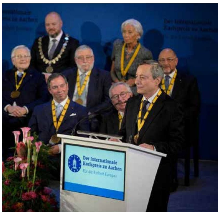
Aachen-Aquisgrana, 14 maggio 2026. Draghi pronuncia il suo discorso dopo il ricevimento del premio Carlo Magno

In sostanza manca un mercato interno che possa sostenere investimenti, crescita e innovazione e dipendiamo troppo dalla domanda esterna, e non basteranno gli accordi commerciali con altri Paesi extraeuropei a salvare la situazione, sottolinea Draghi con una critica implicita allo stesso Merz e all'economia tedesca basata sull'export. D'altra parte neanche gli interventi statali e le politiche protezionistiche possono essere una soluzione, perché “le ritorsioni invitano controritorsioni” e le esportazioni negli Usa sono diminu-