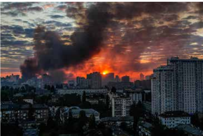
24 maggio 2026. Kiev durante l'attacco dei naziristi con 600 droni e l'impiego del missile ipersonico Oreshnik che ha fatto 4 morti e circa 100 feriti

Il ministro degli Esteri ucraino Andrii Sybiha ha annunciato su X il 24 maggio di aver incaricato i rappresentanti diplomatici ucraini di chiedere la convocazione di riunioni di emergenza del Consiglio di Sicurezza delle Nazioni Unite e di altre istituzioni internazionali in seguito all'ultimo massiccio attacco russo. "Onu, Osce, Consiglio d'Europa e Unesco devono fornire una risposta adeguata e decisa all'aggressore, che sta cercando di compensare la mancanza di progressi militari sul campo di battaglia con il terrore contro i civili", ha affermato Sybiha, aggiungendo che l'Ucraina chiede una riunione urgente del Consiglio di Sicurezza delle Nazioni Unite e una sessione congiunta del Forum per la Cooperazione in materia di Sicurezza e del Consiglio Permanente dell'Osce.