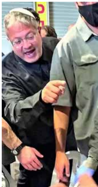
Ben Gvir, ministro sicurezza nazionale di Israele del governo Netanyahu, protetto dai suoi agenti dello Shin Bet (Agenzia per la sicurezza israeliana) provoca e offende gli attivisti della Flotilla inginocchiati nei containers

In estrema sintesi è così che ancora una volta in acque internazionali ad ottanta miglia nautiche dalla costa palestinese, in piena violazione del diritto internazionale e di quello del mare, si è consumato un rapimento collettivo di 426 attivisti, 27 dei quali di nazionalità italiana. Una volta nelle mani dell'esercito sionista, hanno percorso oltre duecento miglia a bordo della famigerata nave-prigione Ins Nahshon già utilizzata durante gli abbordaggi del 29 e 30 aprile scorso e nota ormai come una