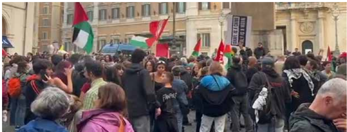
Roma, 20 maggio 2026. L'immediata protesta contro l'assalto alla Flotilla davanti Montecitorio

Comunque sia "La mobilitazione e la pressione di Global Sumud Italia prosegue - fanno sapere i portavoce dell'organizzazione -, e andrà avanti fino a quando non si interromperà la nostra complicità con Israele, fino a quando non saranno interrotti i rapporti militari, commerciali, accademici, fino a quando non saranno liberi tutti i prigionieri politici palestinesi, in Italia e nei territori occupati, fino a quando l'occupazione non avrà fine". Ed allora avanti uniti finché la Palestina non sarà libera "dal fiume al mare".