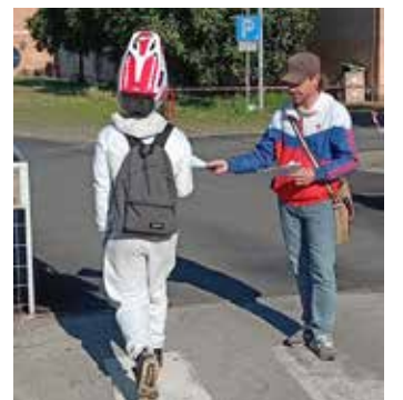
Pontassieve (Firenze), 21 maggio 2026. Diffusione dell'appello ai giovani del Segretario generale Scuderi all'ITC Bladucci

a quella della scorsa settimana alla scuola superiore di Borgo San Lorenzo, dimostra la grande attenzione che le Istanze del PMLI della Valdiesieve e del Mugello hanno nei confronti delle nuove generazioni, le quali hanno da oggi in mano una importante e inedita posizione politica sulla quale possono auspicabilmente riflettere.