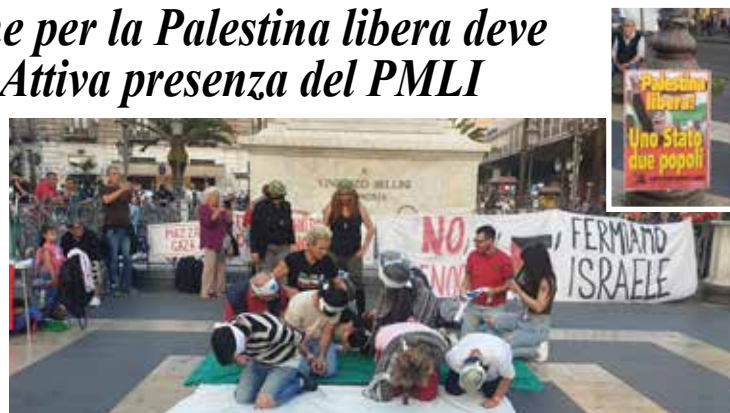
Catania, Piazza Stesicoro (piazza Gaza), 24 maggio 2026. Assemblea di solidarietà con la Flotilla. Manifestanti come gli arrestati con le mani legate e bendati. In alto: il manifesto del PMLI esposto all'assemblea

Indetta dal comitato "Catanese solidali con il popolo palestinese" con la parola d'ordine "Stop alla complicità occidentale. Ieri era la Flotilla. La Palestina è ogni giorno", l'assemblea rappresenta un impegno a continuare la lotta di solidarietà al fianco del popolo palestinese fino alla vittoria. "Riuniamoci in piazza, spezziamo la complicità. Ora che le attiviste/i internazionali della Global Sumud Flotilla e della Freedom Flotilla sono al sicuro, la nostra attenzione non può e non deve scemare! Quello che hanno subito le partecipanti alla missione non violenta dei giorni scorsi è, infatti, solo un assaggio del trattamento riservato ogni giorno alle prigioniere/i palestinesi... Mentre Tajani chiede di sanzionare solo Ben-Gvir e mentre l'Europa propone sanzioni per 'alcuni' coloni violenti, noi sappiamo qual è la verità: queste non sono eccezioni. Questa è la regola. Israele è uno Stato terrorista, fondato su un'ideologia suprematista e violenta, che agisce impunemente nel silenzio generale. È il momento di chiedere al nostro governo e all'Unione Euro-