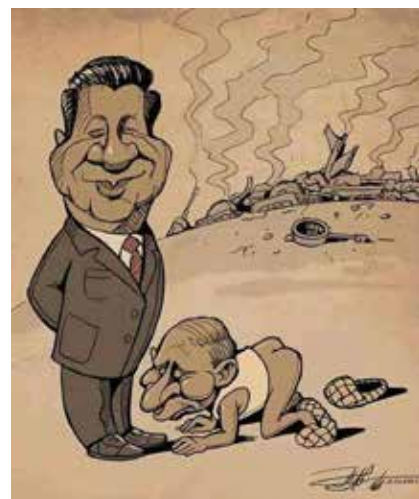
Una vignetta satirica sui reali rapporti tra Xi e Putin

Dopo il 2022, la dipendenza economica russa dalla Cina è cresciuta. Pechino lo sa e sfrutta questa posizione. La partnership sarà anche strategica, ma le condizioni vengono sempre più dettate da Xi Jinping. Dai due vertici, prima con il presidente USA e poi con il leader del Cremlino a uscire nettamente vincitore è Pechino. Come ha osservato anche l'Ipsi - Istituto per gli studi di politica internazionale, la Cina vuole mostrarsi al mondo come superpotenza aperta al dialogo e "si presenta come polo di stabilità in un mondo in preda ad un grande disordine". "Il viaggio è avve-