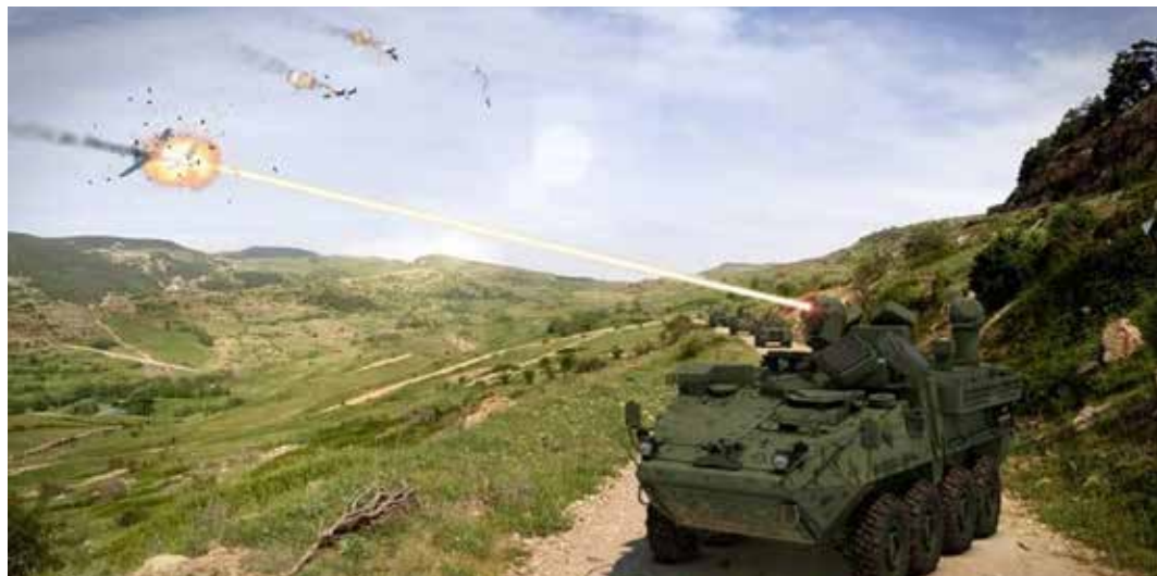
Una ricostruzione fotografica di come potrebbe essere un mezzo militare, che si appoggia sulla tecnologia quantistica, per individuare anche da minime variazioni di calore e colpire in tempo reale e con precisione, ad esempio un attacco di missili e droni. Nell'immagine un mezzo militare americano

approvvigionamento quantistica" che "abiliterà applicazioni di difesa della tecnologia quantistica e applicazioni a duplice uso". Inoltre, l'India ha lanciato la missione quantistica nazionale in forte collaborazione con il settore della difesa pubblica e privata. Iniziative simili stanno emergendo in diversi altri paesi, tra cui ad esempio il Giappone, Corea del Sud, Iran, Turchia, Brasile, e Perù.