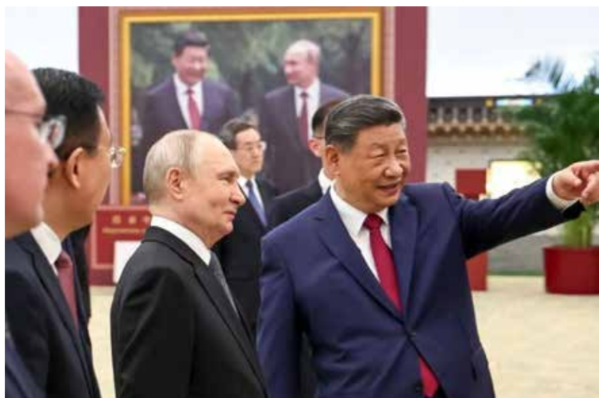
20 maggio 2026. Xi e Putin, dopo l'arrivo di quest'ultimo a Pechino, visitano la mostra fotografica sui 25 anni di rapporti bilaterali

Putin è arrivato in Cina cercando di dimostrare che la Russia resta una potenza globale con alternative all'Occidente. Quello che il viaggio ha nascosto, invece, è quanto profondamente la guerra in Ucraina abbia accelerato la dipendenza di Mosca da Pechino e quanto abilmente Xi Jinping stia gestendo questo squilibrio a vantaggio della Cina.