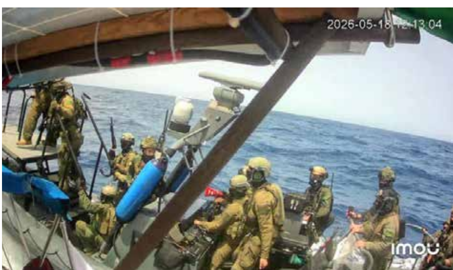
Un momento dell'abbordaggio dell'esercito israeliano ad una nave della Flotilla il 18 maggio 2026 ora locale 12.13

Dopo il trasporto ad Ashdod, infatti, uno degli avvocati dell'ong Adalah che segue legalmente le vicende della Flotilla, ha dichiarato: "Rappresento gli attivisti della flottiglia da oltre un decennio, ed il trattamento riservato loro durante questa spedizione è stato tra i più violenti e duri". Tutti i racconti dei testimoni documentano infatti non solo di pressioni e violenze psicologiche, ma anche di pestaggi, ossa rotte, molestie sessuali, pistole alla testa e coltelli puntati, uso di cani e dei taser, pochissima acqua messa a disposizione, e mani e piedi legati. I segni evidenti sui loro corpi sono una ulteriore quanto chiara conferma della prassi ormai