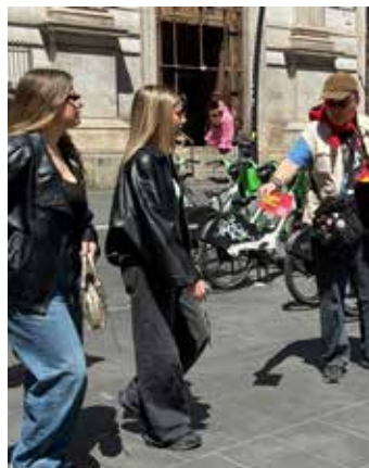
Napoli, 21 maggio 2026. Diffusione per la campagna di proselitismo del PMLI in via Toledo

Terminata la diffusione i compagni provvedevano a raggiungere la sede napoletana della Cgil e ad apporre la loro firma a favore dei referendum nazionali su sanità ed appalti.