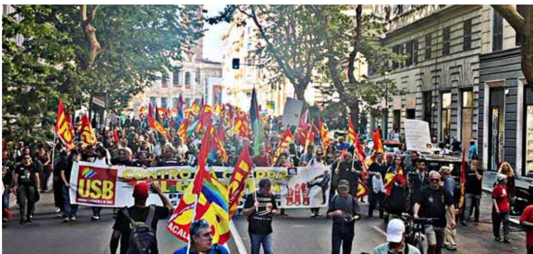
Roma, 23 maggio 2026. Manifestazione per lo sciopero nazionale indetto dal sindacato Usb per la lotta per il salario e carovita

La manifestazione ha rilanciato il “Manifesto Operaio”, approvato dall'Assemblea Nazionale del 28 marzo 2026, organizzata a Roma da Usb, che l'ha presentata come “proposta alternativa al modello economico fondato su precarietà, bassi salari, delocalizzazioni, appalti al massimo ribasso e riarmo”. Tra le rivendicazioni del “Manifesto”, rilanciate alla manifestazione del 23, c'è anzitutto quella dell'adeguamento automatico dei salari ai prezzi, attraverso una sorta di nuova scala mobile che tuteli le retribuzioni, oltre a un reddito garantito universale di transizione, finanziato dallo Stato, per non far pagare ai lavoratori con licenziamenti, cassa integrazione infinita e desertificazione industriale, la transizione eco-