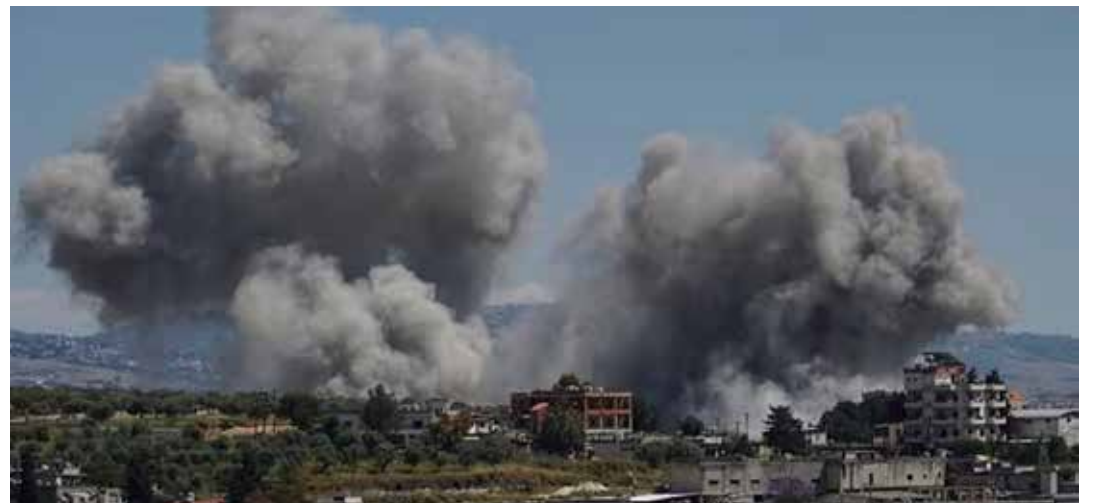
Nabatieh nel sud del Libano, 24 maggio 2026. Edifici bombardati durante un attacco aereo nazionista

Anche in Cisgiordania si registra un'escalation degli attacchi dei coloni, protetti o accompagnati dall'esercito occupante, che non sono più solo furti dei raccolti e del bestiame ma vere e proprie operazioni di saccheggio organizzate che prendono di mira attrezzi agricoli e veicoli degli agricoltori per spingerli a abbandonare le loro terre. Il 25 maggio entravano in azione direttamente i soldati che nella regione settentrionale di Al-Aghouar sequestravano trattori, attrezzature, veicoli e serbatoi d'acqua della popolazione palestinese. La regione che comprende le valli palestinesi e la par-