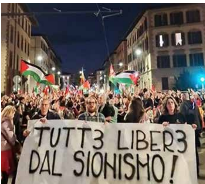
Firenze, 20 maggio 2026. Il corteo serale di protesta organizzato dopo la notizia dell'abbordaggio nazionista alle navi della Flotilla