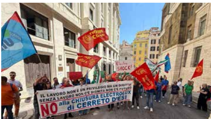
Roma, 25 maggio 2026, durante lo sciopero nazionale del gruppo Electrolux. Alcuni momenti della protesta delle delegazioni di lavoratrici e lavoratori che hanno manifestato davanti al MIMIT per mandare un messaggio molto chiaro verso il Governo e l'azienda affinché siano ritirati immediatamente i licenziamenti