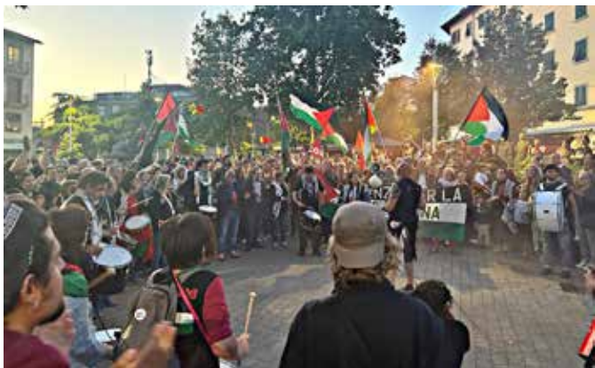
Firenze, 20 maggio 2026. Manifestazione da Piazza Dalmazia a piazza Indipendenza a sostegno della Resistenza palestinese e della Flotilla

I cori che hanno animato tutto il percorso del corteo sono stati nettamente antisionisti e dalla piazza è salita nuovamente la forte richiesta di una Palestina libera dal fiume al mare.