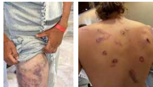
Due attivisti, appena liberati, mostrano i segni delle botte e dell'uso del taser da parte dei nazionisti che li hanno interrogati e torturati

Ad oggi pertanto il cane neofascista abbaia poco e non morde assolutamente il suo alleato sionista, tant'è che Roma non ha dato neanche il via libera alla rogatoria chiesta dai magistrati che vorrebbero conoscere i nomi dei militari israeliani che hanno illegalmente sequestrato