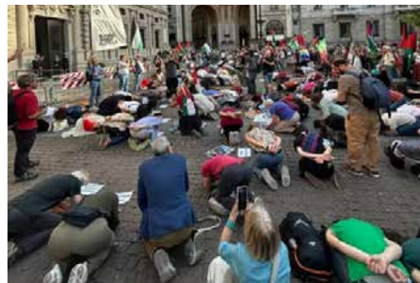
Milano, 22 maggio 2026. La protesta davanti a Palazzo Marino, sede del comune. I manifestanti si sono inginocchiati come gli attivisti prigionieri dei sionisti